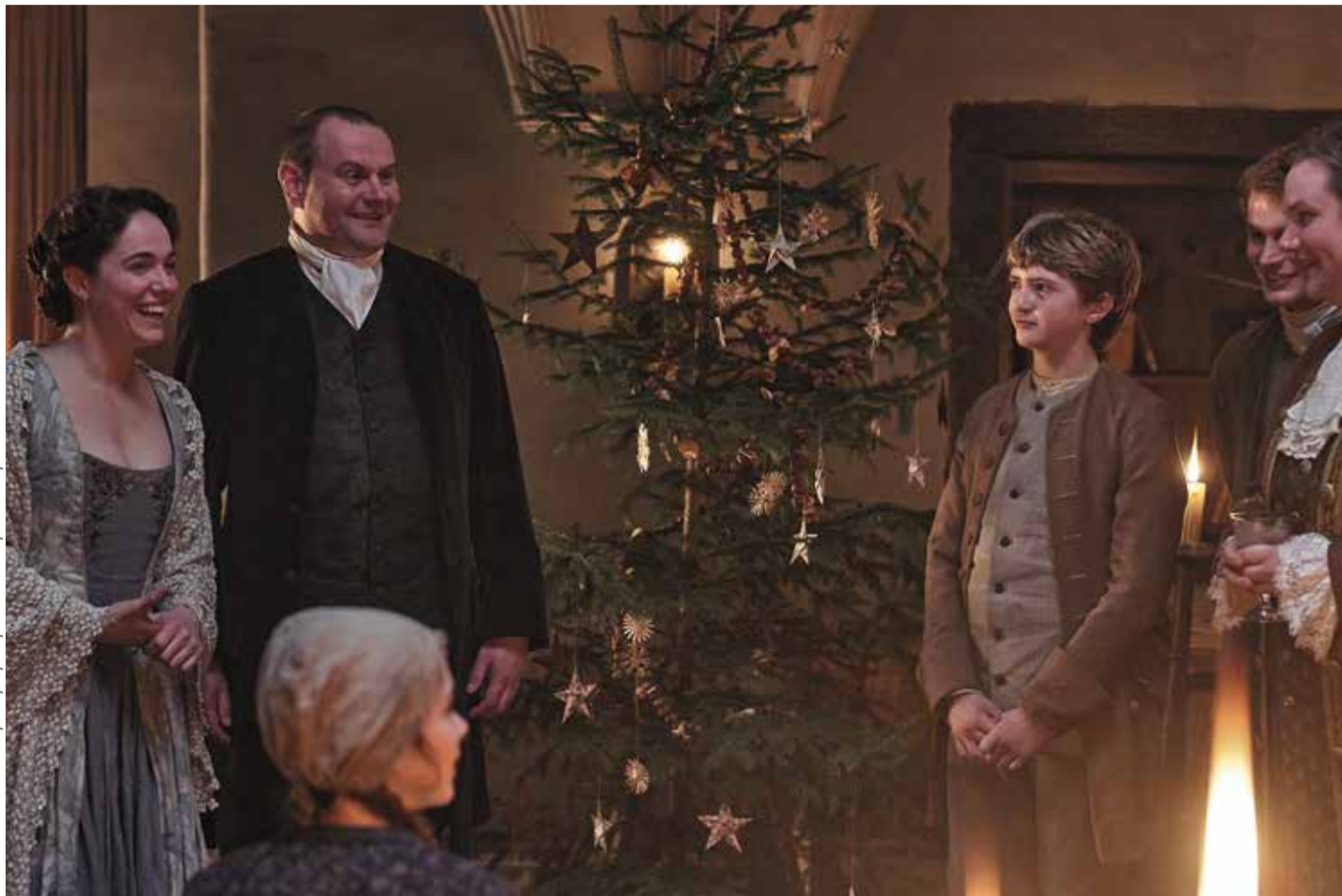
Familie Bach feiert Weihnachten: J. S. Bach (Devd Striesow) mit seiner zweiten Ehefrau (Verena Altenberger) und den Kindern