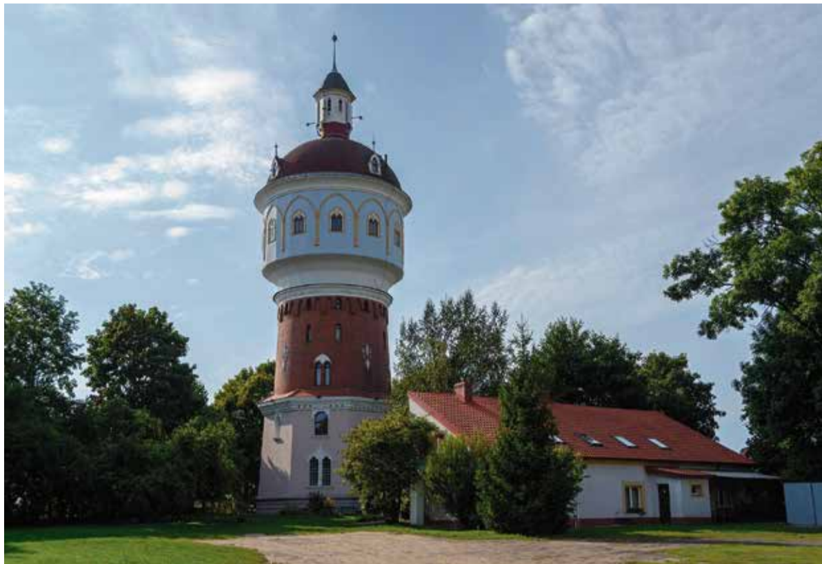
Sehenswert in Lyck Der alte Wasserturm wartet mit einem Museum der Stadtgeschichte auf. In dem Gemeindeforum hat die örtliche Gruppe der Deutschen Minderheit ihren Sitz

Das Oderhaff verbindet Stettin mit den Weltmeeren. Auf dem Landweg sind es nur 100 Kilometer bis Berlin. Die vitale Großstadt an der Westgrenze der Republik