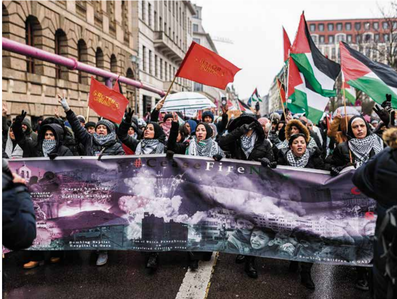
Sinnbild für eine historische Zeitenwende: Muslimische Demonstrationen auf europäischen Straßen wie hier in Berlin

Zentral in der Dekadenz-Debatte ist nach wie vor Oswald Spengler mit seinem Werk „Der Untergang des Abendlandes. Umriss einer Morphologie der Weltgeschichte“. Spenglers Grundannahme lautet: Die Weltgeschichte verläuft in einem Zyklus von Aufstieg und Niedergang. Dabei ist Spengler sehr be-