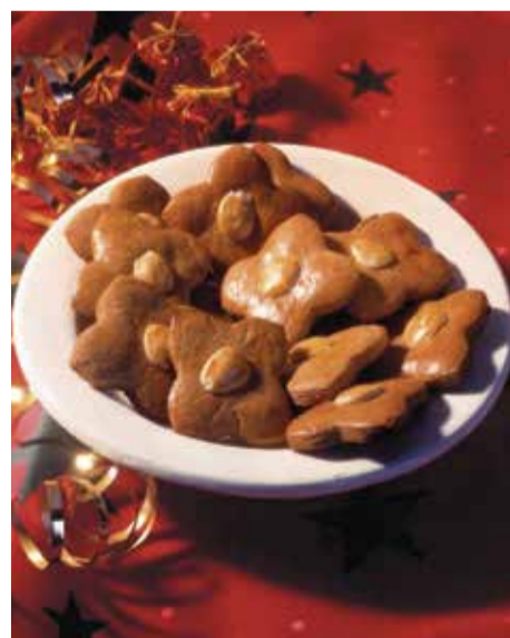
Die Thorner Kathrinen sind wegen ihrer Würze die bekanntesten Lebkuchen

Im 19. Jahrhundert begann sich die Industrie zu entwickeln, und es wurden Süßwarenfabriken gegründet, die sich nicht nur auf die Herstellung von Lebkuchen, sondern dann auch auf die Produk-