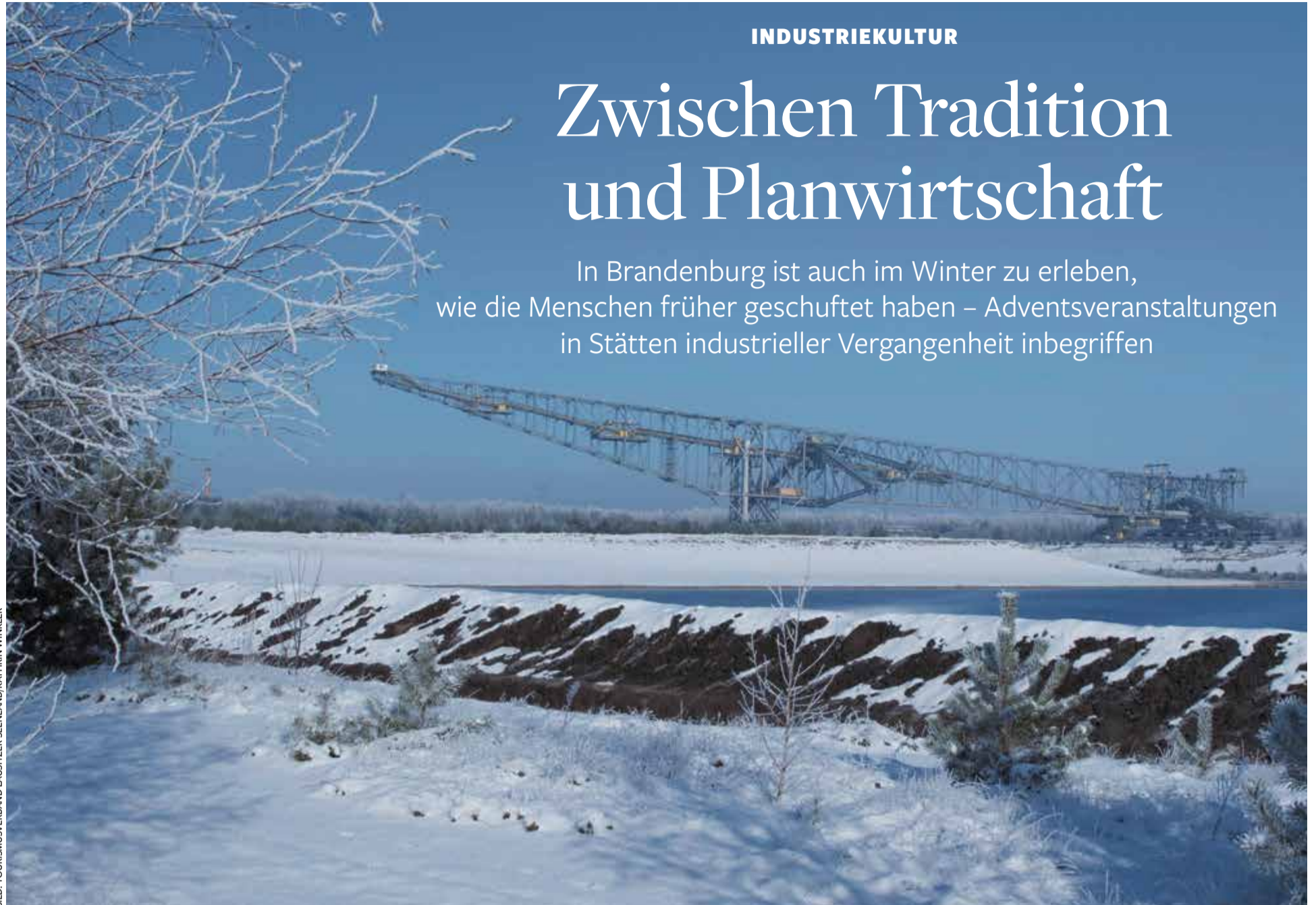
Industrie-Relikt aus DDR-Zeiten: Die Abraumförderbrücke F60 bei Finsterwalde war die größte bewegliche Arbeitsmaschine der Welt, aber nur knapp anderthalb Jahre in Betrieb

In Niederfinow sind die imposanten Stahlkonstruktionen der dortigen Schiffshebewerke unübersehbar. Alt und Neu arbeiten hier Seite an Seite: das mit Baujahr 1934 älteste noch in Betrieb befindliche Hebewerk sowie das 2022 eingeweihte modernste Hebewerk Deutschlands.