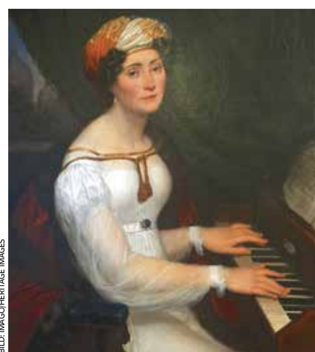
Talentierte Frau: Maria Szymanowska

Als Komponistin erlangte Szymanowska die Anerkennung von Robert Schumann. 1836 äußerte er sich mit Lob über ihre Etüden in den Gesammelten Schriften über Musik und Musiker. Szymanow-