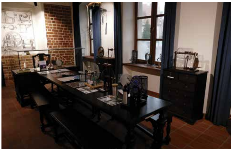
Im neues Museumsgebäude „Dekanatshaus“, dem damaligen Wohnhaus von Kleists in Cammin [Kamieñ Pomorski]: Der Versuchsraum