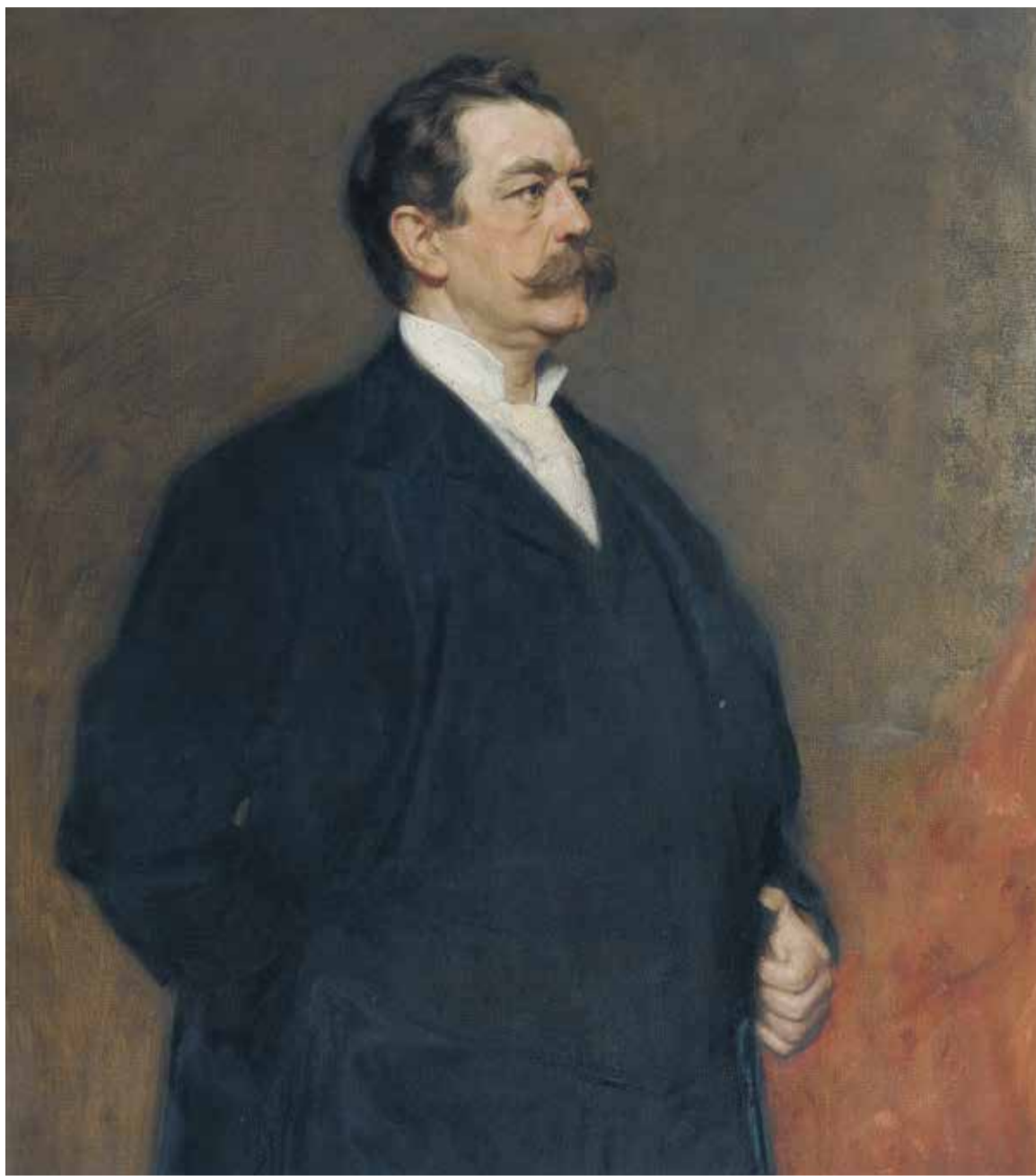
Fürst Herbert von Bismarck: Ölgemälde von Max Koner aus dem Jahre 1898 (Ausschnitt)

Doch dann kam das Jahr 1890. Der neue, junge Kaiser, Wilhelm II., erwartete vom alten Bismarck den Rücktritt. Vom jungen Bismarck erwartete er diesen hingegen