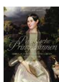
Rudolf G. Scharmann: „Preußische Prinzessinnen. Leben in Schlössern und Gärten der Romantik“, BeBra Verlag, Berlin 2024, gebunden, 240 Seiten, 28 Euro

Das auf Kunstdruckpapier gedruckte Buch ist zu einem Drittel bebildert. Es sind wahre Schätze, die der Autor aus seinem Charlottenburger Schloss und anderen Residenzen größtenteils in Berlin und Potsdam zusammengetragen hat: schönste Porzellane, Marmorbüsten, Gemälde, Schmuck, Tapeten und Vorhänge, gefertigt von den besten preußischen Künstlern. Vieles kann auch heute noch besichtigt werden. Sozialgeschichte bleibt weitgehend ausgespart, das Buch zeigt Preußen von einer ungewohnt freundlichen Seite. Für Preußenverehrer ein ideales Weihnachtsgeschenk.