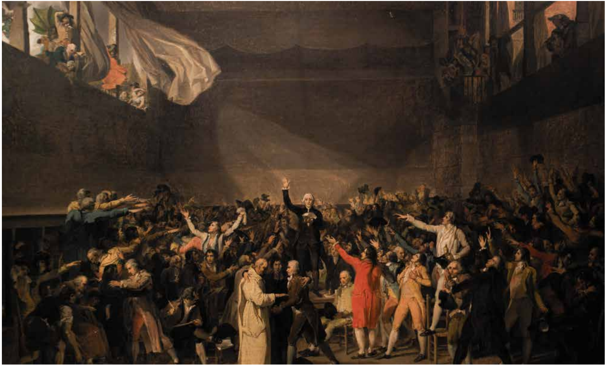
Der historische „Ballhaus-Schwur“: Die erste Zusammenkunft der französischen Nationalversammlung am 20. Juni 1789

Die rechte Hand ist kultur- und zivilisationsübergreifend die gute, die linke die schlechte Hand, wie der Anthropologe