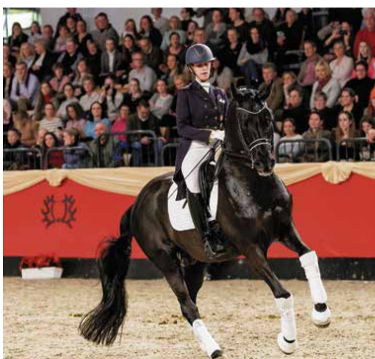
Strahlender Sieger: Schwarzgold

Der imposante Rappe ist nicht nur 30. Trakehner Hengst des Jahres, sondern auch der fünfte Titelträger für das Gestüt Hörem. Züchterisch präsentiert Schwarzgold eine eindrucksvolle bisherige Bilanz: 18 gekörte Söhne sind eine stolze Zahl, und unter den zehn gekörnten Trakehner Söhnen sind neben Siegerhengst Perpignan Noir, der Reservesieger Instagram, Luxus, der Siegerhengst der dänischen Trakehner Körung, der S*-Dressursieger Speedway und der Trakehner Dressurperdechampion Halifax. Schwarzgold ist Vater von über 100 eingetragenen Stuten. Auf den zentralen Eintragungen und Stutenleistungsprüfungen stellte er diverse Sieger- und Reservesiegerstuten. Auch 60 Trakehner Auktionspferde und -fohlen sprechen für die Qualität des diesjährigen Titelträgers.