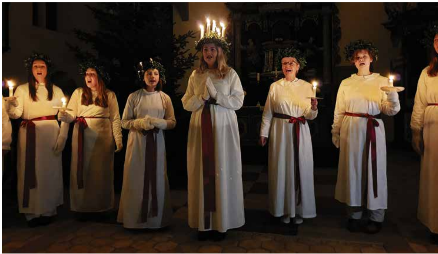
Am 7. Dezember in der Fischerkirche in Prerow: Der Chor aus Malmö gestaltet das stimmungsvolle Luciafest

Julkapp, oder das „Julkappschmieten“, wie es der Dichter Ernst Moritz Arndt (1769–1860) bezeichnete, hielt also Kurzweil und Überraschungen zu Weih-