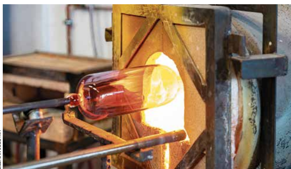
Traditionsreiche Glasherstellung: Ein Schmelzofen in der Baruther Glashütte

Im Museum und Glasstudio können die Gäste am original erhaltenen Schmelzofen erleben, wie Sand, Kalk und Pottasche bei über 1300 Grad Celsius zu Kunstwerken verschmelzen. Besucher dürfen zuschauen, Fragen stellen und sogar selbst aktiv werden. Im Winter sind Museum und Glasstudio von Mittwoch bis Sonntag geöffnet. An den Öffnungstagen können Gäste von 11 bis 12 Uhr und von 14 bis 15 Uhr für zehn Euro pro Stück eigene Bewässerungskugeln blasen. Im Anschluss findet eine etwa 20-minütige Vorführung der Glasmacher statt. Eine Voranmeldung ist nicht erforderlich. ( www.baruther-glashuette.de )