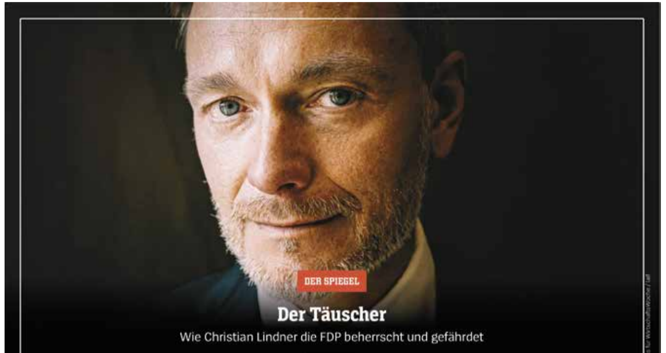
Buhmann der Leitmedien: Der ehemalige Finanzminister Christian Lindner, hier in einer aktuellen „Spiegel“-Geschichte

Landsmannschaft Ostpreußen: www.ostpreussen.de Bürogeschäftsstelle: info@ostpreussen.de