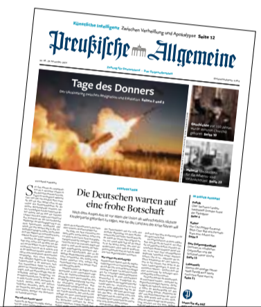
Ausgabe Nr. 48

Leserbriefe an: PAZ-Leserforum, Buchstraße 4, 22087 Hamburg, Fax (040) 41400850 oder per E-Mail an redaktion@preussische-allgemeine.de