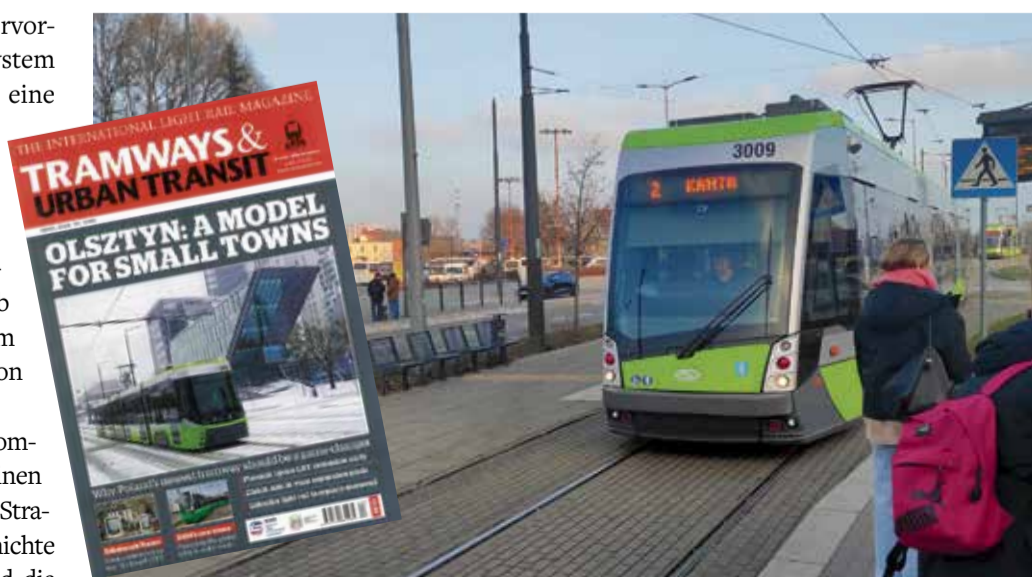
Auf dem Titelblatt einer britischen Zeitung: Allensteiner Straßenbahn