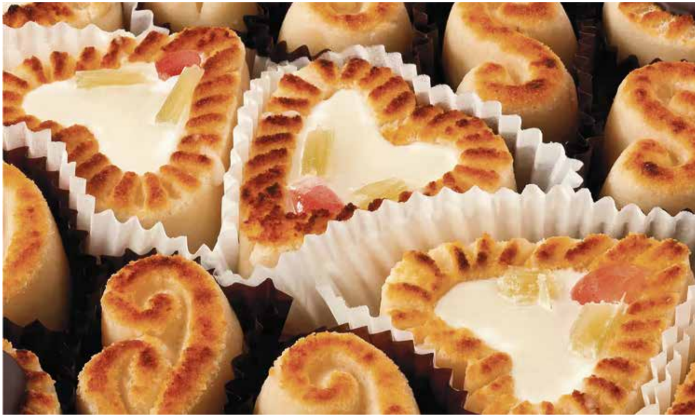
Erst nach dem Flämmen oder Rösten erhält das Marzipan seine auf der Oberseite typische gebräunte Farbe. Hier hat sich der Zucker im Marzipan karamellisiert und verleiht dem Konfekt die leckere Kruste

Stimmt, wenn da nicht doch eine Einschränkung wäre. Denn mindestens genauso gut schmeckt das Königsberger Marzipan. Und weil das so ist, wurde es auch immer in einem Atemzug mit dem Lübecker Pendant genannt. Bis zu dem Zeitpunkt, als britische Bomberverbände die wunderschöne Hauptstadt Ostpreußens Ende August 1944 fast von der Landkarte tilgten und die urbane Schönheit regelrecht in Schutt und Asche versank. Königsberg lag in Ruinen, wurde dann von Russen annektiert, geplündert und weitestgehend über die Jahre hinweg herzlos mit typisch kommunistischen Plattenbauten wieder hochgezogen. Der Charme, die Schönheit, die architektonische Opulenz früherer Jahre waren hinfort, doch geblieben ist immer noch der Ruf von damals – und das gilt auch für das leckere Königsberger Marzipan.