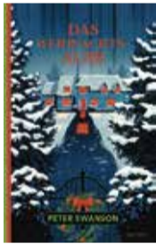
Peter Swanson: „Das Weihnachtsalibi“, Oktopus Verlag, Zürich 2024, gebunden, 125 Seiten, 18 Euro