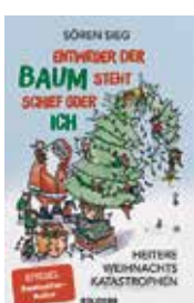
Sören Sieg: „Entweder der Baum steht schief oder ich. Heitere Weihnachtskatastrophen“, Goldegg Verlag, Berlin 2024, gebunden, 256 Seiten, 15 Euro