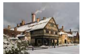
Schloss Cecilienhof

Schloss Cecilienhof ist seit dem 1. November geschlossen, deshalb präsentiert die Stiftung Preussische Schlösser und Gärten Berlin-Brandenburg (SPSG) in Kooperation mit Google Arts & Culture virtuelle Rundgänge und Online-Ausstellungen: https://artsandculture.google.com/partner/schloss-cecilienhof