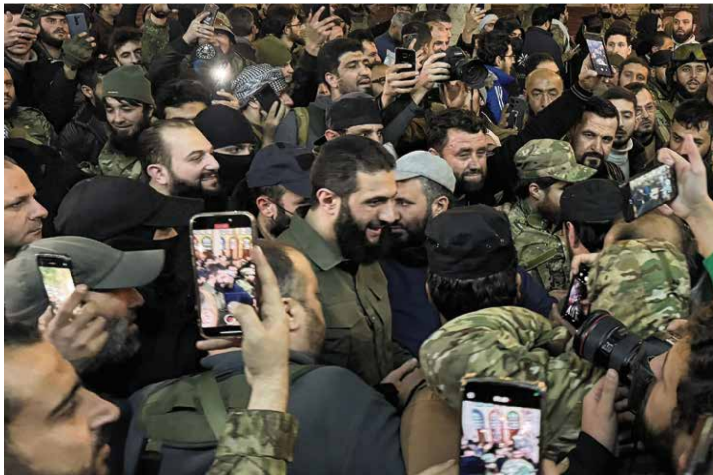
Der Kommandeur der IS-Rebellen Ahmed Hussein al-Schar'a alias Abu Muhammad al-Dschaulani verkündet der jubelnden Menge, dass Präsident Bashar al-Assad endgültig aus dem Palast gejagt wurde.

Zum anderen droht eine neue Flüchtlingswelle. In Syrien leben viele Christen, Alawiten, Drusen, Jesiden und Schiiten, die ins Visier der sunnitisch-dschihadistischen HTS geraten könnten. Besonders stark dürfte die Lage eskalieren, wenn die Terrormiliz die volle Kontrolle über das Land erlangt, so wie die Taliban in Afghanistan. Derzeit befinden sich über fünf Millionen Syrer im Ausland, über eine Million in der Bundesrepublik. Diese Zahlen könnten demnächst deutlich steigen.