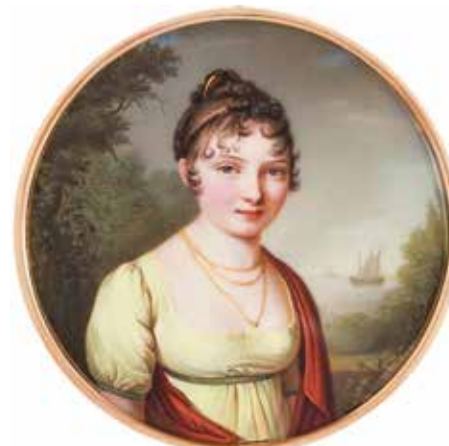
Juliane von Krüdener

Heilbronn den wohl mächtigsten Mann dieser Zeit, den russischen Zaren Alexander I. Der idealistische, aber auch labile und wankelmütige Befreier Europas von Napoleon war damals insbesondere im liberalen Lager ein Hoffnungsträger. Bestärkt von Juliane von Krüdener fühlte er sich berufen, auf eine auf christlichen