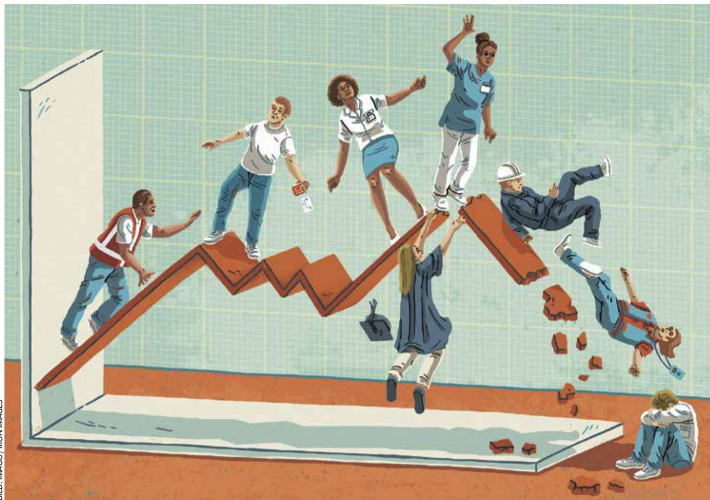
Unsichere Zeiten: Immer mehr Menschen aus der Mittelschicht haben Angst vor dem sozialen Abstieg oder gar Einbruch

Eine Verbraucherumfrage der Schufa aus dem Oktober macht deutlich, in welcher dramatischen Situation sich die Mittelschicht mittlerweile befindet. Pandemie-Lockdowns samt Einkommenseinbußen für Freiberufler und Selbstständige, hohe Inflation, jahrelange Nullzinspolitik auf Ersparnisse, steigende Mieten, die massive Verteuerung von Energie und nun auch aufkeimende Unsicherheit über den Arbeitsplatz haben offenbar selbst in der ge-