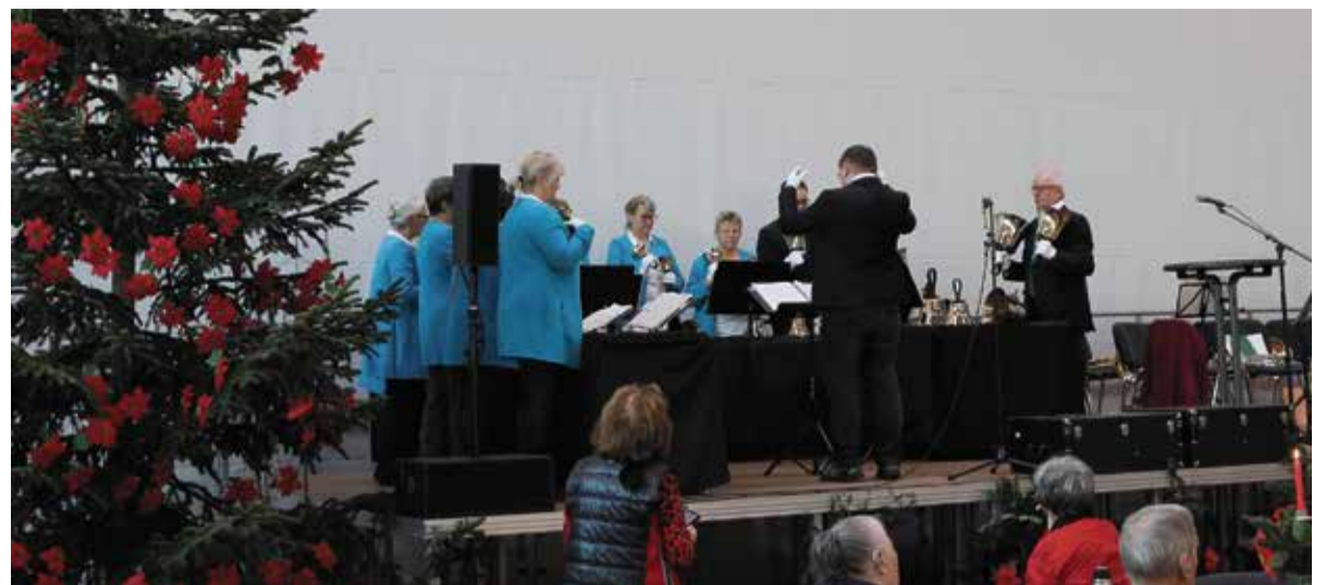
Sorgte mit seinem Spiel für eine wunderbare Stimmung: Der Handglocken-Chor aus Dabel

Kassel – Sonntag, 15. Dezember, 15 Uhr, Landhaus Meister, Fuldastraße 140, Kassel-Wolfsanger: Advents- und Vorweihnachts-