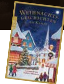
Barbara Mürrmann (Hg.): „Weihnachtsgeschichten am Kamin 39“, rororo Verlag, Hamburg 2024, Taschenbuch, 14 Euro