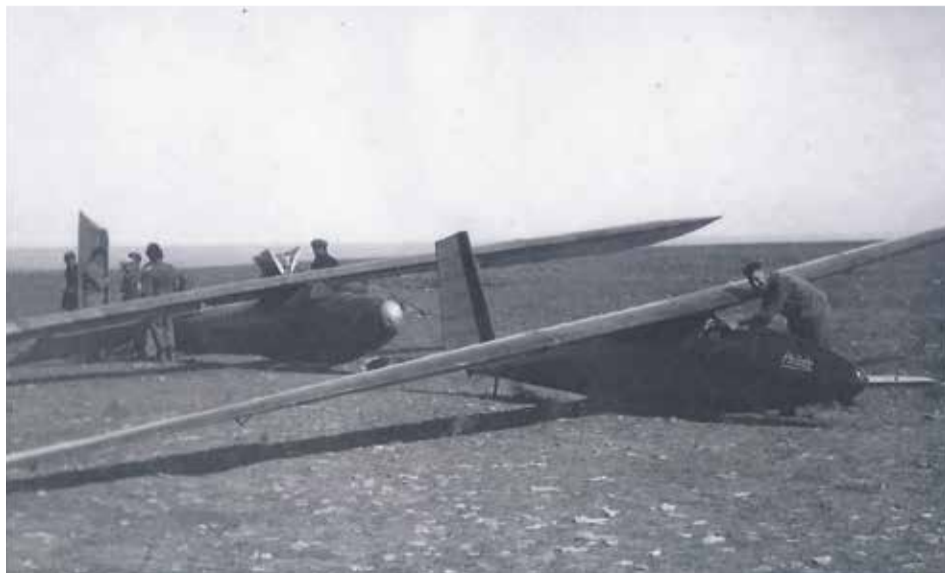
Kamen beim Samland-Küstenflug zum Einsatz: das Segelflugzeug „Hannover H6“ und dahinter der Doppelsitzer „Liegmitz DI, Baujahr 1924

Ebenfalls vom Ostpreussischen Verein für Luftfahrt Königsberg durchgeführt, fand am 18. Mai 1924 auf dem Flugplatz Devau ein Kleinflugzeug-Wettbewerb unter der Bezeichnung „Samland-Küstenflug“ statt. Die „Kölnische Zeitung“ vom 5. Mai 1924 vermerkte, dass „die Höchstzahl der zuzulassenden Reichsdeutschen, deren Fluggeräte mit Motoren in Deutschland hergestellt sein müssen“, zwölf betrage. „Wenn keine acht Bewerber melden, kann der Veranstalter die Konkurrenz ausfallen lassen. Die gemeldeten Flugzeuge und ihre Piloten müssen vom Reichsluft-