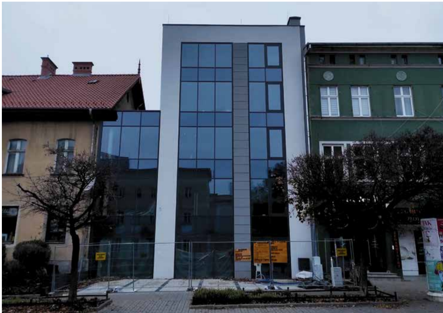
Passt nicht in das Bild der historischen Altstadt: Das umstrittene Gebäude in der Kaiserstraße

Einige Bewohner der Stadt vertreten die Auffassung, dass ein modernes Gebäude, das von geschichtsträchtigen Stadthäusern umgeben ist, den Charakter des Stadtzentrums beeinträchtigt. Viele Befürworter des Erhalts der historischen Substanz in der Stadtmitte bezeichnen den Neubau als Katastrophe und einen Verstoß gegen die Grundsätze des guten architektonischen Geschmacks. Befürworter einer Kombination verschiedener