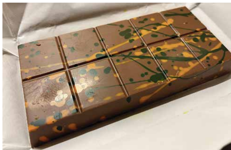
Eine Süßigkeit, auf die viele schwören: Eine Tafel Dubai-Schokolade

Aber Luxus hat eben seinen Preis, selbst wenn die Herstellungskosten gering sind. Und Dubai steht nun einmal für Luxus. Doch selbst in dem Emirat am Persischen Golf ist es nicht einfach, an die begehrte Schokolade zu kommen. Nur zweimal am Tag gibt es kleine Zeitfenster im Online-Verkauf, und die Ware ist immer schnell weg. Detlef Berg/Harald Tews