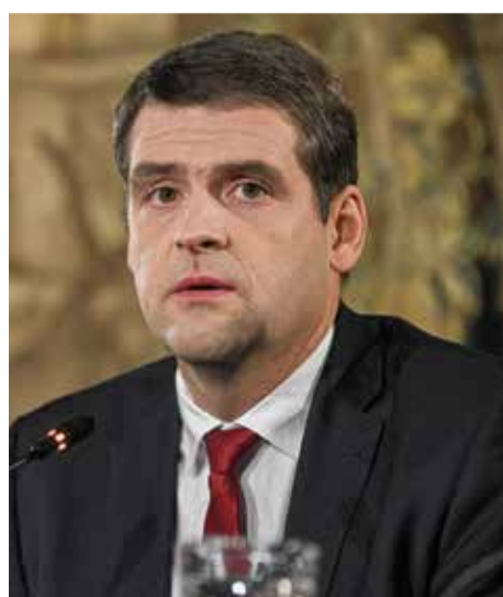
Umstritten: Remigijus Žemaitaitis

recht. Er war als Berater des Wilnaer Bürgermeisters Juozas Imbrasas tätig, arbeitete als Berater der litauischen Mitglieder der EU-Parlaments Rolandas Paksas und Juozas Imbrasas. Von 2009 bis 2024 war er selbst Mitglied des litauischen Par-