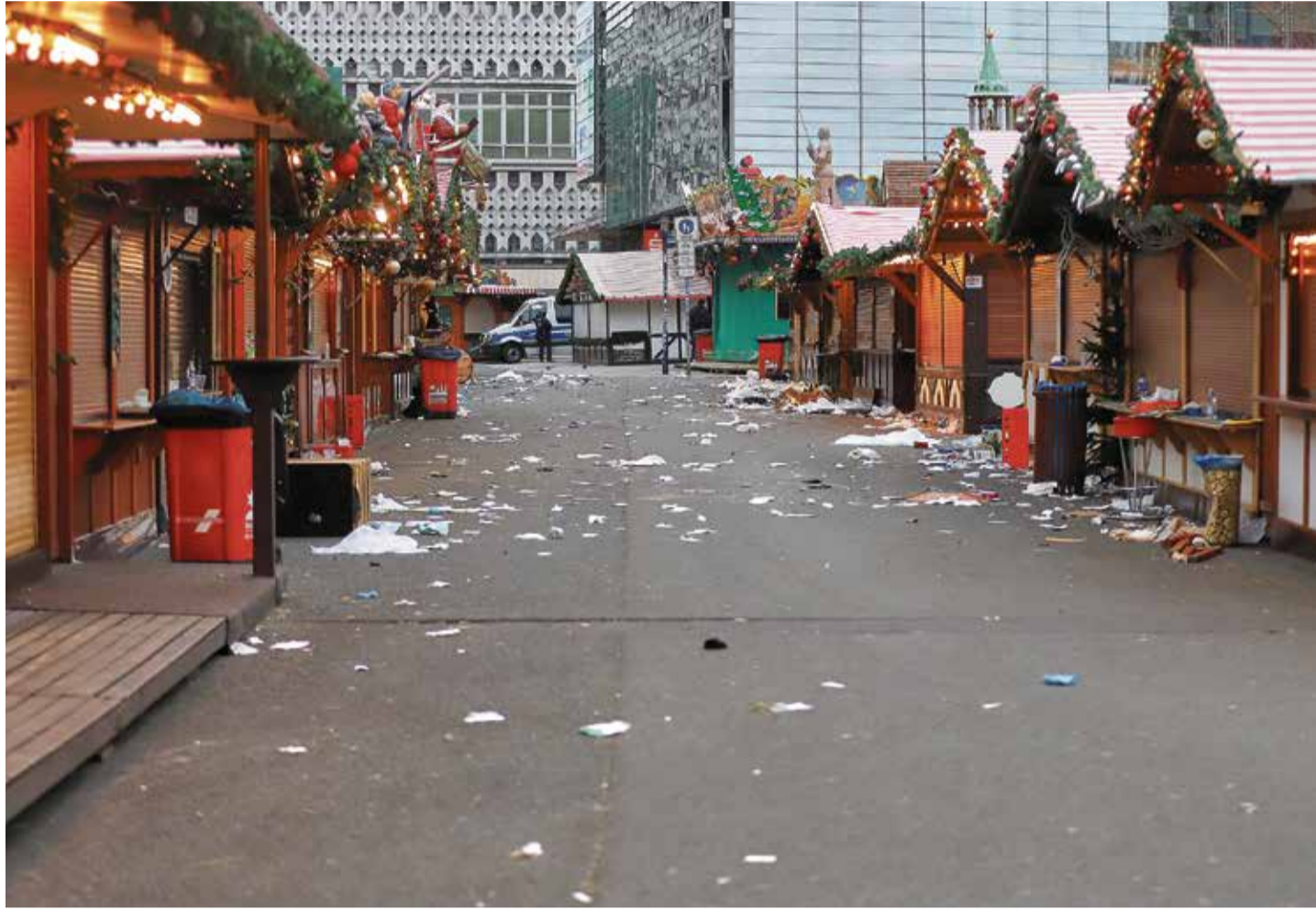
Der Ort des Schreckens: Magdeburgs menschenleerer Weihnachtsmarkt am Tag nach der Tat

Faktisch steht in Deutschland damit seit der Gründung des GTAZ im Jahr 2004