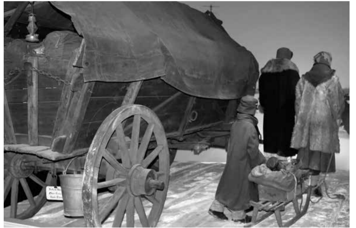
Einbrüche, Fliegerangriffe und die Hoffnung auf Sicherheit: Die Flucht über das Haff war für viele der einzig mögliche Fluchtweg

Die Teilnehmerzahl ist begrenzt und eine Anmeldung unter Telefon (04131) 759950 oder per E-Mail: info@ol-ig.de erforderlich. Die Veranstaltung wird ausgezeichnet und online übertragen werden.