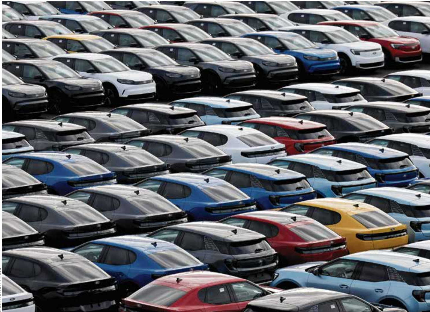
Zu teuer, unbeliebt und optisch unattraktiv: E-Autos aus deutschen Werkhallen sind Ladenhüter wie hier bei Ford in Köln

Die Probleme bei Volkswagen sind derzeit in aller Munde. Ohne Arbeitsplatzabbau wird es nicht gehen. Doch die ganz Großen in der Branche sind nach Expertenmeinung immer noch stark genug, um ein weiteres schlechtes Jahr aufzufangen. „Viel schlimmer sind die kleinen und mittleren Zulieferer dran, und das umso stärker, je mehr sie in ihrem Geschäftsmodell von Elektroautos abhängen“, sagt Becker. Man geht von Auftragsrückgang und Umsatzeinbrüchen von 40 Prozent aus. Die Deindustrialisierung des Auto-standorts Deutschland werde 2025 ohne politische Notbremung ungebremst fortschreiten. Beckers bitteres Fazit: „Das merkt halt keiner, außer die Betroffenen selbst.“ Hohe Standortkosten, eine viel zu starke Konkurrenz bei den E-Autos und vor allem die Absatzschwäche im chinesischen Markt sind die größten Probleme.