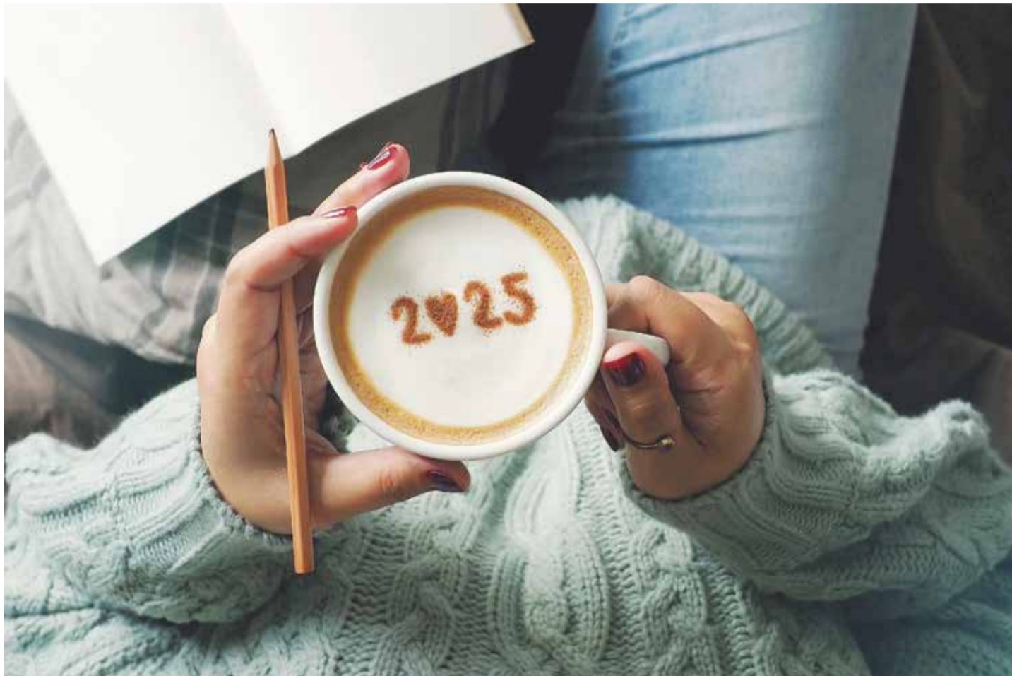
Ein guter Schluck auf das neue Jahr: Mit einem Kaffeegetränk fängt die Arbeit gleich viel besser an

Laut aktuellen Studien ist Kaffee grundsätzlich gesund. Er soll die Aufmerksamkeit verbessern, kann das Risiko von Brust- und Prostatakrebs senken, vor Diabetes sowie Alzheimer und Demenz