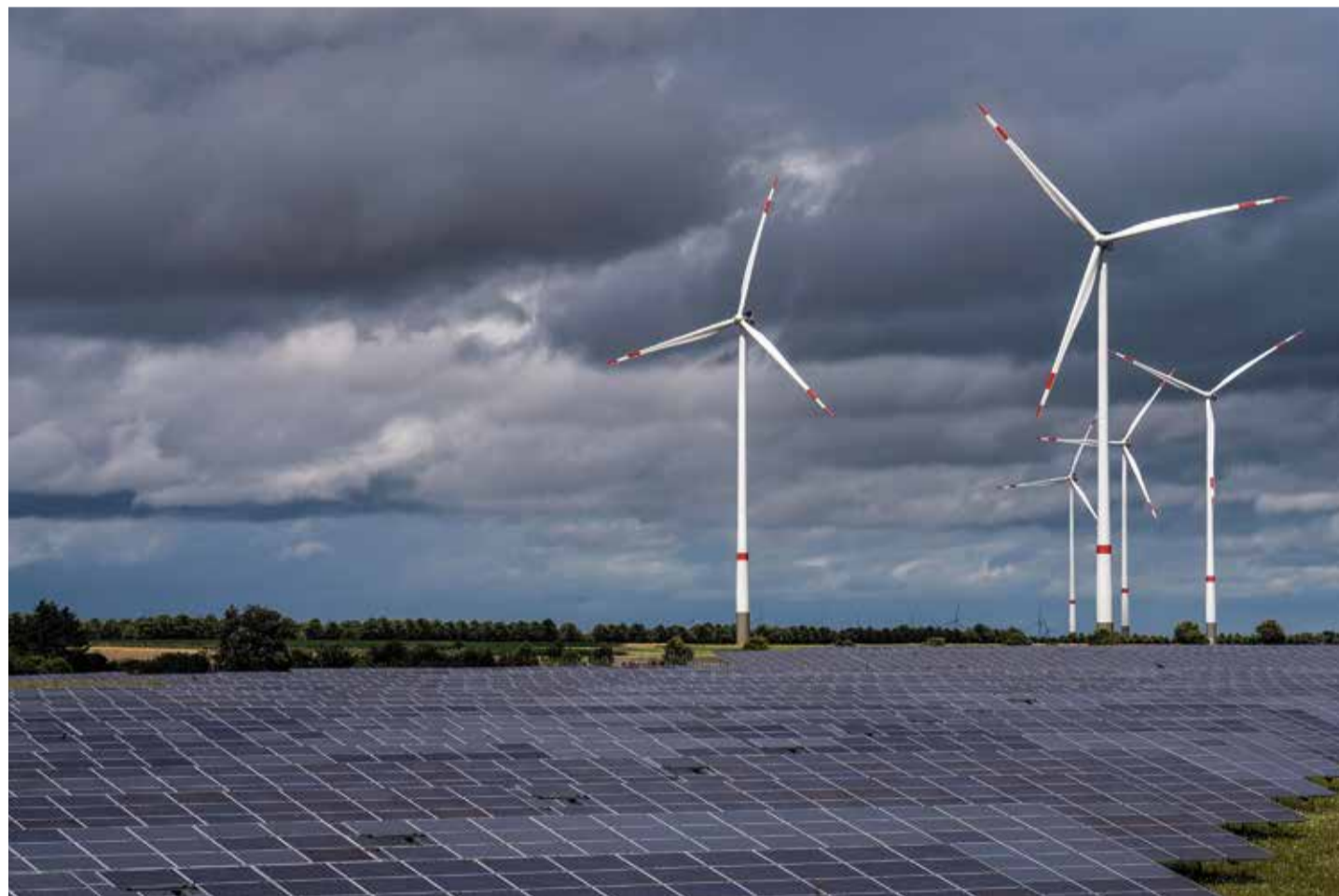
Es herrscht totale Dunkelflaute: Keine Sonne scheint und es weht noch nicht einmal ein laues Lüftchen. Somit lässt sich weder aus Wind noch durch das Sonnenlicht Energie gewinnen

Und tatsächlich will die in Oslo regierende Koalition aus Sozialdemokraten und Zentrumsparter nun mit genau diesem Vorschlag im aktuellen Parlamentswahlkampf punkten: Statt der für 2026 geplanten Erneuerung der Trasse solle deren Außerbetriebnahme erfolgen, damit der in Norwegen billig produzierte Strom zukünftig auch im Lande bleibe. Den bundesdeutschen Stromverbrauchern stehen also harte Zeiten bevor.