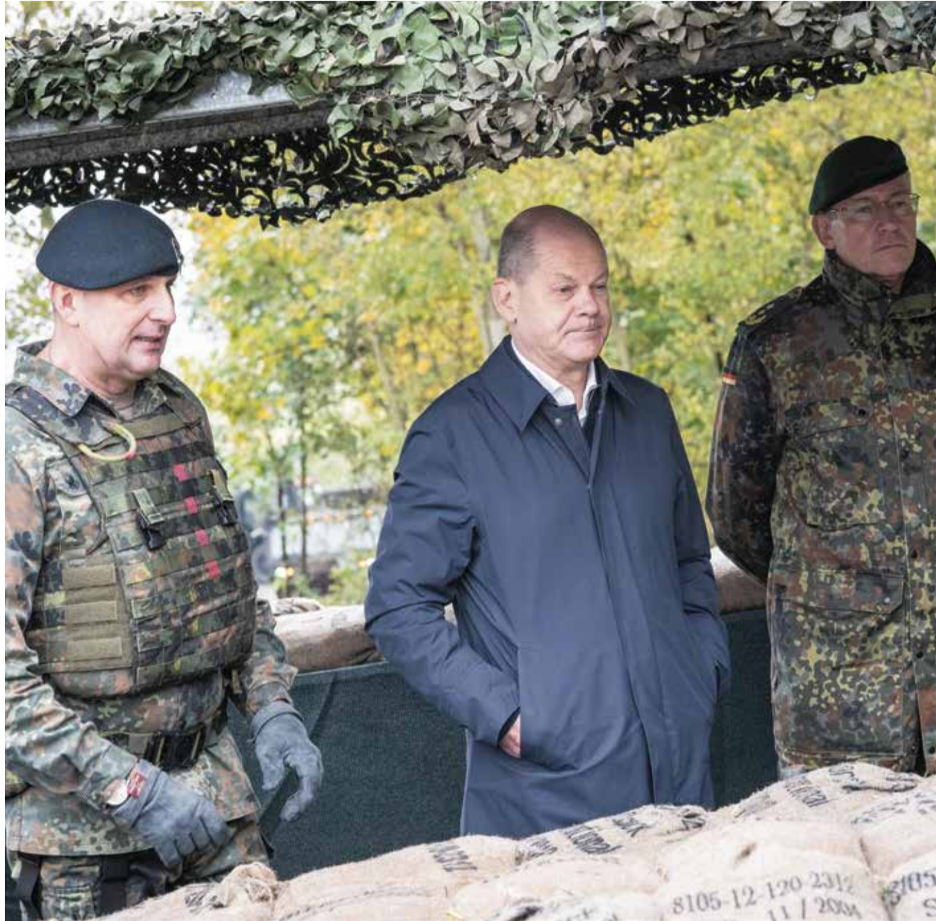
Verspruch bei seinem Amtsantritt Führung und lieferte dann doch nicht: Bundeskanzler Olaf Scholz, hier bei einem Besuch der Luftwaffenkaserne Köln-Wahn

Deutlich wurde die deutsche Zögerlichkeit in der Debatte um die Lieferung von Waffen. Während nicht nur ostmitteleuropäische Staaten klare Positionen einnahmen, wirkte die deutsche Regierung unsicher und zögerlich. Auch die von Scholz gesuchte Abstimmung mit den USA – etwa bei der Lieferung von Kampf- und Schützenpanzern oder auch weitreichenden Raketen – verstärkte den Eindruck, dass Deutschland statt zu führen bei allem und jedem auf der Bremse stand. Dies galt offensichtlich selbst für Gespräche mit der Gegenseite. Weshalb sonst hätte nach zwei Jahren Funkstille das Telefonat von Scholz mit Putin vom November 2024 derart