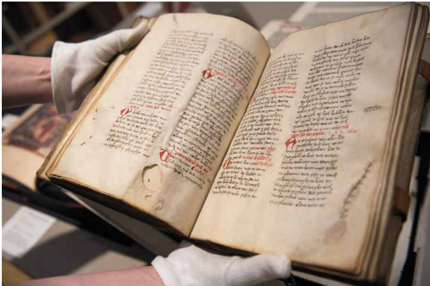
Wertvolle Abschrift aus dem Jahr 1385: Eine aufgeschlagene Seite des „Sachsenspiegel“

Über Eike von Repgow wurde viel geschrieben und spekuliert. Neben seiner Buchschöpfung sind allerdings nur wenige Fakten aus seinem Leben quellenmäßig gesichert. Vieles in früheren Darstellungen beruht auf Zuschreibungen. Nachgewiesenermaßen entstammte er einer