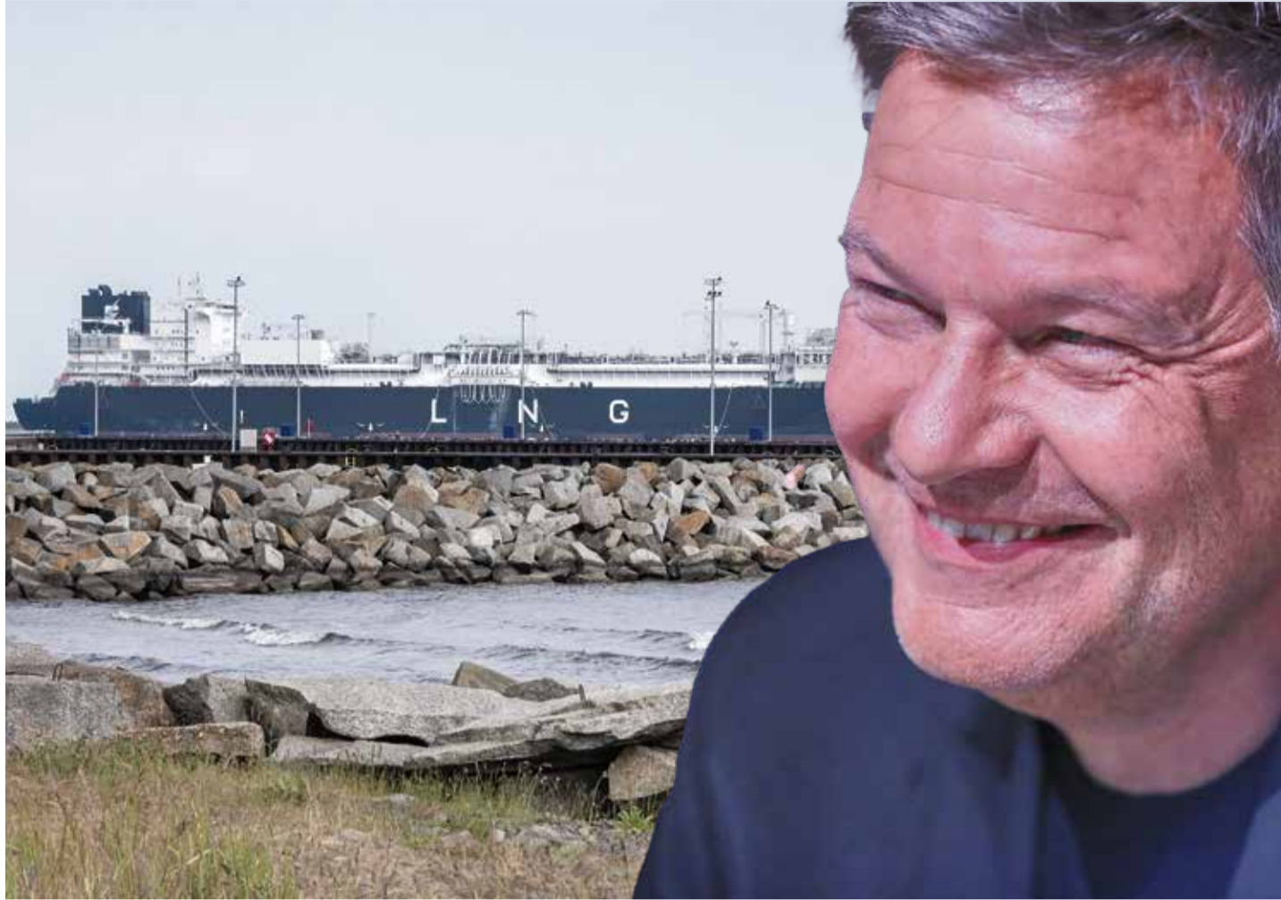
Der grüne Wirtschaftsminister Habeck: Grinst gern, auch wenn er Steuergelder wie hier beim LNG-Terminal auf Rügen versenkt