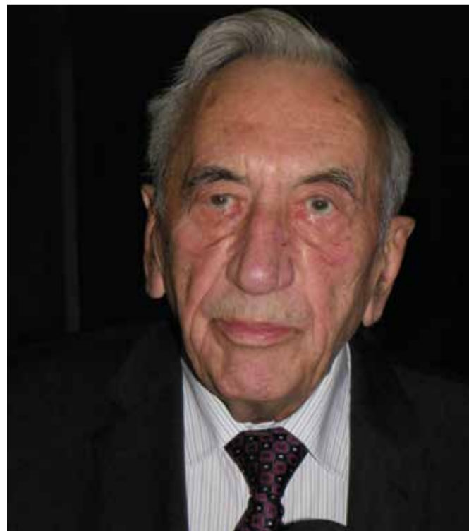
Gut drei Jahre vor seinem Tod bei einem Besuch in Oppeln: der frühere polnische Premierminister Tadeusz Mazowiecki

Herangehensweise an Aspekte der Vertreibung und kulturellen Wiederfindung nicht an Narrativen von „Migration“ orientierten. Heute als Lokalredakteur unmittelbar an der Grenze nerve ich eher damit, dass ich in deutschen Texten an deutschen Ortsnamen festhalte. Vor allem aber lassen sich bestimmte Formate auch nur mit dem meist öffentlich-rechtlich finanzierten journalistischen Raum überhaupt ausbreiten. Mit anzeigenfinanziertem minimalem Platz in einer Lokalzeitung ist man systemimmanent schon einmal schlechter gestellt.