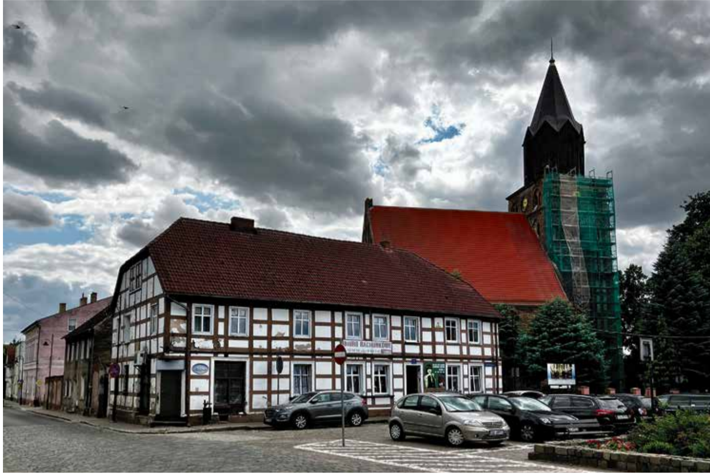
Die Sankt Marienkirche am Markt hat viel gesehen: Hungersnot, Pest, Feuersbrunst, Plünderung, Schwarze Pocken, Cholera sowie Flucht und Vertreibung

Die Siedler, Bauern, Handwerker und Kaufleute waren einst im 12. und 13. Jahrhundert in ein weitgehend entvölkertes Land gerufen worden. Sie brachten Erfahrung und Wissen mit, stellten eigene Regeln auf und sicherten sich das Erbrecht