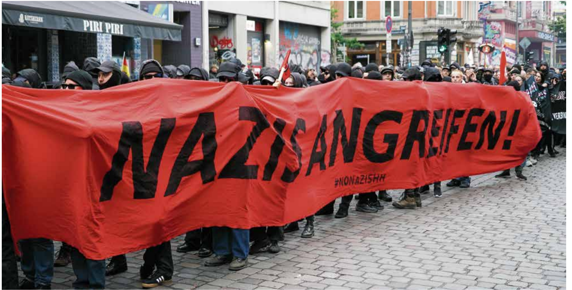
Auslöser für die „Anti-Antifa“: Aggressive Linksextremisten, hier auf einer Demo vergangenen Sommer in Hamburg

Nach dem zunehmend häufigeren Auftreten der sogenannten Autonomen Antifa und des dezidiert gewalttätigen „Schwarzen Blocks“ im Verlaufe der 1980er Jahre radikalisierte sich die rechtsextreme Szene in gleicher Weise, indem sie ab 1997 militante „Freie Kameradschaften“ bildete. Dazu kam später noch eine Professionalisierung der Anti-Antifa-Arbeit. So wurden die Sozialen Netzwerke im Internet ganz gezielt nach persönlichen Informationen über Gegner durchforstet und die Ergebnisse der Recher-