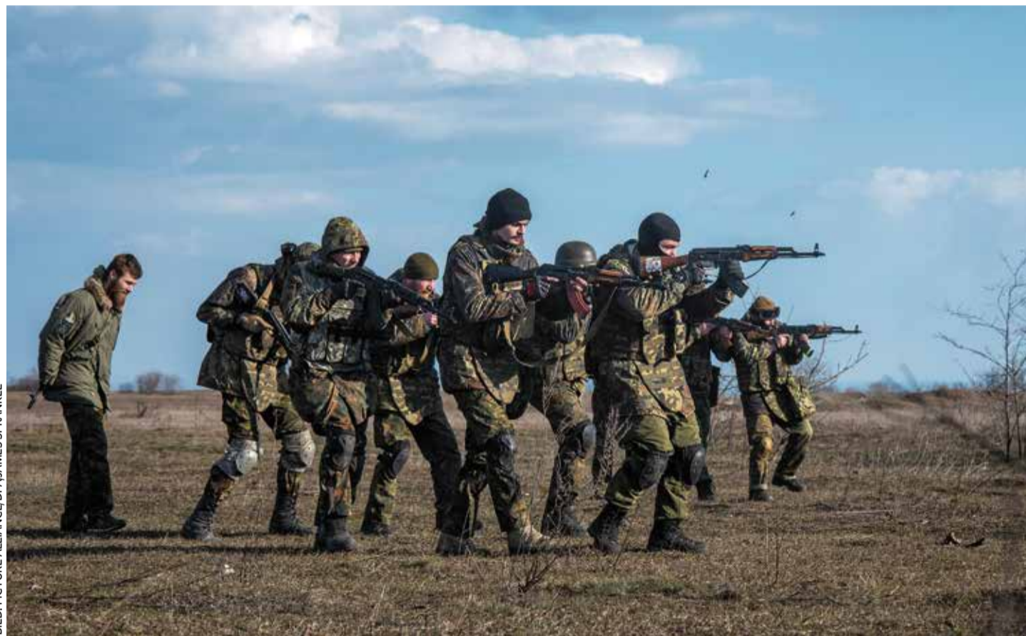
Nach Einberufungsbefehl: Die Online-Initiatoren von „DeepStateMap“ müssen demnächst an der Front den Feind ins Visier nehmen