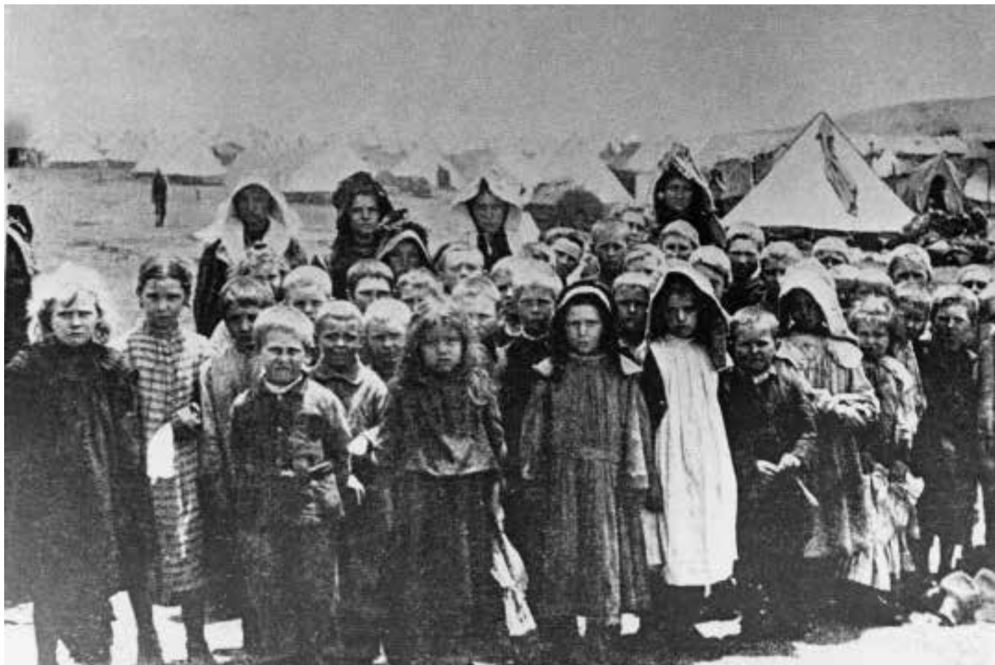
Insassen eines britischen Konzentrationslagers: Internierte burische Farmbewohner, überwiegend Frauen und Kinder