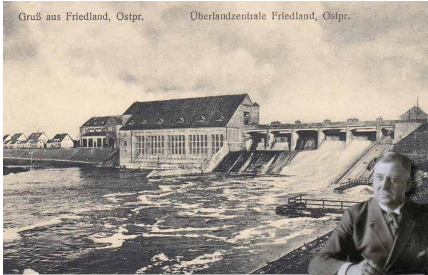
Das Stauwerk in Friedland an der Alle wurde maßgeblich vom ostpreußischen Oberpräsidenten August Winnig (r.) mit 200 Millionen Mark gefördert

Die hier erzeugte Energie reichte aus, um den gesamten Nordosten von Ostpreußen mit Strom zu versorgen, was für die damalige Zeit durchaus aufsehenerregend war. Insbesondere zeigten sich Besucher aus Litauen und Russland immer wieder höchst erstaunt über das hohe Maß an zivilisatorischem Fortschritt selbst in den umliegenden Dörfern.