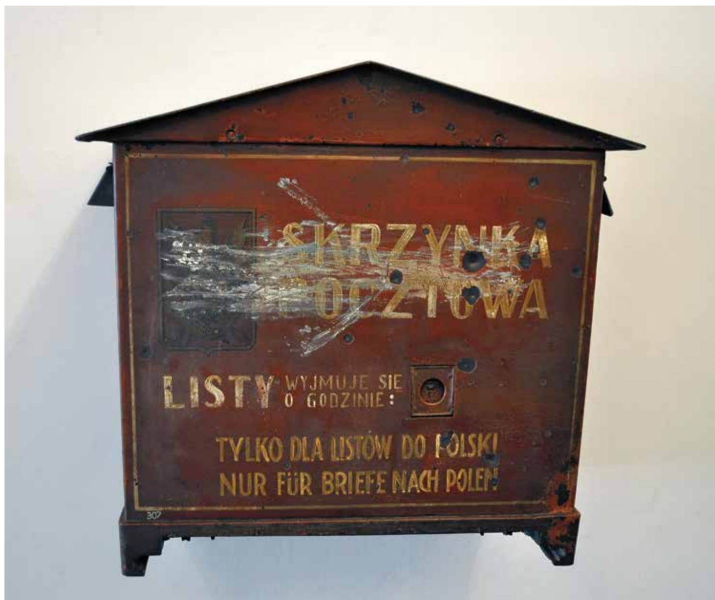
In der Zwischenkriegszeit ein Vorposten des großen Nachbarn im deutschen Stadtstaat: Briefkasten der Polnischen Post in Danzig

Damit erfüllte sich eine Ankündigung des polnischen Staatspräsidenten Stanislaw Wojciechowski, der bereits im Mai 1923 eine härtere Gangart im Sinne einer Politik der Nadelstiche in Aussicht gestellt hatte: „... Polen ist seit Jahren bemüht, Danzig durch Wohlwollen und Zugeständnisse zu gewinnen. Diese Zeitepoche ist als beendet zu betrachten. Man muss Danzig all diejenigen lebenswichtigen Säfte unterbinden, die es Polen entnimmt, und dies so lange, bis in Danzig eine andere dauerhafte Richtung die Oberhand gewinnt, die keinen Kampf noch Entgegensetzung von Schwierigkeiten will, sondern eine loyale Zusammenarbeit sucht und Polen als Großmacht anerkennt, die an Danzig nicht nur geschriebene, sondern natürliche Rechte hat. Danzig hat nur zwei Wege, entweder einen Wirtschaftskampf mit Polen, in dem wir mit völliger Rücksichtslosigkeit Widerstand leisten werden, oder ein loyales Vorgehen der Freien Stadt gegenüber dem großen polnischen Reich.“