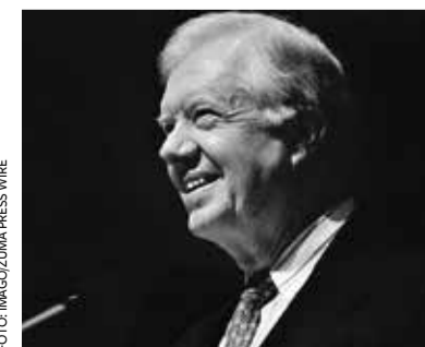
Der Demokrat Jimmy Carter war von 1977 bis 1981 der 39. Präsident der Vereinigten Staaten

Doch der krachend abgewählte Demokrat blühte nach seiner politischen Karriere erst richtig auf. Das soziale Engagement des gläubigen Katholiken war einzigartig. Er baute Häuser für Obdachlose, legte dabei selbst Hand an, sammelte Millionen US-Dollar an Spenden und erhielt 2002 schließlich den Friedensnobelpreis für seine stetigen Bemühungen um den Frieden. So gründete er das Carter Center für Menschenrechte und war als Privatmann und privater Diplomat immer wieder als Vermittler in verschiedenen Konflikten von Afrika, Südamerika, im Nahen Osten im Golfkrieg als auch im Jugoslawienkrieg unterwegs. Carter wurde 100 Jahre alt und war bis dato der am längsten lebende Ex-US-Präsident. S.C.