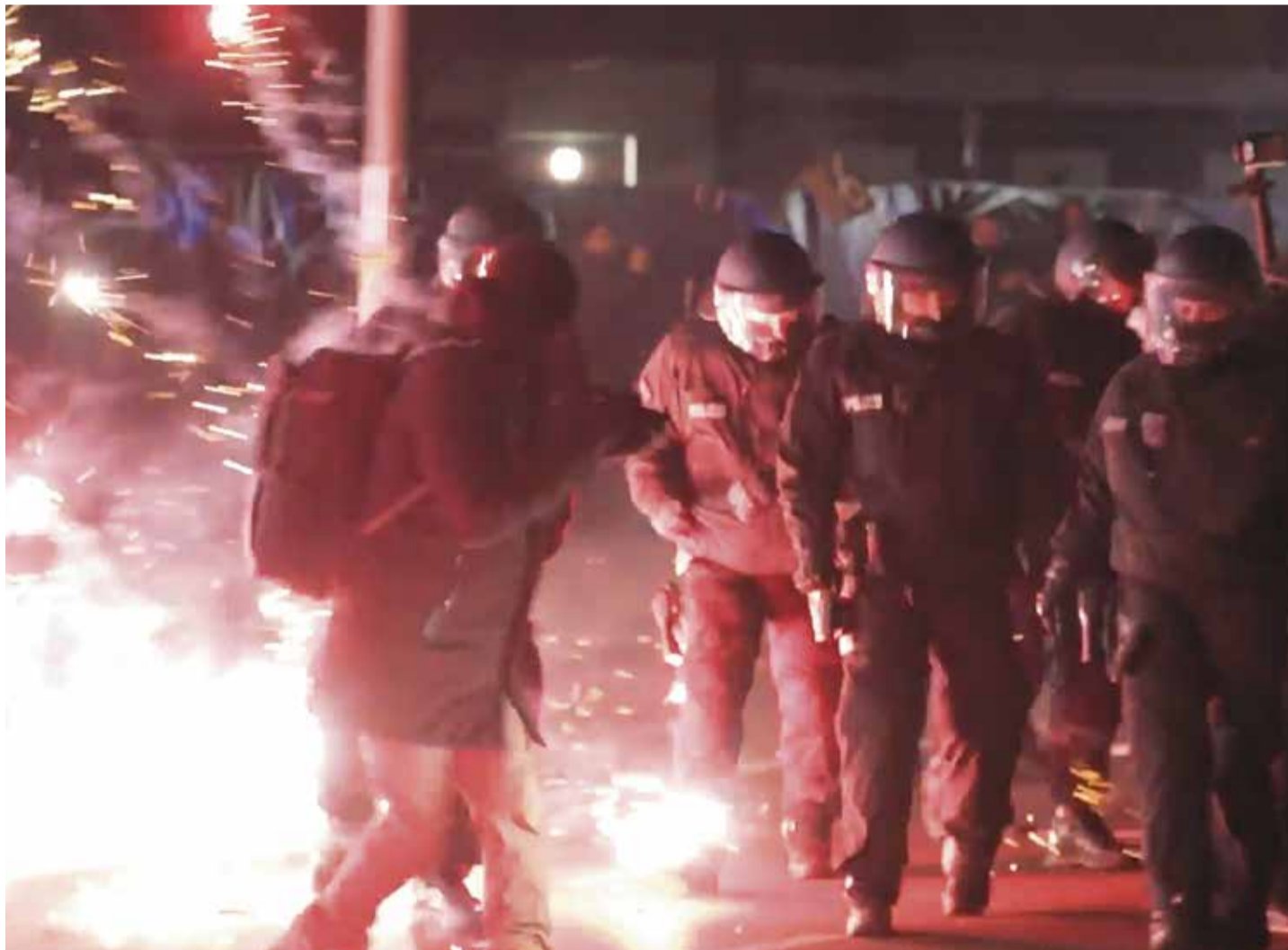
Oft Ziel von Angriffen: Polizisten in der Silvesternacht in Neukölln

Ein zweiter spektakulärer Fall heizte in Berlin die Diskussion um sogenannte Kugelbomben an. Eine derartige Bombe führte in der Silvesternacht in Berlin-Schöneberg zu massiven Schäden. Die Wucht der Detonation beschädigte an der Kreuzung von Belziger Straße und Hauptstraße sieben Häuser und diverse Autos. 36 Wohnungen waren vorübergehend unbewohn-