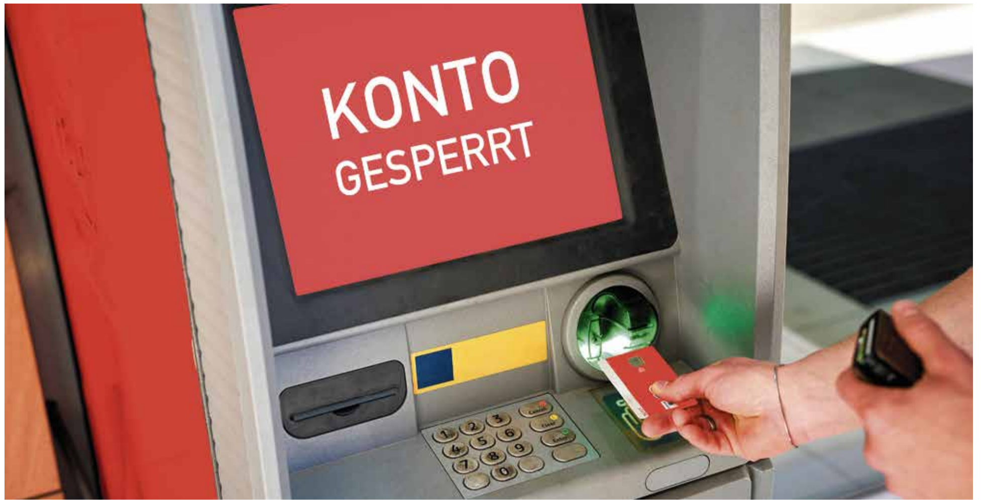
Wenn nichts mehr geht: Kontosperrungen sind zur politischen Waffe geworden

Angesichts dessen, dass der ebenso lautlose wie effektive Kampf gegen abweichende Meinungen mithilfe der Banken eine ständige Intensivierung zu erfahren scheint, stellen Kritiker die Frage, ob hier eine konzertierte und gesteuerte Aktion abläuft. Dabei lautet die Antwort letztlich „Jein“, denn oftmals agieren die Geldinstitute völlig aus eigenem Antrieb. Der Hauptgrund dafür könnte in der Angst vor einer Rufschädigung liegen. Die Bankvorstände, welche sich gegenüber den Verwaltungs- und Aufsichtsräten sowie der Öffentlichkeit und der Gesamtheit der