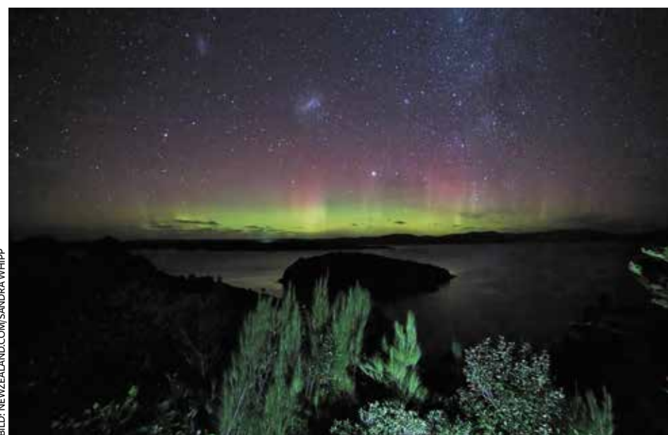
Wie Lichter eines fremden Raumschiffes: Aurora australis über Stewart Island/Rakiura

Ganz im Süden der Nordinsel ist die Küste des Wairarapa ein perfekter Beobachtungsort, weil sie sowohl nach Süden als auch Osten ausgerichtet ist. Auch der Blick auf die Milchstraße ist atemberaubend von hier. Vor dem Hintergrund schneebedeckter Berge bietet die Südinsel Neuseelands jedoch die perfekten Bedingungen für Himmelsbeobachtungen. Zu nennen wären hier die Küste der Catlins oder – ganz im Süden – Stewart Island, die in der Maori-Sprache der Ureinwohner Rakiura heißt, was so viel wie „Land des leuchtenden Himmels“ bedeutet. Wer hier einmal das Polarlicht erlebt hat, der wird ein wahrhaft kosmisches Gefühl mit nach Hause tragen. H. Tews