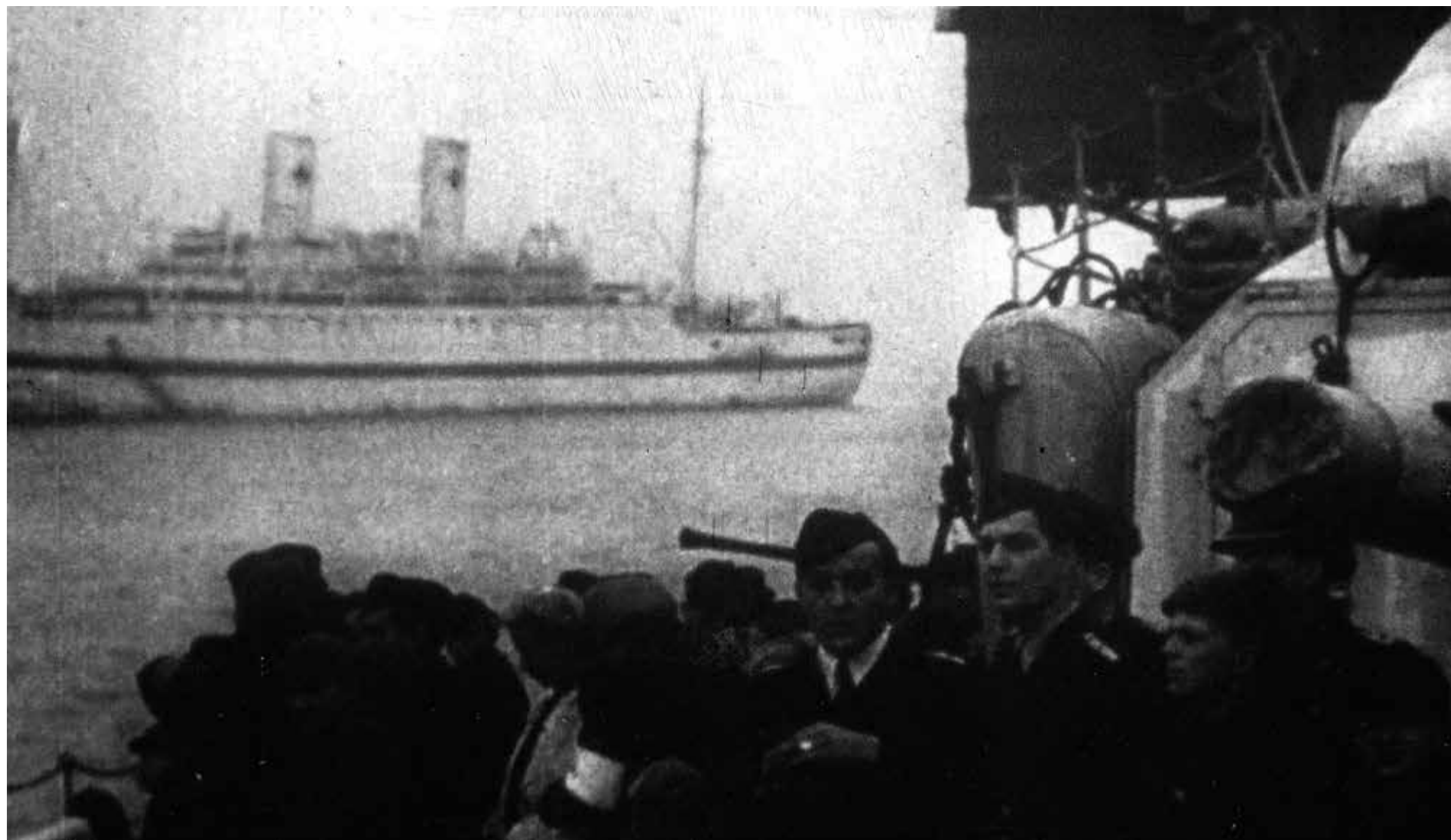
Auch einstige „Kraft durch Freude“-Schiffe wurden eingesetzt: Flucht aus Ostpreußen über die Ostsee vor 80 Jahren