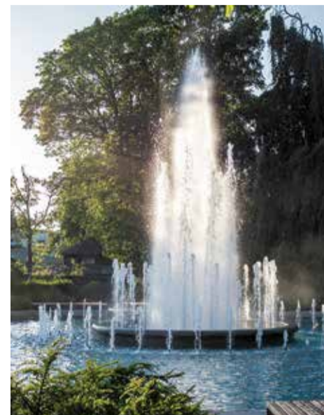
Besonderheit des Königsberger Tiergartens: Viele Objekte stammen noch aus deutscher Zeit wie das Bärengehege und der Springbrunnen. Sie stehen unter Denkmalschutz

on hatte somit natürliche Auswirkungen auch auf die hiesigen Besucherzahlen.