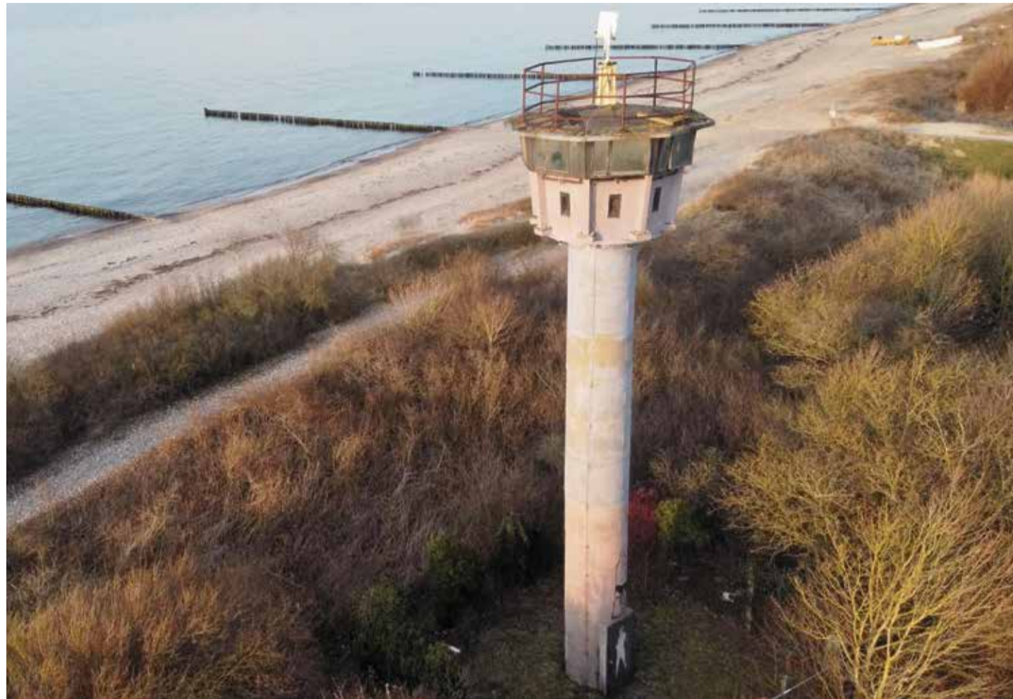
Als See-Grenzbeobachtungsturm (BT 11) gehörte er zu einer Reihe von ehemals 27 Türmen dieser Art an der Ostseeküste der DDR: Ostsee-Grenzturm Börgerende

Die juristische Grundlage für deren Tätigkeit bildete ab dem 19. März 1964 die neue Grenzordnung der DDR. Dabei wurde zwischen der land- und der seeseitigen Grenzsicherung unterschieden. Landseitig kontrollierte die 6. GBK eine fünf Kilometer breite Grenzzone zwischen Pötenitz am Dassow-See im Westen und Altwarp am Oderhaff im Osten, die zwar kein Sperrgebiet war, in der aber diverse Meldepflichten und Auflagen für Bewohner und Touristen galten. Dazu kam ein 500 Meter