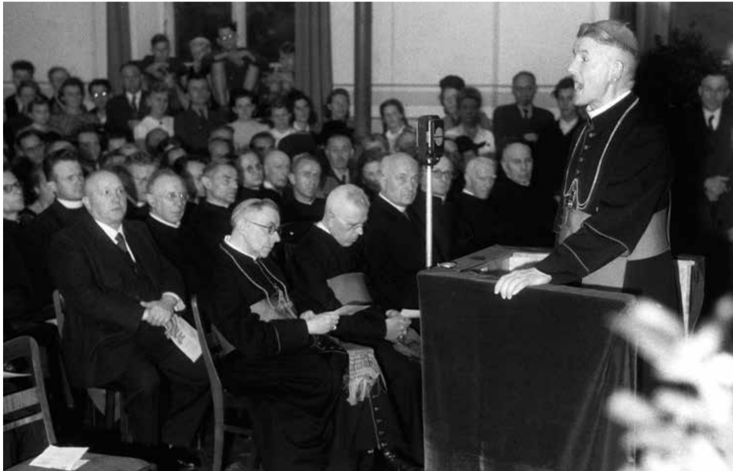
Der vom Papst zum Beauftragten für die Flüchtlinge ernannte Bischof Maximilian Kaller spricht zum Abschluss der Bischofskonferenz Ende August 1946 zu den katholischen Bischöfen und Flüchtlingen

Auf Anselm folgte 1278 Heinrich Fleming, dem es mit viel Geschick gelang, das Ermland weitgehend der Herrschaft des Ordens zu entziehen. Dieser fungierte bald nur noch als Schutzmacht des Bistums nach außen. Im Jahre 1356 stiegen die ermländischen Bischöfe, welche ab 1350 in der Burg Heilsberg residierten, sogar