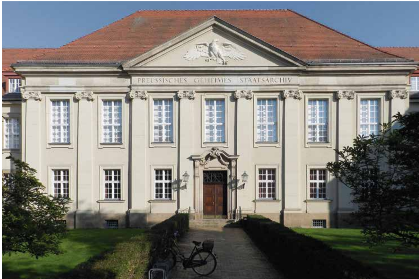
Seit 1924 Heimat preussischer Aktenbestände: Das Geheime Staatsarchiv in Berlin-Dahlem

Jahrhundertlang waren die Archive im Berliner und im Königsberger Schloss untergebracht. Viele Akten wurden erst nach und nach im 19. Jahrhundert vom Staat der Forschung freigegeben, zuvor dienten sie der Verwaltung und waren oft tatsächlich geheim. Mehr und mehr traten erledigte Akten aus Behörden, aus Privatbesitz, aus Nachlässen hinzu. Immer enger wurde es in beiden Schlössern, immer notwendiger Neubauten hier wie