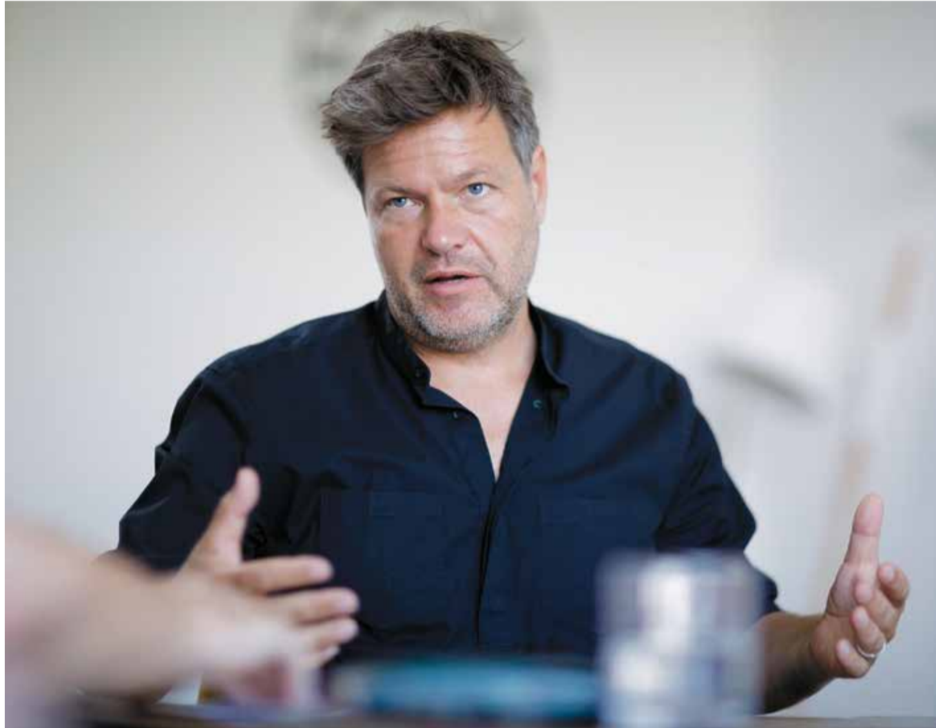
Zweifelhafter Debattenstil: Während Robert Habeck am Küchentisch den plaudernden Kumpeltyp gibt, verfolgt der grüne Vizekanzler wie kein zweiter Politiker unliebsame Äußerungen im Internet