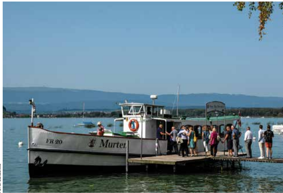
Als MS „Murten“ auf dem Schweizer Murtensee unterwegs: Einst „Hindenburg“, „Schwerin“, „Sowjetfreundschaft“, „Mecklenburg“ und „Liselotte von der Pfalz“