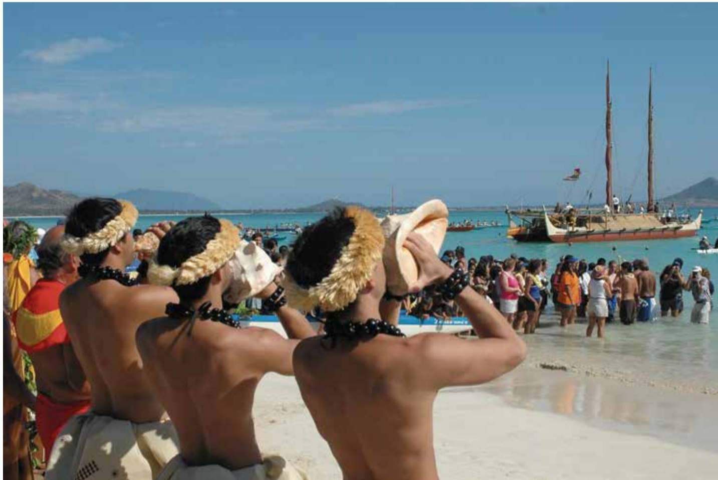
Begrüßung auf Polynesisch: Die „Höküle'a“ nach ihrer Ankunft in der Bucht von Kailua auf der Hawaii-Insel O'ahu

1769 fiel dem englischen Südseentdecker und Kartographen James Cook (1728–1779) auf, dass er sich mit den Maori auf Neuseeland verständigen konnte, weil diese denselben Dialekt sprachen wie