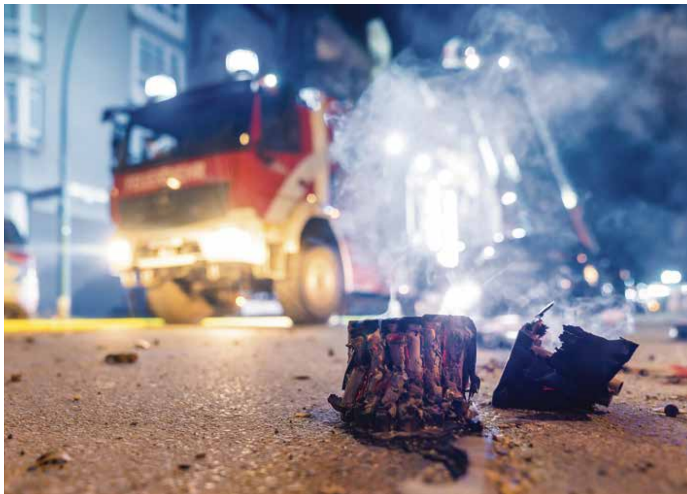
Löschen bei Böllerbeschluss: Die Feuerwehr im Einsatz in Berlin-Neukölln

Sowohl Bundeskanzler Olaf Scholz als auch Innenministerin Nancy Faeser wissen, dass es fast unmöglich ist, jemanden abzuschicken oder in sein Heimatland zurückzuführen. Schon allein deswegen sind die vollmundigen, in regelmäßigen Abständen wiederholten Abschiebe-Ankündigungen pure verbale Nebelkerzen. Es geht nicht ums Abschieben, sondern darum, niemanden mehr ins Land zu lassen, der nicht hundertprozentig ein Recht auf Asyl hat. Dass es klappt, wurde im Sommer 2024 deutlich, als die Grenzkontrollen wegen der Fußball-EM verschärft wurden und die Zahl der Illegalen signifikant sank. Italiens Verhalten ist der Beweis: Eine EU-weite Lösung gibt es nicht, gab es nie und wird es nicht geben – trotz aller scheinheiligen Bekundungen.