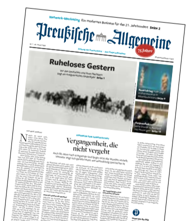
Ausgabe Nr. 1

Leserbriefe an: PAZ-Leserforum, Buchstraße 4, 22087 Hamburg, Fax (040) 41400850 oder per E-Mail an redaktion@preussische-allgemeine.de