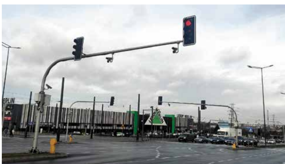
Wegen Kameras gemieden: Kreuzung bei der „Ermländischen Galerie“

Die einzige derartige Anlage in Allenstein befindet sich an der Kreuzung Sikors-