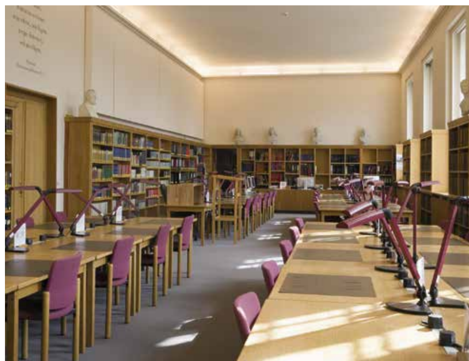
Wird in Zeiten zunehmender Digitalisierung von den Nutzern immer weniger aufgesucht: Der große Forschungssaal im Geheimen Staatsarchiv

Die Jubiläumsausstellung im Geheimen Staatsarchiv ist während der normalen Öffnungszeiten des Hauses zugänglich.