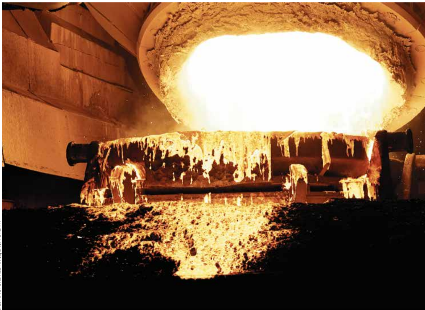
Stahlkochen bei Thyssenkrupp in Duisburg: Grüner Stahl bleibt vorerst eine Illusion, weil die Produktion viel zu teuer ist

„Die Branche setzt alles auf eine Karte“, schrieb ZDF-Online im Oktober, als im saarländischen Dillingen eine weitere milliardenschwere Investition beschlossen wurde. Eine Direktreduktionsanlage (DRI) und zwei Elektrolichtbogenöfen