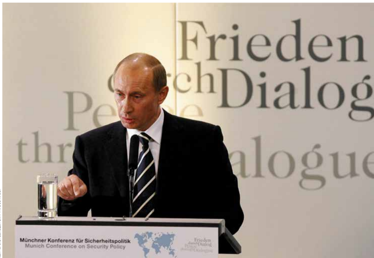
Leitete einen Wendepunkt in den gegenseitigen Beziehungen ein: Putins Rede auf der Münchner Sicherheitskonferenz 2007

Kopenhagen – König Frederik X. hat das Staatswappen des dänischen Königshauses überarbeiten lassen. In der seit Jahresanfang gültigen neuen Fassung sind ein Eisbär und ein Widder als Symbole für Grönland und die Färöer-Inselgruppe größer abgebildet. Drei Kronen als Symbol der mittelalterlichen Kalmarer Union zwischen Schweden, Norwegen und Dänemark sind dafür vom neuen Wappen verschwunden. Beobachter werten das neue Königswappen als Signal, dass Dänemark seinen Anspruch auf Grönland und die Färöer-Inseln aufrechterhält. Auf Grönland wird seit einigen Jahren immer vehementer die Unabhängigkeit von Dänemark gefordert. Zudem hat Donald Trump schon in seiner ersten Amtszeit Interesse an einem Kauf Grönlands bekundet. Kürzlich bezeichnete er den Besitz und die Kontrolle Grönland sogar als eine Notwendigkeit für die nationale Sicherheit der USA. H.M.