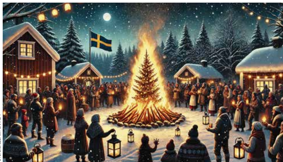
So könnte es in einem schwedischen Dorf ausgesehen haben: Das Knutfest beendet die Weihnachtszeit mit dem Verbrennen der Weihnachtsbäume

In der Hansestadt Stralsund begeht man ebenfalls das Knutfest, und so frönte man am 11. Januar dieses Jahres im Stralsunder Strandbad der schwedischen Tradition. Die abgeschmückten Bäume wurden verbrannt, und bei Glühwein und Bratwurst vom Grill ließ man es sich gut gehen. Ein Fest, das noch mal Licht in die dunkle Zeit bringt. Brigitte Stramm