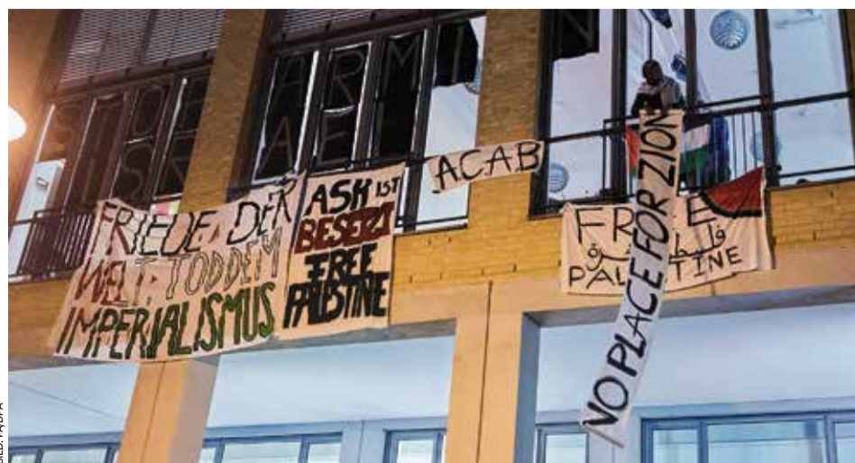
Freiraum für Aktivist:innen: Pro-palästinensische Banner an der Alice-Salomon-Hochschule

Schon 2018 löste die Alice-Salomon-Hochschule eine Protestwelle aus, als ein am Gebäude aufgemaltes Gedicht des Lyrikers Eugen Gomringer wegen angeblichen Sexismus entfernt und durch eine andere Aufschrift ersetzt wurde. Diese Selbstzensur sah viele als einen Angriff auf die Kunstfreiheit. Dass sich die Hochschule die Freiheit nimmt, ausgerechnet jenen Fürsprechern einer Volksgruppe aus dem Nahen Osten, die nicht gerade als Vorkämpfer für die Frauenrechte steht, ein Forum zu geben, ist ebenso inkonsequent wie absurd. Harald Tews