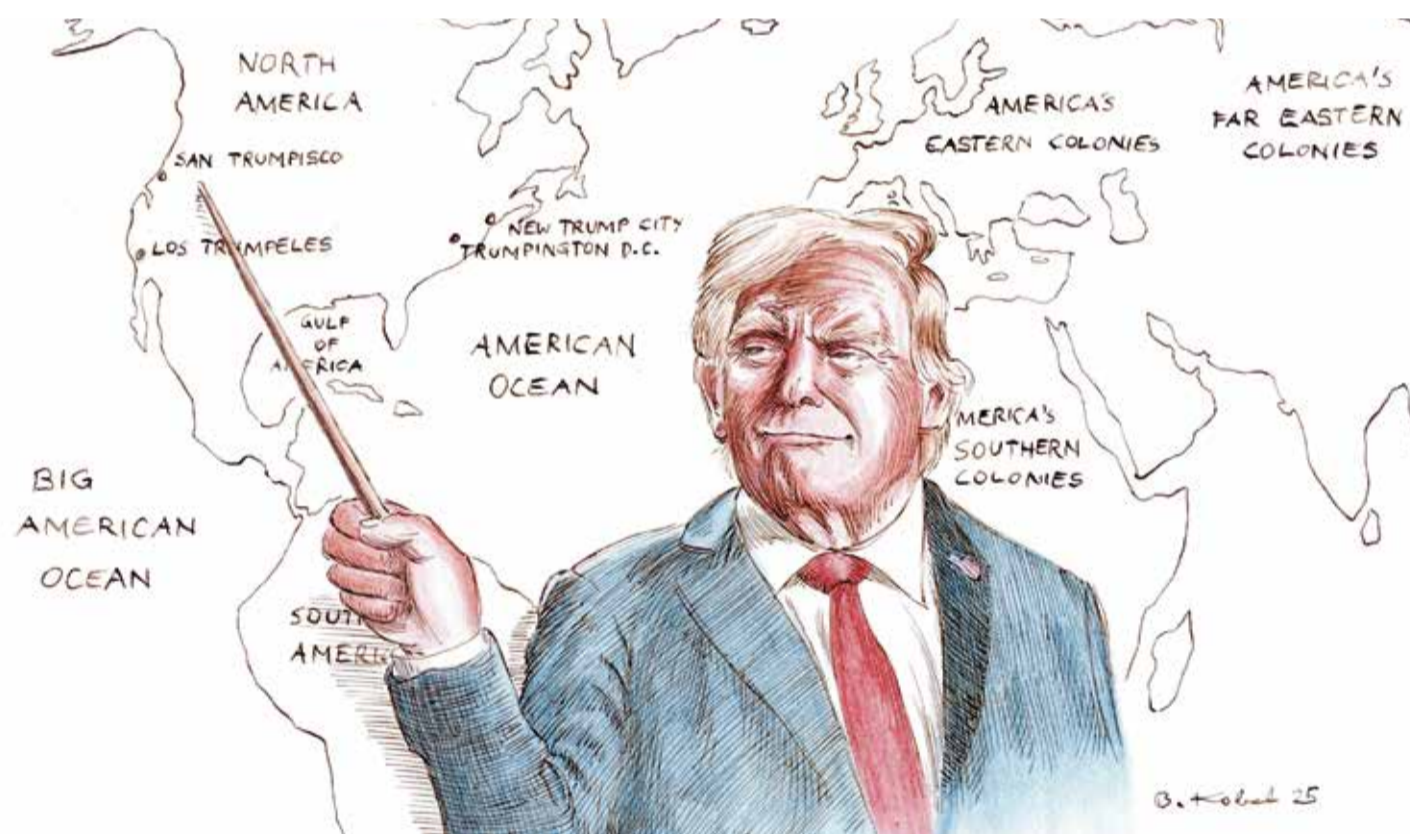
Donald Trump vor seiner neuen Weltkarte, wie er sie wohl am liebsten hätte: Cartoonist Benedikt Kobel zeigt auf ironisch-sarkastische Weise die plötzlich deutlich verbalisierte Lust am Imperialismus des 47. Präsident der Vereinigten Staaten

Das aber stört Trump sicherlich nicht. Auch nicht, dass er als erster verurteilt, wenn auch unbestrafter, Präsident in die Geschichte der USA eingehen wird. Vorbei die Zeiten einer republikanischen Ikone wie Ronald Reagan, der mit Aura, rhetorischer Gewandtheit und politischem Gespür die Welt und sein Land positiv prägte und den „American Spirit“ verströmte – weil er ein verantwortungsbewusster Patriot mit festen moralischen Grundsätzen und klaren politischen Visionen war. Moral und Anstand bedeuten Trump hingegen nichts, sondern nur der nächste Deal, und der soll am liebsten vor allem einem nützen: ihm selbst.