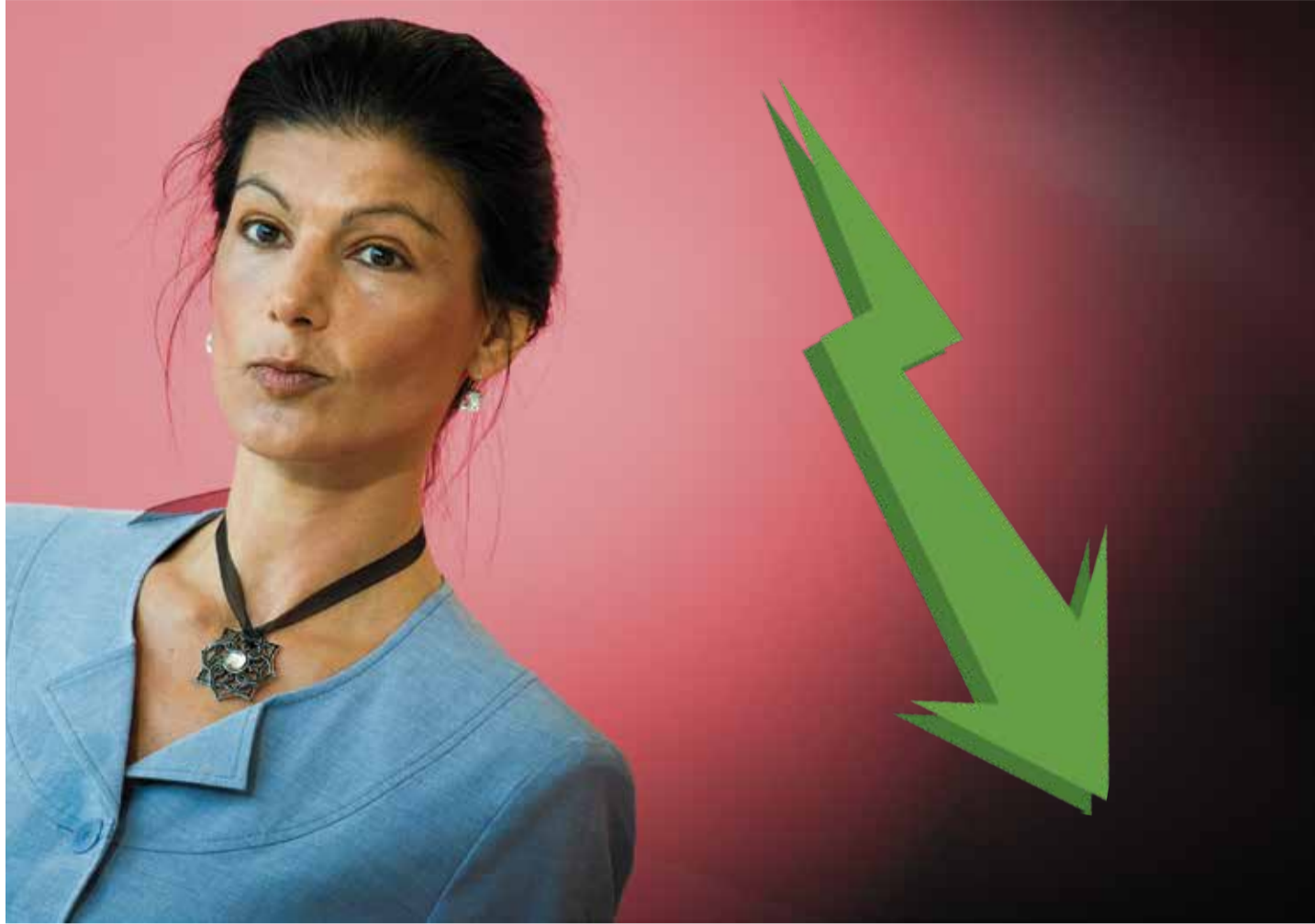
Macht gute Miene zum bösen Spiel: Nach kurzem Höhenflug droht der Absturz für Sahra Wagenknechts BSW-Truppe

Berlin – Die Unternehmensverbände Berlin-Brandenburg (UVB) sprechen sich dafür aus, Feiertage wie den Frauentag und den Einheitstag zukünftig immer auf einen Sonntag zu legen. Die Unternehmensverbände verweisen dabei auf die anhaltende Wirtschaftskrise und auf Berechnungen der Bundesbank sowie des Ifo-Instituts zu den volkswirtschaftlichen Kosten eines Feiertages. Im Fall von Berlin würde nach Angaben der UVB ein zusätzlicher Arbeitstag immerhin 230 Millionen Euro zusätzliche Wertschöpfung bringen. Der Frauentag am 8. März wurde in Berlin als arbeitsfreier Feiertag erst 2019 unter der damaligen rot-rot-grünen Landesregierung eingeführt. Der CDU-Wirtschaftspolitiker Christian Gräff erklärte, er könne sich durchaus vorstellen, dass der 8. März künftig kein gesetzlicher Feiertag mehr sei. Der Linken-Bundestagsabgeordnete Christian Görke hat unterdessen vorgeschlagen, auf einen Sonntag fallende gesetzliche Feiertage durch einen arbeitsfreien Montag nachzuholen. H.M.