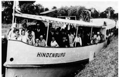
In Stralsund vom Stapel gelaufen: Das kleine Ausflugsschiff MS „Hindenburg“

Sie lag dort, wo die Königliche und spätere Staatswerft Stralsund, der VEB Schiffs- und Reparaturwerft und seit der Wende die Strahlwerft an der Ziegelstraße ihre Anlagen hatten. Heute im Schatten der Rügenbrücke fristet sie ein beschäftigungsloses Dasein.