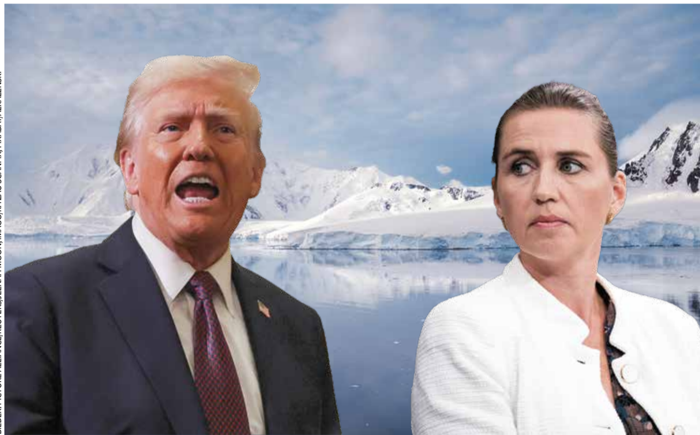
US-Präsident Trump (l.) will unbedingt Grönland haben – aber Dänemarks Regierungschefin Frederiksen (r.) lehnt das strikt ab

Erst 2021 wurde durch Recherchen des dänischen Rundfunks in Kooperation mit deutschen Medien bekannt, dass der dänische Geheimdienst zwischen 2012 und 2014 dem NSA geholfen hat, europäische Spitzenpolitiker abzuhören. Konkret soll der dänische Dienst der NSA ermöglicht haben, einen wichtigen Internetknotenpunkt in der Nähe von Kopenhagen anzuzapfen. Vom Lauschangriff der Amerikaner betroffen waren laut den Berichten Politiker aus Schweden, Norwegen, den Niederlanden und Frankreich, aber auch Angela Merkel, Frank-Walter Steinmeier und der damalige SPD-Kanzlerkandidat Peer Steinbrück.