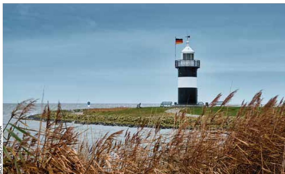
Bei „Schietwetter“ empfängt er keine Besucher: Der „Kleine Preuße“

● In der Wintersaison geöffnet: Sonnabend und Sonntag von 13 bis 15 Uhr, Eintritt frei. www.kleiner-preusse.de