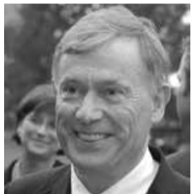
Horst Köhler (1943–2025)

In einer Stellungnahme zum Tode Horst Köhlers nannte ihn der amtierende Bundespräsident Frank-Walter Steinmeier einen „Glücksfall“ für unser Land. Dem ist nichts hinzuzufügen.