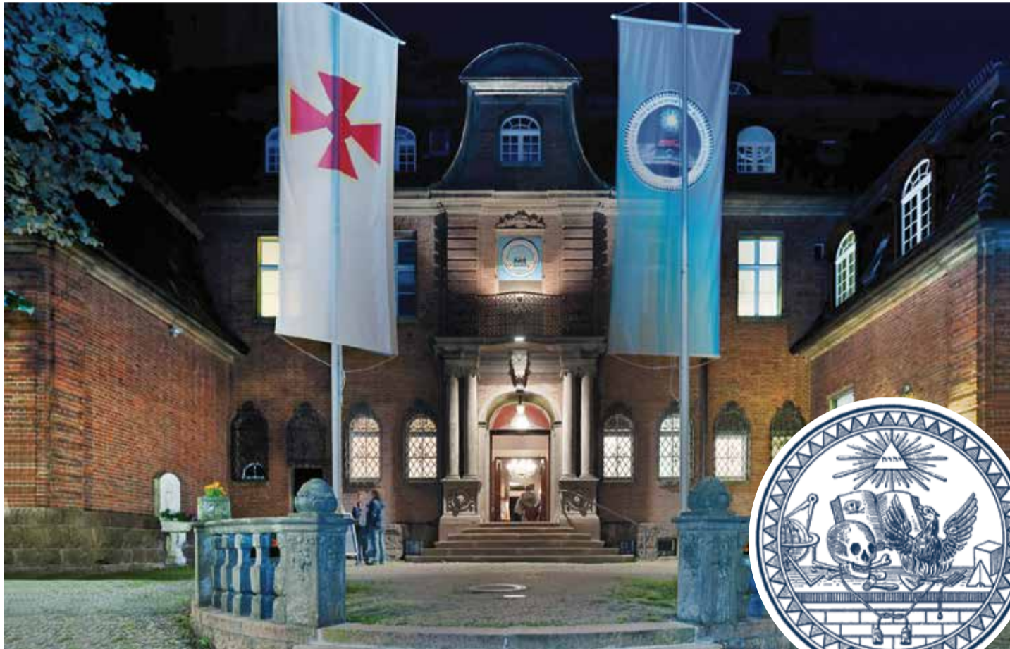
Nach dem Krieg veranlassten die beiden Logenbrüder Rogoruský und Kecker die Wiederbegründung der Loge „Zum Totenkopf und Phoenix“ – heute residiert die Bruderschaft in Berlin-Dahlem

Die neue Loge wurde kurz darauf als Tochterloge der Großen Landesloge der Freimaurer von Deutschland anerkannt, welche gleichfalls gegen das System der Strikten Observanz opponierte und den Schwedischen Ritus bevorzugte, der zwar ebenfalls auf christlich-mythischem Gedankengut basierte, aber eben nicht den blinden Gehorsam gegenüber den „Oberen“ in den Mittelpunkt stellte, sondern die Erziehung zu einem innerlich freien Menschen. Zur Loge „Zum Totenkopf“ gehörten vorwiegend Beamte, Militärs, Unternehmer, Hochschullehrer, Ärzte, Theologen, Grundbesitzer und Künstler. Einige der bekanntesten Mitglieder waren der Generalleutnant Heinrich Christoph