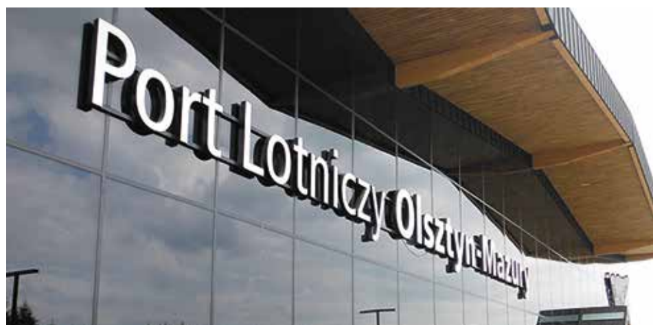
Erweitert sein Angebot: Flughafen Schimanen