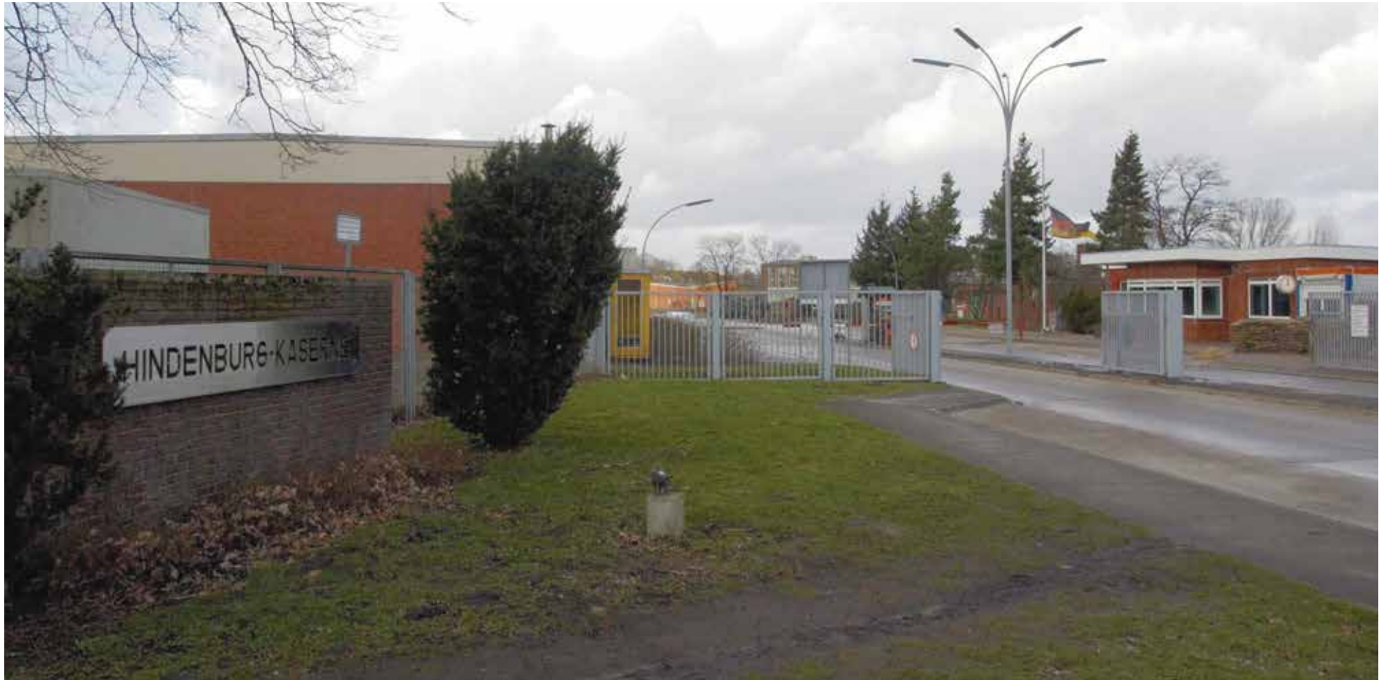
Vor der Umbenennung: Hindenburg-Kaserne im niedersächsischen Münster

Längst hat die Sorge um den „falschen“ Namen auch die Bundeswehr erfasst. Die haderte bislang eigentlich nur mit Traditionslinien, die zur Wehrmacht