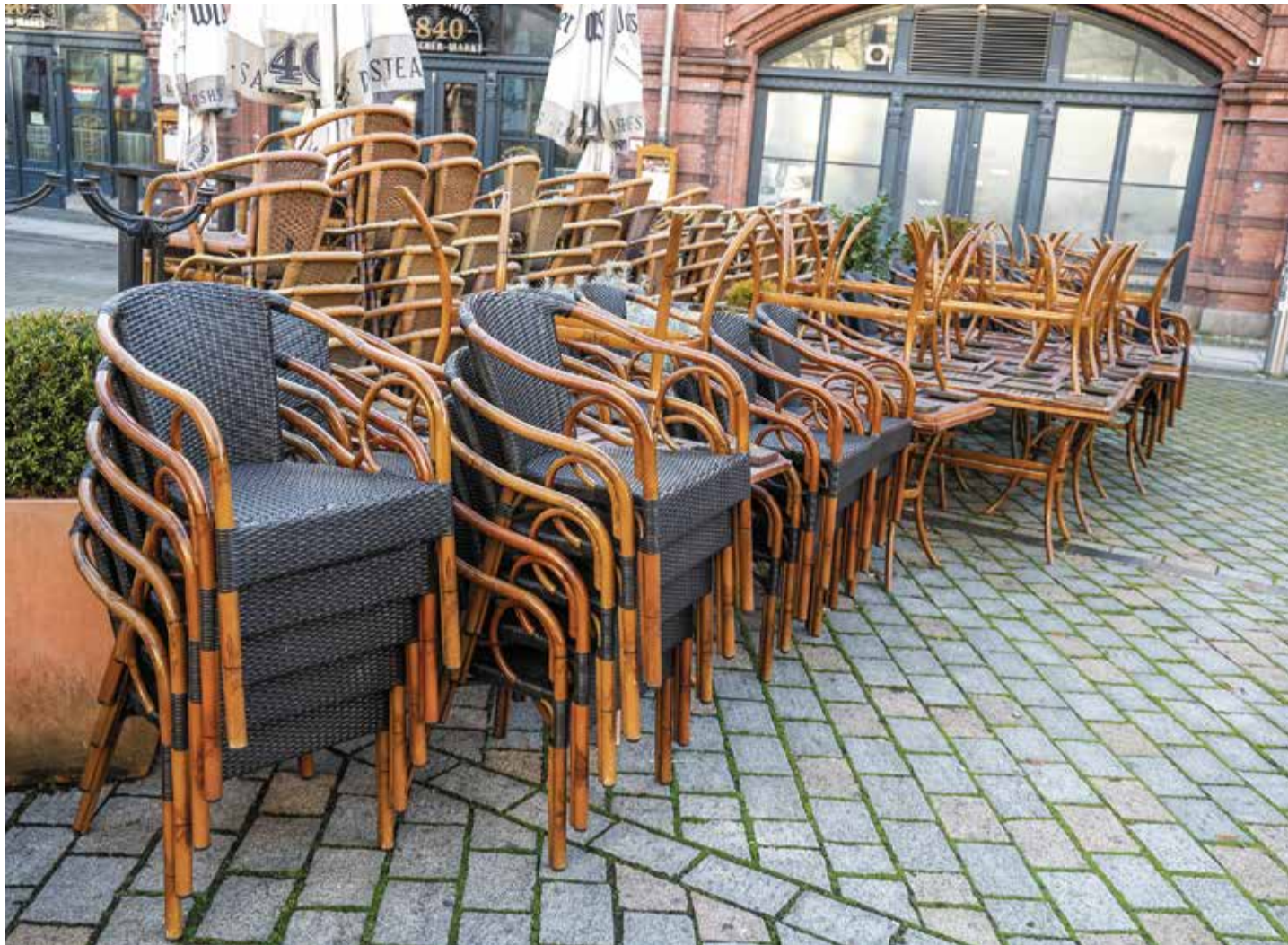
Gerade höherpreisigen Lokalen geht die Luft aus: Restaurantsterben in Berlin

Die Rede ist mittlerweile davon, dass in Berlin ein großes Restaurantsterben eingesetzt hat. Als Ursachen nennen Betreiber und Küchenchefs neben gestiegenen Lebensmittelpreisen, höheren Mieten und Personalkosten auch immer wieder die massiv gestiegenen Energiekos-