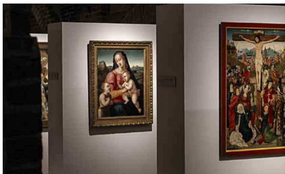
Erstmalig in einer Ausstellung vereint: Seltene Artefakte und Dokumente