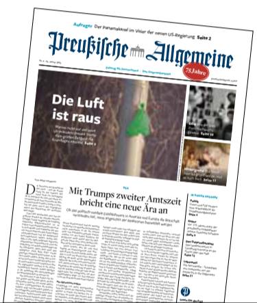
Ausgabe Nr. 4

Gisela Löffelmacher, Flensburg zum Thema: Der grünen Blase geht die Luft aus (Nr. 4)