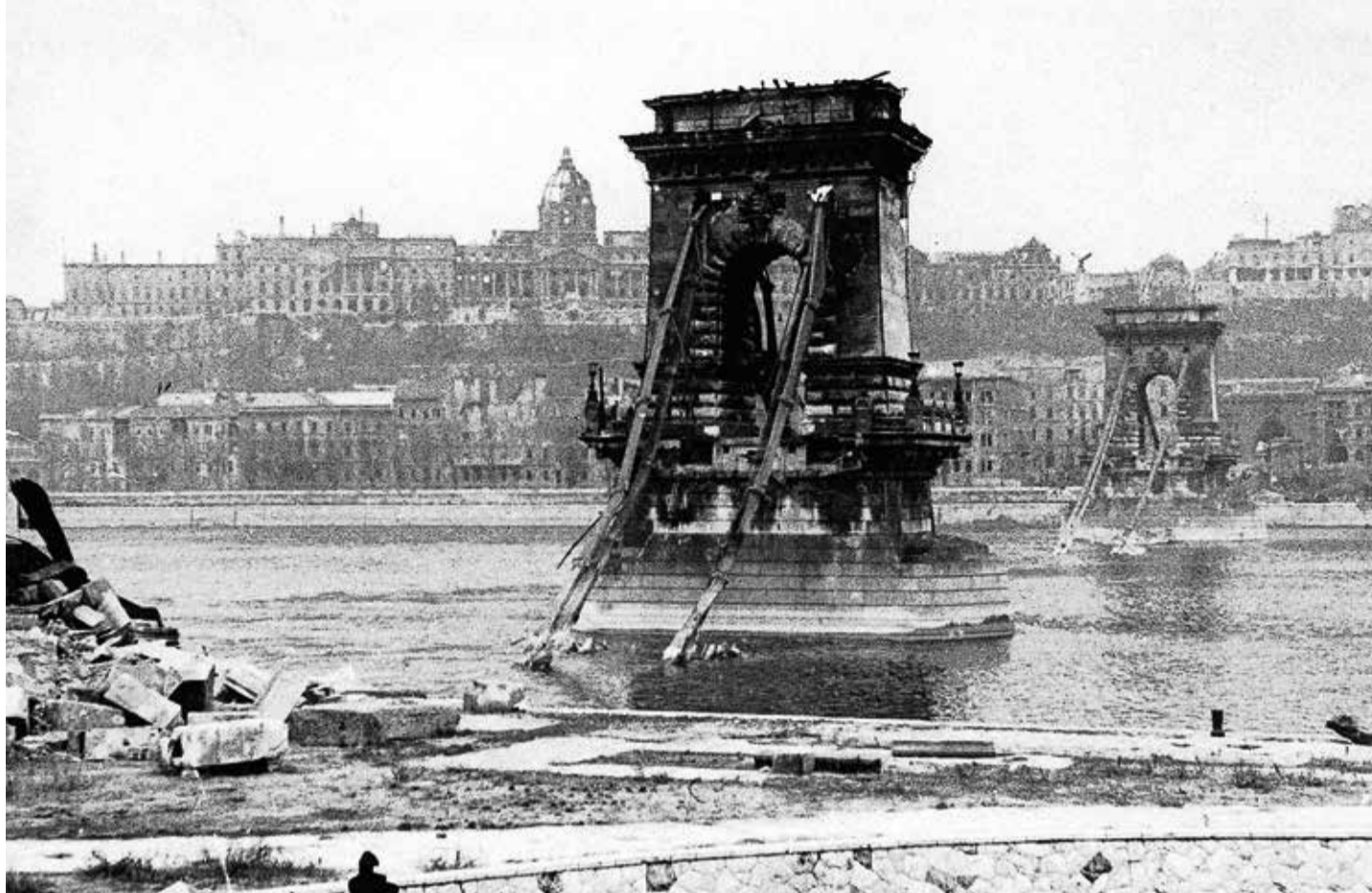
Sinnbild eines Untergangs: Blick von der Pester Seite über die zerstörte Kettenbrücke auf die Ruine der Budaer Burg 1945