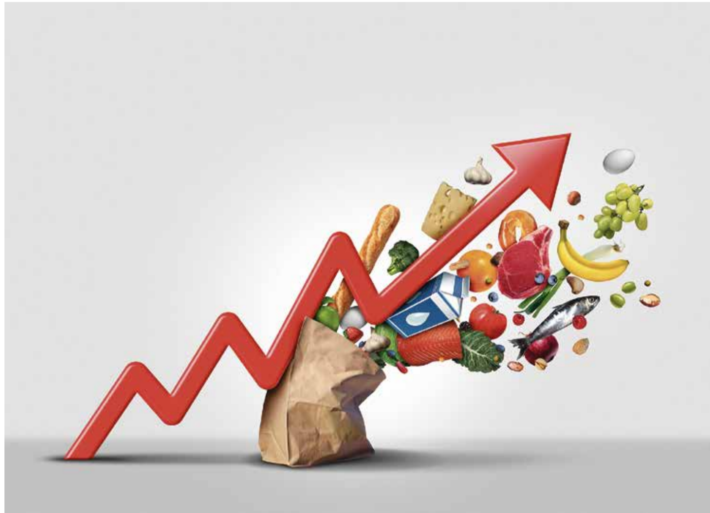
Die hohen Teuerungsraten bringen immer mehr Menschen in wahre Existenznot

Zucker wurde im Vier-Jahres-Vergleich um 83 Prozent teurer. Nach Angaben der deutschen Zuckerwirtschaft gingen die Preissteigerungen vor allem auf steigende Kosten für Energie, Rohstoffe und Personal zurück. Bekannt und in einer breiten Öffentlichkeit diskutiert war die temporäre Speiseölnappheit, für die der Ukraine-Krieg verantwortlich gemacht wurde. Mittlerweile sind die Regale zwar wieder voll, aber die Preise für Rapsöl liegen um durchschnittlich mehr als 60 Prozent über dem Normalwert. Volkswirte rech-