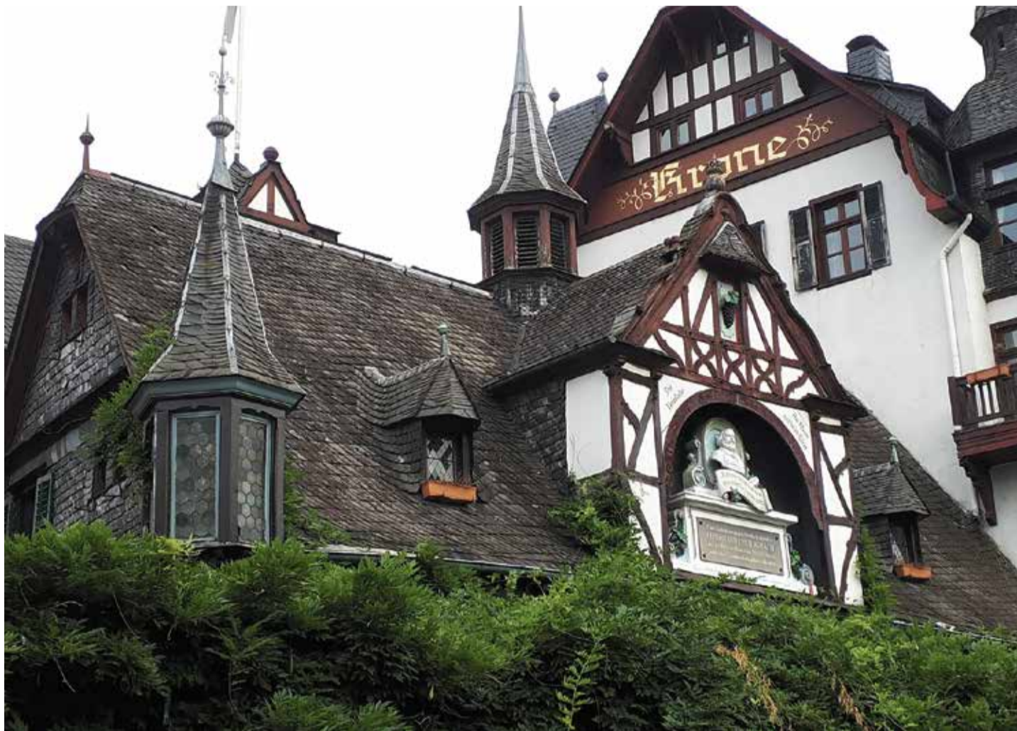
Von wilder Natur erobert: Das pseudoromantische Gebäck des Hotels „Zur Krone“ mit der Freiligrath-Büste

1844 wurde das Hotel schließlich auch zu einem politischen Ort, als der Dichter Ferdinand Freiligrath in der „Krone“ seinen politisch gefärbten Gedichtband „Ein Glaubensbekenntnis“ verfasste. Und das barg für den Autor des Vormärz, der sowieso schon durch seine Forderung nach Pressefreiheit und der Abschaffung der