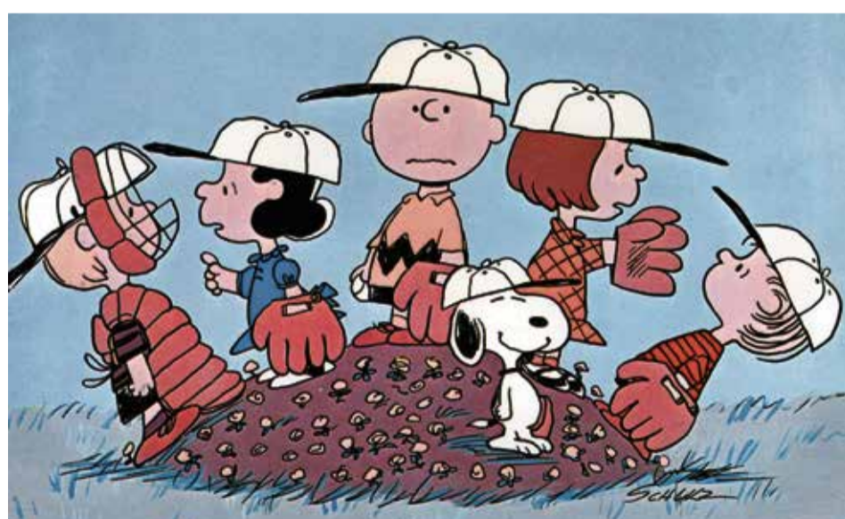
Schroeder, Lucy, Charlie Brown, Peppermint Patty und Linus beim Baseball, dem Sport, bei dem Charlie trotz aller Weisheiten immer verliert. Snoopy hat gut Lachen

Erfunden hat sie einst ihr Schöpfer Charles M. Schulz, ein in den USA im US-Bundesstaat Minnesota geborener Künstler mit deutschen Wurzeln. Denn sein Vater stammte aus Stendal im heutigen Sachsen-Anhalt. Tja, viel Gutes aus den USA stammt nun mal aus „Good old Germany“. Und auch Charles hatte das Glück, Deutschland persönlich kennenzulernen. Nämlich als Soldat war er hier stationiert und machte damals was am liebsten? Richtig, er zeichnete, wann immer sich die Chance dazu bot, beispielsweise auch, wenn er die Feldpost mit lustigen Skizzen und Figuren verzierte. Schulz war eben