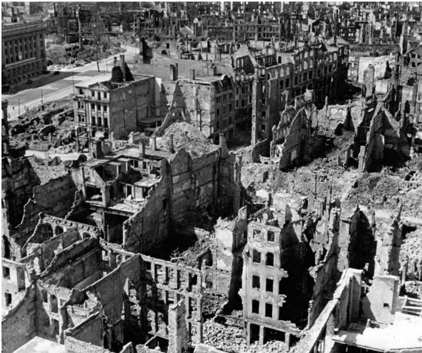
Die Altstadt von Dresden wurde bei Luftangriffen der Alliierten vom 12. bis 15. Februar 1945 fast völlig zerstört. Auch die Kulturdenkmäler der Innenstadt wurden in Schutt und Asche gelegt

Warum also wurde Elbflorenz eingeäschert? Die Antwort verweist auf die Area Bombing Directive vom 14. Februar 1942. Mit Spreng- und Brandbomben auf Wohngebiete wollten der britische Premierminister Winston Churchill und sein Kriegskabinet die Durchhaltevermögen deutscher Zivilisten und in der Konsequenz die Kampfmoral der Wehrmacht brechen. Dass RAF-Oberbefehlshaber Charles Por-