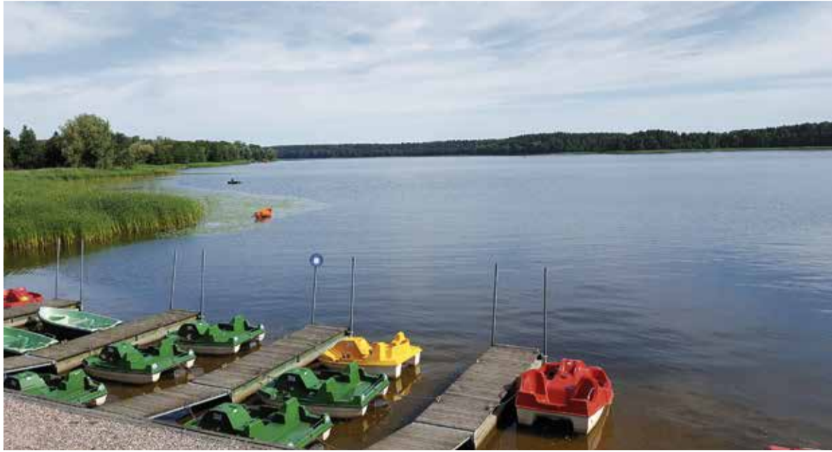
Der Goldaper See: Vom 16. bis zum 23. Juli reist die Kreisgemeinschaft Goldap nach Ostpreußen. Auf dem Programm stehen Danzig, Marienburg, Thorn und das Sommerfest der Kreisgemeinschaft in Goldap

Am 19. Mai geht es vormittags los mit dem Flugzeug nach Danzig; Flüge gehen ab Berlin, Frankfurt, Hamburg, München oder Stuttgart. In Danzig werden die Teilnehmer von der Reiseleitung ins Hotel gebracht. Am Nachmittag wird ein Stadtrundgang durch Danzigs Altstadt unternommen.