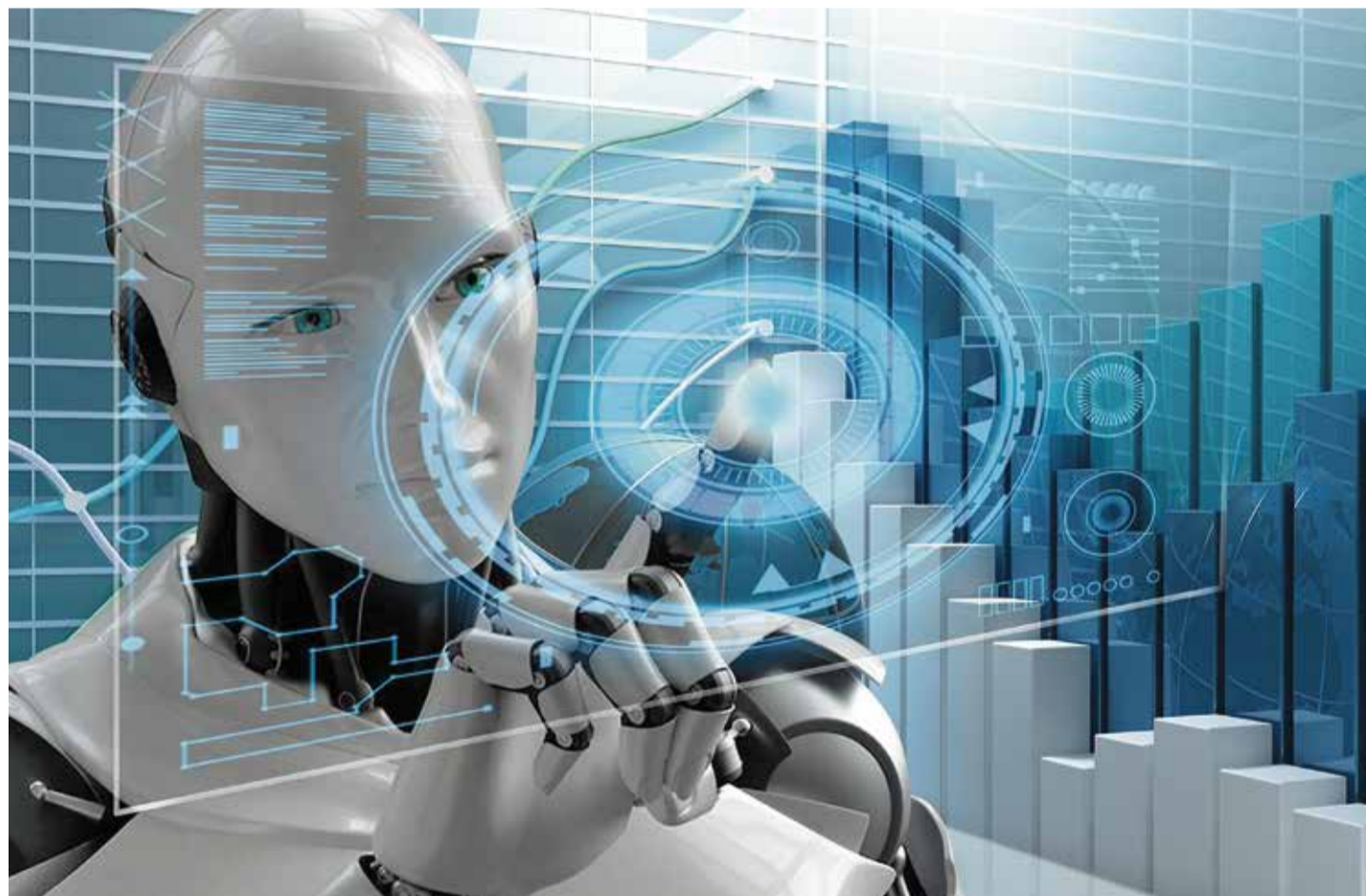
Ex-US-Präsident Biden wusste um die nur geringe Kontrollierbarkeit der KI-Technik und erließ strenge staatliche Beschränkungen, um ein Monstrum im Zaum zu halten – Trump hat diese Limits nun komplett gekippt. Hat er damit das Tor zur Hölle geöffnet?