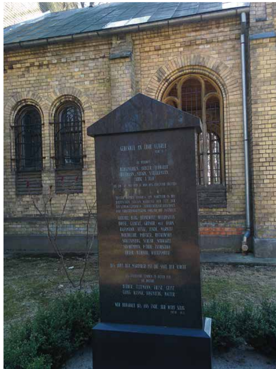
Auf dem Großen Friedhof in Riga: Rigaer Märtyrerstein

Die drei orthodoxen Geistlichen wurden im Jahr 2000 von ihrer Kirche heiliggesprochen. Die Glaubensmartyrer von Dorpat gelten heute als Vorbilder für Ökumene und gelebtes Christentum über die konfessionellen und nationalen Grenzen hinweg.