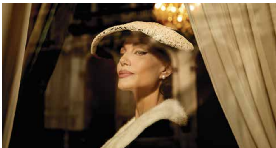
Hochmütiger Blick: Maria Callas (Angelina Jolie) schaut wehmütig auf ihr Leben zurück