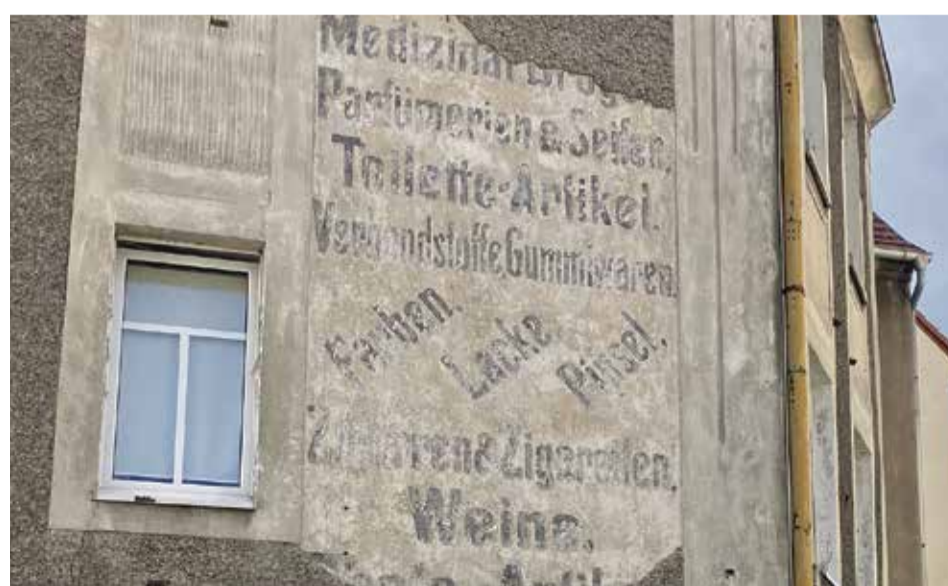
Fremdenführer entdecken immer häufiger die deutsche Vergangenheit unter dem zunehmend bröckelndem Putz

In Stettin gibt es bis heute keine Regelungen, was mit solchen Inschriften geschehen soll, bemängelt die aus Kasachstan stammende Stadtführerin. „Nach 1989 haben wir Polen allmählich begonnen, die Städte anders zu betrachten. Wenn heute auf solche historischen Inschriften hingewiesen wird, weiß die Stadt nicht wirklich, was damit passieren soll. Deshalb ist es so, dass diese an manchen Denkmälern erhalten bleiben, an