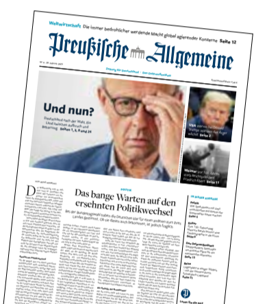
Ausgabe Nr. 9

Leserbriefe an: PAZ-Leserforum, Buchtstraße 4, 22087 Hamburg, Fax (040) 41400850 oder per E-Mail an redaktion@preussische-allgemeine.de