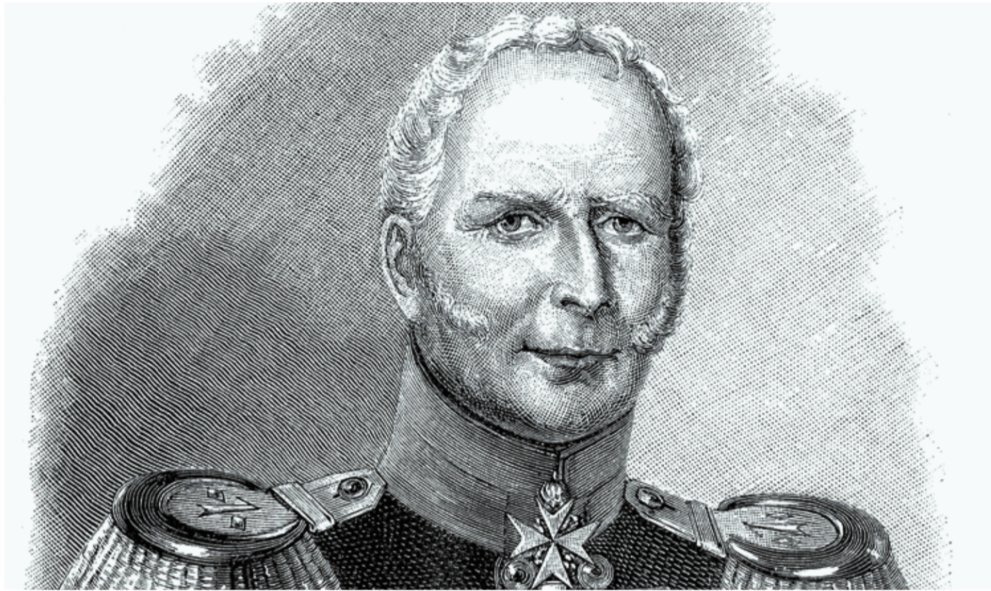
Ludwig Leopold Gottlieb Hermann von Boyen war Generalfeldmarschall in der preußischen Armee und zweimal preußischer Kriegsminister – einmal von 1814 bis 1819 und dann noch einmal von 1841 bis 1847

Daraufhin wechselte Boyen 1812 nach Russland, um dort gegen Napoleon zu agieren. Wenige Monate später überbrachte er Friedrich Wilhelm das Bündnisangebot des Zaren, woraufhin Preußen die Seiten wechselte und seinen Befreiungskrieg begann. In diesem fungierte Boyen zuletzt im Range eines Generalmajors als Stabschef des 3. Armeekorps. Doch damit nicht genug: Nach dem Ersten Pariser Frieden wurde der nunmehrige Träger der höchsten preußischen Tapferkeitsauszeichnung „Pour le Mérite mit