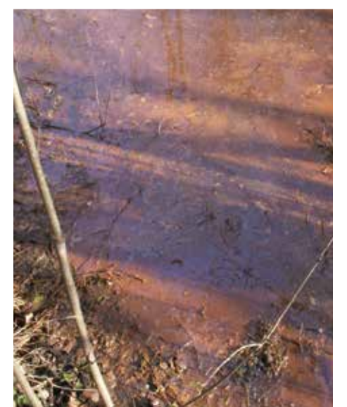
Die rötliche Färbung ist ein klares Zeichen für stark eisenhaltiges, mooriges Gewässer