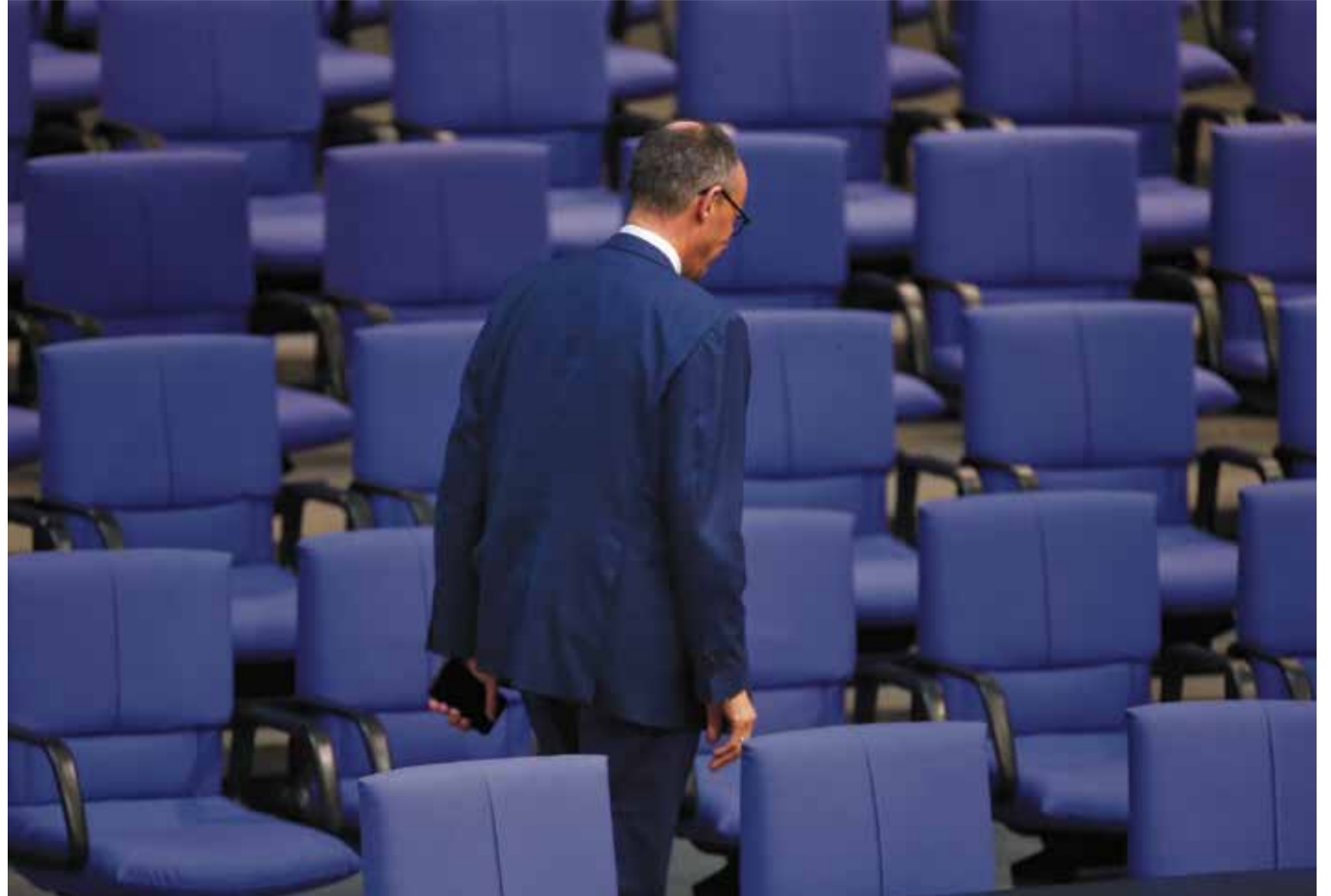
Bereits vor seiner Vereidigung schwer in Erklärungs- und Handlungsnot: Friedrich Merz

Deutschland hat nach Berechnungen des International Institute for Strategic Studies im Jahr 2024 immerhin nach den USA, China und Russland weltweit die vierthöchsten Rüstungsausgaben gehabt. Gemäß der Londoner Denkfabrik hat unser Land 2024 knapp 80 Milliarden Euro für Verteidigung ausgegeben – regulären Haushalt, Ausgaben über das Bundeswehr-Sondervermögen und Militärhilfe für die Ukraine inklusive. Gleichzeitig hat die Bundeswehr aber größte Mühe, eine einsatzfähige Brigade zur dauerhaften Stationierung in Litauen aufzustellen.