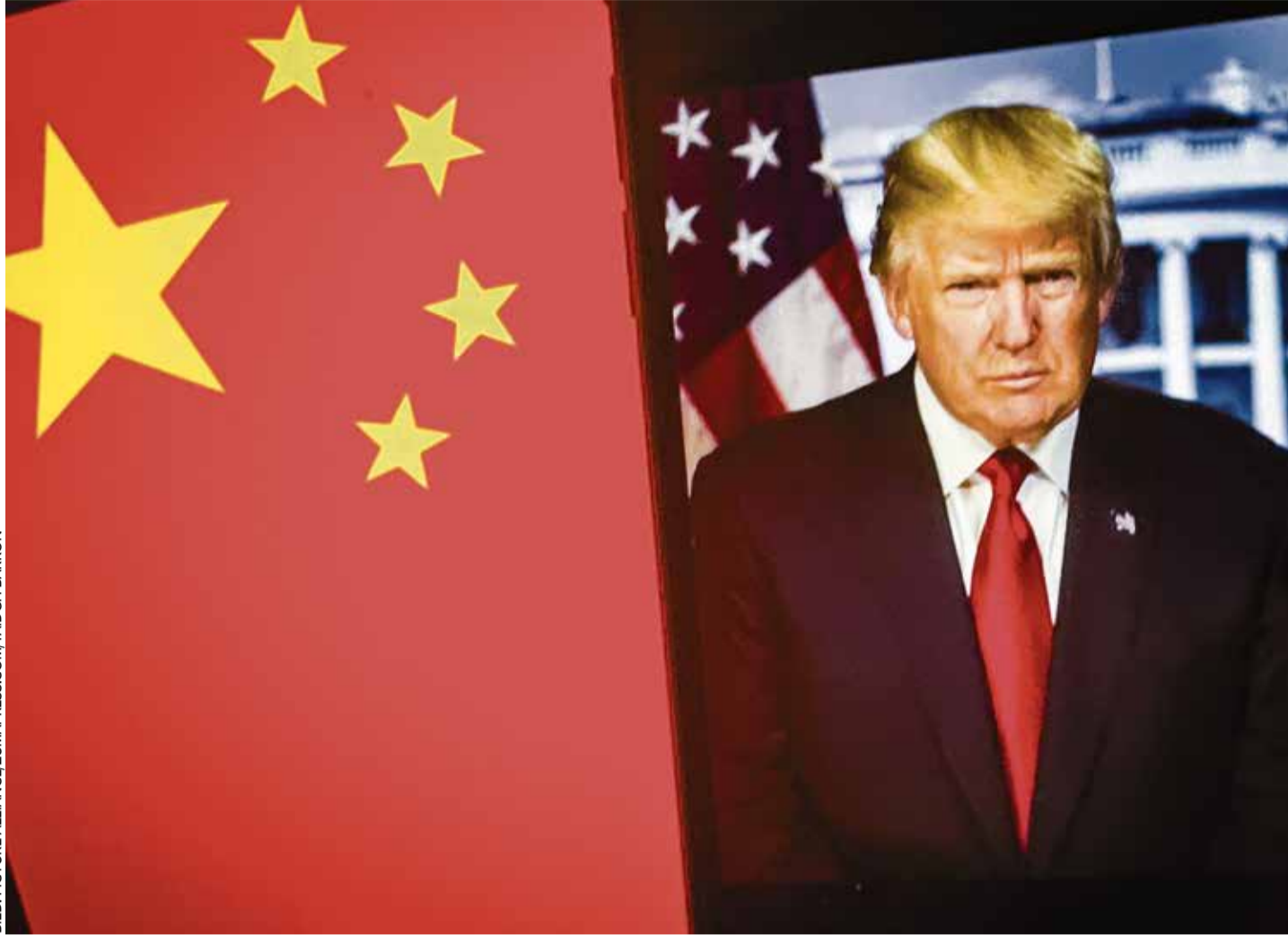
Es ist zu befürchten, dass Trumps ideenlose Zollpolitik erst die US-Bürger selbst und dann die EU-Kunden schmerzlich treffen wird

China reagierte auf Trumps Zollpolitik bisher mit Gegenzöllen in Höhe von zehn bis 15 Prozent auf einige landwirtschaftliche US-Produkte. Kritik fiel noch verhalten aus, denn die Zeit spielt Peking in