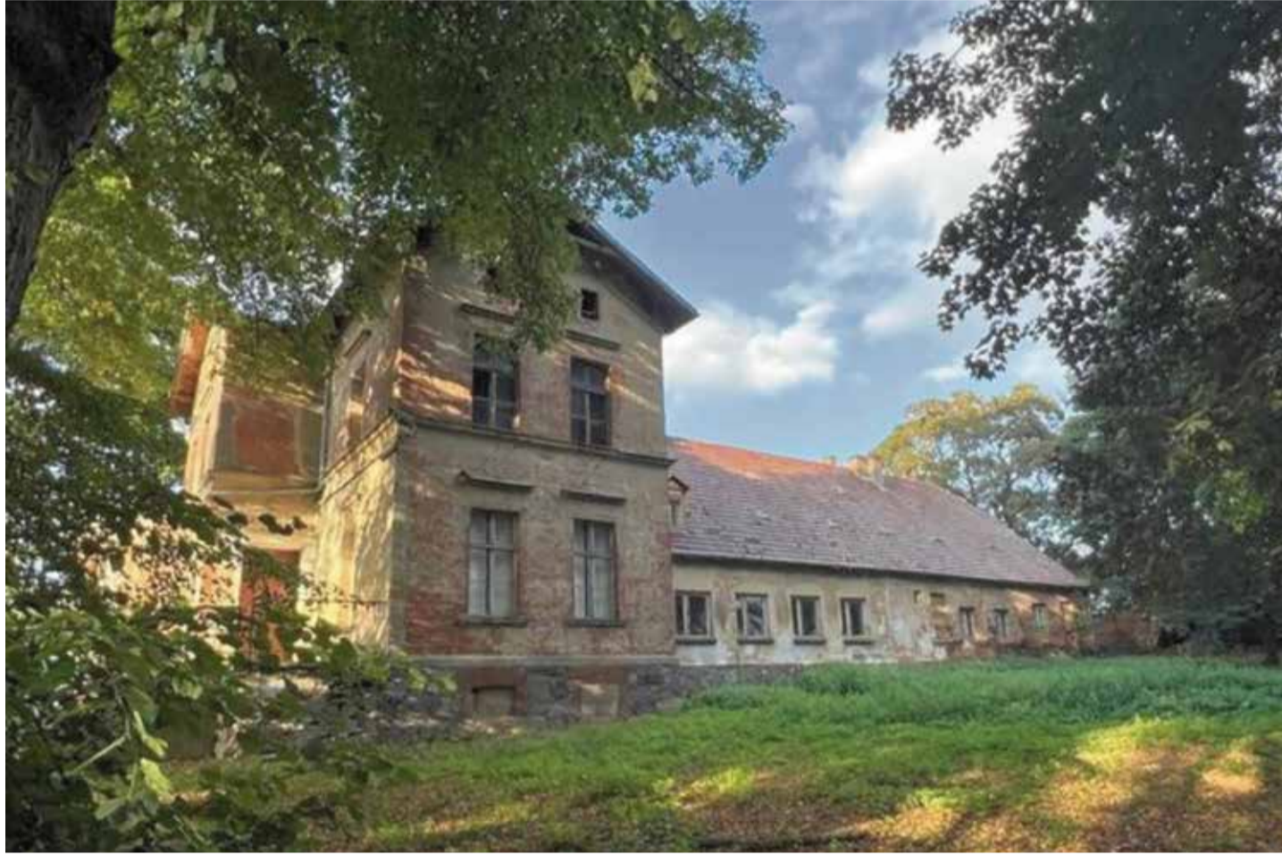
„Schade, dass das Herrenhaus im Verfall begriffen ist“: Bedauern von polnischer Seite über den Zustand der Preußenresidenz

Das Dorf mit derzeit 170 Einwohnern wird in der Literatur auch als Golzow (Schildberg) oder Golzow (Soldin) bezeichnet, denn es gehörte bis 1945 zur Landgemeinde Schildberg im Kreis Soldin. Im Neumärkischen Landbuch von 1337 wird es als „Golenitz“ oder „Goltitz“ und adliges Vorwerk von Schildberg bezeichnet. Als ältere Namensformen erscheinen auch „golste“, „gehoczste“, „Golze“ und „Goltze“. 1365 und 1372 wird das Dorf noch erwähnt, vor 1469 scheint