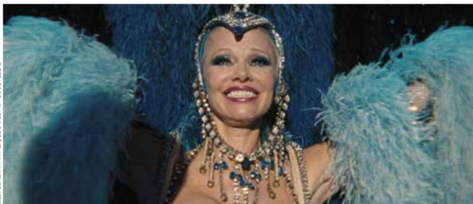
Verbreitet auf der Bühne viel Glamour: Pamela Anderson als Show-Tänzerin Shelly