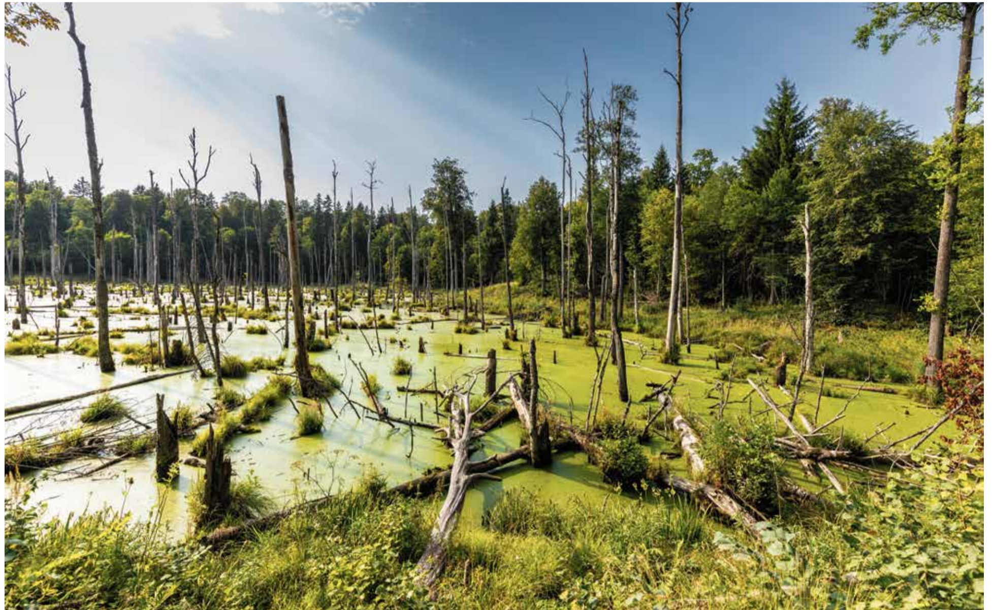
Die Sumpfgelände von Masuren waren reich an Sumpferz und Raseneisenerz

In diesen kleinen masurischen Eisenhütten bediente man sich eines sehr einfachen