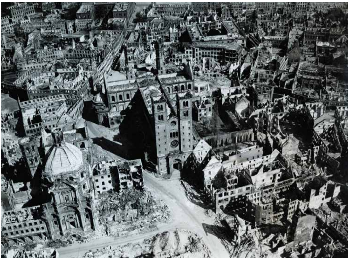
Ein zerstörtes Würzburg: Nach dem Luftangriff vom 16. März 1945 lag die Barockstadt in Trümmern

Die meisten Chemnitzer Bombentoten ruhen in einem Massengrab des Städtischen Friedhofs neben einem DDR-typischen Mahnmahltext: „Zum Gedenken an 4000 Opfer des anglo-amerikanischen Bombenterrors auf Chemnitz am 5. März 1945“. Optischer Höhepunkt ist aber die Frauenfigur mit totem Kind vor einer Sandsteinwand. Eingraviert sind Verse des jüdischen Schriftstellers und Autors