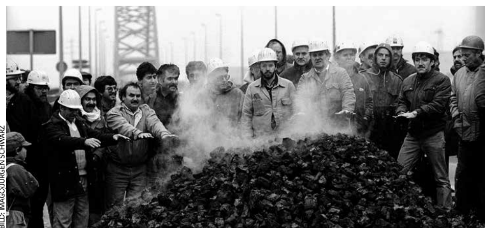
Stunde der Seelsorger: Kruppianer heizen sich 1987 auf der „Brücke der Solidarität“ auf

Was Kirchengemeinden, Kirchenkreis sowie Landeskirche anbelangt, ist es sehr still um den KDA geworden. Selbst im Internet hinterlässt er kaum noch Spuren. Schaut man sich die tagesaktuellen Streitigkeiten bei ThyssenKrupp und die Transformation zu „blauem Stahl“ an, so scheint es, als habe zumindest die evangelische Kirche nichts mehr zu den Verwerfungen im Arbeits- und Wirtschaftsleben zu sagen. Wenn der Kirche LGBTQ-Themen wichtiger sind als die Sorgen der Allgemeinheit, ist es kein Wunder, dass sich die Arbeiterschaft von ihr zunehmend im Stich gelassen fühlt. Andreas Rüdiger