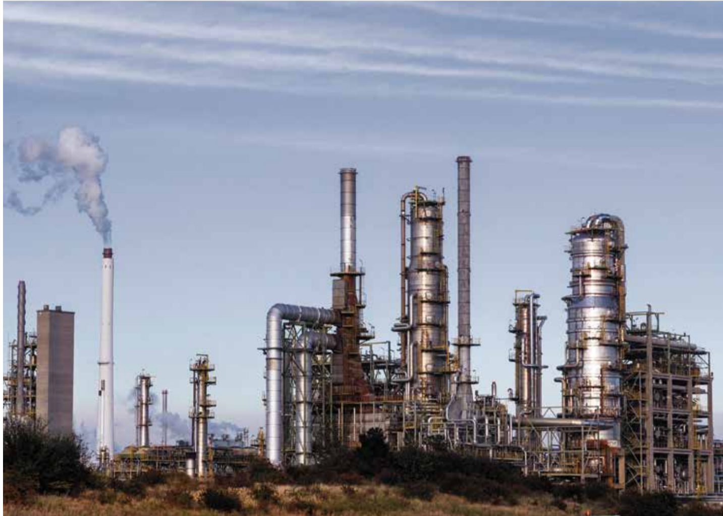
Industrie unter Druck: Total-Raffinerie Mitteldeutschland im Chemiepark Leuna

Zugesagte Fördergelder bleiben aus Erschwert wird die Lage noch durch die weiterhin ungeklärte Frage, wer künftig eigentlich Eigentümer der Raffinerie sein wird. Rosneft Deutschland, der russische Mehrheitseigner, wurde während der Amtszeit von Wirtschaftsminister Robert Habeck (Grüne) unter Treuhandverwaltung des Bundes gestellt. Diese wurde erst kürzlich bis zum 10. September verlängert. Rosneft will zwar seine Anteile verkaufen, allerdings kommen die Verhandlungen nicht voran. Obendrein hat die EU-Kommission Fördergelder des Bundes für den Bau einer Pipeline zum Rostow-