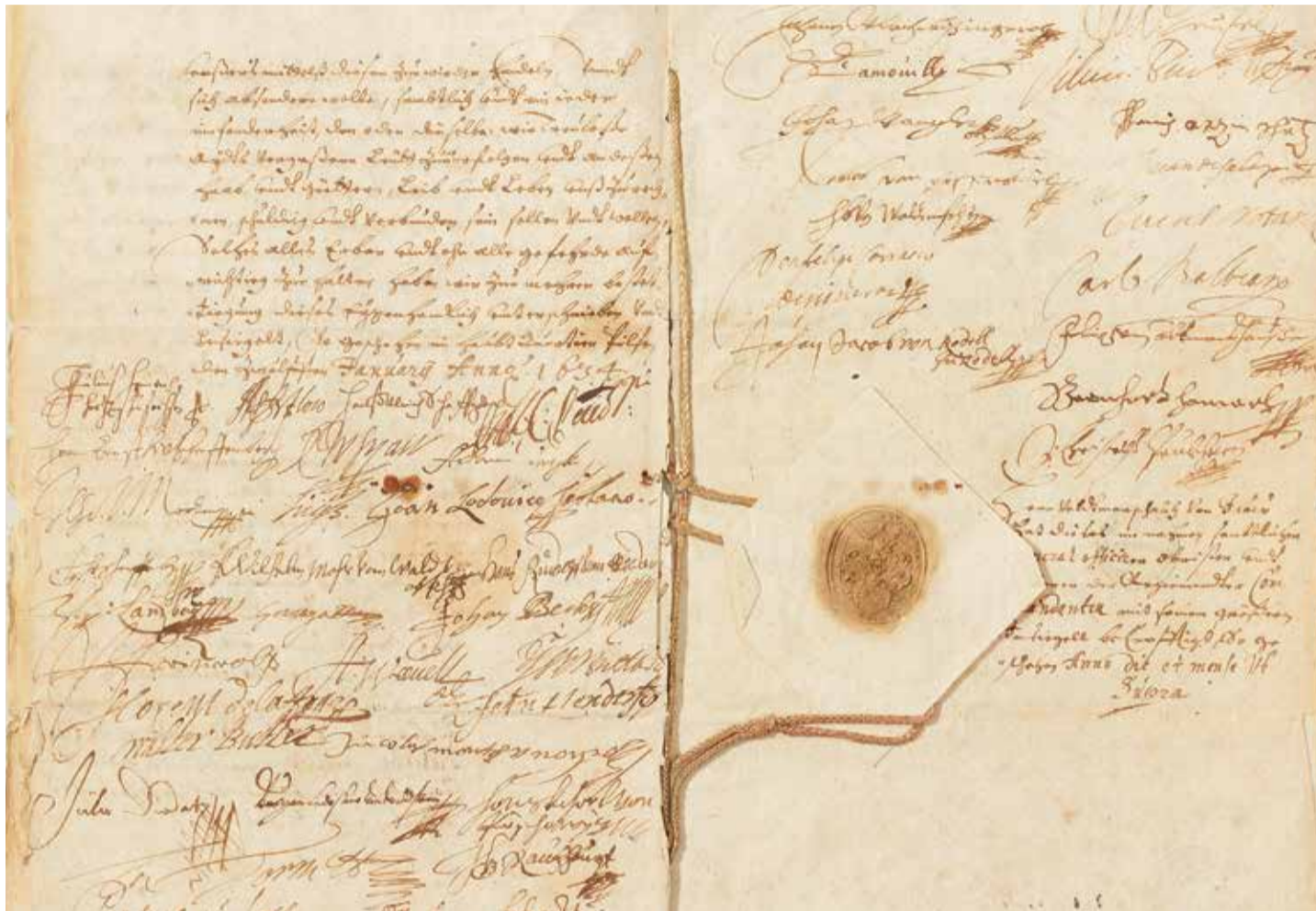
Für die Nachwelt in Berlin gesichert: Urkunde des Feldmarschalls Christian von Ilow mit Ergebnheitsadresse und Treueschwur an Albrecht von Wallenstein samt Unterschriften von 47 kaiserlichen Regimentsinhabern und Offizieren vom 12. Januar 1634

Unter dem Motto „Der Krieg ernährt den Krieg“ blieb den Menschen in den jeweiligen Territorien kaum etwas zum Leben übrig. Der Ruhm des Generalissimus bröckelte, als er sich mit dem Kaiser überwarf und später zu eigenmächtig in puncto Friedensverhandlungen wurde. Wallenstein drohte mit Rücktritt, was den Kaiser nicht schreckte, da er seinen Sohn als Oberbefehlshaber einsetzen wollte, Wallensteins Generäle und Obristen jedoch in Schrecken versetzte. Diese waren von seiner Armeefinanzierung abhängig.