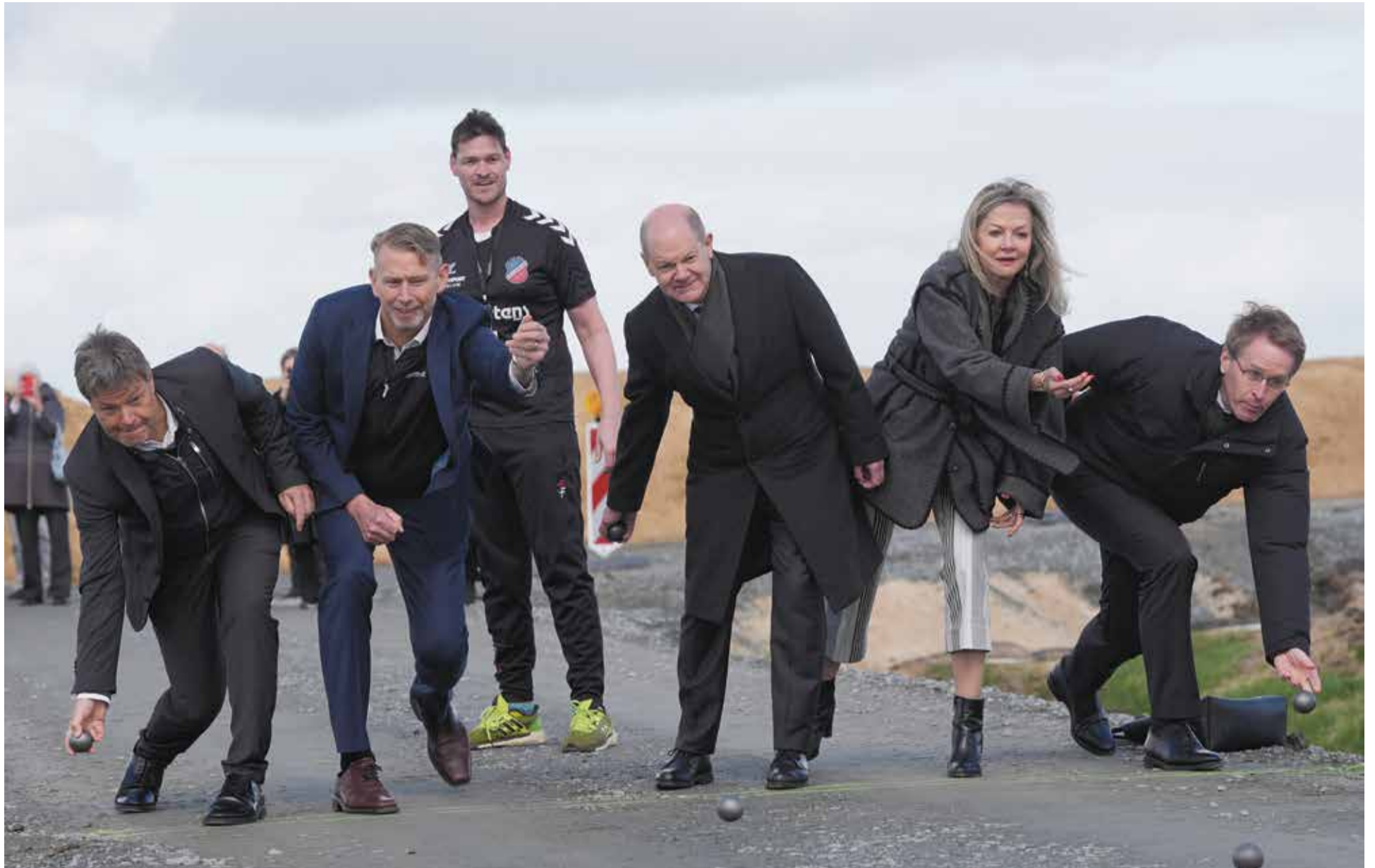
Auftakt 2024: Habeck (l.), Scholz (M.) und Schleswig-Holsteins Ministerpräsident Daniel Günther (r.) beim Northvolt-Baubeginn

Größter Anteilseigner des schwer angeschlagenen Unternehmens ist Volkswagen. Weitere Großinvestoren sind die US-Investmentgesellschaft BlackRock und die US-amerikanische Großbank Goldman Sachs. Als zweitgrößter Investor schrieb Goldman Sachs seine Beteiligung indes bereits ab. BMW als Miteigentümer und Kunde hat schon im August seinen Auftrag für E-Autobatterien im Wert von