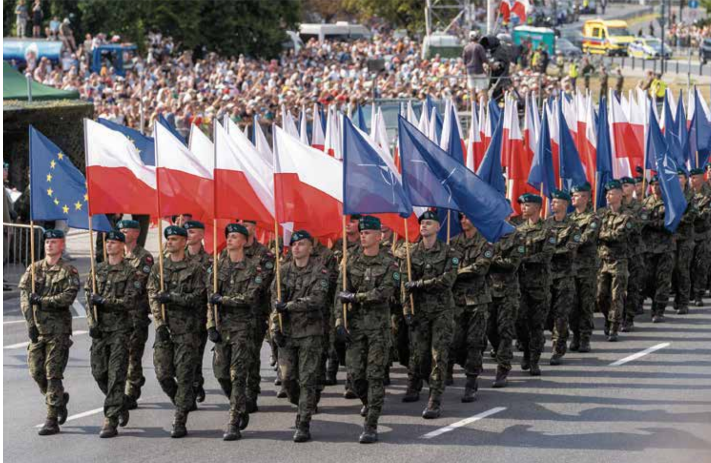
Die polnische Armee wirbt kräftig an und ist jetzt schon die drittgrößte unter den NATO-Staaten

Los Angeles – Die von dem Amazon-Gründer Jeffrey Bezos ins Leben gerufene Stiftung Earth Fund stellt ihre Förderung der Science Based Targets initiative (SBTi) ein. Damit geht der Vereinigung zur Unterstützung von Unternehmen bei der Festlegung und Erreichung von Klimazielen eine ganz zentrale Finanzierungsquelle verloren. Konkret muss die SBTi nun auf die gigantische Summe von zehn Milliarden US-Dollar verzichten. Die Hintergründe von Bezos' Entscheidung sind bislang unklar. Möglicherweise reagierte er damit auf die veränderte politische Landschaft in den USA seit der Wahl des neuen US-Präsidenten Donald Trump. Aber vielleicht spielt auch die gesunkene Glaubwürdigkeit der SBTi und die daraus resultierende Kritik von Mitarbeitern des Earth Fund eine Rolle. Der SBTi wird neuerdings vorgeworfen, Unternehmen ein falsches umweltfreundliches Image zu verschaffen und damit als Wirtschaftslobbyist zu agieren. W.K.