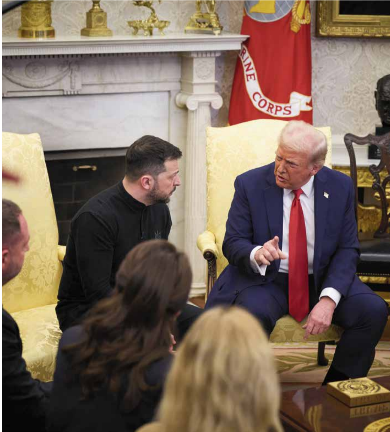
Symbol einer weiteren Zeitenwende: Das Zerwürfnis von US-Präsident Donald Trump und seinem ukrainischen Kollegen Wolodymyr Selenskyj am 28. Februar 2025 im Weißen Haus

Die Vorstellung, Moskau könne durch wirtschaftlichen Druck und militärische Unterstützung der Ukraine zu einem Rückzug bewegt werden, war somit von Beginn an eine Fehlkalkulation. Die Bundesregierung verweigerte sich dieser Realität ebenso wie der designierte Kanzler Friedrich Merz, der trotz offensichtlicher geopolitischer Verschiebungen weiterhin an der Illusion festhält, dass Deutschland mit einer moralisch begründeten Sanktionspolitik entscheidenden Einfluss