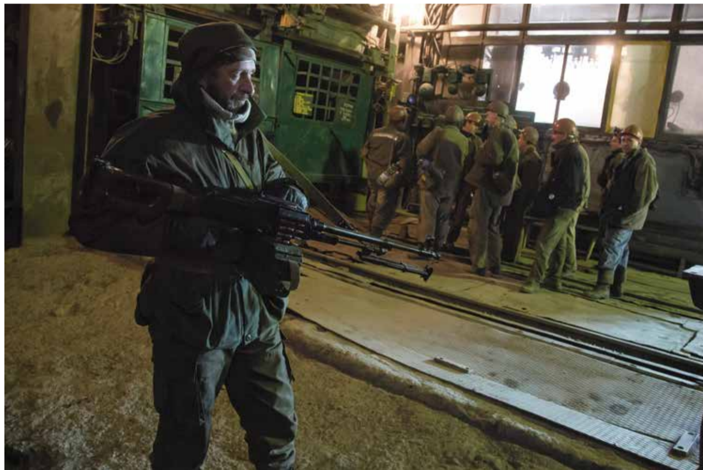
Ein pro-russischer Rebel hält ukrainische Minenarbeiter mit Waffengewalt in Schach, die in der Tscheljuskinzew-Mine von Donetsk in den Lift einsteigen wollen, um unter Tage Rohstoffe abzubauen

Insofern könnte Selenskyj also teilweise geblufft haben, als er in seinem „Siegessplan“ vom Oktober 2024 die natürlichen Ressourcen der Ukraine pries und als Köder anbot. Wenn dem so wäre, dann würden am Ende die USA als die Ge-narten dastehen.