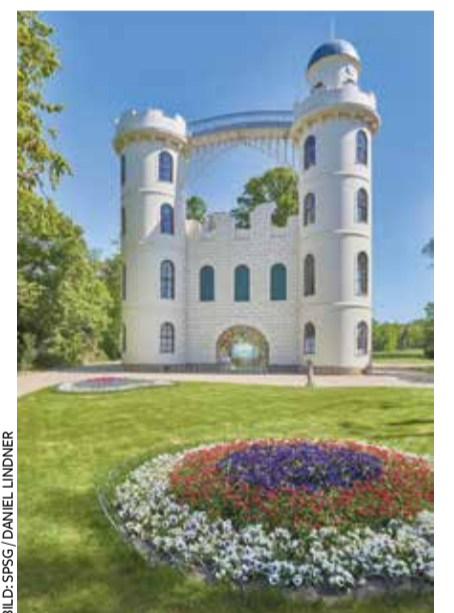
Schloss auf der Pfaueninsel mit dem Wandbild in der unteren Bogennische

Auf diese erste Fassung bezog sich später auch das Wandbild der 1970er Jahre, das von dem Berliner Künstler Thomas Harndt ausgeführt wurde, das im Zuge der jetzigen Sanierung wegen