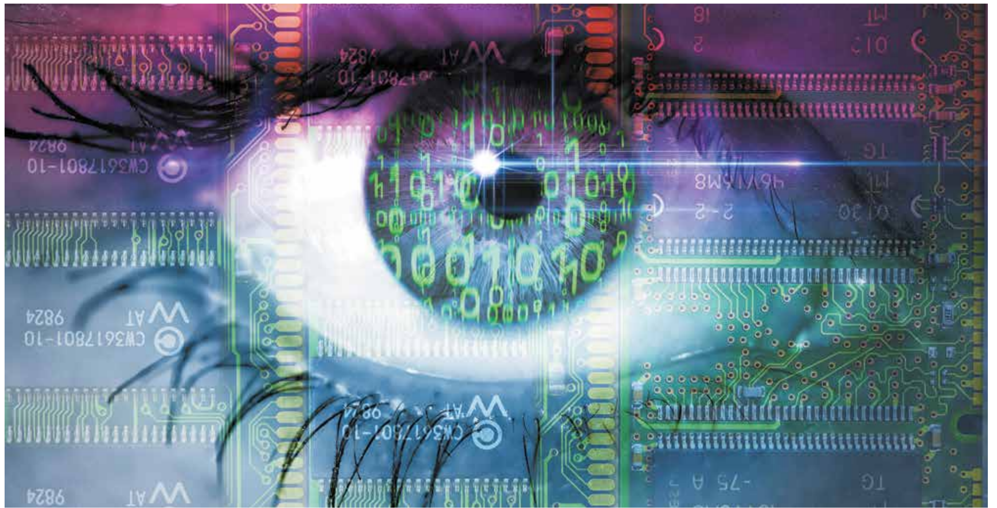
Furcht vor Orwellscher Dystopie: Sind wir auf dem Weg in die totale digitale Kontrolle?

Sind die Pläne der schwarz-roten Koalition ein Angriff auf den Datenschutz und die Privatsphäre der Bundesbürger? Dazu steht im Vertrag: „Das Spannungsverhältnis zwischen sicherheitspolitischen Erfordernissen und datenschutzrechtlichen Vorgaben muss neu austariert werden.“ Wie dieses „Austarieren“ enden könnte, lässt die Dokumentation der Wissenschaftlichen Dienste des Deutschen Bundestages vom Juni 2024 „Zum sogenann-