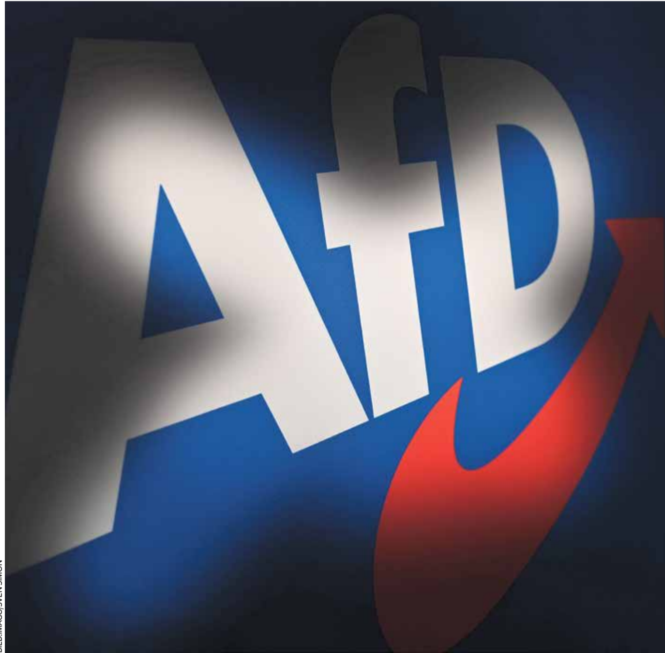
Unter Druck und unter verschärfter Beobachtung des Verfassungsschutzes: Deutschlands größte Oppositionspartei

Also bietet ein Gutachten, in dem sich keine Nachweise für Umsturzpläne der AfD finden, auch keinen ausreichenden Grund dafür, diese Partei zu verbieten. Eben deshalb waren weiterhin alle Politiker mit höheren Regierungspositionen vor der Einleitung eines Verbotsverfahrens. Denn anders als im Fall