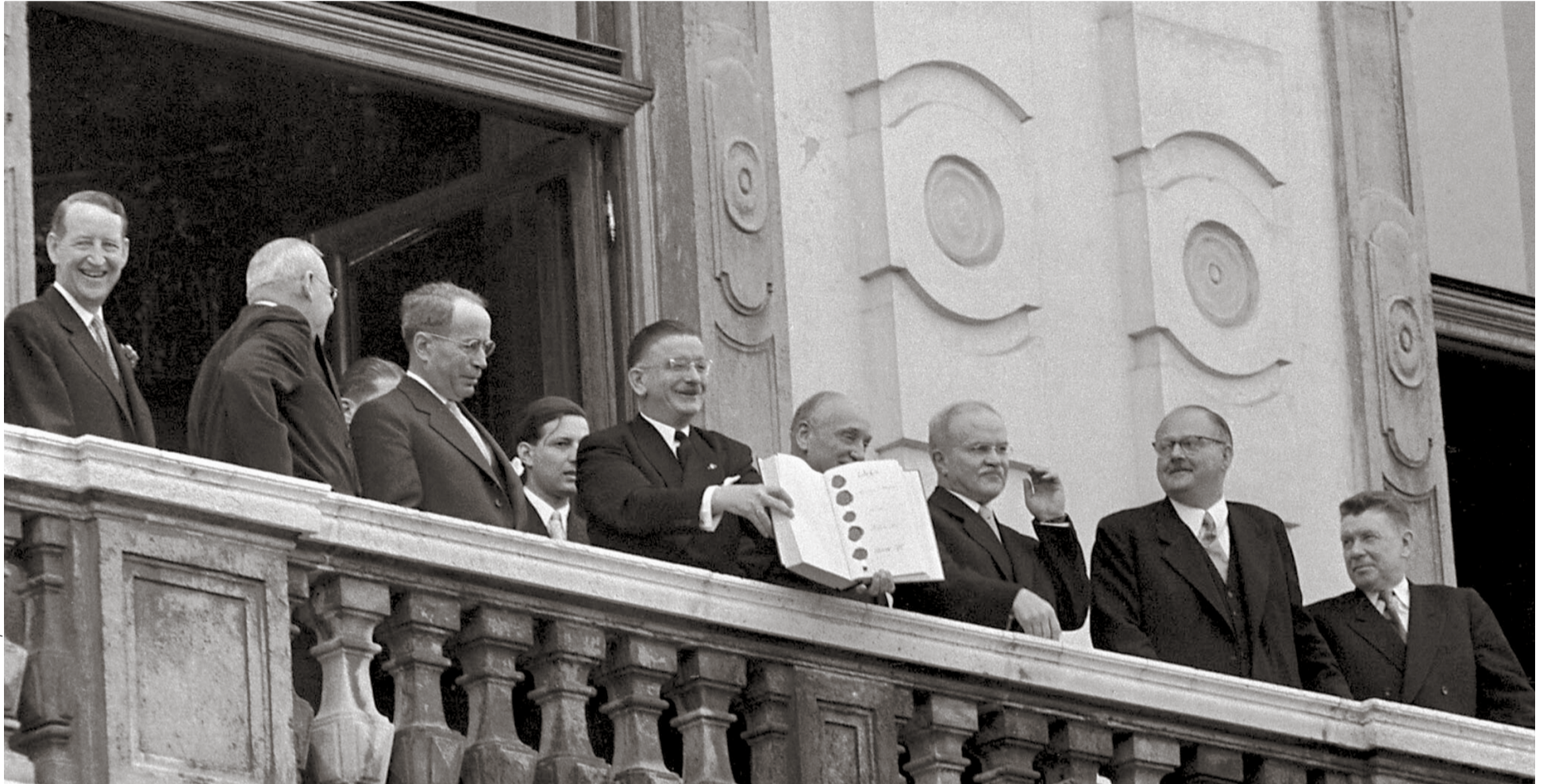
Nach der Unterzeichnung: Österreichs Außenminister Leopold Figl zeigt im Beisein von Vertretern der Alliierten der wartenden Menge den Staatsvertrag

Österreichs Außenpolitik selbst verfolgte verschiedene Ziele, die zum Staatsvertrag führen sollten: die Reklamierung des „Opferstatus“ als Mittel zur Abgrenzung von Deutschland sowie zur austrospezifischen Identitätsbildung – die Rolle von Adolf Hitlers Helfern und Tätern im NS-Apparat wurde ausgeblendet; die Wiedererlangung von staatlicher Unabhängigkeit, der Abzug aller Besatzungstruppen; die Bewahrung der territorialen Integrität, die erst 1949 in Verhandlungen gesichert werden konnte; die Befreiung aus außenpolitischer Isolation, die Reaktivierung des Außenhandels und Allianzfreiheit. Nach positiven Signalen aus Moskau in Form einer Rede von Außenminister Wjatscheslaw Molotow vor dem Obersten Sowjet vom 8. Februar 1955, in der er sich dafür aussprach, die österreichische losgelöst von der deutschen Frage zu behandeln, weilte vom 12. bis 15. April eine Regierungsdelegation unter Bundeskanzler Julius Raab, Vizekanzler Adolf Schärf, Außenminister Leopold Figl