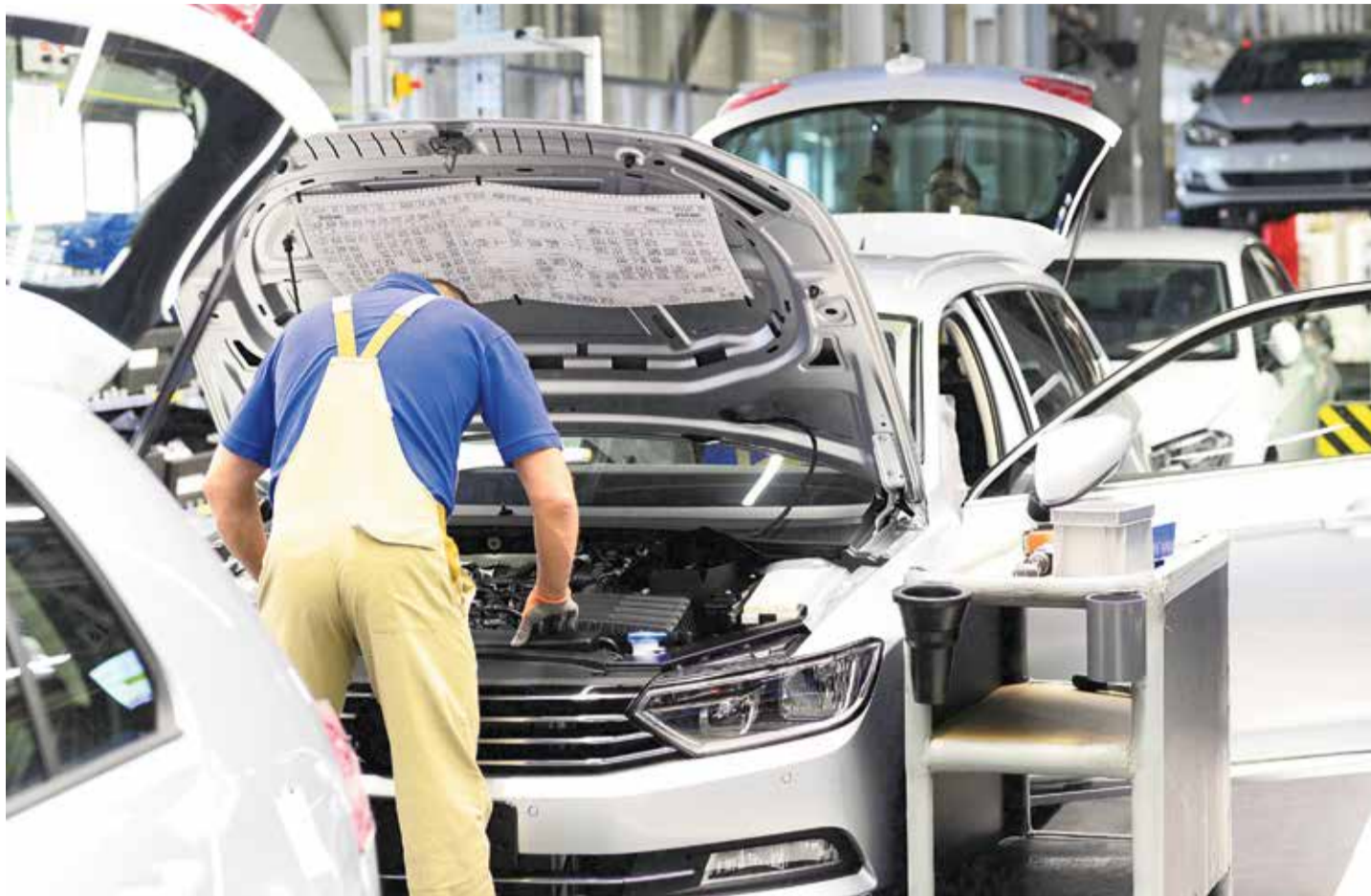
Nicht mehr so sicher wie einst: Arbeitsplatz in der deutschen Automobilindustrie

VW hat bereits beschlossen, Zehntausende Stellen abzubauen. Bis 2030 sollen es mehr als 35.000 werden, so der Kompromiss mit den Gewerkschaften. Ob das reicht, ist angesichts der neuesten Daten des Konzerns fraglich. Audi streicht bis Ende 2029 insgesamt 7500 Stellen in Deutschland. Sport- und Geländewagen-