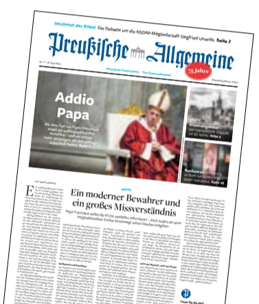
Ausgabe Nr. 17

Katrin Bieglin, Freiburg zur Jubiläumsausgabe: 75 Jahre Zeitung für Deutschland (Nr. 15)