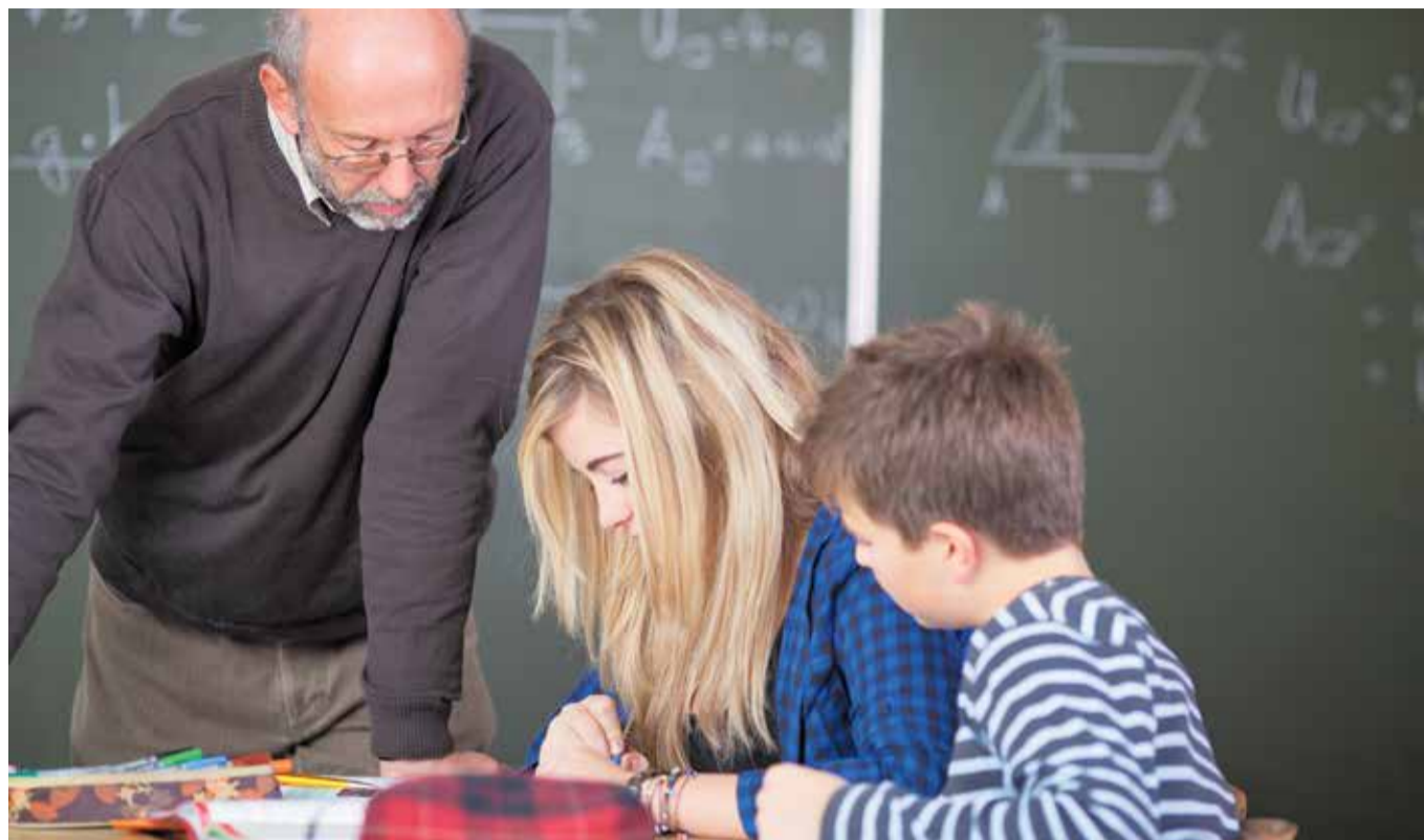
Missachtetes Fundament eines maroden Bildungssystems: Der Lehrer

Landsmannschaft Ostpreußen: www.ostpreussen.de Bundesgeschäftsstelle: info@ostpreussen.de