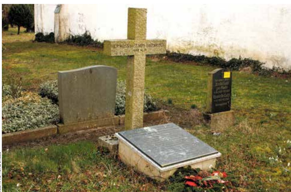
Auf dem Kirchhof von Alt-Teterin: Dieses bescheidene Denkmal erinnert an die Tragödie, die kurz vor Kriegsende in dem kleinen vorpommerschen Dorf geschah

Auf dem Kirchhof von Alt-Teterin erinnert seit 2009 ein bescheidenes Kreuz und eine Namensplatte an die erschütternden Geschehnisse kurz vor Kriegsende. Karl-Heinz Engel