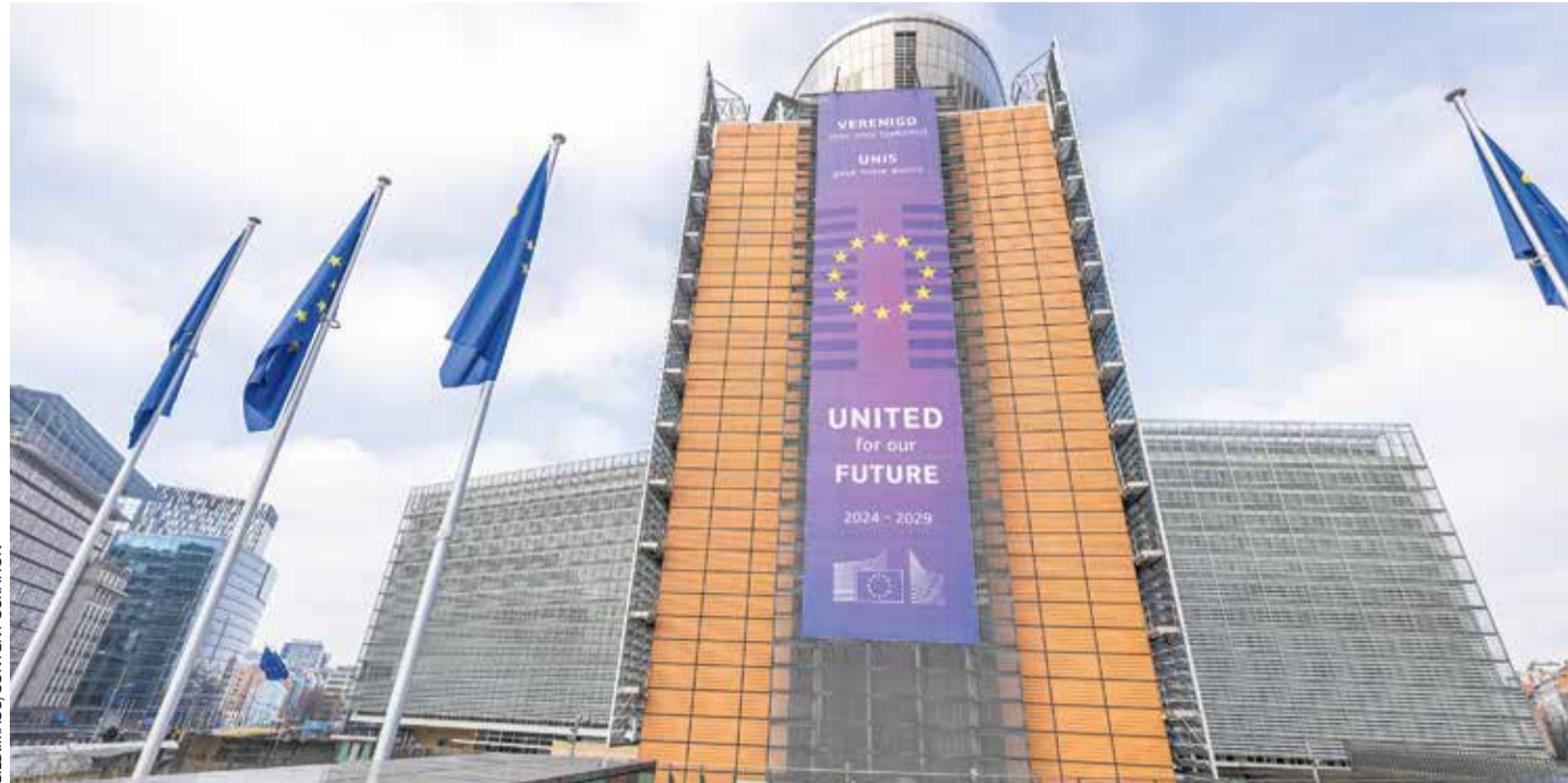
Goldene Zukunft für Nichtregierungsorganisationen: Der Sitz der Europäischen Kommission in Brüssel

Moskau – Russland und Usbekistan wollen in diesem Jahr mit dem Bau einer 573 Kilometer langen Eisenbahnlinie durch Afghanistan beginnen. Über diese sollen jährlich bis zu 20 Millionen Tonnen Fracht befördert werden. Die Bauarbeiten sollen fünf Jahre dauern, die Kosten werden von usbekischen Spezialisten auf knapp fünf Milliarden US-Dollar geschätzt, ihre pakistanischen Kollegen gehen von einem höheren Finanzierungsbedarf von etwa acht Milliarden US-Dollar aus. Die neue Eisenbahnlinie soll einen Transportkorridor schaffen, der die Europäische Union und Russland über Usbekistan, Afghanistan und Pakistan mit Indien und Südostasien verbindet. MRK