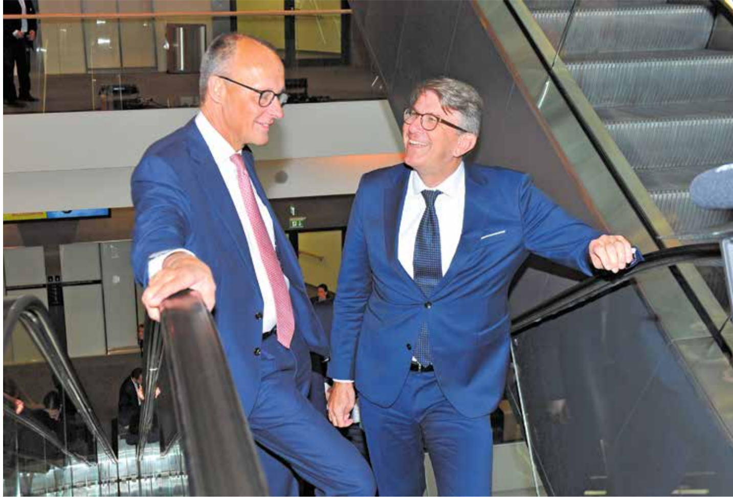
Der CDU-Bundesvorsitzende mit seiner Wahl: Friedrich Merz und Wolfram Weimer (r.)

Brüssel – André Denk soll Generaldirektor der Europäischen Verteidigungsagentur (EDA) werden. Bislang war der Brigadegeneral der Bundeswehr als stellvertretender Generaldirektor die Nummer 2 in der 2004 gegründeten EU-Verteidigungsagentur. Generaldirektoren der EDA waren bislang ausnahmslos Politiker oder Diplomaten. Nach Einschätzung des Onlinemediums „Euractiv“ könnten sich mit dem Deutschen an der Spitze der EDA deren Beziehungen zu Berlin verbessern. Deutschland hat die zunehmende Übertragung der Kontrolle über militärische Angelegenheiten an die EDA bislang mit Skepsis verfolgt. In letzter Zeit hat es entweder wie bei der European Sky Shield Initiative auf eine Führungsrolle gesetzt oder aber sich wie bei der jüngsten Entscheidung für ein eigenes Satellitensystem für die Bundeswehr für eigenständige Lösungen entschieden. H.M.