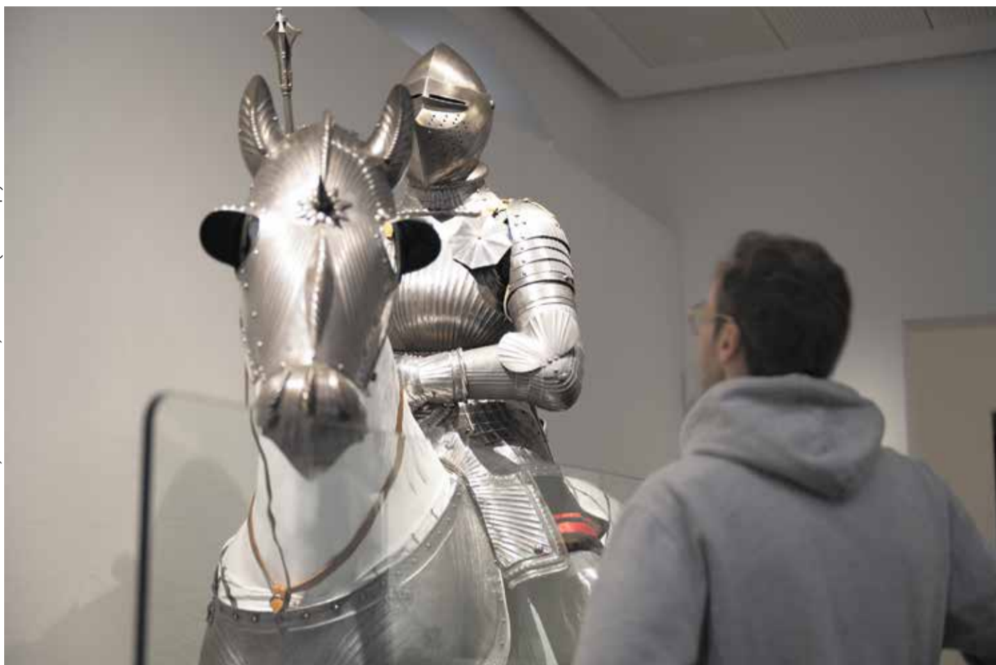
Gut gepanzert: Die Ausstellung „Uffrur!“ stellt den Bauernkrieg lebensnah nach

Die Zwölf Artikel präsentierten die Aufständischen dem Schwäbischen Bund, dem etwa 50 weltliche und geistliche Herrschaften sowie Städte angehörten. Weil der Schwäbische Bund keine Bereitschaft zeigte, auf die Forderungen der Bauern einzugehen, gingen diese an, Schlösser und Klöster zu plündern und zu verwüsten. Über diese und die folgenden Geschehnisse unterrichtet uns die Chronik des Klosters Weißenau aus der Sicht des Abtes Jakob Murer in Wort und Bild. Die elf skizzenhaften und detailreichen Zeichnungen zeigen zum Beispiel Abt Murers Flucht in die Reichsstadt Ravens-