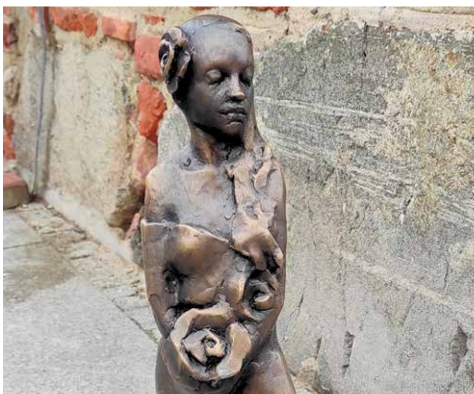
In Allenstein: Eine der neuen Märchenfiguren

Die Figuren sind Teil des Projekts „Auf den Spuren von Märchen und Legenden aus Ermland und Masuren“, das im Rahmen des Allensteiner Bürgerhaushalts 2024 umgesetzt wird. Ziel ist es, den städtischen Raum zu beleben und ein Stück Magie aus dem lokalen Volksglauben in den Alltag zu bringen. Insgesamt sollen 15 Skulpturen in der Stadt aufgestellt werden, von denen jede eine Figur aus den