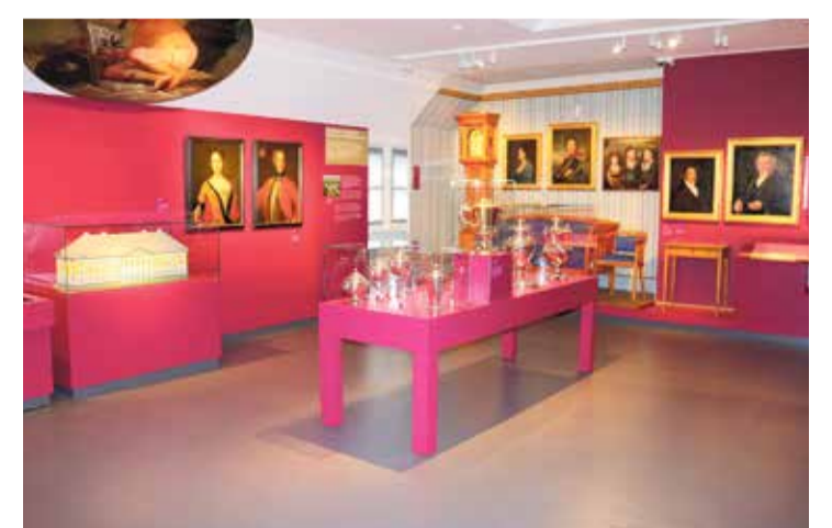
2018 eröffnet: Deutschbaltische Abteilung im Ostpreußischen Landesmuseum

Ostpreußisches Landesmuseum mit Deutschbaltischer Abteilung Heiligengeiststraße 38, 21335 Lüneburg, Internet: www.ostpreussisches-landesmuseum.de