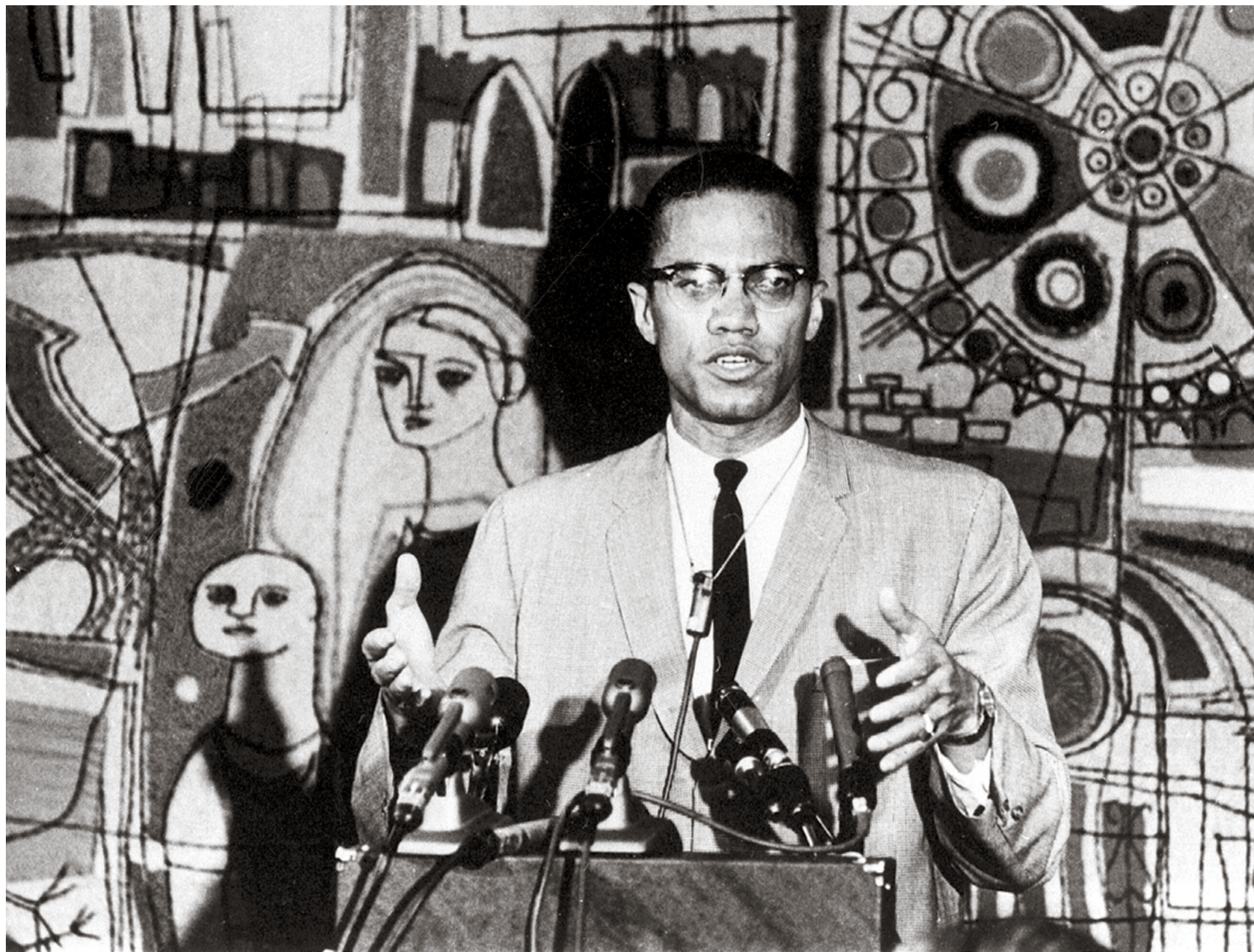
Seine beeindruckende Rhetorik machte ihn zu einem der prominentesten Sprecher der Nation of Islam: Malcolm X auf einer Pressekonferenz im März 1964