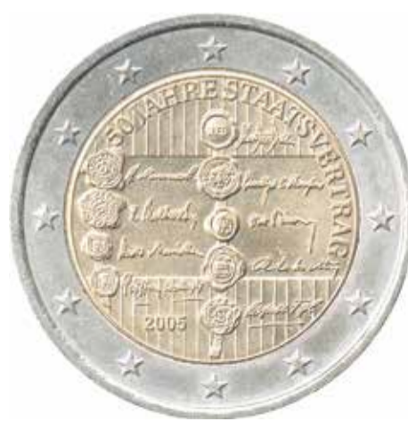
Motivseite der 2-Euro-Gedenkmünze „50. Jahrestag des Österreichischen Staatsvertrages“ aus dem Jahr 2005 mit den Siegeln und Unterschriften der Außenminister der Alliierten Siegermächte und der Hochkommissare der vier Besatzungszonen sowie des Außenministers Österreichs