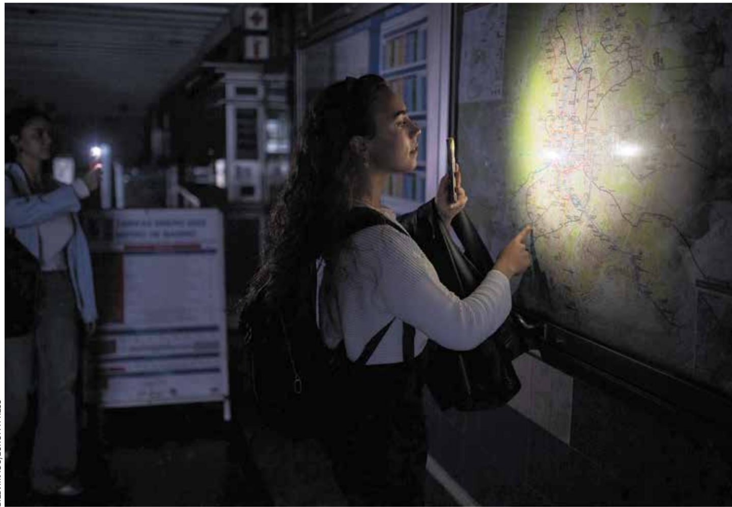
Smartphone-Licht im Dunkeln: Eine junge Madrilenin verschafft sich beim Blackout auf eigene Weise Orientierung

Ebenso ignorant wie die spanischen Behörden agiert jetzt die deutsche Bundesnetzagentur, welche angesichts des iberischen Blackouts, der um ein Haar ganz Kontinentaleuropa erfasst hätte, abwiegelt: „Die Stromversorgung in Deutschland ist stabil“, weil redundant angelegt. Diese Redundanz schwindet allerdings mit jedem konventionellen Kraftwerk, das hierzulande außer Betrieb geht. Das allerdings verschweigen die Mainstream-Medien, welche die Aussagen der Bundesnetzagentur verbreiten.