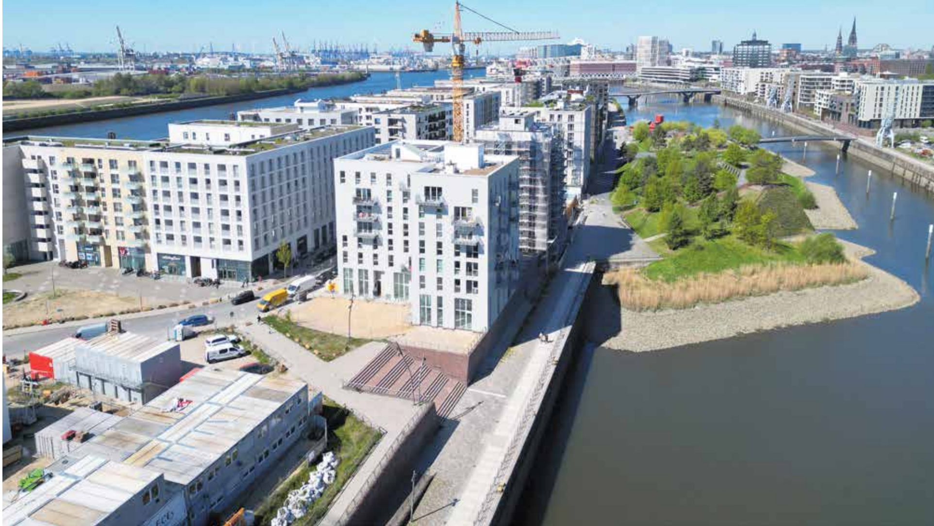
Kaum noch Platz für einen Gedenkort: Der für Wohn- und Gewerbeflächen neu erschlossene Hamburger Baakenhafen in der HafenCity

Hamburg sucht in seiner HafenCity nach einen Gedenkort an die deutsche Kolonialvergangenheit