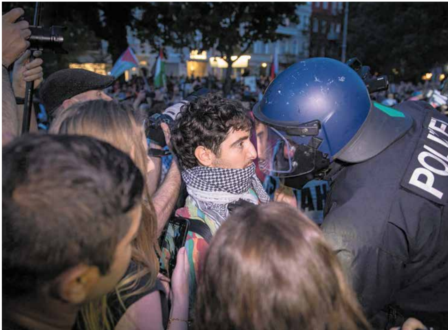
Parolen gegen Israel: Polizist spricht am 1. Mai Demonstranten in Berlin an

Bereits im vergangenen Jahr hatte sich am 1. Mai ein propalästinensischer Block unter die DGB-Demo gemischt. Im ge-