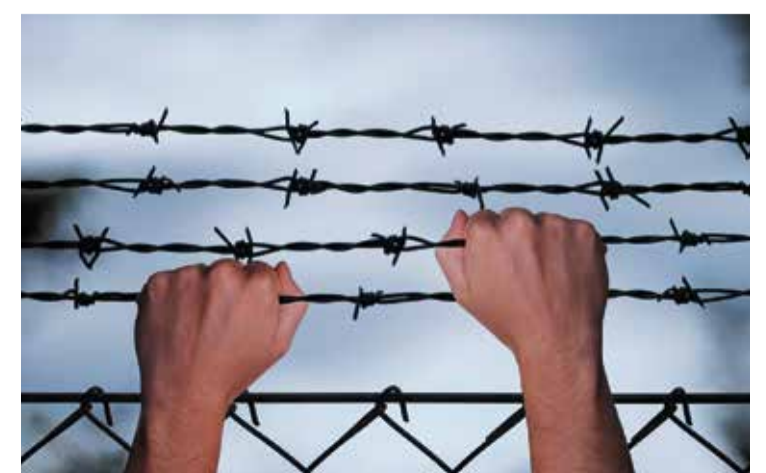
Dänisches Flüchtlingsmuseum Oksbøl