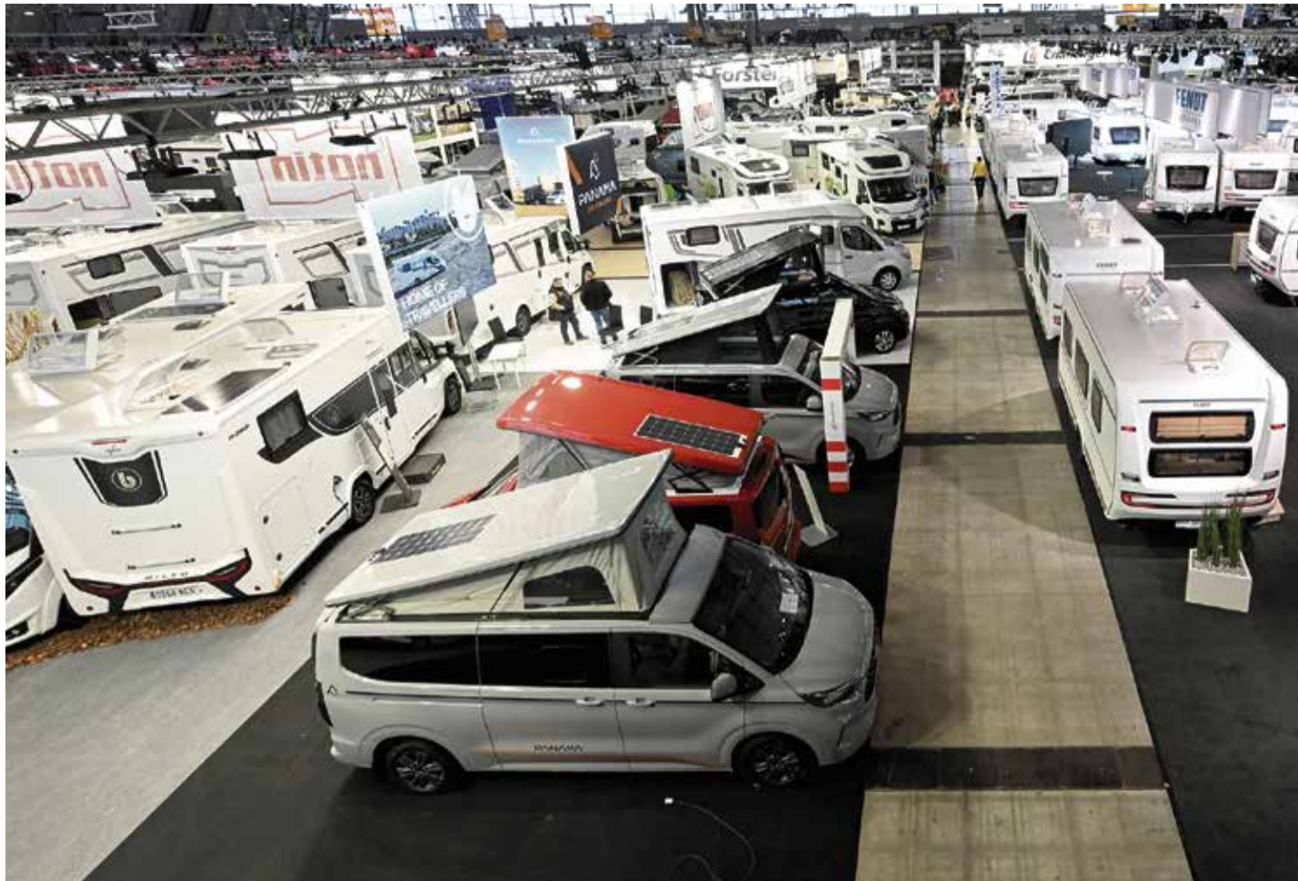
Überangebot an Reisemobilen: Diesjährige Caravan Motor Touristik Messe CMT in Stuttgart

Klinke Caravaning im niedersächsischen Loxstedt stellt zum 30. Juni seinen Betrieb ein, Camper Base, Caravaning Schneider in Heidelberg, Caravaning Henschel in Aalen, Bayern-Camper GmbH in Wurmansquick, Auto & Frei-