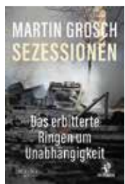
Martin Grosch: „Sezessionen. Das erbiterte Ringen um Unabhängigkeit“, Lau-Verlag, Reinbek 2024, broschiert, 348 Seiten, 28 Euro

Und schließlich kommen die aktuellen, hochproblematischen Sezessionsbewegungen zur Sprache, wie es sie nicht zuletzt in Südtirol, Katalonien, dem Baskenland, auf Korsika, in Schottland, der belgischen Region Flandern, den Kurdengebieten der Türkei, Syriens, des Iraks und des Irans sowie in Zentralafrika gibt.