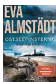
Eva Almstädt: „Ostseefinsternis“, Lübbe Verlag, Köln 2024, Taschenbuch, 397 Seiten, 12,99 Euro

Eva Almstädt's Roman „Ostseefinsternis“ ist spannend, aber zu langsam. Die Verwandtschaftsverhältnisse werden klarer durch den Stammbaum im Bucheinband. Die Personen und Geschehnisse werden stimmig und realistisch beschrieben. Der vorliegende Band ist der 19. Fall der Korittki-Reihe. Angela Selke