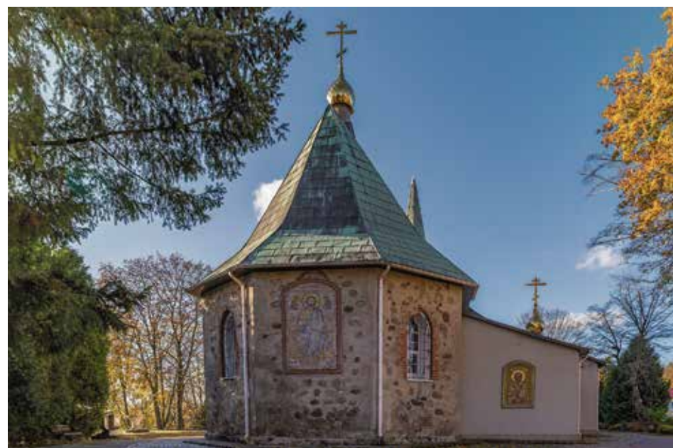
Gilt als „Mutter der Kirchen von Königsberg“: Juditter Kirche