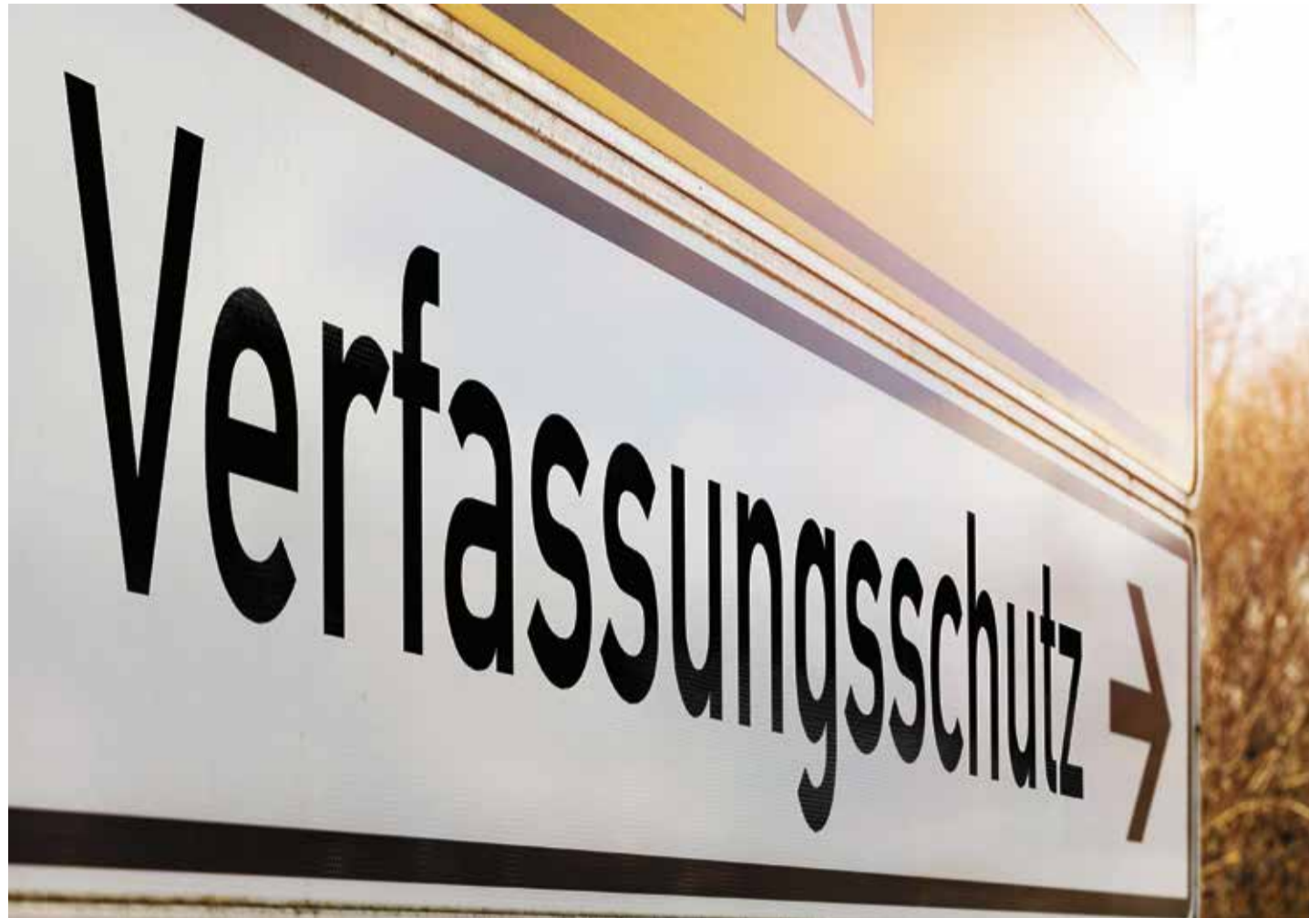
Leitung und Ausrichtung des Brandenburger Verfassungsschutzes sind derzeit ungewiss