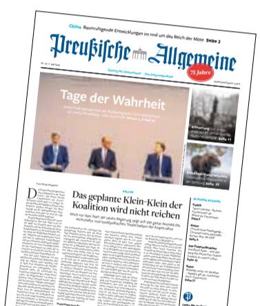
Ausgabe Nr. 18