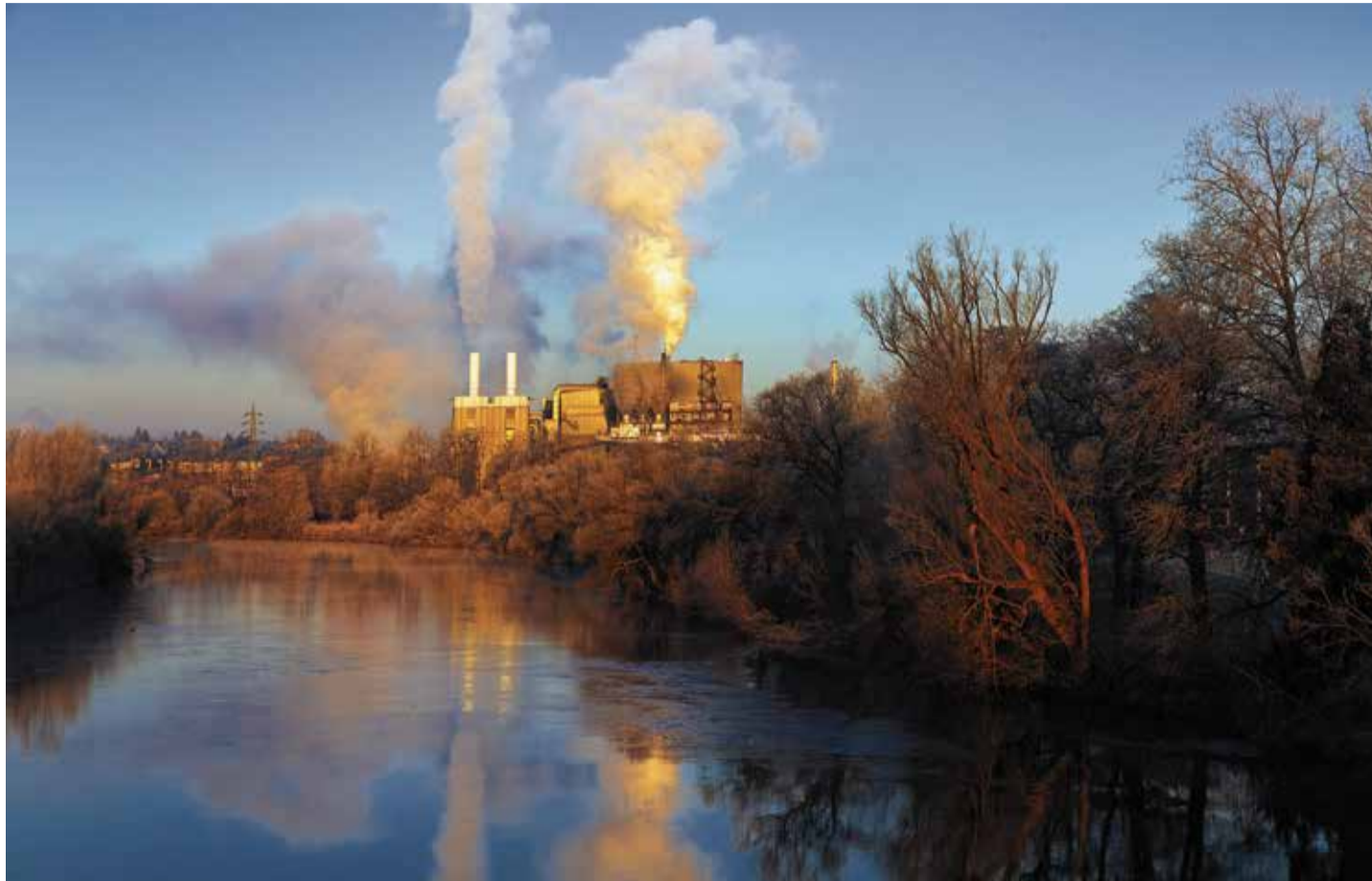
Natur und Industrie geben sich in Westfalen die Hand: Die Deutschen Edelstahlwerke an der Ruhr bei Witten

Bereits 777 hielt Karl den ersten Reichstag ab – in Paderborn. Hier gründete er eine Pfalz, baute eine Kirche, errichtete ein Bistum, setzte einen Bischof ein und traf sich Jahre später mit Papst Leo III. Als Vorposten im Eroberungsgebiet wurde Paderborn zum strategisch wichtigen Standort für den späteren Kaiser.