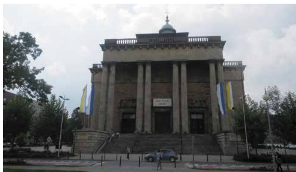
Oberschlesisches Pantheon in den Katakomben der Kattowitzer Christkönigskathedrale zeigt amputierte Geschichte