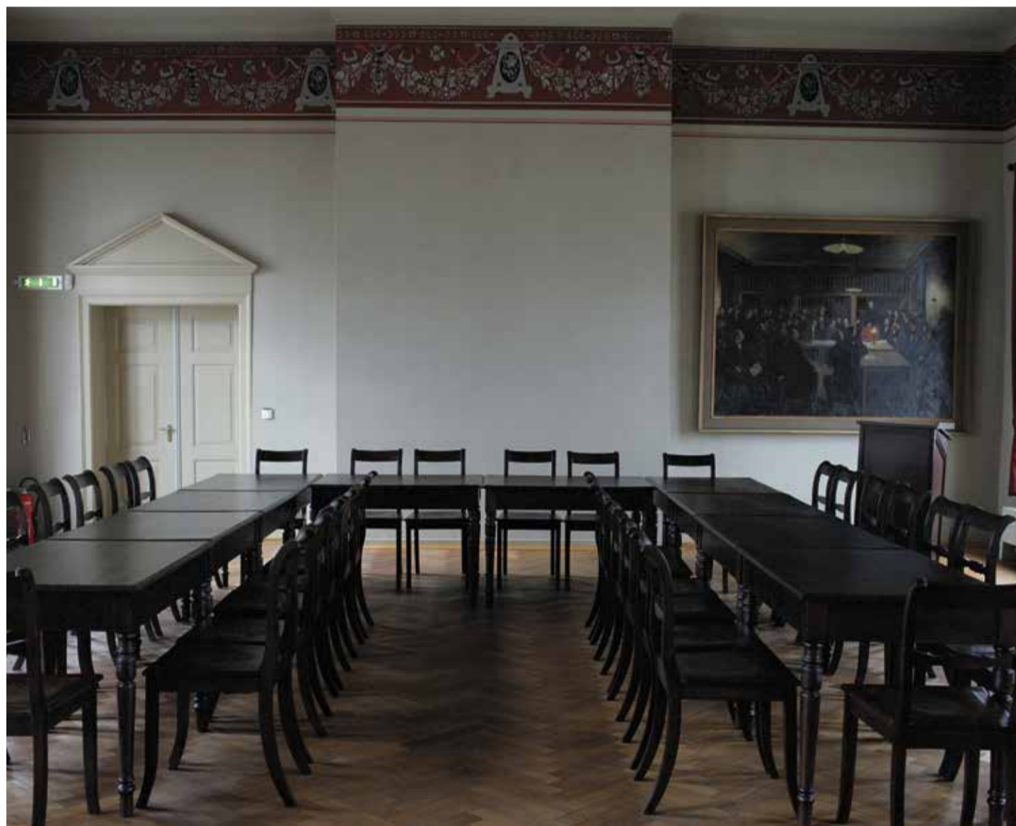
Gründungsstätte der deutschen Sozialdemokratie: Versammlungssaal der damaligen Gaststätte Tivoli