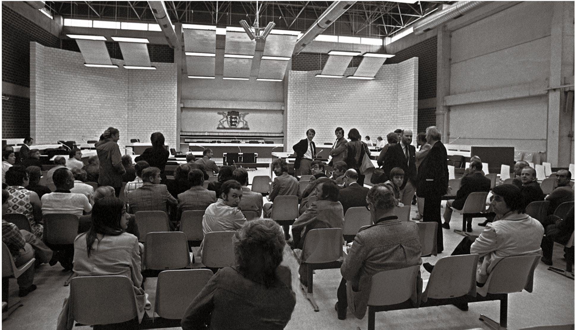
Beim Stammheim-Prozess wurde aus dem Vollen geschöpft: Als Gerichtssaal wurde ein extra für den Prozess auf dem Gelände der Justizvollzugsanstalt Stuttgart errichtetes fensterloses Mehrzweckgebäude genutzt

Die Benesch-Dekrete gelten bis heute. Im tschechischen Präsidentschaftswahlkampf 2013 sagte der konservative Kandidat Karl Schwarzenberg: „Die Vertreibung war eine schwere Verletzung der Menschenrechte. An heutigen Maßstäben gemessen, würde sich die Regierung, einschließlich Präsident Benesch, wahrscheinlich in Den Haag befinden.“ Mit solchen Worten wurde der Fürst kein Präsident mehr. Bodo Bost