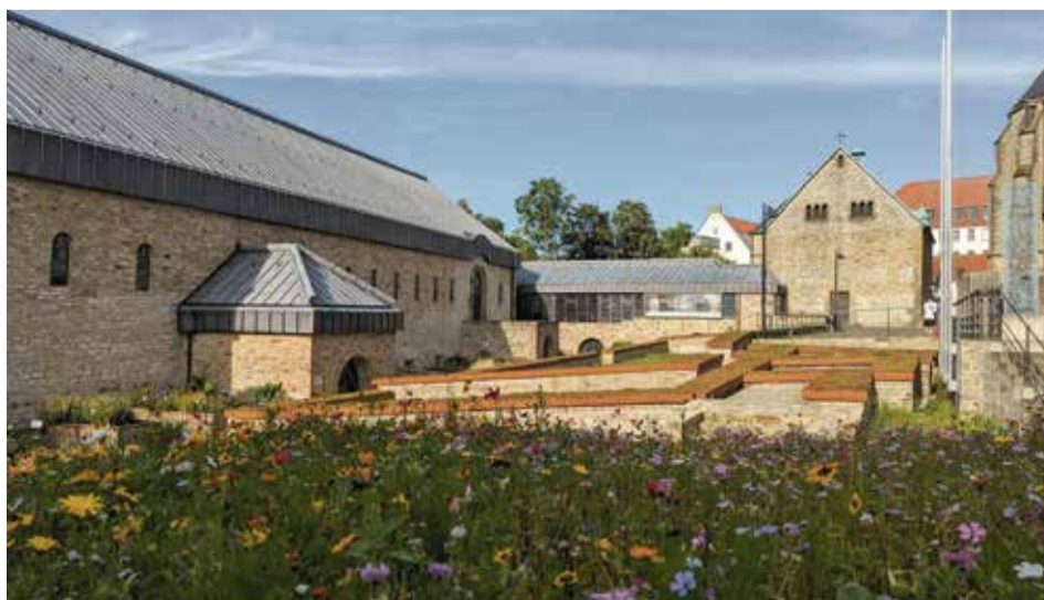
Das Paderborner Museum in der Kaiserpfalz mit den Pfalzanlagen des 8. und 11. Jahrhunderts zeigt ab dem 16. Mai die Ausstellung „775 – Westfalen“

Westfalen hat eine Geschichte, die sich nicht nur in ländlichen Regionen wie dem Sieger- und Sauerland abspielte, sondern auch in größeren Städten wie eben Dortmund, der früheren Bierhauptstadt Europas, Bochum, Bielefeld, Münster, Gelsenkirchen, Hagen, Hamm, Herne, Paderborn, Bottrop, Recklinghausen, Siegen und Gütersloh. Ansgar Lange