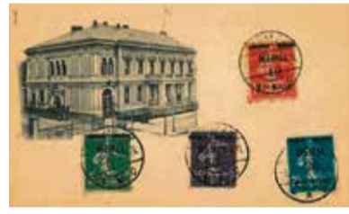
Zeigt die Kutsche der Gerlachs: überreichte Postkarte

Hamm-Westtinnen - Sonntag, 25. Mai, 10 Uhr, Von-Thünen-Halle, Vereinsheim Schützenverein West-