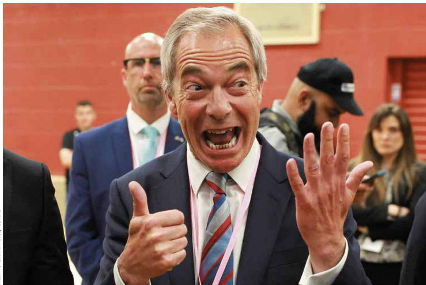
Viel Grund zur Freude: Nigel Farage zählt seinen Sieg bei den Kommunalwahlen und der Nachwahl zum Unterhaus an den Fingern ab

Das Etikett „Rechtsaußen“-Partei wäre für Reform indes nicht ganz passend. Der Geschäftsführer der Partei, der Ex-Unternehmer und Millionär Zia Yusuf, ist ein (moderater) Muslim. Farage hat sich mit dem US-Milliardär Elon Musk überworfen, weil Musk sich für den inhaftierten rechten Aktivisten Tommy Robinson einsetzte, während Farage diesen draußen halten will. Farage versucht, sich vom extremen Rand fernzuhalten und in die Mitte des Parteiensystems vorzudringen. Allerdings gibt es Risiken. Eines davon sind die wiederkehrenden innerparteilichen Spannungen und Spaltungen. Mit einem der fünf Reform-Abgeordneten in Westminster hat sich Farage schon verkracht und ihn aus der Partei geschmissen.