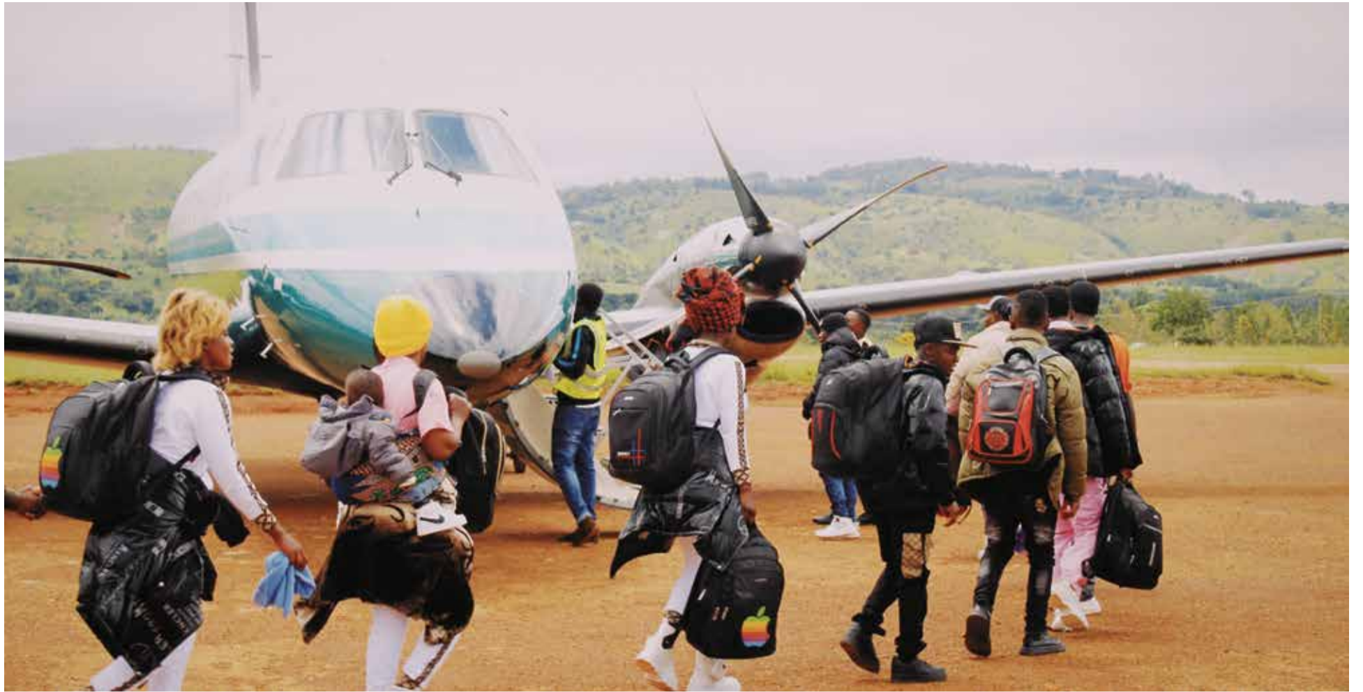
Zahl steigt seit Jahren stark an: Kongolesische Asylsucher vor ihrem vom UNHCR organisierten Abflug

Deutschland ist seit Dezember 2011 an dem Resettlement-Programm beteiligt, für das hierzulande der Paragraph 23 des Gesetzes über den Aufenthalt, die Erwerbstätigkeit und die Integration von Ausländern im Bundesgebiet die juristische Grundlage bildet. In dessen Absatz 4 vom Juli 2015 steht: „Das Bundesministerium des Innern, für Bau und Heimat kann im Rahmen der Neuansiedlung von Schutzsuchenden im Benehmen mit den obersten Landesbehörden anordnen, dass das Bundesamt für Migration und Flüchtlinge (BAMF) bestimmten, für eine Neuansiedlung ausgewählten Schutzsuchenden (Resettlement-Flüchtlinge) eine Aufnahmezusage erteilt.“ Diese bietet die Möglichkeit zur dauerhaften Niederlassung.