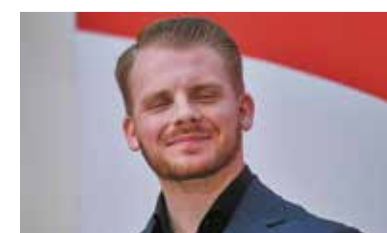
Augen zu und durch: Tim Klüssendorf wird SPD-Generalsekretär