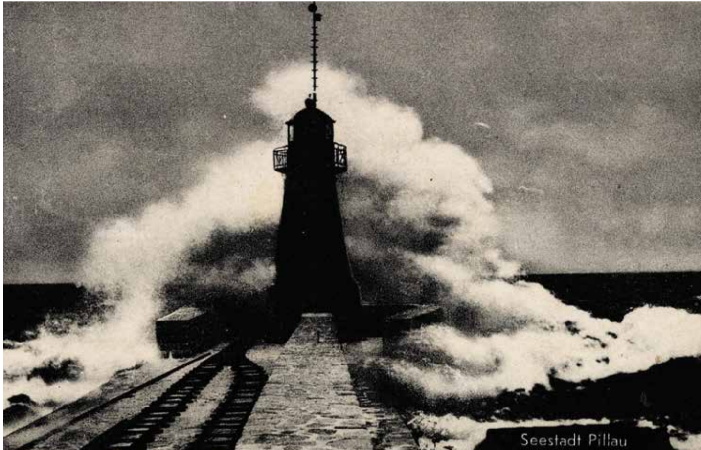
Stürme in Ostpreußen können schnell an Intensität zulegen und mutieren dann zum gefährlichen Orkan mit Windstärke 12: So wie hier an der Nordmole von Pillau, wo im Jahr 1915 aufgepeitschte Fluten den Signalturm unterspülten

Demgegenüber nahmen in anderen Jahren Hitze und Dürre überhand. 1427 fiel von Ostern bis in den August hinein kein einziger Tropfen Regen, während am 13. August 1868 in Ostpreußen eine Höchsttemperatur von 44,75 Grad Celsius im Schatten gemessen wurde. Sehr heiß geriet auch der Sommer 1912, weswegen es in den Königsberger Schulen 25-mal Hitzeferien gab. Manchmal führte die ungewöhnlich früh einsetzende Wärme sogar dazu, dass die Obstbäume zweimal blühten und Früchte trugen. Das passierte unter anderem in den Jahren 1506 und 1834. Und 1642 trafen die ersten Störche überraschenderweise schon Ende Januar ein. Weniger erfreulich waren hingegen