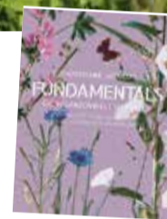
Christiane Jacquat: „Fundamentals. Die Pflanzenwelt des J. H.“, AT Verlag AG, Aarau und München 2024, gebunden, 240 Seiten, 59 Euro

Umwelt anzuregen. Das gelingt ihr, ohne den Zeigefinger zu erheben, indem sie und weitere Autoren die Bilder textlich begleiten und einordnen. Besonders erfrischend sind neben den wundervollen Bildern die französischen Originaltexte und literarischen Zitate. CRS