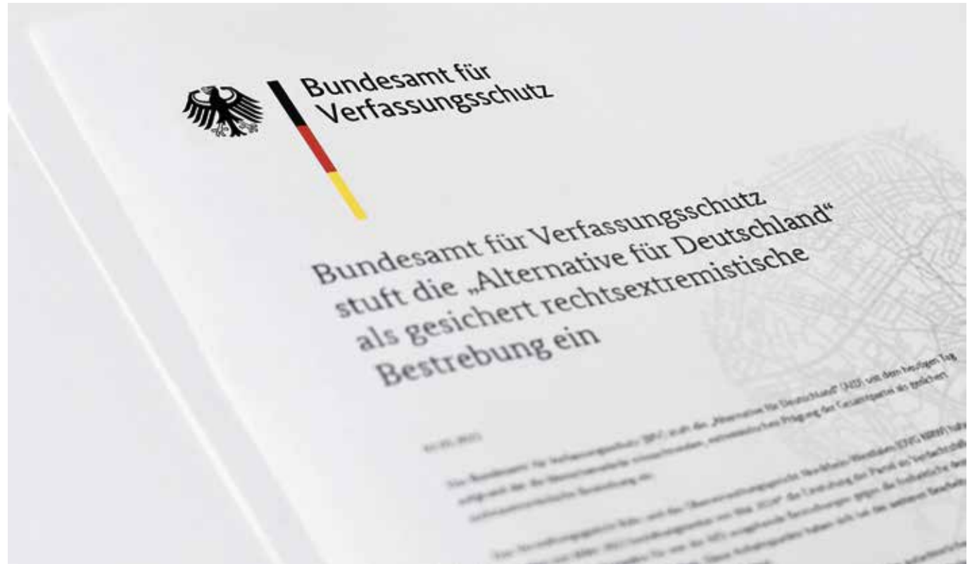
Verfasst vom Verfassungsschutz: Zweifelhafte AfD-Gutachten mit dünnen Belegen

Gewählt werden die 16 Richter des Bundesverfassungsgerichts jeweils zur Hälfte vom Bundestag und vom Bundesrat. Zur Richterwahl nötig ist eine Zweidrittelmehrheit. Der Bundestag steht in diesem Jahr vor der Aufgabe, drei neue Richter für das Bundesverfassungsgericht zu wählen. Dabei müssen die Unionsparteien mit einem Problem rechnen: Ohne die Linkspartei haben CDU/CSU, SPD und Grüne im neuen Bundestag nämlich keine Zweidrittelmehrheit mehr.