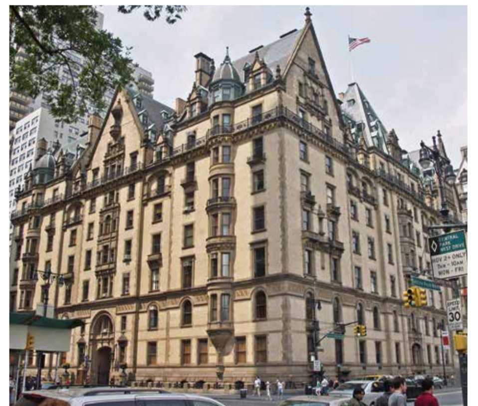
Das Dakota-Haus in der feinen Upper West Side Manhattans wurde 1969 von New York als Denkmal ausgewiesen – es folgten viele weitere Auszeichnungen dieser Art

Also beauftragten sie den ambitionierten Preußen mit immer aufregenderen, interessanteren Projekten, die wiederum immer spektakulärere Herausforderungen nach sich zogen. Den ersten wirklich optischen Meilenstein erschuf der US-Preuße mit dem großen Treppenhaus der Library of Congress in Washington DC. Bemerkenswert war dabei nicht nur Grie-