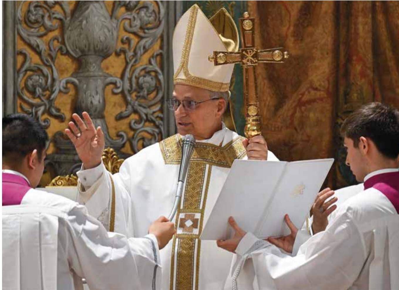
„Fähigkeit, die verschiedenen Strömungen in der Kirche zusammenzuführen und gleichzeitig klare Orientierung zu geben“: Leo XIV., hier während seiner ersten Messe als Papst in der Sixtinischen Kapelle

Seine augustinerische Identität ist mehr als ein biographisches Detail; sie dürfte sein Denken und Handeln als Papst prägen. Der Orden des heiligen Augustinus steht für Gemeinschaftssinn, die Suche nach Wahrheit im Dialog sowie die Bedeutung von Freundschaft und innerem Leben. Prevosts bischöf-