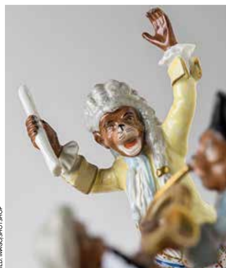
Komponist aus Kaendlers „Affenkapelle“

Den spektakulärsten Auftrag erteilt ihm August II. Kaendler sollte ihn auf einem mit Sockel neun Meter hohen Reiterdenkmal aus Porzellan verewigen. Aber mit dem Tod des Kurfürsten 1763 war auch das Projekt gestorben. An die großen Pläne erinnert das kleine Kabinetstück des Reiterdenkmals. Veit-Mario Thiede