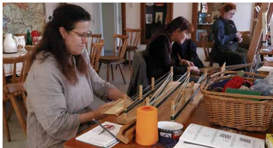
Wichtig beim Weben: Das Schären der Kette

Alle Teilnehmer planen, auch zum Herbstkurs zu kommen. Der Termin für diesen wurde gemeinsam mit der Kursleiterin festgelegt, und zwar vom 13. bis 17. Oktober von 10 bis 16 Uhr wieder im „Haus der Heimat“ in Kiel. G. Hergenhan