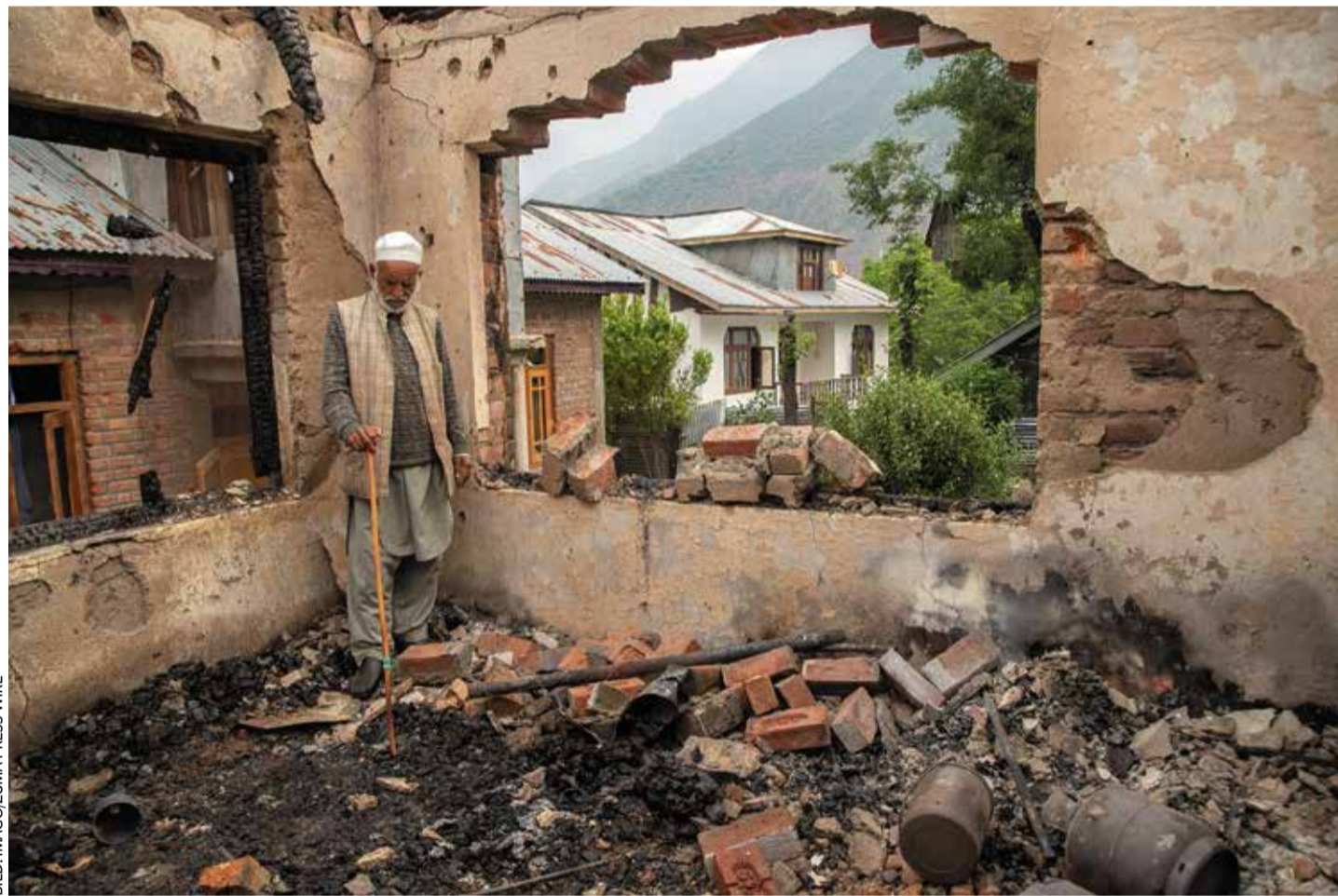
Ausgebombt in Kaschmir: Bei den jüngsten Kämpfen kamen auf beiden Seiten auch 36 Zivilisten ums Leben

Andererseits bieten der gute Draht zwischen Peking und Islamabad sowie die teilweise wirtschaftliche und außenpolitische Interessenskongruenz zwischen der Volksrepublik und Indien aber die Chance, dass das Reich der Mitte erfolgreich als Schlichter agiert. Den jetzigen Waffenstillstand vermittelten allerdings die USA, nachdem Pakistan massiv zurückschoss und einen Kampf „bis zum letzten Blutstropfen“ ankündigte.