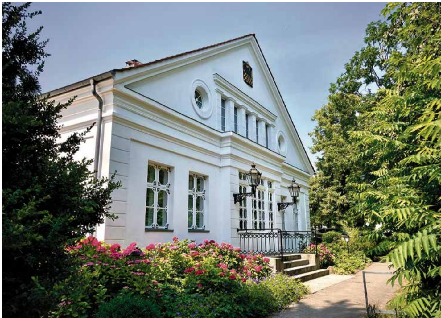
Das 1829 errichtete Gartenhaus des Fürsten zu Putbus: Heute ein gerne besuchtes Rosencafé mit interessanter Geschichte

Eines der Themen, die Bismarck bewegten: Die Verfassung des Norddeutschen Bundes, der gerade im Werden war.