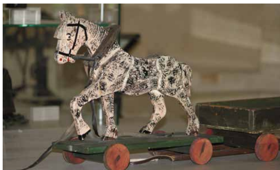
Ein Holzpferd im Museum für Stadtgeschichte, welches die Bedeutung der Pferde für die ganze Landschaft und Kultur in Ostpreußen verdeutlicht

Die Ausstellung „Wolfskinder – Eine Geschichte des Überlebens“ ist bis zum 24. August 2025 zu sehen. Der Eintritt ist frei. Öffnungszeiten: Fr.-Di. 10 bis 17 Uhr. Sa. und So. zwischen 12.30 und 13 Uhr geschlossen, www.templin.de/museum .