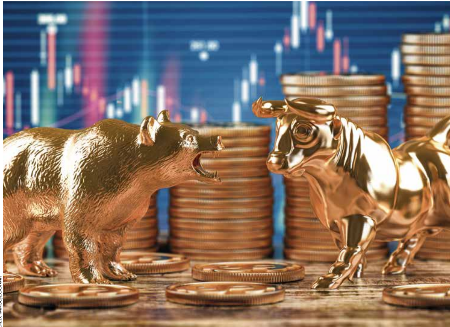
Die US-Märkte sind übersättigt und Anleger verunsichert: Deutschland ist auch wegen der neuen Regierung eine gute Alternative

Ende Mai summierten sich die Staatsschulden auf den historischen Höchst-