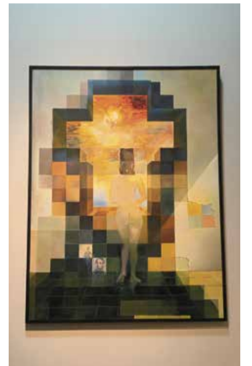
Halluzination: Bei naher Betrachtung schaut Gala aufs Meer, von Weitem aber entsteht das Porträt von Lincoln

In einer Welt, die oft von Eindeutigkeit und Pragmatismus geprägt ist, erinnert Dalí daran, dass das Irrationale, das Spielerische und das Visionäre ebenso wichtig sind. Sein Museum in St. Pete ist ein Tempel der Vorstellungskraft – und ein Ort, an dem man für ein paar Stunden nicht nur Kunst sieht, sondern der Wirklichkeit entflieht, indem man sie neu zu denken lernt – eine Twilightzone!