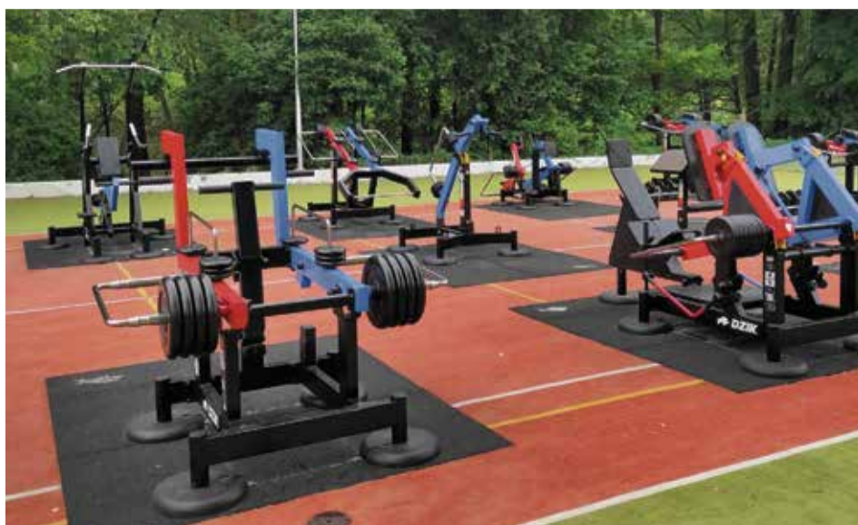
Die Idee von Studenten: Eine moderne Fitnessanlage in Kortau

Die Auswahl der zu realisierenden Projekte erfolgte durch eine Abstimmung