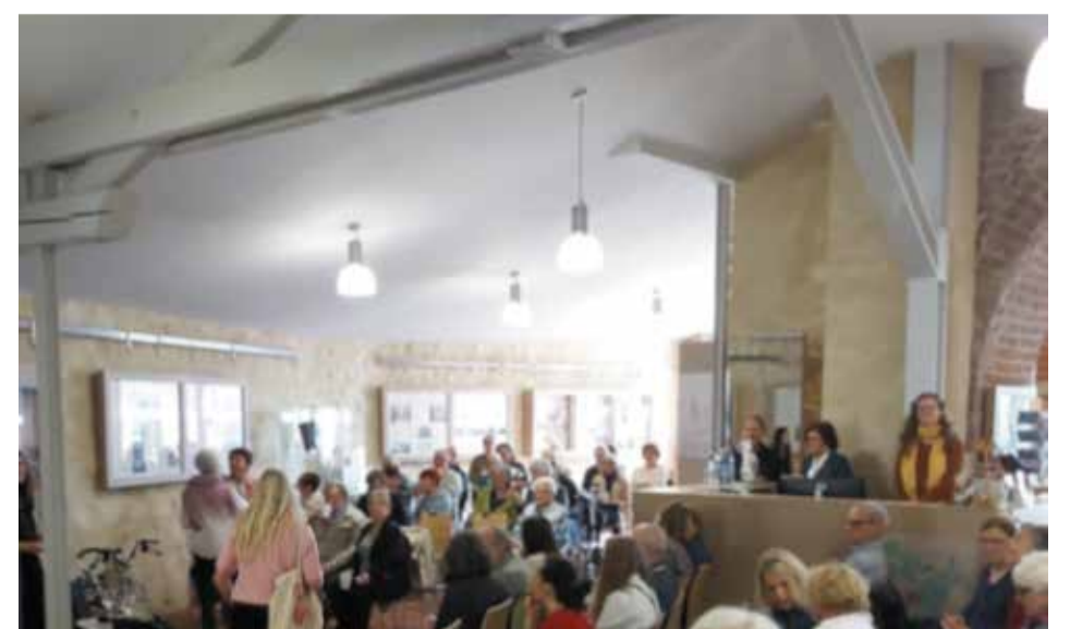
Die Versammlung in den Ausstellungsräumlichkeiten war gut gefüllt mit neugierig-aufgeschlossenen Besuchern des Museums