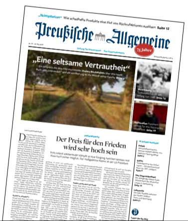
Ausgabe Nr. 22