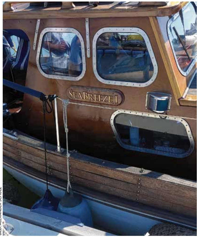
Erinnerungen an den Untergang der Wilhelm Gustloff: Das letzte Beiboot ankert am Greifswalder See

Chemnitz - Im Evangelischen Schulzentrum Chemnitz trafen sich am 11. Juni 2024 Vertreter des Regionalverbandes Süd/West-Sachsen e.V., Mitglied im Landesverband der Vertriebenen und Spätaussiedler/ Schlesische Lausitz e.V. zu ersten Gesprächen bezüglich der Bildungsfahrten nach Knappenrode zur Bildungs- und Begegnungsstätte „Transferraum