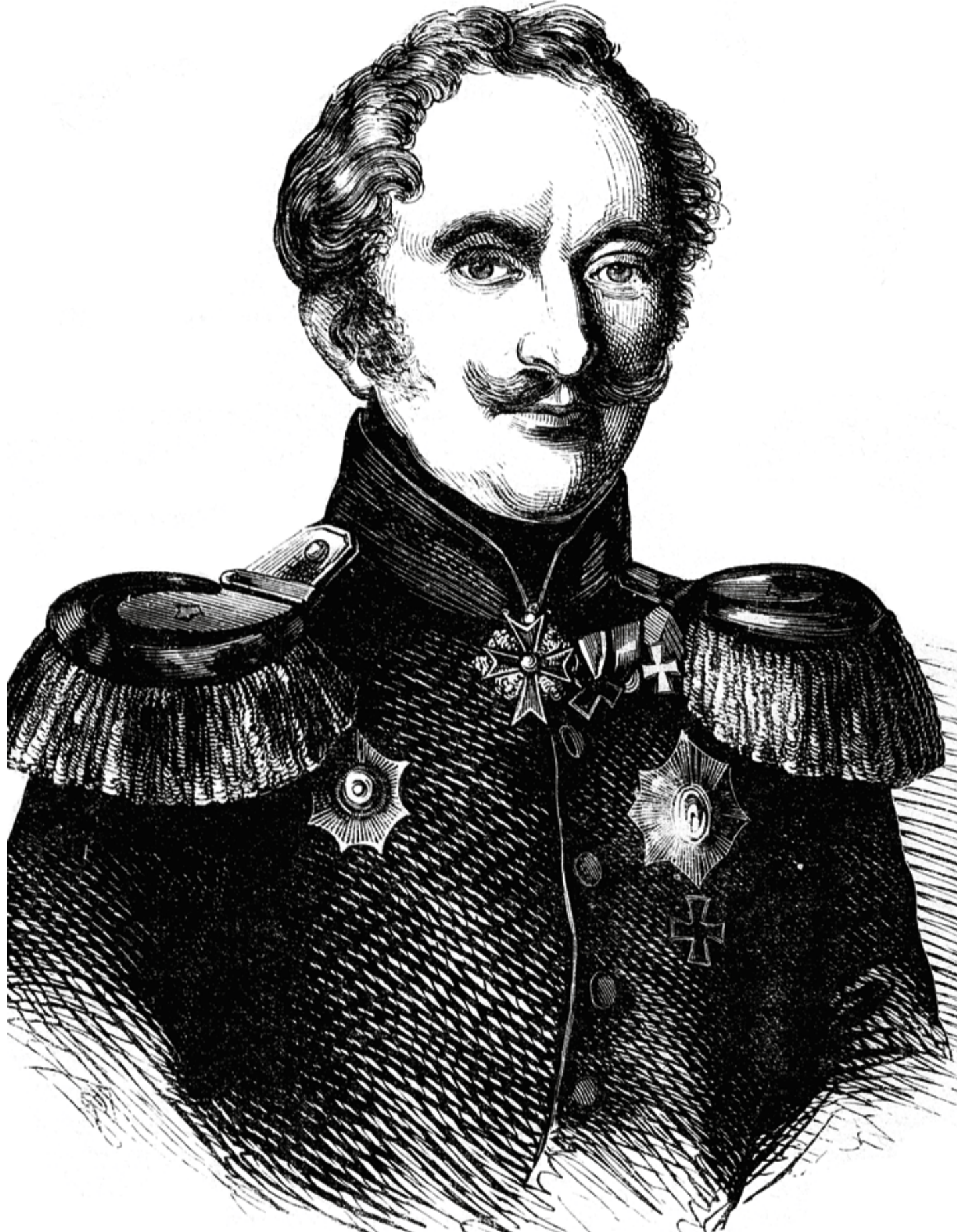
Friedrich August Peter von Colomb in einer Xylographie um 1845

Im Krieg auf dem Schlachtfeld bewährt und versiert, machte er aber auch in Friedenszeiten eine steile Karriere und brachte es schließlich sogar zum Gouverneur von Königsberg