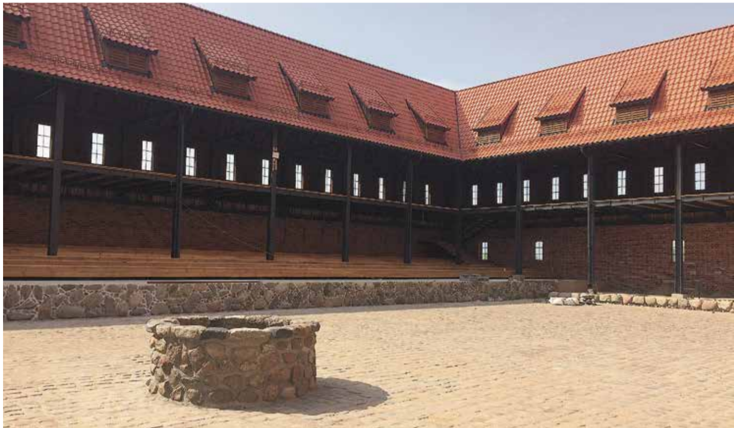
Wurde bereits restauriert: Der Nordwestflügel der Burg

Im wichtigsten historischen Gebäude in Tapiau, dem Nordwestflügel der Burg, sind die Hauptarbeiten schon abgeschlossen. Die Baugerüste wurden inzwischen abgebaut. Der Innenhof ist nun nahezu ein einsatzbereiter Ort für Kulturveranstaltungen. Laut Bilous soll in Kürze direkt vor der Festung eine Bühne errichtet werden. Rundherum, auf einem gepflasterten Platz, sollen Zuschauerplätze eingerichtet werden, einschließlich einer VIP-Zone. Der Minister für Kultur und Tourismus der Region, Andrej Jermak, sagte, dass auf dem Gelände der Burg Tapiau im Sommer 2025 das Musikfestival „KANTate“ ausgerichtet wird.