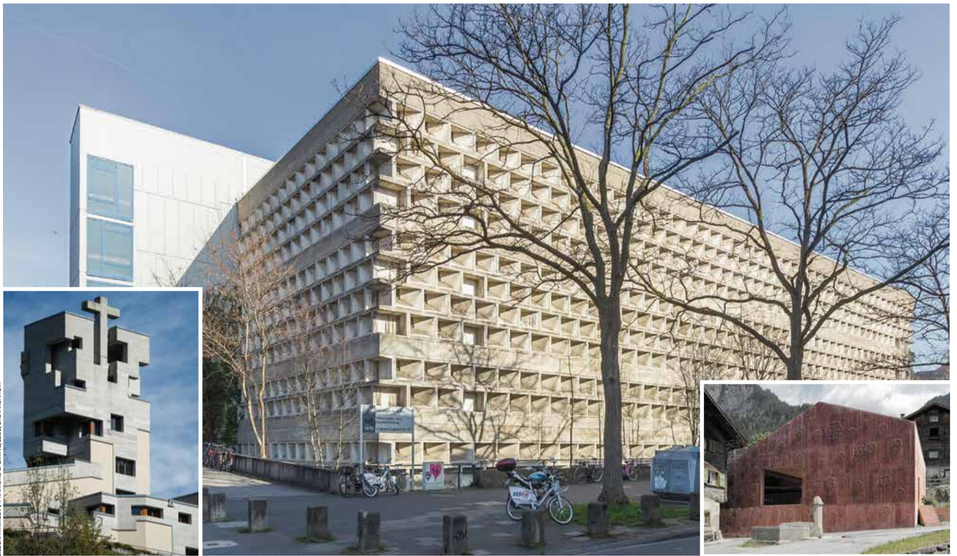
Beispiele des Brutalismus: Die Unibibliothek Köln (großes Bild), die Kirche St. Gallus in Lichtensteig, Schweiz (l.), und das Atelier Bardill im ebenfalls schweizerischen Scharans (r.)

Demgegenüber loben die Bewunderer die „derbe Poesie“ der „kompakten, disziplinierten Architektur“ sowie die „ethische Bauweise“, welche nichts zu verbergen habe. Ebenso ist von „kraftvoller, robuster Ästhetik“ die Rede. Und vielfach wird auch noch die „zukunftsgerichtete, futuristische Aura“ der Bauwerke gefeiert. Manchmal heißt es in diesem Zusammenhang sogar, die Architekten hätten eine „Heldentat“ vollbracht, indem sie sich dem „ideologischen Geschmacksterror“ der rückschrittlichen Liebhaber konventioneller Baustile widersetzen.