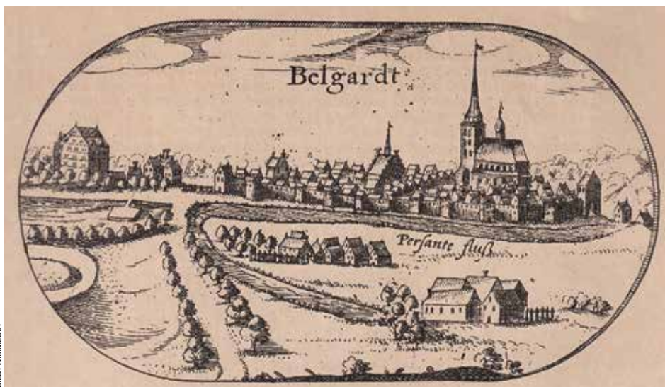
Aus der Lubinschen Pommerkarte: Herzogs Philipp II. von Pomern ließ sie zwischen 1610 und 1618 von Eilard Lubinus aus Stralsund erarbeiten

Seine zweite Arbeit mit dem Titel „Ursprung und Geschicht der Pomern und Rhüganer“ enthält für die Nachwelt wichtige Hinweise auf die Geschichte Bel-