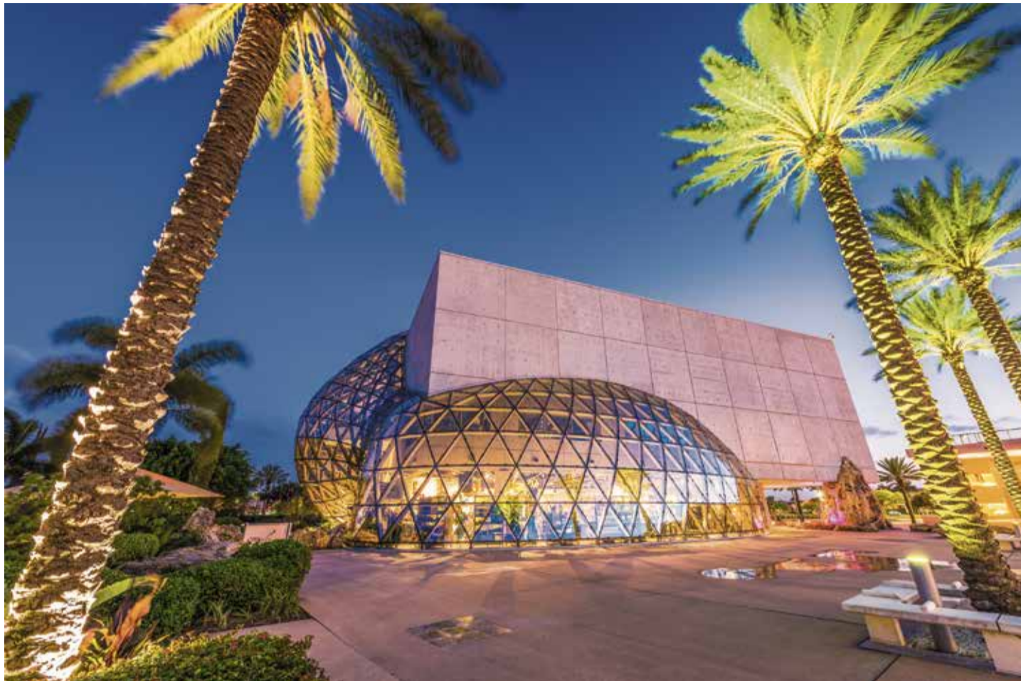
Das Dalí-Museum in St. Pete: Die Glasblase namens Enigma scheint sich aus dem Betonklotz zu quälen

Bereits im ersten Ausstellungsraum schlägt einem das volle Gewicht von Dalís Genie entgegen. Großformatige Werke wie „Die Halluzinatorische Stierkampfarena“ oder „Gala schaut auf das Mittelmeer, das bei 20 Metern Entfernung wie