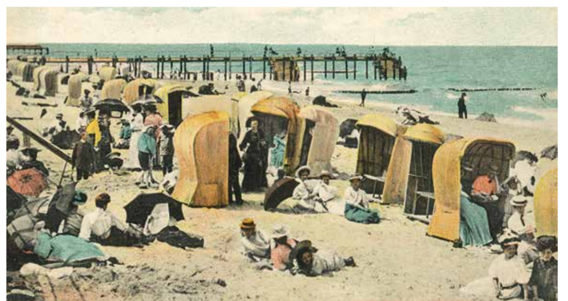
Postkartenmotiv: Sommer in Cranz um das Jahr 1900

seführern und Tourismusbrochüren die Entwicklung des Fremdenverkehrs in Ostpreußen. Dabei beleuchtet sie auch die Entwicklung nach 1990, als Ostpreußen Ziel unzähliger Heimatreisen wurde. Museum Erleben ist unsere Veranstaltungsreihe, die jeden ersten und dritten Dienstag im Monat, nachmittags ab 14.30 Uhr einlädt, das Ostpreußische Landesmuseum mit Deutschbaltischer Abteilung auf besondere Weise zu entdecken.