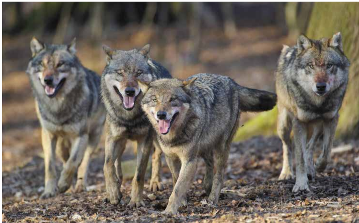
Der europäische graue Wolf hat sich geradezu rasant in den letzten Jahrzehnten wieder in Deutschland ausgebreitet. Doch was Tierschützer zu Recht freut, wird für Viehhalter zunehmend zur Bedrohung

Sollte die Bundesregierung beim Wolf nicht für eine begrenzte Bestandspflege sorgen, dürfte das für den Räuber ein Bärendienst sein. In dem Verlust von Akzeptanz durch einen nicht mehr zeitgemäßen Schutz sieht der Deutsche Jagdverband die größte Gefahr.