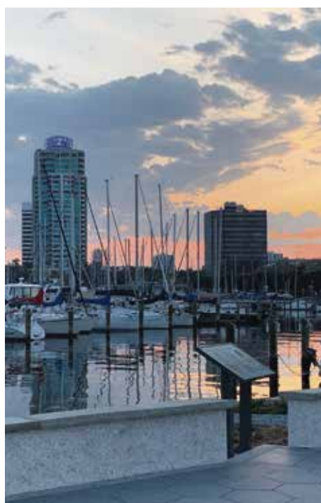
Pier und Jachthafen von St. Pete