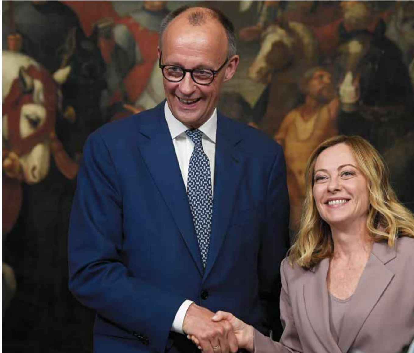
Neues Verständnis von Konservatismus: Italiens Ministerpräsidentin Giorgia Meloni – hier mit Bundeskanzler Friedrich Merz