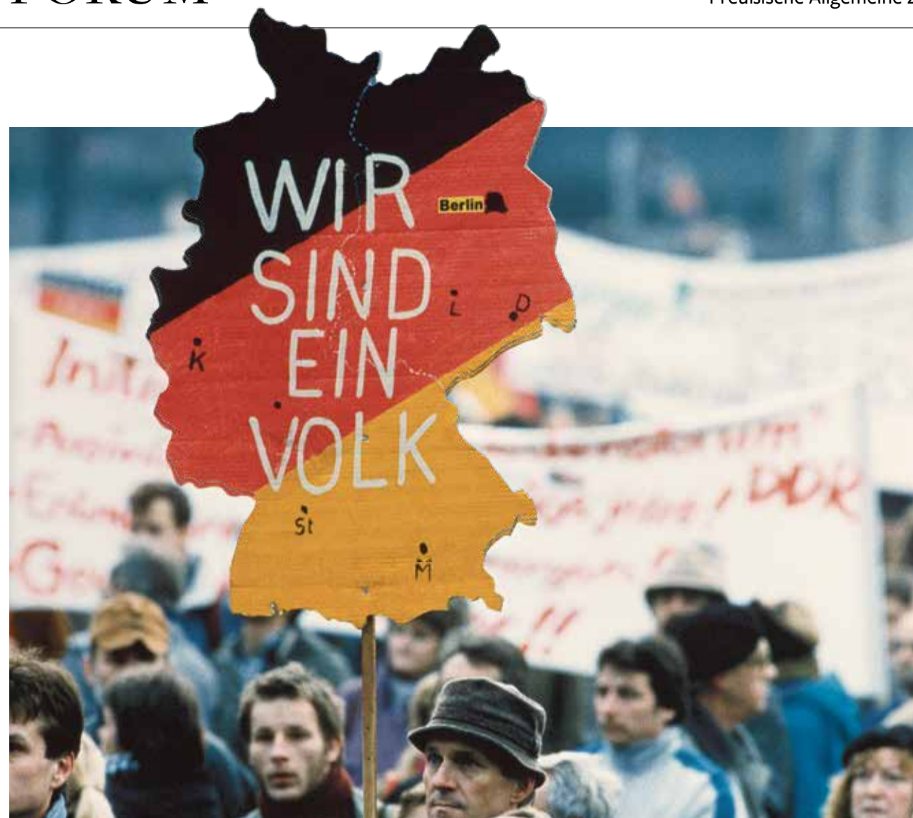
Zeigten, dass ein Volk mehr ist als die Gemeinschaft der Bürger eines Staates: Demonstranten im Winter 1989/90

Landsmannschaft Ostpreußen: www.ostpreussen.de Bundesgeschäftsstelle: info@ostpreussen.de