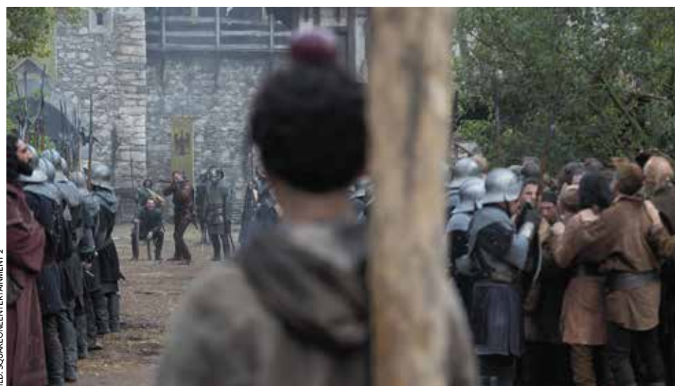
Der Apfel fällt dieses Mal weit vom Stamm: Tell (hinten) zielt auf seinen (Stief-)Sohn