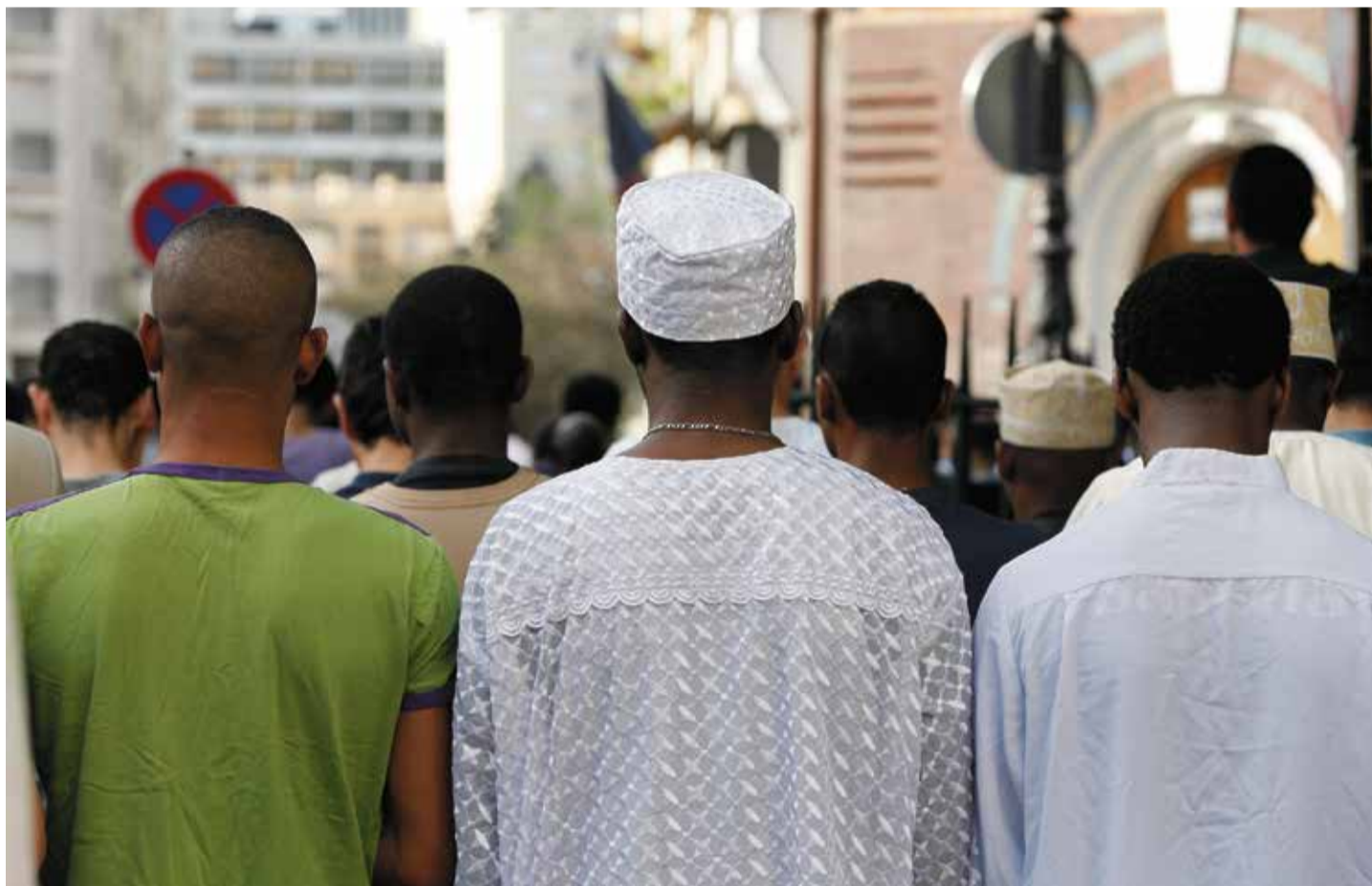
Provokant: Muslimbrüder beten öffentlich außerhalb ihrer große Moschee in Paris

Jean-Luc Mélenchon, Führer der bereits weitgehend islamistisch unterwanderten linken Volksfront im Parlament, die sich „La France insoumise“ nennt, sprach hingegen von „einer beschämenden Islamophobie der herrschenden Kräfte in Frankreich, die ihre menschenfeindliche Fratze zeigt“. Ein klares Zeichen, dass sich die Linke den Moslems bereits vollumfänglich unterworfen hat und sich lediglich weiter anbiedern will.