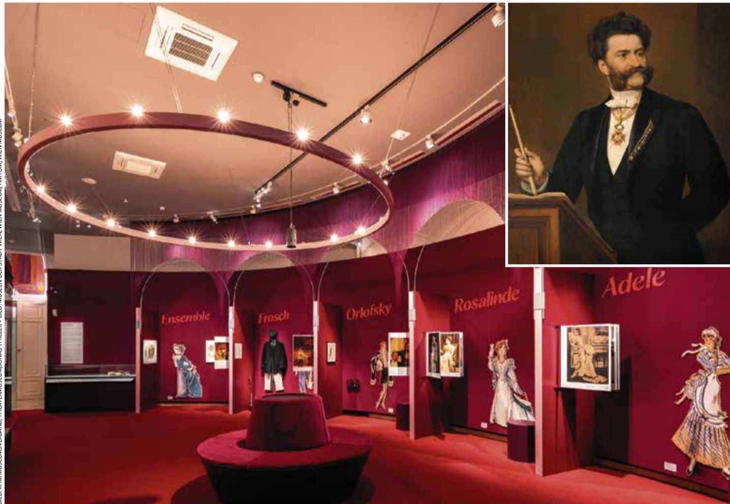
Der Schöpfer und sein Werk: Das Theatrumuseum präsentiert Figuren der Operette „Die Fledermaus“ von Strauss (oben)

Die Voyager 1 ist seit 1977 unterwegs und hat zwei goldene Datenplatten mit Bild- und Toninformationen an Bord, um potenzielle außerirdische Wesen mit dem Reichtum der irdischen Zivilisation bekannt zu machen, so auch Musik von Bach und Mozart. Den „Donauwalzer“ hatte