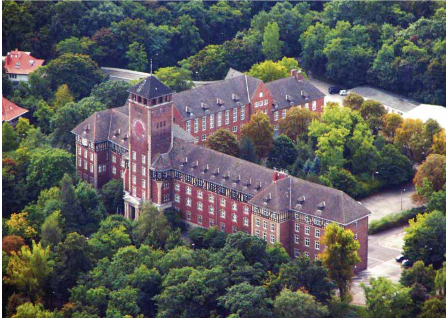
Geschichtsträchtiger Koloss: Gebäudekomplex auf dem Potsdamer Brauhausberg

Nunmehr hat Plattner sein bislang größtes Potsdam-Projekt vorgestellt. Zusammen mit dem brandenburgischen Ministerpräsidenten Dietmar Woidke (SPD) und der Universität Potsdam präsentierte er Pläne für den Bau eines neuen Uni-Campus und zur Erweiterung des Hasso-Plattner-Instituts (HPI).