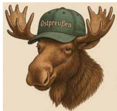
Zur Kontaktaufnahme aufgerufen: B-W mit Interesse an Ostpreußen

Außerdem sucht die Landesgruppe Berichte über Ostpreußen. Das können Erinnerungen an die Heimat oder Erlebnisse während Flucht und Vertreibung sein. Es können auch Erlebnisse sein, die Ihnen Ihre Eltern oder andere Verwandte geschildert haben. Auch werden Schilderungen, wie Nachgeborene den Verlust der Heimat ihrer Eltern verarbeiten, gesucht. Gerne nimmt die Landesgruppe auch Reiseberichte ins heutige Ostpreußen an. Alle diese Berichte