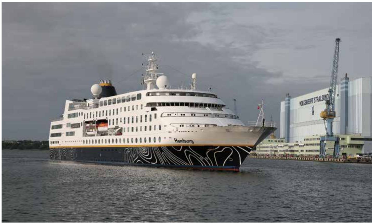
Der zweite Besuch in der Hansestadt Stralsund: Die MS „Hamburg“ auf heimischen Gewässern unterwegs, denn sie wurde 1997 als MS „Columbus“ auf der MTW Schiffswerft Wismar gebaut

Für die MS „Hamburg“ ist die Hansestadt etwas Besonderes, auch wenn sie schon alle Weltmeere befahren hat und die meisten großen und viele kleine Häfen kennt. Der Autor dieser Zeilen war mit ihr mehrfach unter anderem in Südamerika, der Antarktis und auf den Großen Seen in den USA und Kanada unterwegs. Immer mit begeisterter Resonanz bei den dort