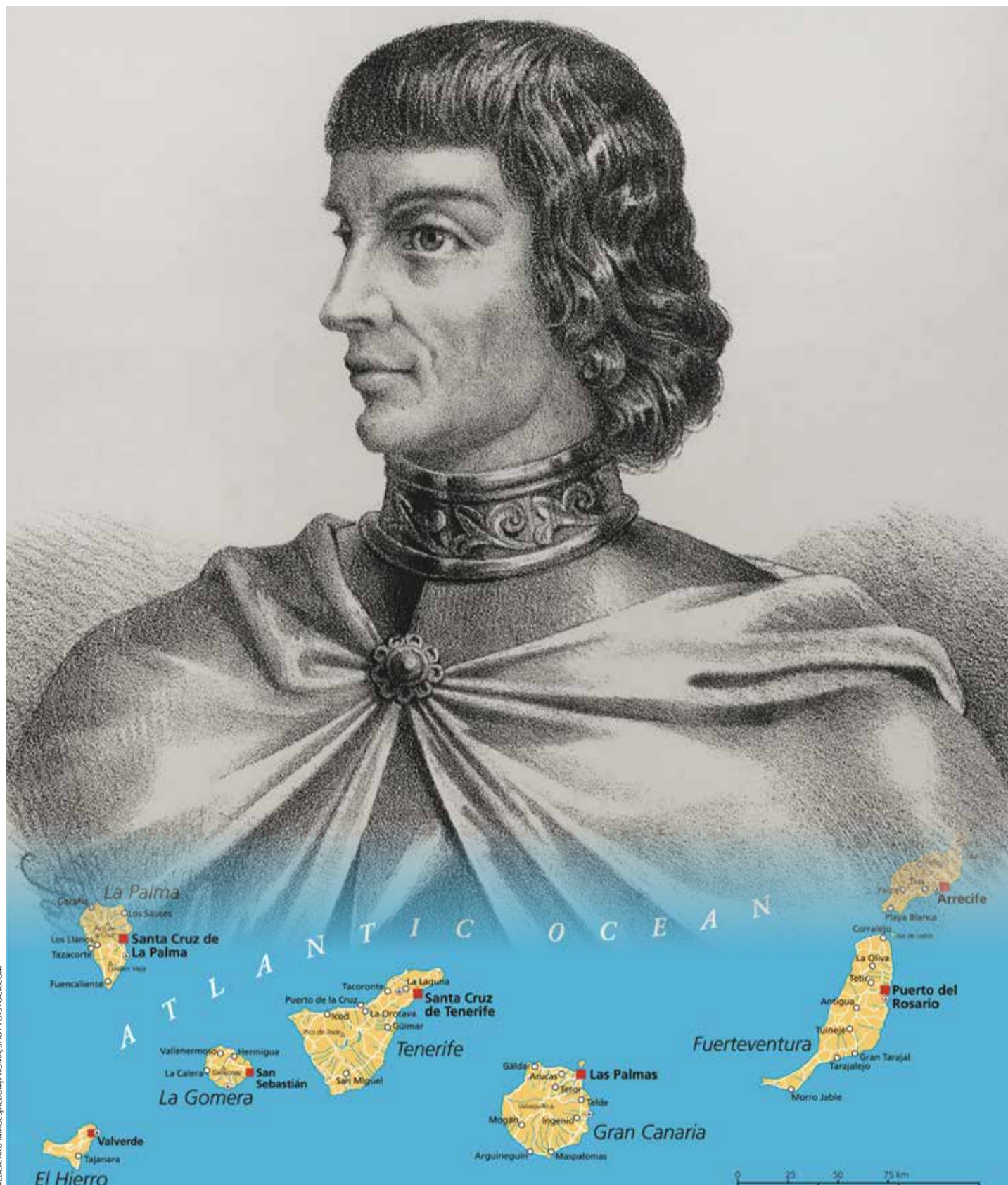
Verübte im 15. Jahrhundert ein grausames Massaker an den Gomeros: Gouverneur Pedro de Vera y Mendoza

Die Rebellion endete mit dem Eintreffen des Gouverneurs von Gran Canaria, Pedro de Vera y Mendoza, und dessen Truppen. Wenig später veranstalteten die Wit-