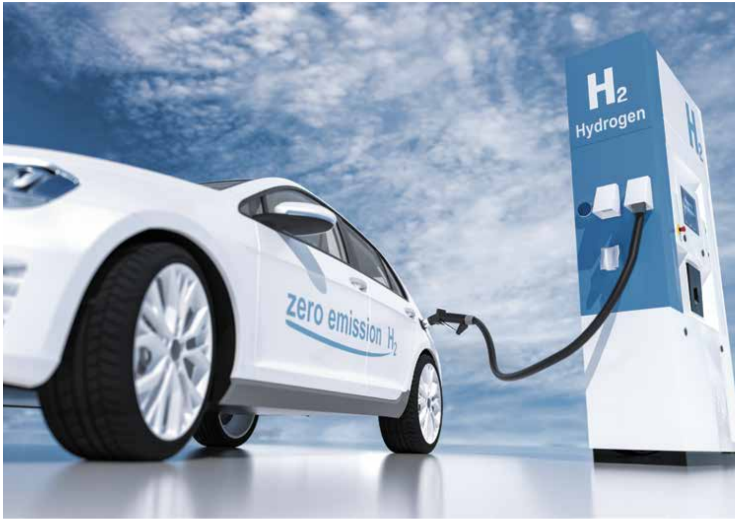
Und dem nächsten grünen Herzensprojekt droht das Aus: „Bye-bye H 2 “ tönt es aus der Automobilwirtschaft