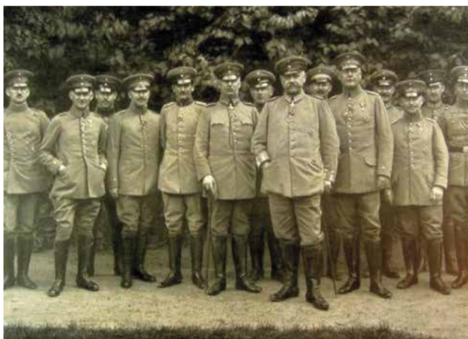
Hindenburg vor seiner Truppe: Aufnahme aus der „Illustrierte Zeitung“ vom 19.08.1915

Sowohl Hindenburg als auch Ludendorff haben ihre Zeit in Lötzen genossen und dies auch in ihren Memoiren ausdrücklich erwähnt. So schrieb etwa Hindenburg in seinem Buch „Aus meinem Leben“ (Leipzig 1920) in einem eigenen Kapitel „Lötzen“: „... möchte ich zu einer idyllischen Seite unseres Kriegslebens übergehen, in-