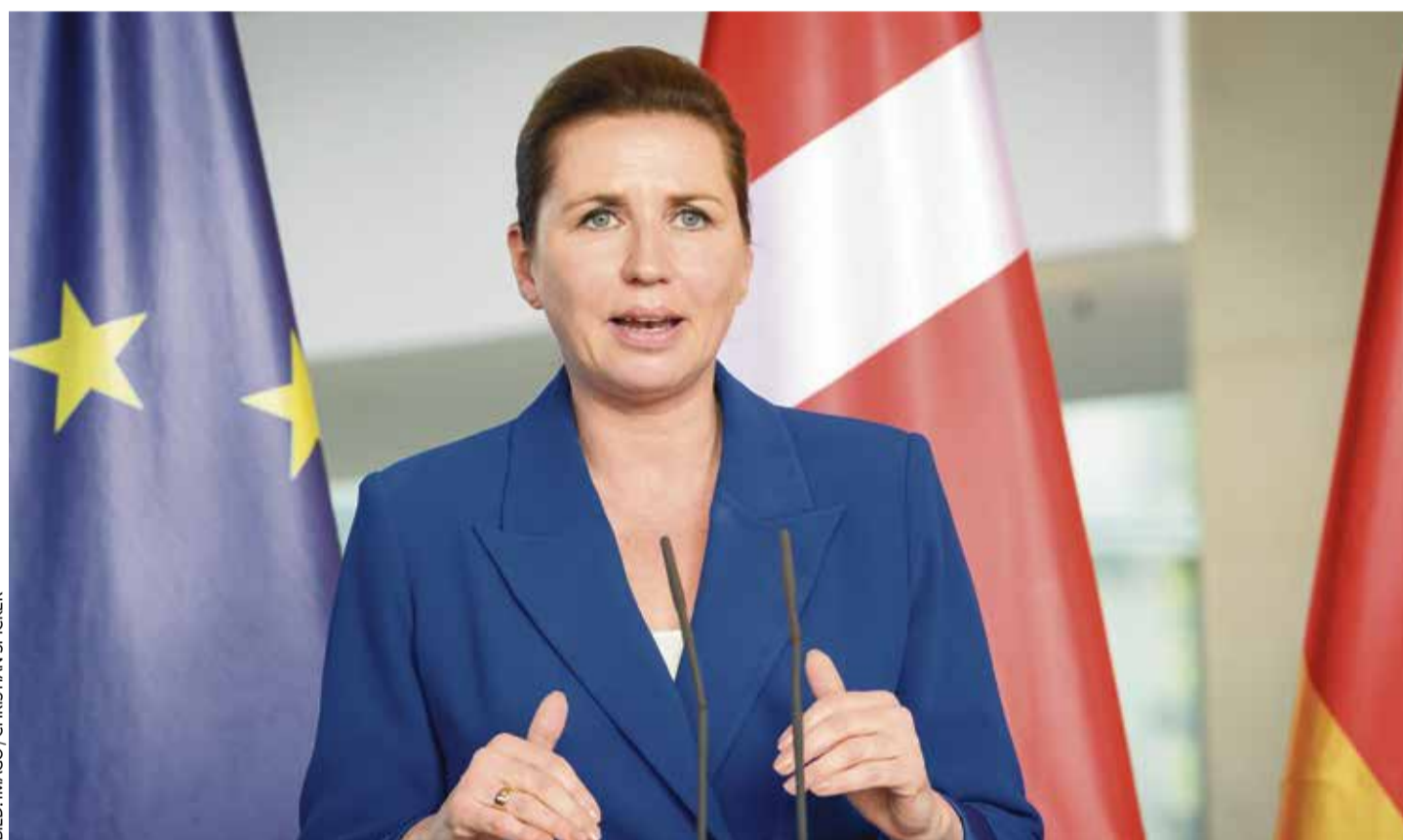
Dänemarks Regierungschefin Mette Frederiksen hat seit dem 1. Juli den EU-Ratsvorsitz übernommen: Auf ihr ruhen die Hoffnungen vieler EU-Staaten, dass sich in der Migrationspolitik nun endlich etwas zum Besseren wendet

Laut dem CDU-Politiker setzt sich jetzt eine Mehrheit der EU-Staaten und des EU-Parlaments für eine nachhaltige Migrationswende ein. „Deutschland wird hierbei treibende Kraft sein und nicht mehr wie bisher blockieren.“