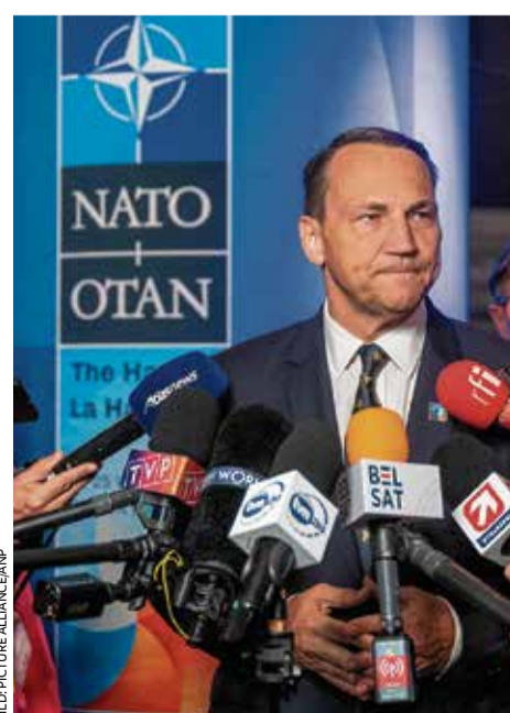
Wirbt für gemeinsame deutsch-polnische Aufrüstung: Radosław Sikorski

Die Republik Polen und Deutschland sollten nach Worten des polnischen Außen-