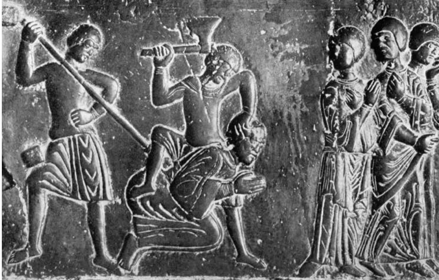
Die noch heidnischen Prußen töten Vojtěch, den überaus frommen Sohn des böhmischen Fürsten, der sich die Christianisierung der Prußen zum Ziel gesetzt hatte: Darstellung auf der Gnesener Bronzetür aus dem 12. Jahrhundert

Daraufhin unternahm man weitere Missionierungsversuche, bis dann im