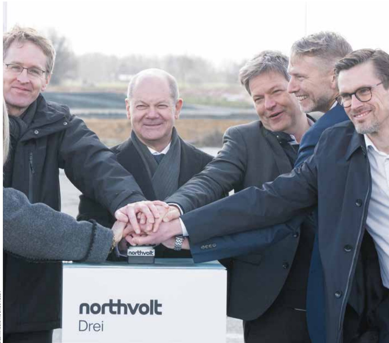
Da herrschte noch Zuversicht: Am 25. März 2024 fiel der Startschuss für den Bau der Northvolt-Fabrik in Heide. Neben Habeck mit dabei waren auch Bundeskanzler Scholz und Ministerpräsident Daniel Günther sowie zwei Northvolt-Offizielle