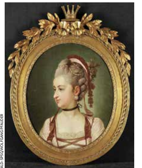
Per Krafft d. Ä.: „Prinzessin Sofia Albertina von Schweden“, um 1773

Der historische Ausstellungsort verleiht der Präsentation eine zusätzliche Tiefe: Im Bibliothekszimmer von Prinz Heinrich von Preußen – Bruder Friedrichs des Großen und Onkel Sofia Albertinas – wurde mit maßgefertigter Möblierung durch den Berliner Möbeldesigner Jonas Stürzebecher eine neue Ausstellungssituation geschaffen. Neun Vitrinenschränke und eine große Tischvitrine, inspiriert von