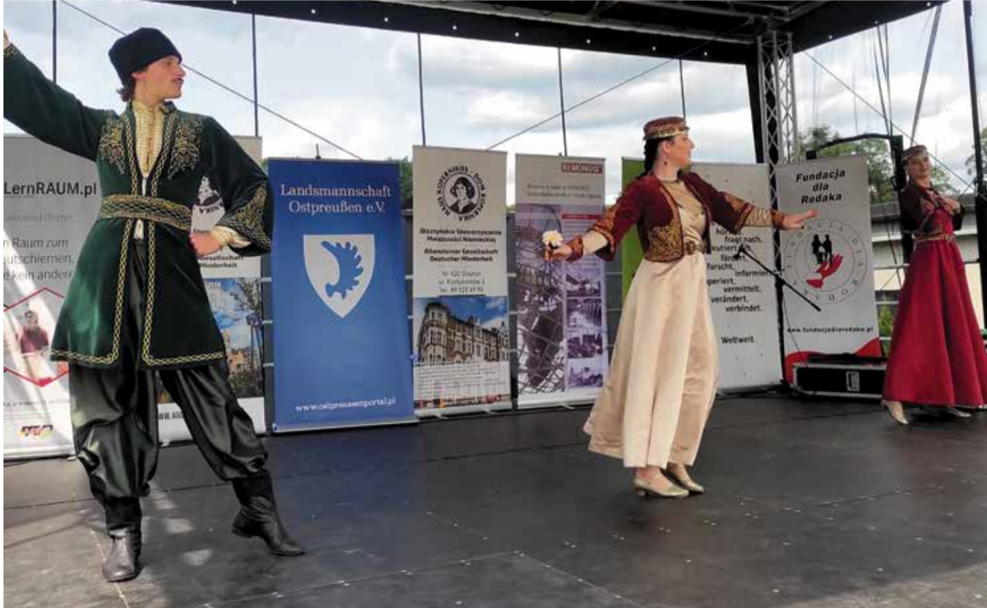
Mit von der Partie: Die karaimische Tanzgruppe Dostlar tritt mit typischen Volkstänzen auf

Wie im Vorjahr hatte das Fest den charmanten Charakter eines Familienpicknicks, das einladend und offen für Menschen jeden Alters war. Dank eines vielfältigen künstlerischen Programms mit zahlreichen Aktivitäten, das von der Allensteiner Gesellschaft Deutscher Minderheit (AGDM) mit großem Engagement vorbereitet worden war, konnte jeder Gast auf seine Weise diesen besonderen Tag genießen. Neben den unterhaltsamen Bühnenauftritten und Informationsständen, an denen eingeladene Organisationen und Vertreter verschiedener Minderheitenverbände ihre Aktivitäten präsentierten, gab es auch viele Attraktionen für Kinder sowie Marktstände mit kulinarischen Spezialitäten und handgefertigten Schmuckstücken.