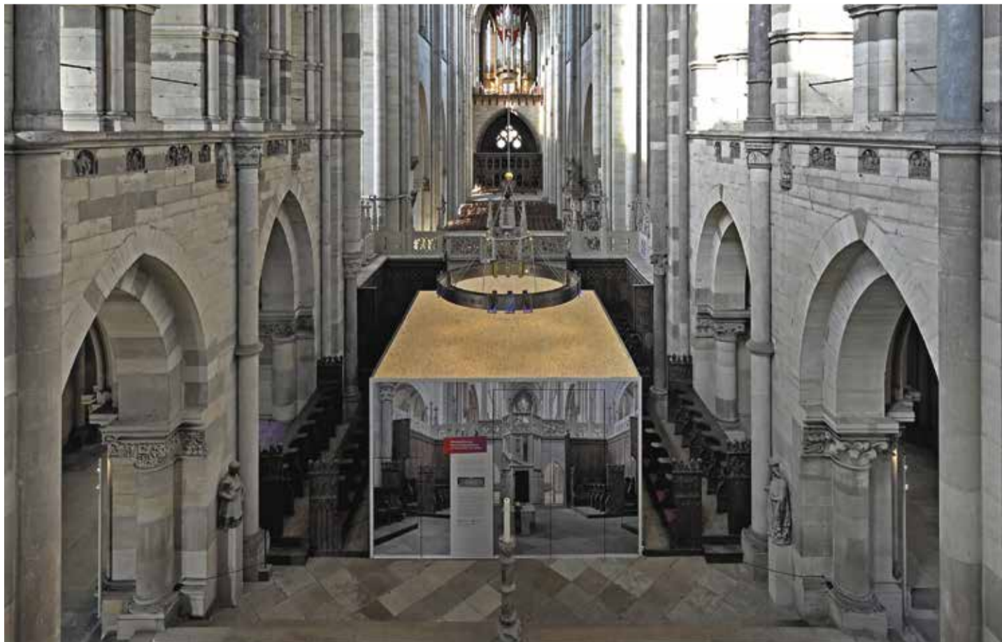
Die Einhausung des Grabmals im Hohen Chor des Doms, in dem die Arbeiten an Ottos Grab seit dem Januar durchgeführt werden

Bei dem Grabmal Ottos des Großen im Magdeburger Dom handelt es sich um einen Sarkophag aus einem an allen vier Seiten kassettierten, monolithischen Block aus Kalkstein. Die Abdeckung bildet eine wiederverwendete antike Marmorplatte. Das Grabmal wurde im 19. Jahrhundert geöffnet. Damals wurde der Sarkophag repariert und konstruktiv ertüchtigt. Auf der Marmorplatte wurde 1937 eine durchbrochene Gedenkschrift aus Gussmetall angebracht. Nach 1945 wurde zur Entlastung der an den Längsseiten weit auskragenden Deckplatte eine stützende Metallkonstruktion hinzugefügt, die ihren Zweck jedoch nur in geringem Maße erfüllte. Zudem tragen gerade die Eingriffe des 19. Jahrhunderts erheblich zu der oben skizzierten Gefährdung des Grabmals bei, zu deren Behebung die beschriebenen Maßnahmen dienen sollen.