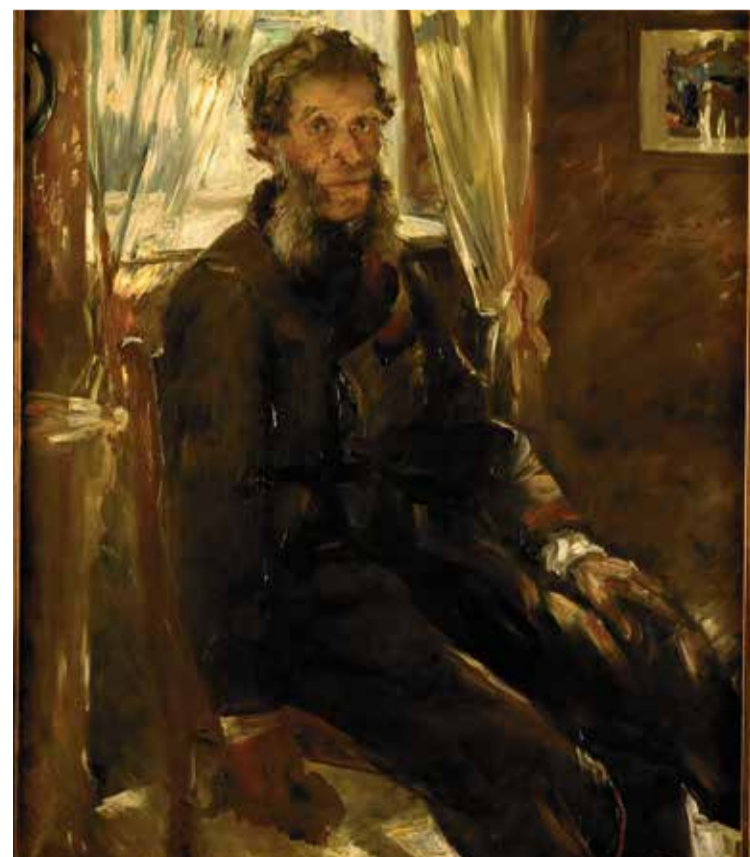
Lovis Corinth: Ohm Friedrich, Öl auf Leinwand, 1900

Mittwoch, 23. Juli, 14 bis 17 Uhr, Kosten 8,- Euro inklusive Material: