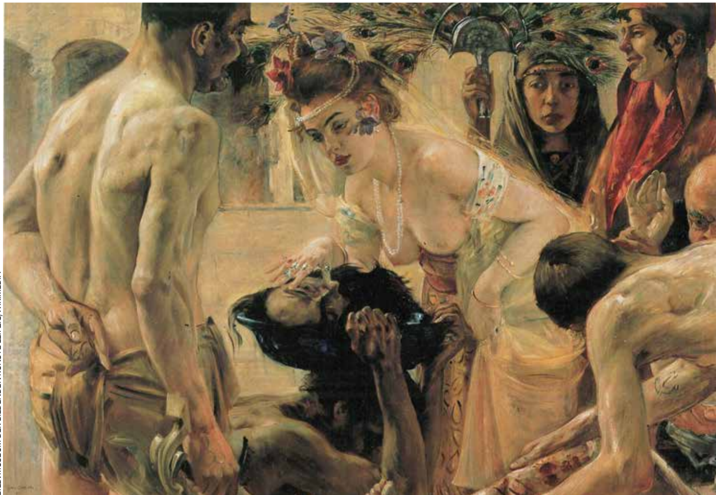
Imponieren durch „ausgefallene Originalität“: Lovis Corinths Gemälde „Salome II“ frei nach dem Skandalstück von Oscar Wilde

Zu seinen ersten Schülerinnen gehört die aus gutem jüdischem Hause stammende Charlotte Berend (1880–1967). Auf einer sommerlichen Studienreise nach Horst an der Ostsee kommen sich die beiden näher. Davon kündigt Corinth vor Ort gemaltes Bild „Mädchen mit Stier“ (1902, Hamburger Kunsthalle). Es zeigt eine befremdliche und dabei komische Szene: Eine fein herausgeputzte junge Dame – Charlotte – steht in freier Na-