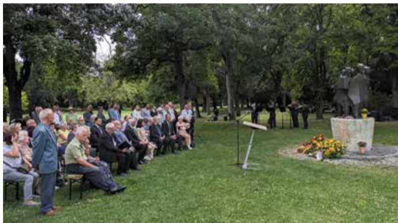
Am Vertriebenenendenkmal im Kurpark Bad Cannstatt: Gedenken an die Opfer von Flucht und Vertreibung