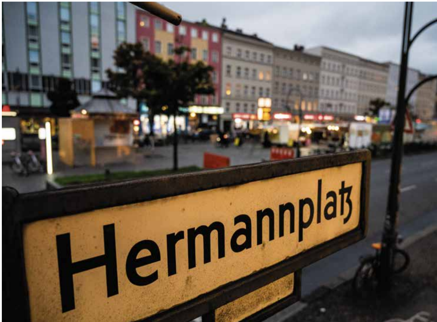
Von Ratten überrascht: Der Hermannplatz in Berlin-Neukölln

Bislang sind die Versuche, die Stadt sauberer zu machen, nicht sonderlich er-