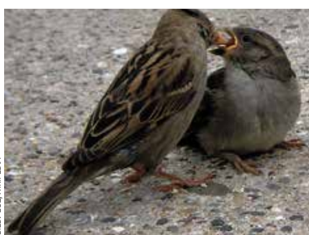
Nachwuchs: Ein Spatzenweibchen füttert sein gerade flügge gewordenen Küken

Wer dies nicht las, konnte sich auch nicht herausreden, denn einmal im Jahr