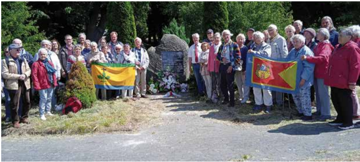
Gedenken an 80 Jahre Kriegsende: Ein Teil der Gruppe, die aus Mecklenburg-Vorpommern angereist ist, mit den Fahnen von Tolkemit und Frauenburg