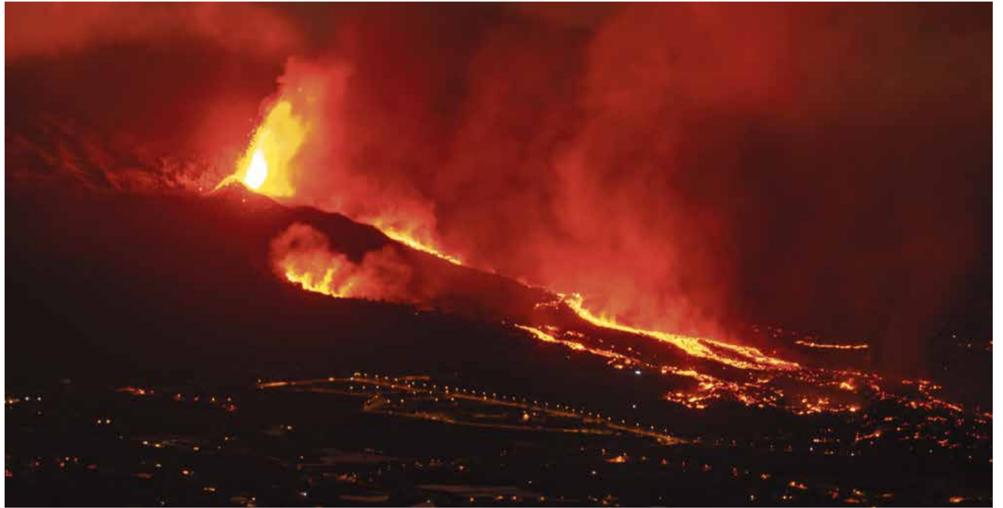
Zerstörte 1600 Gebäude: Vulkanausbruch auf der Kanareninsel La Palma im Herbst 2021

Zusätzlich zu den Phlegärischen Feldern tickt noch eine weitere vulkanische Zeitbombe vor der Südwestküste des italienischen Stiefels. Auf dem Grund des Tyrrhenischen Meeres zwischen Neapel