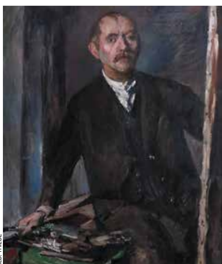
Lovis Corinth: „Selbstbildnis vor der Staffelei“, 1919