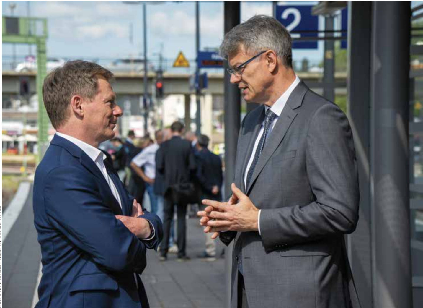
„Da muss sich endlich etwas ändern“, scheint Verkehrsminister Schnieder (r.) gegenüber Bahnchef Lutz (l.) deutlich zu machen

Schnieder stellt vielmehr die Effizienz des bundeseigenen Konzerns in Frage. Angesichts der gewaltigen Summen, die der Bund zuschießt, müsse die Bahn dringend bessere Ergebnisse liefern. Tatsächlich steht der Staatskonzern seit Jahren in der Kritik, weil trotz hoher Investitionen die Qualität für die Fahrgäste zu wünschen übrig lässt. Auch im ersten Halbjahr 2025 waren über ein Drittel aller ICE und Intercity verspätet unterwegs. Nach Bahn-Angaben gingen rund 80 Prozent der Verspätungen auf Probleme mit der Infrastruktur und die zahlreichen Baustellen zurück. Dennoch sind für Bundesminister Schnieder