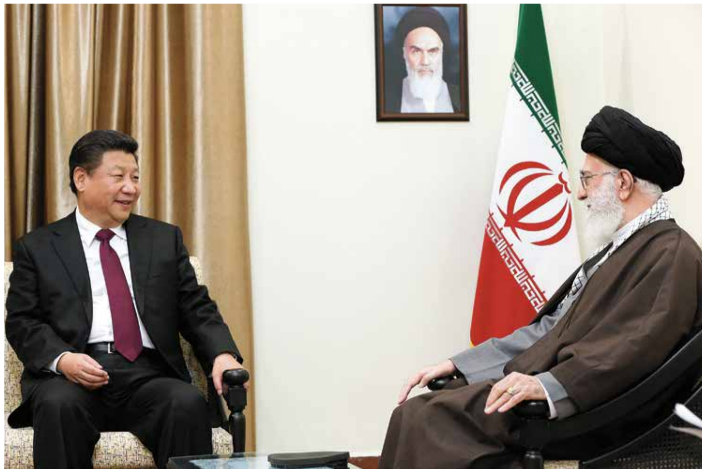
Chinas Präsident Xi Jiping (l.) und Irans Oberster Religionsführer Ali Chamenei (r.): Zwei Machthaber, die meistens nichts Gutes im Schilde führen und für ihre Machtansprüche gern mit ihren Waffenarsenalen eine Drohkulisse aufbauen

Insofern haben die israelisch-amerikanischen Luftangriffe während des Zwölf-Tage-Krieges gegen das Mullah-Regime gravierende Auswirkungen, die weit über die Beeinflussung der Situation im Nahen und Mittleren Osten hinausgehen. So können die USA im indopazifischen Raum künftig wieder stärker auftrumpfen, nachdem das Überlegenheitsgefühl der chinesischen Militär- und Staatsführung durch die Ereignisse im Iran einen massiven Dämpfer erlitten hat.