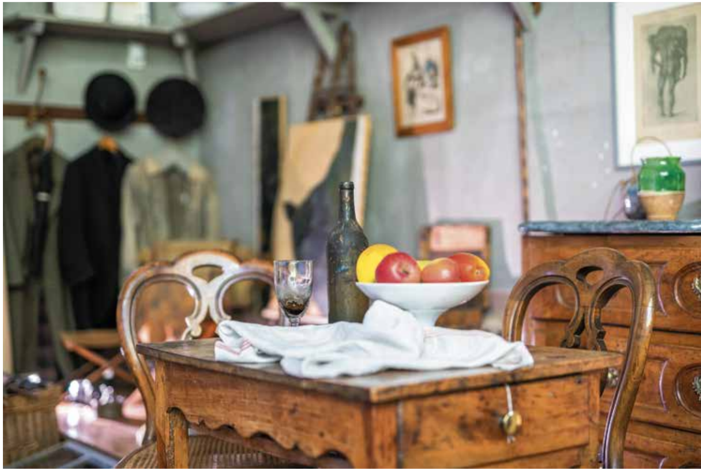
Als warte es darauf, abgemalt zu werden: Im Atelier des Lauves sind viele Stillleben Paul Cézannes entstanden

Spitzenreiter ist Paul Cézanne. Der Stadtrundgang auf den Spuren des promi-