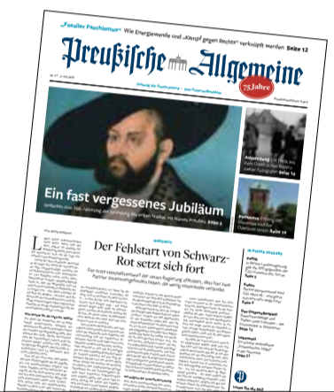
Ausgabe Nr. 27

Ottfried Wallau, Siegburg zum Thema: Die Pfingst-Botschaft: noch nie war sie so nötig wie heute (Nr. 23)