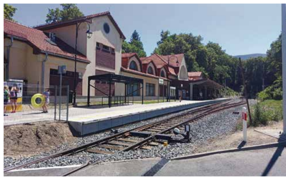
Krummhübel ist nach 25 Jahren wieder mit der Bahn erreichbar

Die Strecke nach Krummhübel ist nicht die einzige, die in Niederschlesien wiedereröffnet wurde. In den vergangenen Jahren gingen bereits Bahnverbindungen nach Bad Flinsberg [Świeradów-Zdrój], Trebnitz [Trzebnica], Langenbielau [Bielawa] und Kotzenau [Chocianów] wieder in Betrieb. Weitere Projekte sind in Vorbereitung, darunter die Reaktivierung der Linien nach Schmiedeberg [Kowary] und Landeshut [Kamienna Góra]. Was jedoch die Wiederherstellung des Tunnelbetriebs angeht, so muss für die