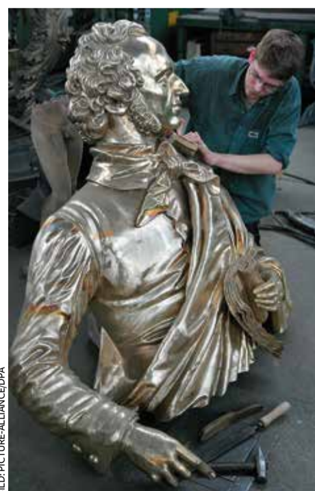
Letzter Schliff in Lauchhammer: Statue des Komponisten Mendelssohn-Bartholdy

zwischen den beiden Weltkriegen kam man in Lauchhammer auf rund 500 Glocken. Davon haben allerdings nur 35 die