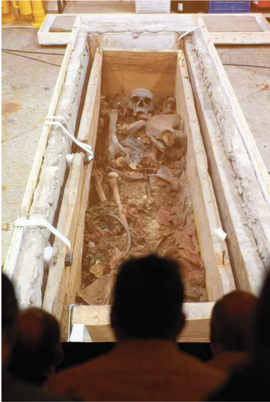
Das Landesamt für Denkmalpflege und Archäologie Sachsen-Anhalt zeigt in der Sakristei des Magdeburger Doms Medienvertretern ein Live-Video, welches das Innere der Holzkiste des Grabes von Otto zeigt

Um Schadensursachen beheben, den Zustand des Holzсарgs im Inneren des Steinkastens überprüfen und maßgeschneiderte Stabilisierungs- und Sicherungsmaßnahmen an der Grablege konzipieren und durchführen zu können, wurde Anfang März unter höchsten Sicherheitsvorkehrungen zunächst die rund 300 Kilogramm