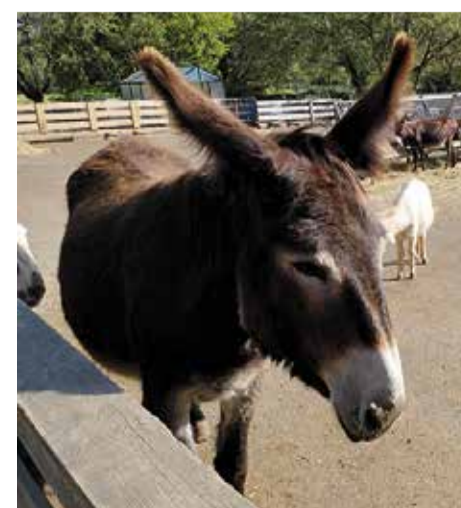
Wartet darauf gekraut zu werden: Streicheltier im Eselpark Maltatal