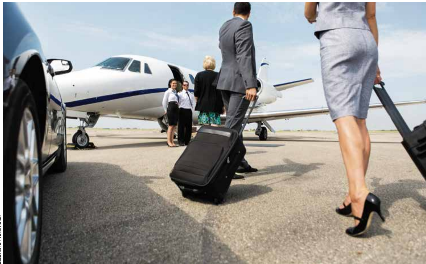
Wenn reiche Menschen aus einem Land abwandern, hat das für diese Nation oft dramatische Folgen: Weniger Kaufkraft, weniger Steuereinnahmen, Abbau von Arbeitsplätzen und auch ganze Unternehmensverlagerungen können drohen

Zudem liegt auch die Körperschaftsteuer vergleichsweise niedrig. Dass die Bundesrepublik dem Beispiel der Emirate in absehbarer Zeit folgen will und kann, ist allerdings illusorisch. Also werden noch deutlich mehr vermögende Menschen auswandern, womit die Steuerlast für den nicht von staatlichen Transferleistungen lebenden Rest der Bevölkerung weiter zunimmt.