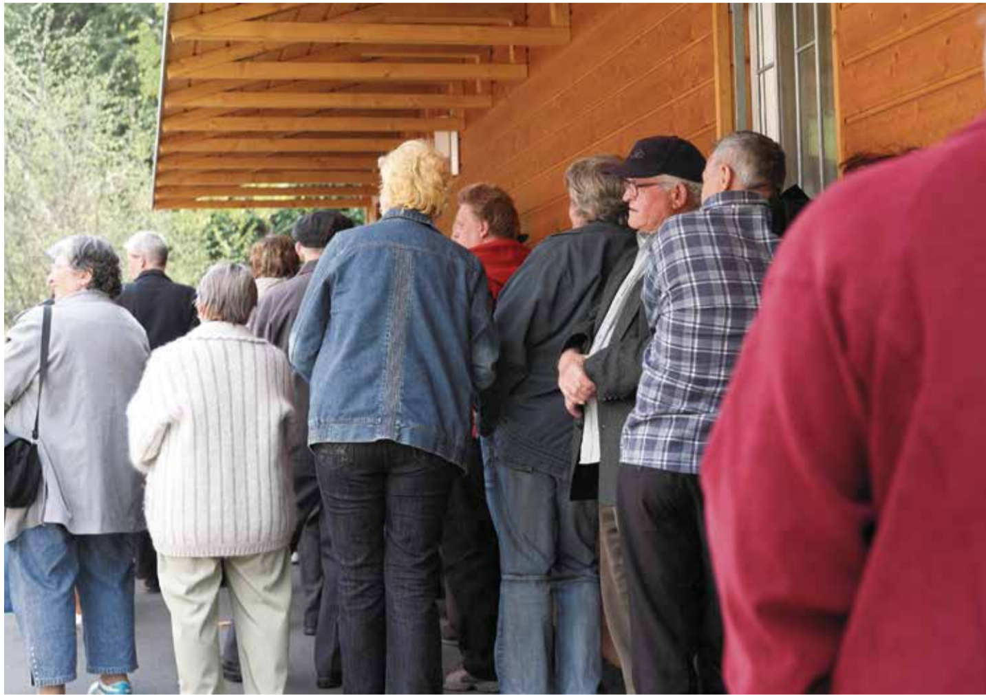
Schlangestehen: Bedürftige wie Rentner und Einkommenschwache holen sich Lebensmittel für wenig Geld bei der Tafel Troisdorf

Velten – In der brandenburgischen Industriestadt Velten, die nördlich von Berlin gelegen ist, ist ein Stadtverordneter von der CDU zur AfD übergetreten, die damit künftig über sieben Mandate verfügt, während die CDU nun mit zwei Mandaten den Fraktionsstatus verliert. Die Stadtverordnetenversammlung umfasst 22 Mandate. Die SPD stellt genau wie die Initiative Pro Velten fünf Sitze. Die Linkspartei und die Heimat (Ex-NPD) entsenden jeweils einen Vertreter. Im September wählen die Menschen in Velten einen neuen Bürgermeister. Die SPD will auf eine Kandidatur verzichten. Neben der CDU und einem parteilosen Bewerber werden den Kandidaten von Pro Velten und der AfD die besten Aussichten eingeräumt. Das neue Stadtoberhaupt wird für kommende acht Jahre gewählt. Der AfD-Landesvorsitzende Rene Springer ist optimistisch: „Dies ist erst der Anfang. Die AfD ist die gestaltende Kraft der Zukunft.“ F.B.