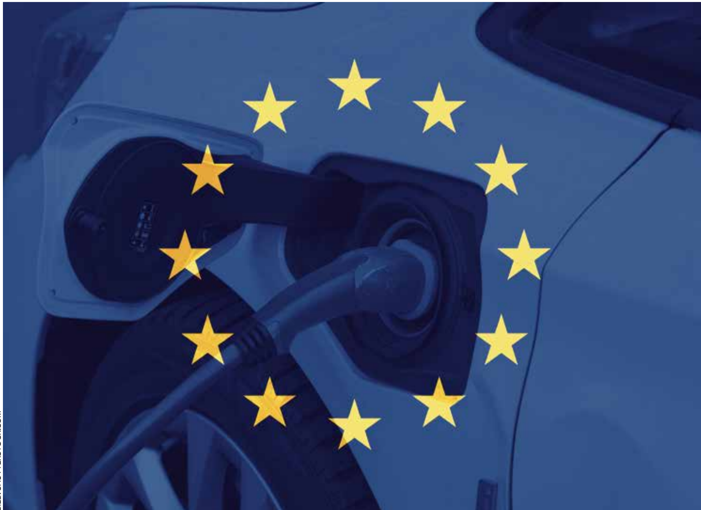
Auch wenn die Verbraucher es nicht wollen: Die EU drängt auf die E-Mobilität trotz extrem zu wenig Ladestationen

Ebenfalls auf den Gebrauchtwagenmarkt zielt eine Idee der EU-Kommission ab, die im Mai bekannt wurde. Dabei geht es um die Einführung einer jährlichen Pflichtinspektion für Autos, die älter als zehn Jahre sind. In Deutschland sind dies laut ADAC mehr als 23,4 Millionen Pkw. Nach Angaben des Automobilclubs liegt der Anteil solcher Autos bei 47,1 Prozent. Offiziell begründet die EU-Kommission ihren Vorstoß mit dem Ziel, die Zahl der Verkehrsunfälle und der Unfallopfer zu senken. Aus Sicht des ADAC würde eine jährliche Hauptuntersuchung jedoch einen hohen Aufwand bedeuten, ohne dass ein relevanter Sicherheitsgewinn nachweisbar wäre.