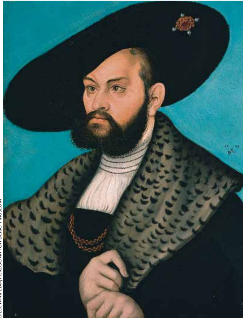
Markgraf Albrecht von Brandenburg-Ansbach war der Hofer Prominente des Monats: Bildnis des Markgrafen von Lucas Cranach d. Ä., 1528

Erst eineinhalb Jahre nach seiner Wahl machte er sich auf den Weg über Nürnberg und Berlin nach Königsberg und fand ein verarmtes und politisch akut gefährdetes Land vor. Wie geplant verweigerte er dem polnischen König Sigismund I. den Lehnseid. Dies hatte zur Folge, dass es 1519 zum Reiterkrieg gegen Polen kam, der überraschenderweise trotz der