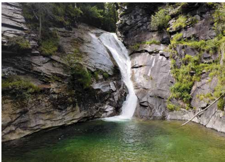
Könnte eine perfekte Wasserrutsche sein: Bei den Gössfällen

www.kaernten.at www.katschberg.at www.maltatal.com