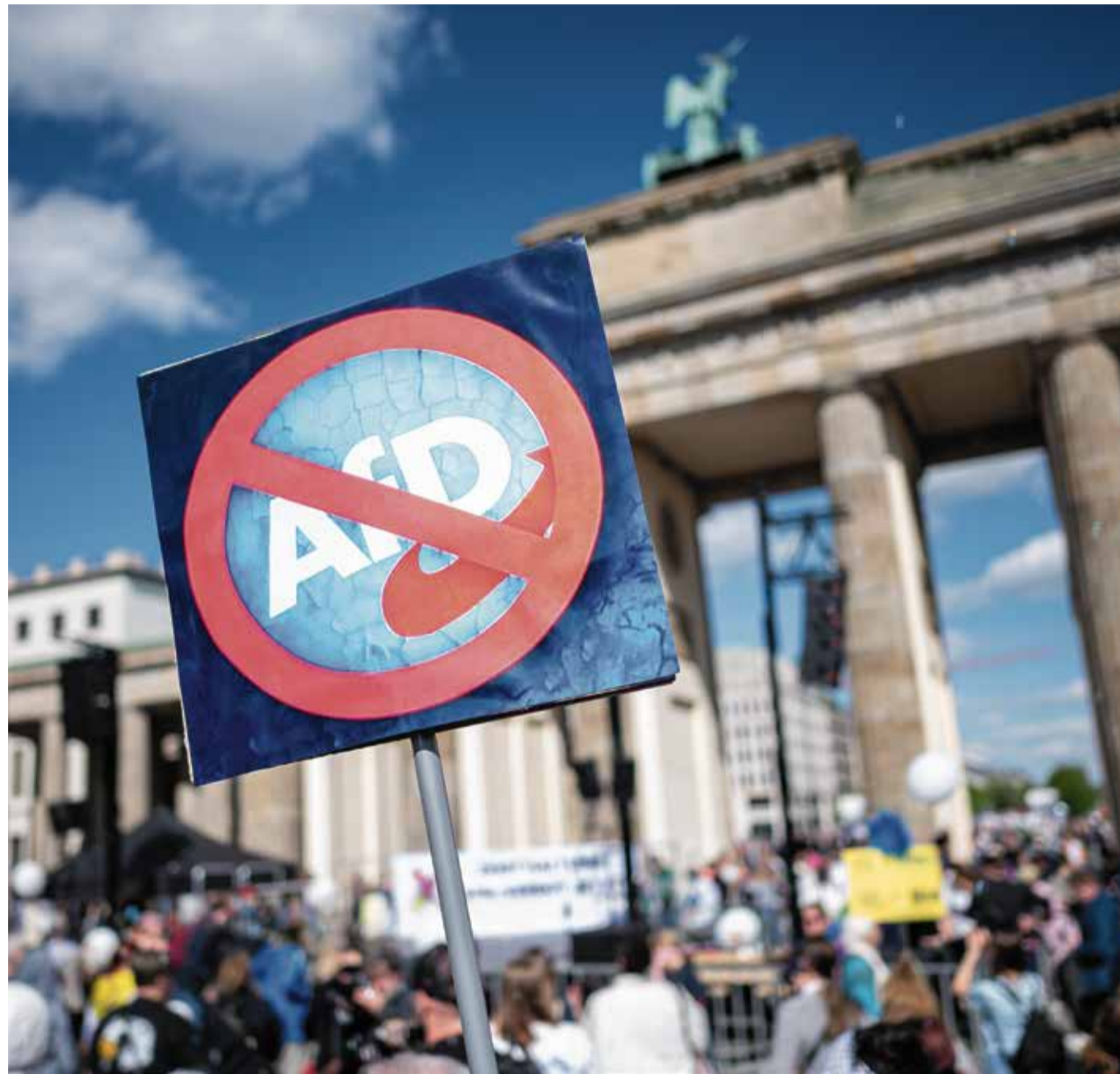
Verzweiflung eines scheiternden politischen Milieus: Die Rufe nach einem Verbot der AfD

Töricht waren auch Warnungen dahingehend, man dürfe niemals Diagnosen der AfD übernehmen, sondern müsse ihnen alternative Deutungen entgegensetzen. Doch es hängt