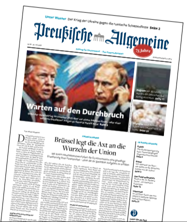
Ausgabe Nr. 30