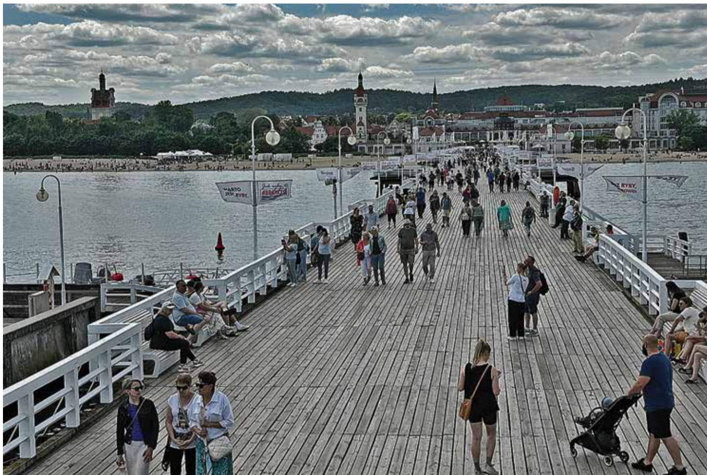
Der Seesteg Zoppot: Er ist einzigartig und in ein Ensemble eingebettet, das seit den 1920er Jahren fast unverändert besteht

Im Eingangsbereich des neuen Bauwerks kann man shoppen, einen Imbiss nehmen, in einem Café seinen Latte Macchiato genießen, von seinem Eisbecher naschen oder in einem Restaurant speisen. Am Anlegesteg auf dem Brückenkopf herrscht im Sommer durch das sogenannte „Seebrücken-Hopping“ reges Leben. An manchen Tagen kommen dort 200 Passagiere mit dem Ausflugsdampfer