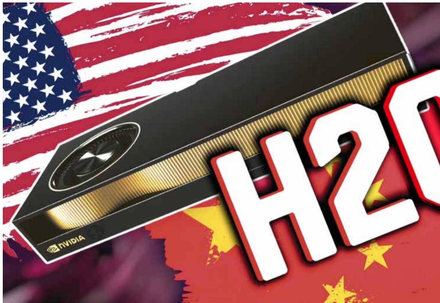
Chips und Daten als Rohstoff des 21. Jahrhunderts

Warschau – Polens Außenministerium warnt seine Bürger vor Reisen nach Russland und ruft alle Polen auf, die sich auf dem Boden der Russischen Föderation befinden, in die Heimat zurückzukehren, außer sie seien familiär oder beruflich in Russland gebunden. Landsleute mit russischem Pass warnt man, dass diese mit allen Konsequenzen russische Staatsbürger geworden seien. Als Gründe für den Appell nennt das Ministerium den Krieg in der Ukraine und die Schließung mehrerer polnischer Generalkonsulate in Russland sowie der damit verbundenen Reduktion des konsularischen Personals. Russland und Polen haben sich einen Schlagabtausch mit der gegenseitigen Schließung diplomatischer Vertretungen geliefert. Davon betroffen ist auch das polnische Generalkonsulat in Königsberg. Bürger, die Visa oder sonstige offizielle Dokumente benötigen, müssen mit Unannehmlichkeiten rechnen. MRK