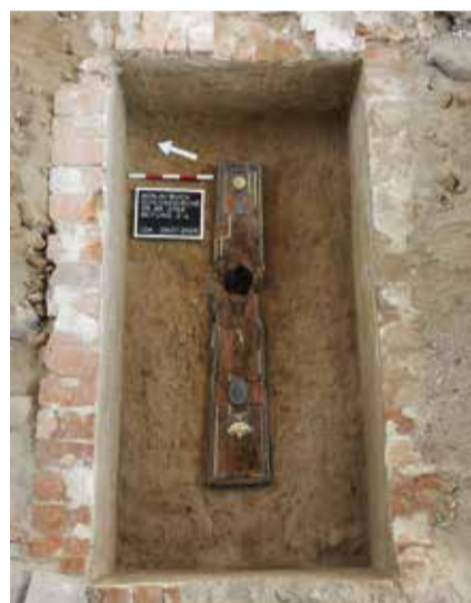
Grablege der Juli von Voß

Bereits am 8. Juli haben Mitarbeiter des Berliner Landesdenkmalamtes in der Schlosskirche Reste eines Prunksargs aus dem späten 18. Jahrhundert freigelegt. „In der rechteckigen, gemauerten und mit Erde verfüllten Gruft fand sich der gut erhaltene, mit zahlreichen vergoldeten Leisten und Medaillons verzierte Holzarg“, so die Beschreibung von Sebastian Heber, Abteilungsleiter beim Landesdenkmalamt Berlin. Die Behörde stuft den Fund als außergewöhnlich ein. Der gefundene Sarg liefert aus Sicht der Denkmal-schützer und Archäologen wertvolle Einblicke in eine herausragende Frauenbestattung am Ende des 18. Jahrhunderts. Das Grab und die Gruft sollen durch Archäologen nach ihrer Erfassung und Dokumentation gesichert, wieder verschlossen und am Originalstandort erhalten werden. Wie das Landesdenkmalamt mitteilte, ist das Grab nicht markiert oder mit einem Grabstein versehen worden. Eine Sprecherin des Landesdenkmalamtes erklärte: „Um absolut sicher zu sein, müsste der Sarg geöffnet und DNA-