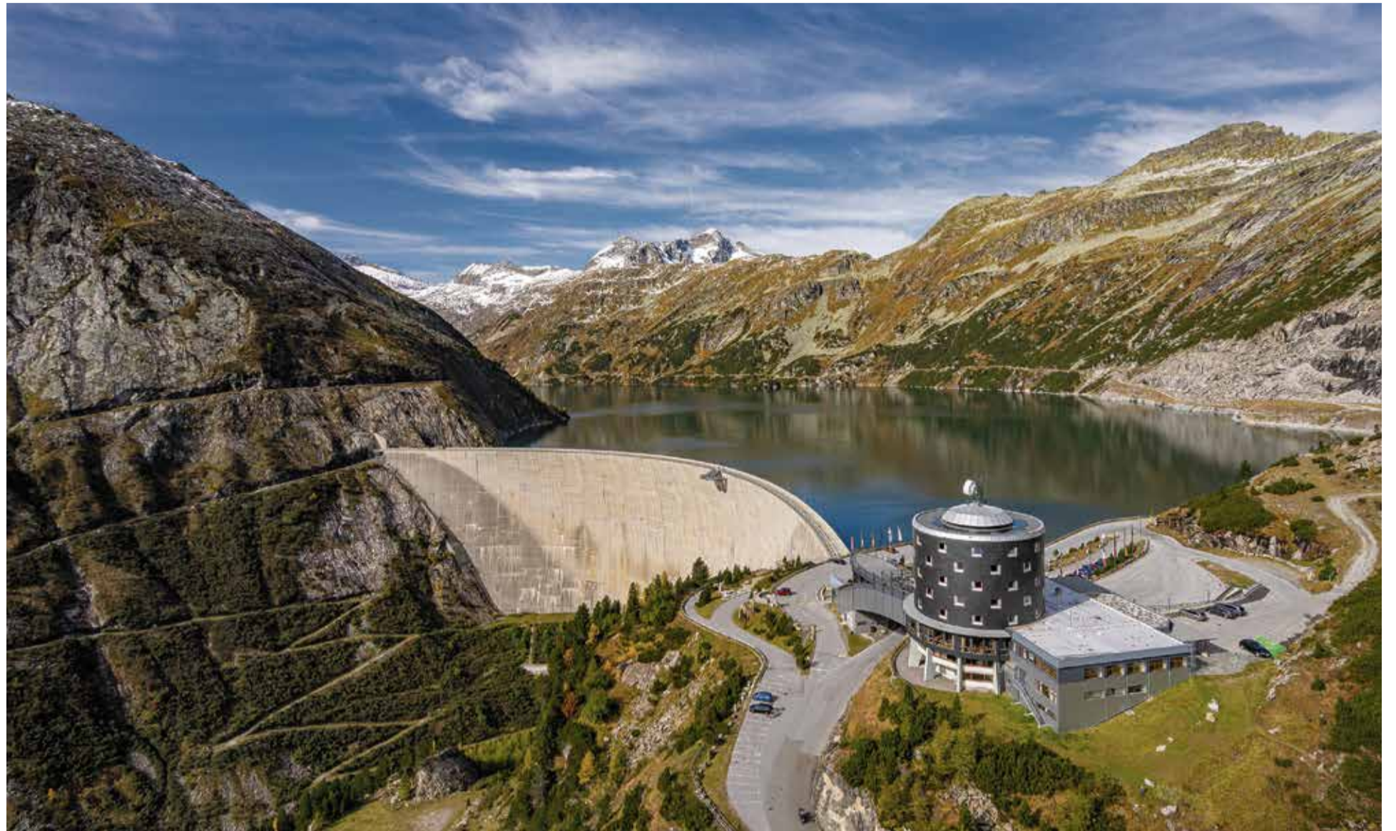
Beeindruckendes Bauwerk: Die 200 Meter hohe Staumauer des Kölnbreinspeichers ist samt Hotel nur im Sommer über eine Hochalmstraße zu erreichen

Hinzu kommen noch Mautgebühren für den Weg dorthin auf der Malta-Hochalmstraße. Doch die Kolonnen an Auto-