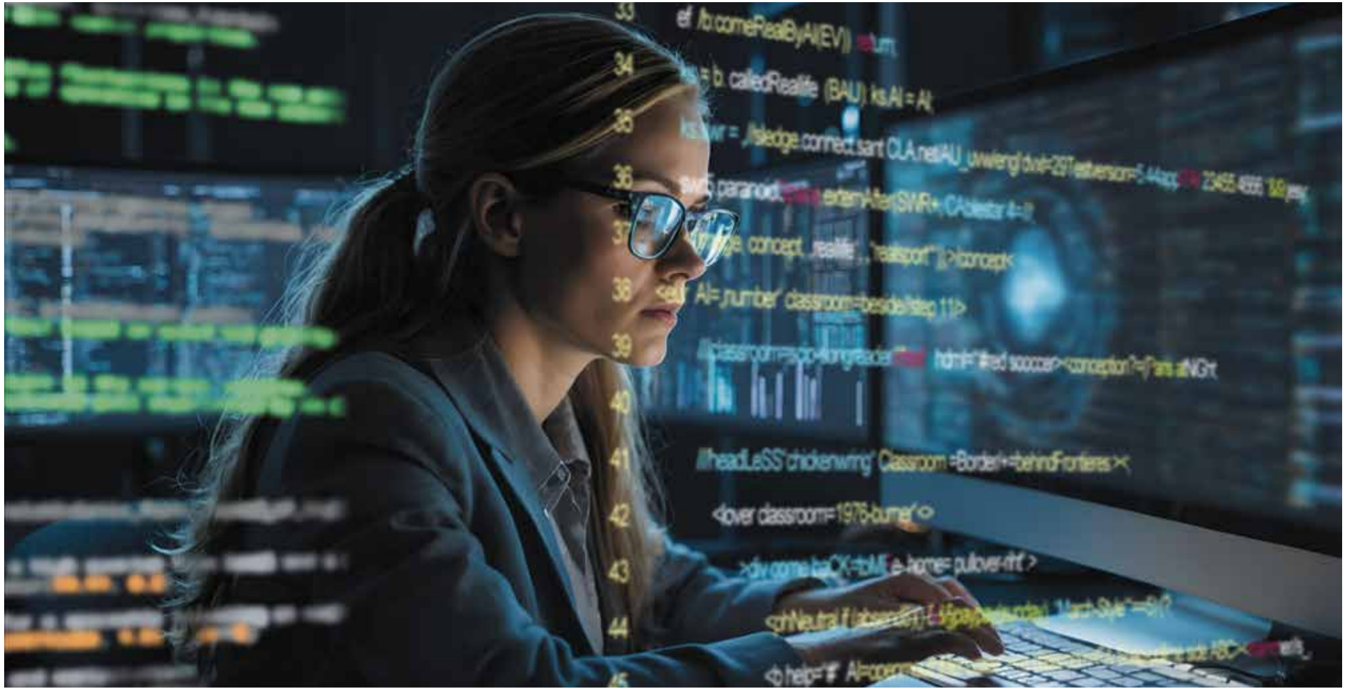
Bill Gates hielt es 1993 für eine kurzzeitige Modeerscheinung: Das Internet, heute Rückgrat der globalen Massenkommunikation

Und 1902 gab der kanadische Astronom Simon Newcomb, welcher Ehrenmitglied von acht Akademien der Wissenschaften rund um die Welt und Präsident der American Mathematical Society war, die folgende Stellungnahme ab: „Mit Maschinen fliegen zu wollen, die schwerer