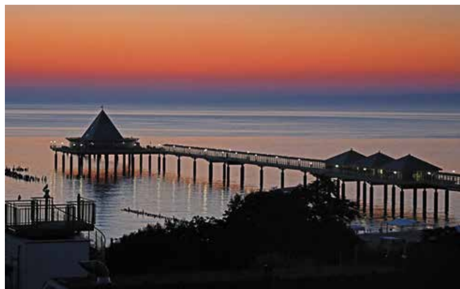
Heringsdorf: Stimmungsvolle Sonnenaufgänge an der Ostsee genießt man gerne