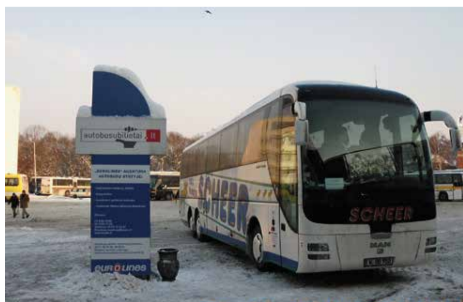
Bei Eis und Schnee, Wind und Wetter fuhren die Scheer-Busse in die deutschen Ostgebiete, nach Ostpreußen, Litauen, Memel oder Königsberg

Häufig erlebte ich, wie gespannt meine Reisegäste sich in der veränderten Umgebung umschaute und alles in sich aufnahm.