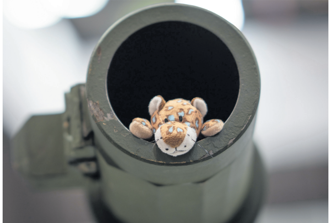
Es wird eng für die Automobilindustrie, die zunehmend personell zum Kanonenfutter der Rüstungsindustrie wird

Landsmannschaft Ostpreußen: www.ostpreussen.de Büro: info@ostpreussen.de