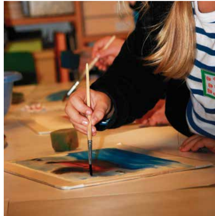
Kinder malen inspiriert durch die Kunstgeschichte von 200 Jahren: Ferienprogramm im Ostpreußischen Landesmuseum

Ostpreußisches Landesmuseum mit Deutschbaltischer Abteilung. Heiligengeiststraße 38, 21335 Lüneburg