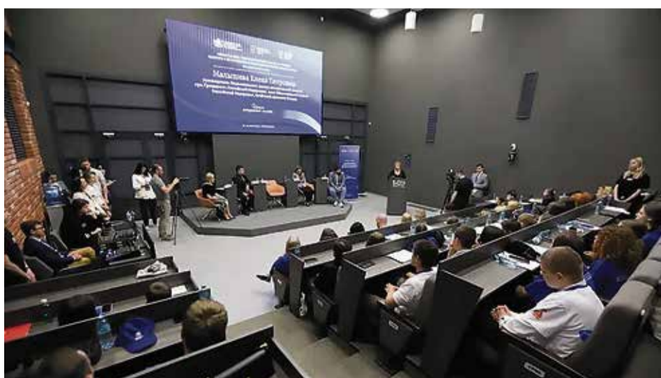
Veranstaltung in der Albertina: Vortrag zum Wettbewerb „Gemeinsames Erinnern“