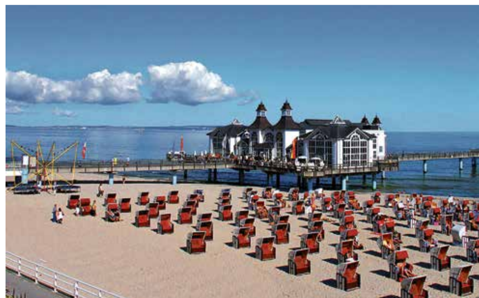
Sellin auf Rügen: Sie gehört zu den „Schönen“ und ist Wahrzeichen des Seebades