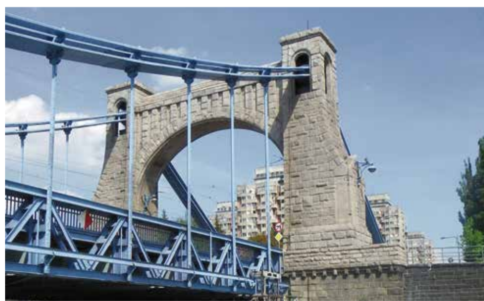
Löst bei manchen heftige Emotionen aus: Nach der Sanierung soll die deutsche Inschrift auf die Kaiser-Wilhelmbrücke in Breslau zurückkehren