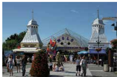
Misdroy: Mit „Erlebnisbereich“

Nach dem Ausbruch des Ersten Weltkrieges wurde befürchtet, der Landungssteg könnte von den Russen genutzt werden. Kurzerhand sprengten Swinemünder Pioniere dessen seeseitiges Drittel mit dem Café in die Luft. Erst 1921 wurde die Brücke erneuert. Sie maß nun nur noch 200 Meter. Im Jahre 1954 beschädigte ein Sturm im nunmehr polnischen Ostseebad Misdroy das Bauwerk. Sechs Jahre später brannte der Eingangsbereich durch die Unachtsamkeit eines Strandkorbwäglers nieder. Schließlich verfiel die Brücke mehr und mehr, sodass sie im Jahr 1985 aus Sicherheitsgründen gesperrt werden musste. Zehn Jahre später errichtete man eine neue, lediglich 120 Meter lange Seebrücke, die sich allerdings nur zum Promenieren eignete. Schließlich war im Frühjahr 2003 Baubeginn für deren Ver-