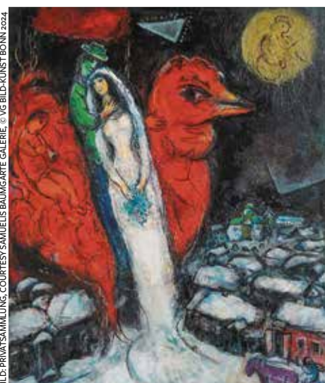
Traumhaft entschwebt: Chagalls „Liebespaar mit rotem Hahn“, 1956–1965

● „Chagall“, bis 10. August in der Kunstsammlung NRW / K20, Grabbeplatz 5 in Düsseldorf, geöffnet täglich außer montags von 11 bis 18 Uhr, Eintritt: 16 Euro. Der Katalog kostet 39,90 Euro www.kunstsammlung.de