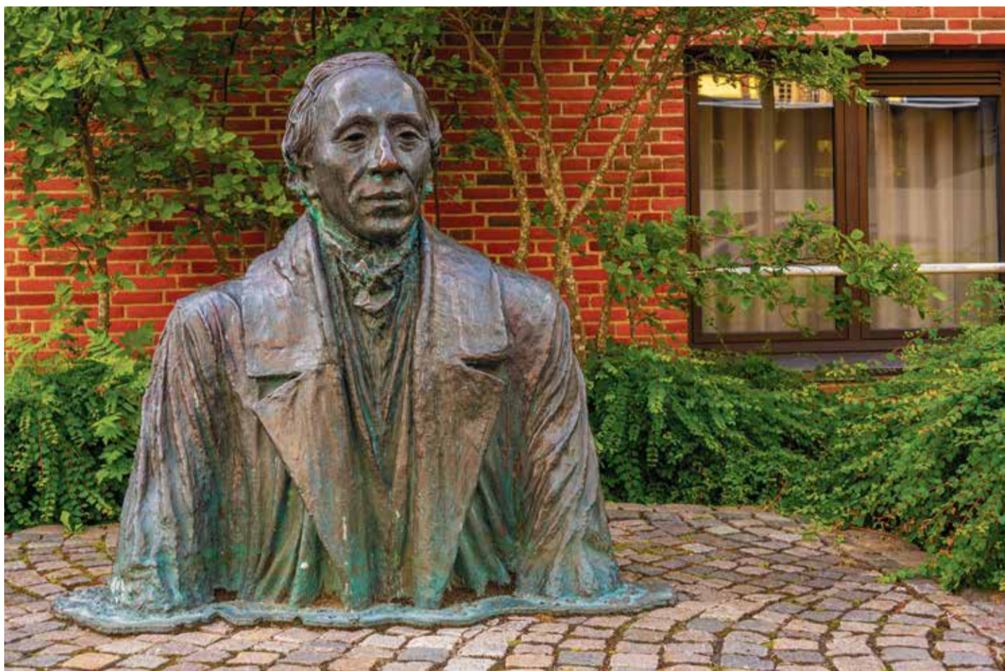
Schmilzt vor sich dahin: Eine der vielen Andersen-Statuen in Odense

Mit 14 Jahren zog er nach Kopenhagen, versuchte sich zunächst als Sänger und Schauspieler, bevor ihn Förderer wie der Direktor des Kopenhagener Königlichen Theaters, Jonas Collin, unterstützten. Ein königliches Stipendium ermöglichte Andersen den Weg zur Bildung. 1835