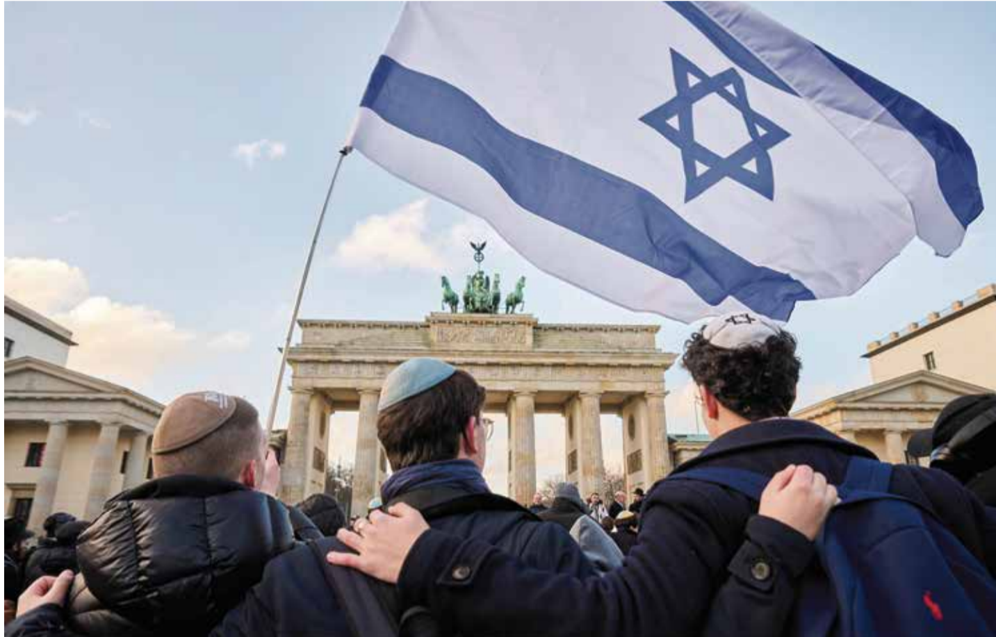
Mit Kippa oder Davidstern können sich Juden in Berlin nicht mehr zeigen. Zu groß ist die Gefahr, von arabischstämmigen Migranten, islamischen Asylsuchern oder links Verblendeten brutal attackiert zu werden

„BILD“ stellte am Folgetag zu Recht fest, dass die Teilnehmer der verbotenen Demo, die lange genug geblieben waren, straffrei nach Hause gehen konnten.