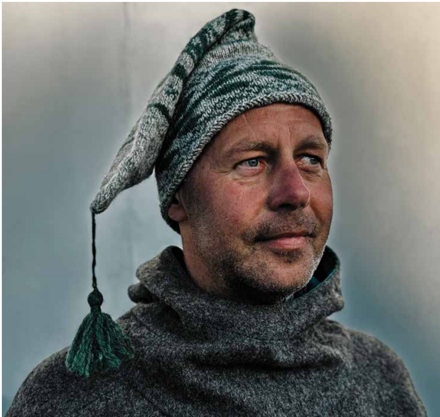
Zünftig: Mit der Mütze, die auch noch gefüttert ist, kann man dem Wetter trotzen

All das hat dann doch noch weitere Wellen geschlagen, sodass nun wieder pommersche Pottmützen gestrickt werden. Längst ergänzen sie perfekt die ebenfalls aus der Wolle der Pommernschaf