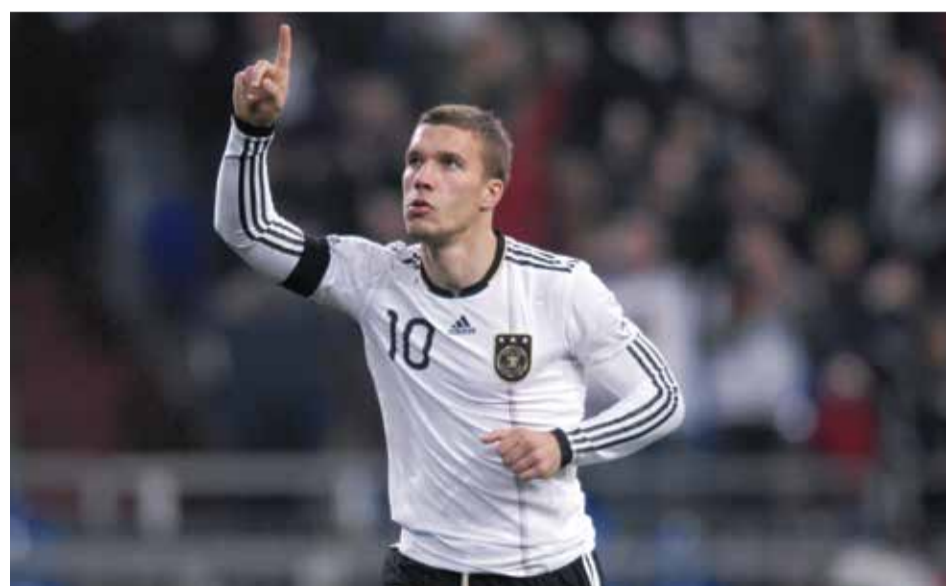
So liebten ihn die deutschen Fußball-Fans: Lukas Podolski in Jubelpose, wenn er mal wieder ein spektakuläres Tor erzielt hat

Seit 2021 spielt Podolski beim polnischen Verein „Górnik Zabrze“ (Berg Hindenburg). Das ist der Nachfolgeverein des „SC Preußen 1910 Hindenburg-Zaborze“, der vor 1945 oft um die deutsche Meisterschaft mitspielte und einen Spieler beim ersten deutschen Weltmeistertitel 1954 in Bern stellte. Auch mit jetzt 40 Jahren hat Podolski noch lange nicht genug vom Fußball. Der Weltmeister geht in seine