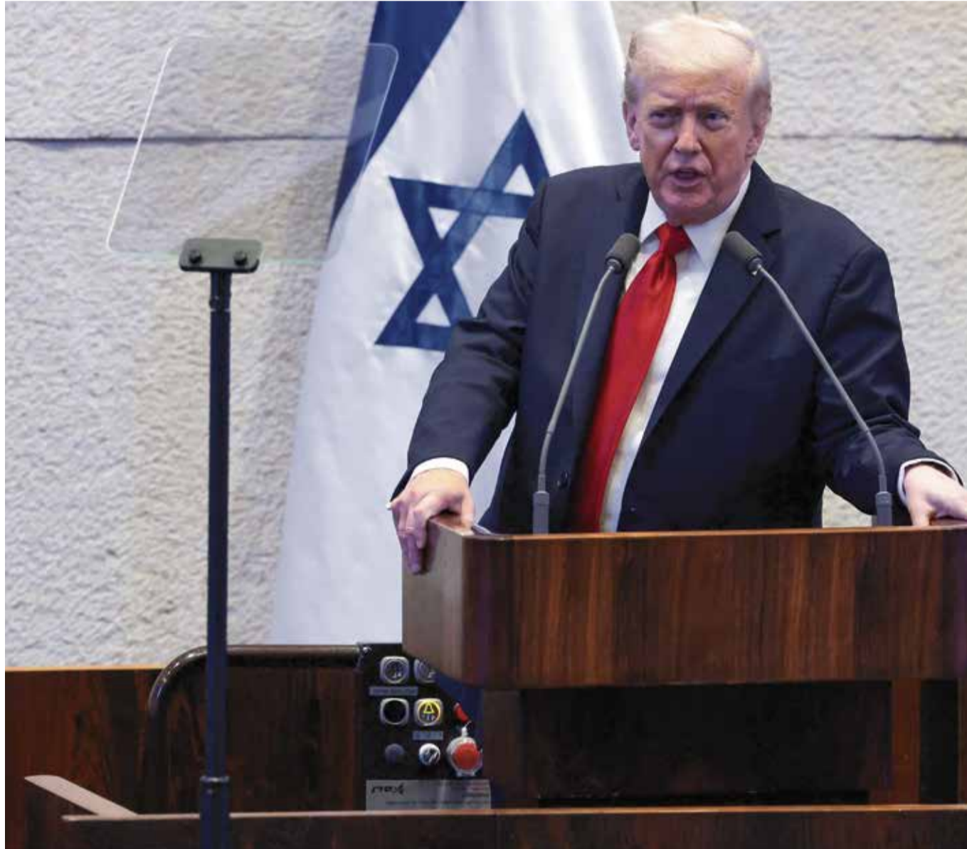
Historischer Augenblick: Nach der Freilassung der letzten israelischen Geiseln sprach US-Präsident Trump vor der Knesset. Doch auf dem Weg des Friedens sind noch viele Hürden zu überwinden

Punkt 6 des Plans geht implizit vom Fortbestehen der Hamas innerhalb Gazas aus. Hamas-Leute, „die sich zu friedlicher Koexistenz und zur Abgabe ihrer Waffen verpflichten“, erhalten Amnestie. Das heißt, sie werden nicht verfolgt oder strafrechtlich belangt. Ein Recht zur Ausreise wird ihnen zubilligt. Aber dies impliziert auch ein Bleiberecht, das darüber hinaus explizit in Punkt 12 festgeschrieben wird. Wird Israel hinnehmen, dass Hamas-Mitglieder weiterhin im Gaza-Streifen leben und agieren, wenn sie sich nur – rein formal – zu friedlicher Koexistenz bereifinden? Könnten nicht viele Israelis in einer solchen Präsenz eine Keimzelle für neue Radikalisierung sehen? Und könnte nicht die Hamas hieraus eine Legitimierung für weitere politische Aktivitäten in Gaza ableiten? Könnte dies wiederum auf israelischer Seite Zweifel daran wecken, dass Gaza eine „deradikalisierte, terrorfreie Zone“ darstelle?