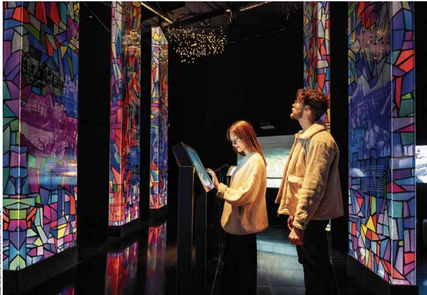
Kunstvoll interaktiv erzählte Geschichte: Das multimediale Museum Brama Poznania (Posener Tor)

Bereits am 25. Dezember desselben Jahres wurde sein Sohn Mieszko II. Lambert in Gnesen zum zweiten König Polens gekrönt – ein Zeichen der dynastischen Kontinuität, aber auch ein Hinweis auf die politischen Spannungen jener Zeit. Seine Herrschaft war von inneren und äußeren Konflikten geprägt, und bei seinem Tod im Jahr 1034 war das mühsam aufgebaute Reich deutlich geschwächt.