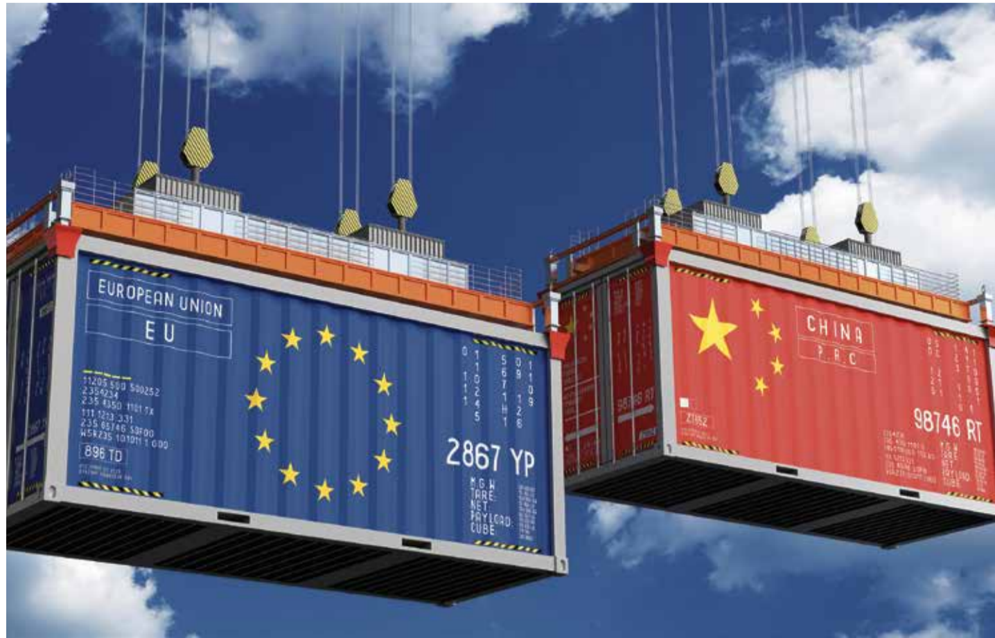
China verdrängt die EU auf allen Feldern – und Europa lässt sich hängen

Rom – Nach mehr als 700 Jahren hat der Vatikan eine zeremonielle Rehabilitierung des am 22. März 1312 aufgelösten Ordens der Armen Ritterschaft Christi und des salomonischen Tempels zu Jerusalem vorgenommen. Dieser erste Ritterorden der Geschichte, dessen Gründung 1118 erfolgte, war einer Intrige des französischen Königs Philipp IV. und des Papstes Clemens V. zum Opfer gefallen. Noch vor der Hinrichtung ihres letzten Großmeisters Jacques de Molay flohen viele der Tempelritter aus Italien und Frankreich und gründeten im Exil Nachfolgeorganisationen. Zu diesen gehört die spanische Vereinigung Souveräner Orden des Tempels von Christus, die 2023 Klage gegen den damaligen Papst Franziskus einreichte, um Schadenersatz für die Beschlagnahme der Ordensbesitztümer zu erstreiten. Die Tempel feierten das nunmehrige Einlenken des Vatikans mit den Worten „An die Eliten: Ihr seid nicht die einzige Macht auf dieser Welt!“ W.K.