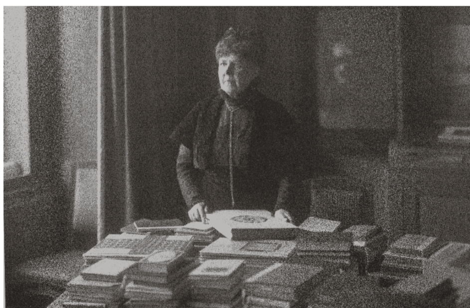
Elisabeth Förster-Nietzsche