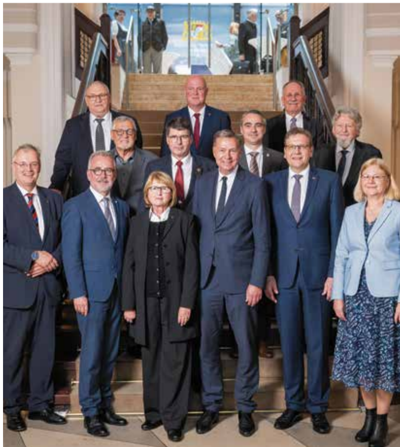
Das neugewählte Präsidium des Bundes der Vertriebenen präsentiert sich mit Neu-Präsident Stephan Mayer (4.v.l.).