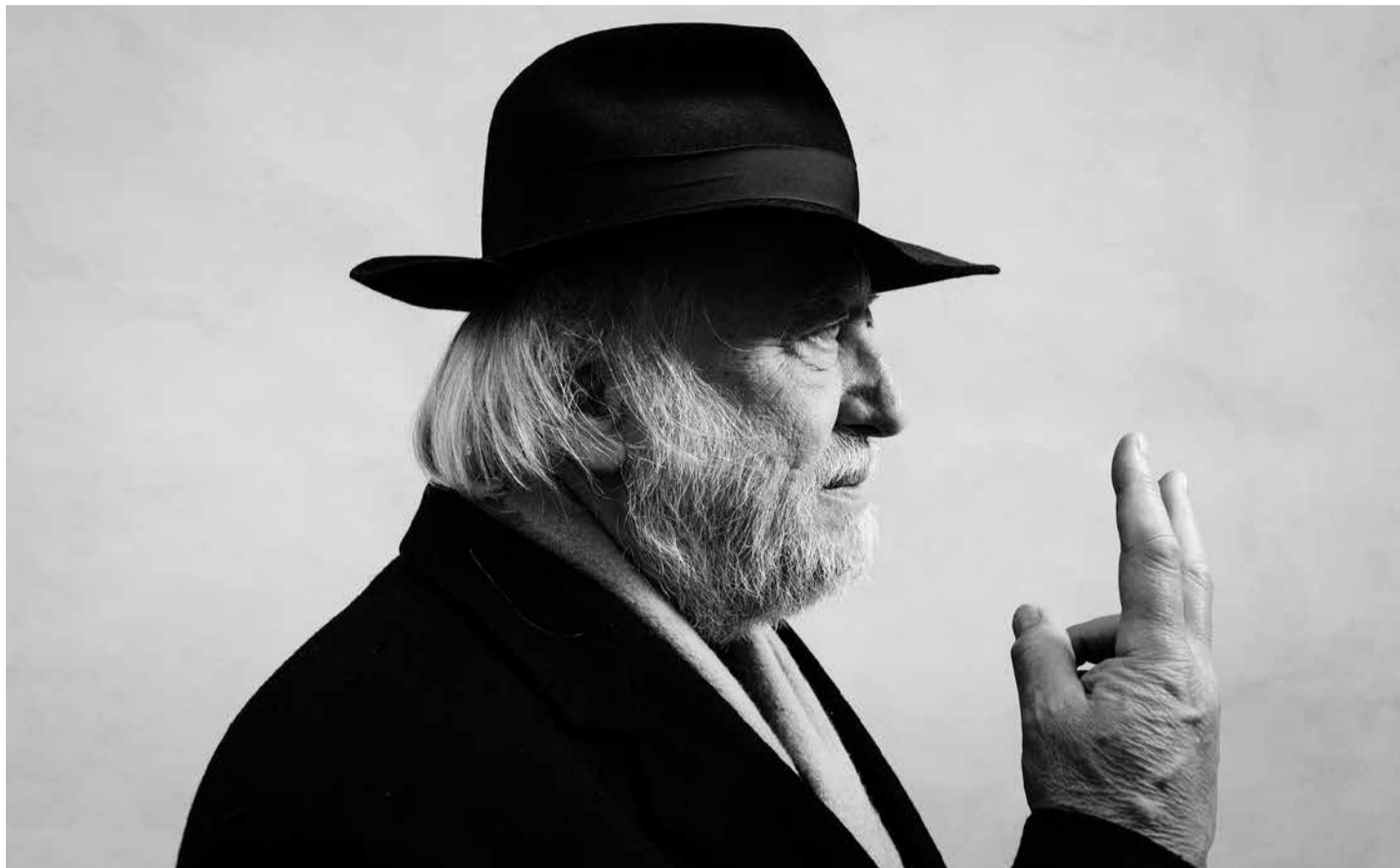
Würdiger Preisträger: Der ungarische Autor László Krasznahorkai

Das Nobelpreiskomitee würdigte den Ungarn mit folgenden Worten: „... für sein fesselndes wie visionäres Werk, das inmitten apokalyptischen Schreckens die Macht der Kunst bekräftigt“. Die erste Reaktion von Krasznahorkai auf diese Ehrung war bezeichnend für seinen schalen Humor: Dem schwedischen Radio erklärte er, dass er ruhig und unruhig zugleich sei, denn: „Es ist bisher der erste Tag, an dem ich den Nobelpreis erhalten habe.“ Der Erfolgsautor wurde am 5. Januar 1954 in der südosteuropäischen Kleinstadt Gyula nahe der rumänischen Grenze geboren. Diese entlegene Gegend wird in Ungarn als „Sturmecke“ bezeichnet, weil sie dem Land stürmische Umbrüche und wetterfeste Charaktere bescherte. Krasznahorkai ist ein ebensolcher sturmerprobter und erdverwachener Schriftsteller. Seine Werke sind voller Wucht und von erschlagender Stärke, erzählerischer Klarheit und tiefen Gedanken.