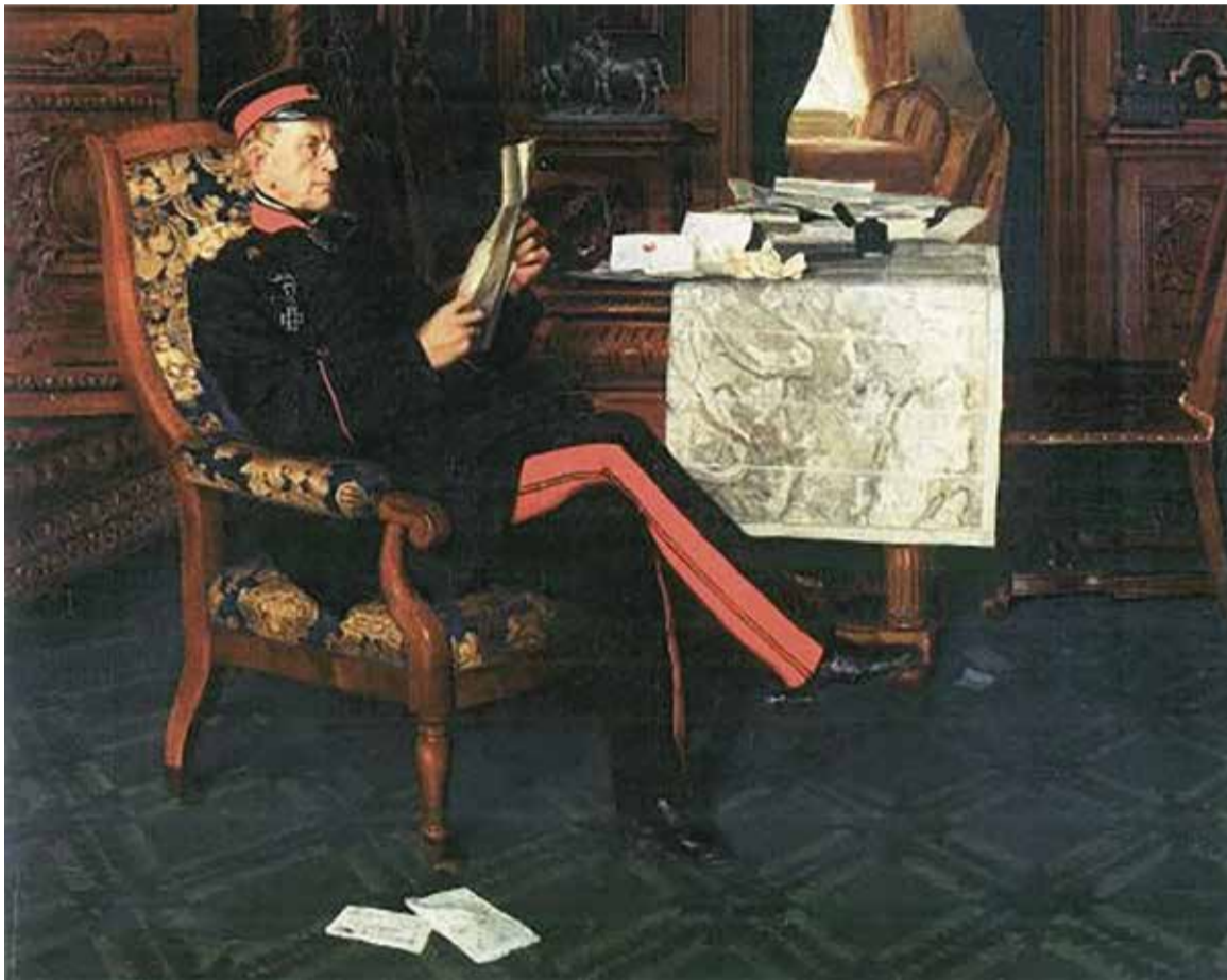
Ein extrem belesener Militär: Helmuth von Moltke

Vor 225 Jahren kam das militärische Pendant zum Reichsgründer Otto von Bismarck in Parchim zur Welt – 1. Teil: 1800–1840