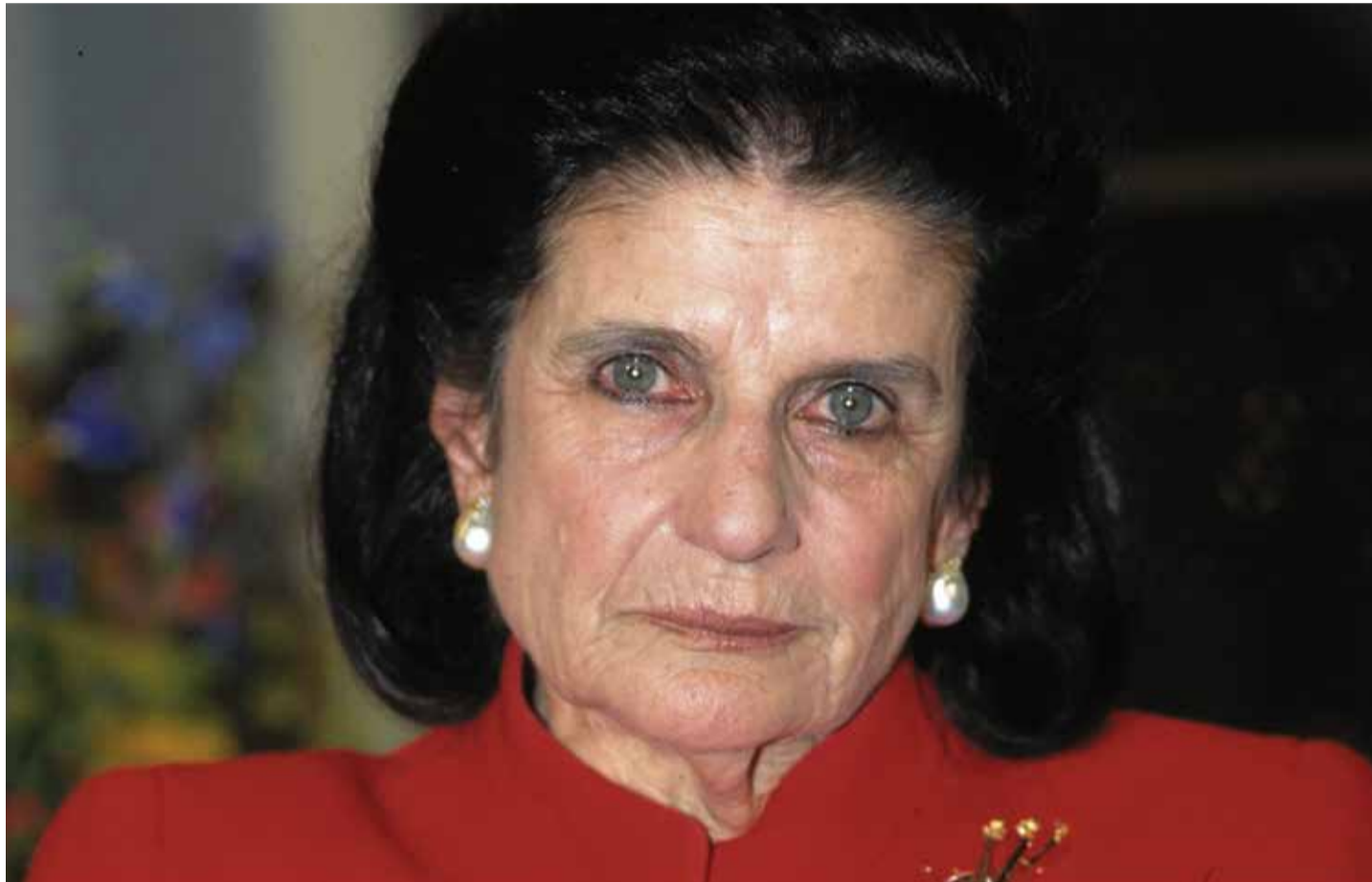
Leah Rabin geborene Schloßberg erblickte am 28. April 1928 das Licht der Welt in Königsberg. Noch kurz vor ihrem Tod bekannte sie sich offen und voller Stolz zu ihrer ostpreußischen Herkunft

Im Sommer 1941 traf die damalige Zehntklässlerin in einer Tel Aviver Eisdielen dann auf Jitzchak Rabin, der ihr so gleich wie „die Reinkarnation des biblischen Königs David“ erschien. Der 19-jährige war Mitglied der jüdischen paramilitärischen Untergrundorganisation Palmach und nahm an militärisch riskanten Kommandounternehmen teil. 1948 erhielt er den Befehl über die Harel-Brigade der Palmach, während sich nun auch Leah Schloßberg in der Palmach engagierte. In erster Linie studierte sie aber Pädagogik,