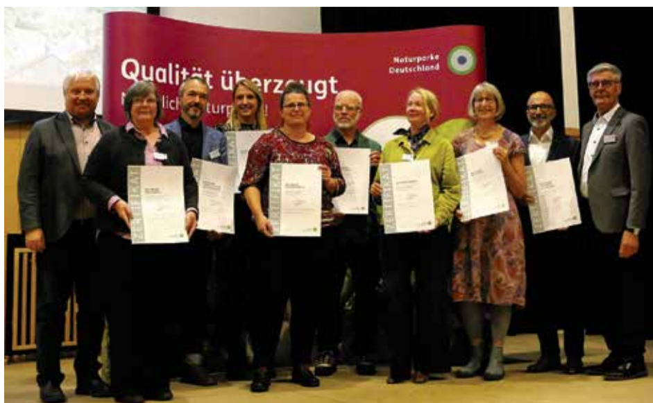
Beim Jubiläumfest: 14 Naturparke erhielten in Pasewalk eine Auszeichnung

lichen Schaugärten zeigt. Ganzjährig kann man sich dort daran erfreuen.