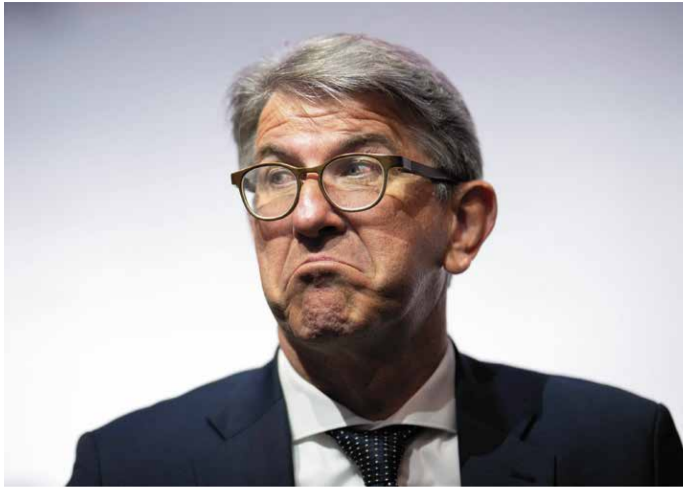
Kulturstaatsminister Weimer will bei den linksextremen Verlagen nichts Verdächtiges bemerkt haben

Landsmannschaft Ostpreußen: www.ostpreussen.de Bundesgeschäftsstelle: info@ostpreussen.de