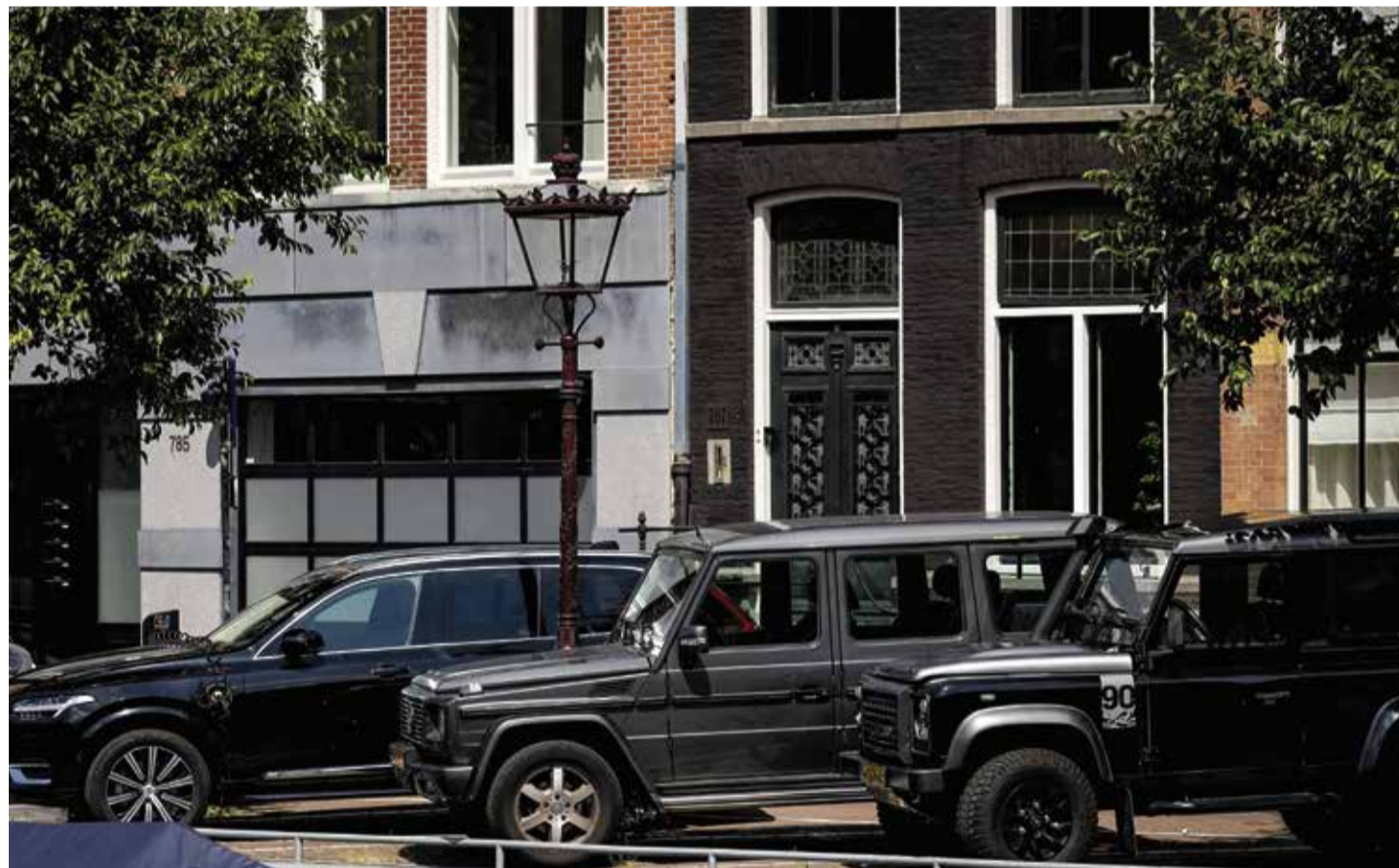
Ob Volvo, Mercedes oder Landrover – all diese SUVs füllen eine Parklücke genauso aus wie ein Klein- oder Mittelklassewagen, von denen hier beispielsweise auch nicht mehr hingepasst hätten

Gleichzeitig halten Experten auch den Vorwurf, dass SUVs „mehr Menschen töten als andere Fahrzeuge“, für falsch. Zwar wirke sich die höhere Masse der SUVs bei Unfällen ungünstig für andere Verkehrsteilnehmer aus, allerdings spiele das letztlich doch nur eine untergeordnete Rolle, weil die Geschwindigkeit der beteiligten Fahrzeuge der entscheidende Faktor sei. Daher kommt der Verband Unfallforschung der Versicherer (UDV) zu dem Fazit: „In vielen Parametern unterscheiden sich die Charakteristik und Häufigkeit von Unfällen mit SUV-Beteiligung in Deutschland nicht wesentlich von denen der Gesamtheit aller Pkw.“