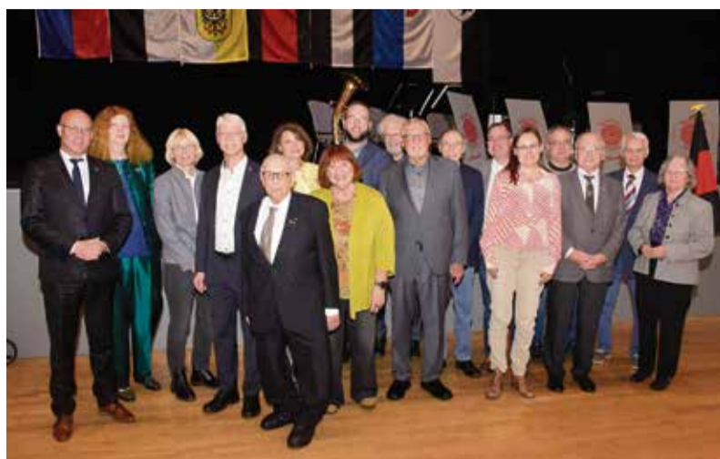
Drei Gedenktage: Referenten und Ehrengäste aus Politik und BdV beim Tag der Heimat in Wetzlar