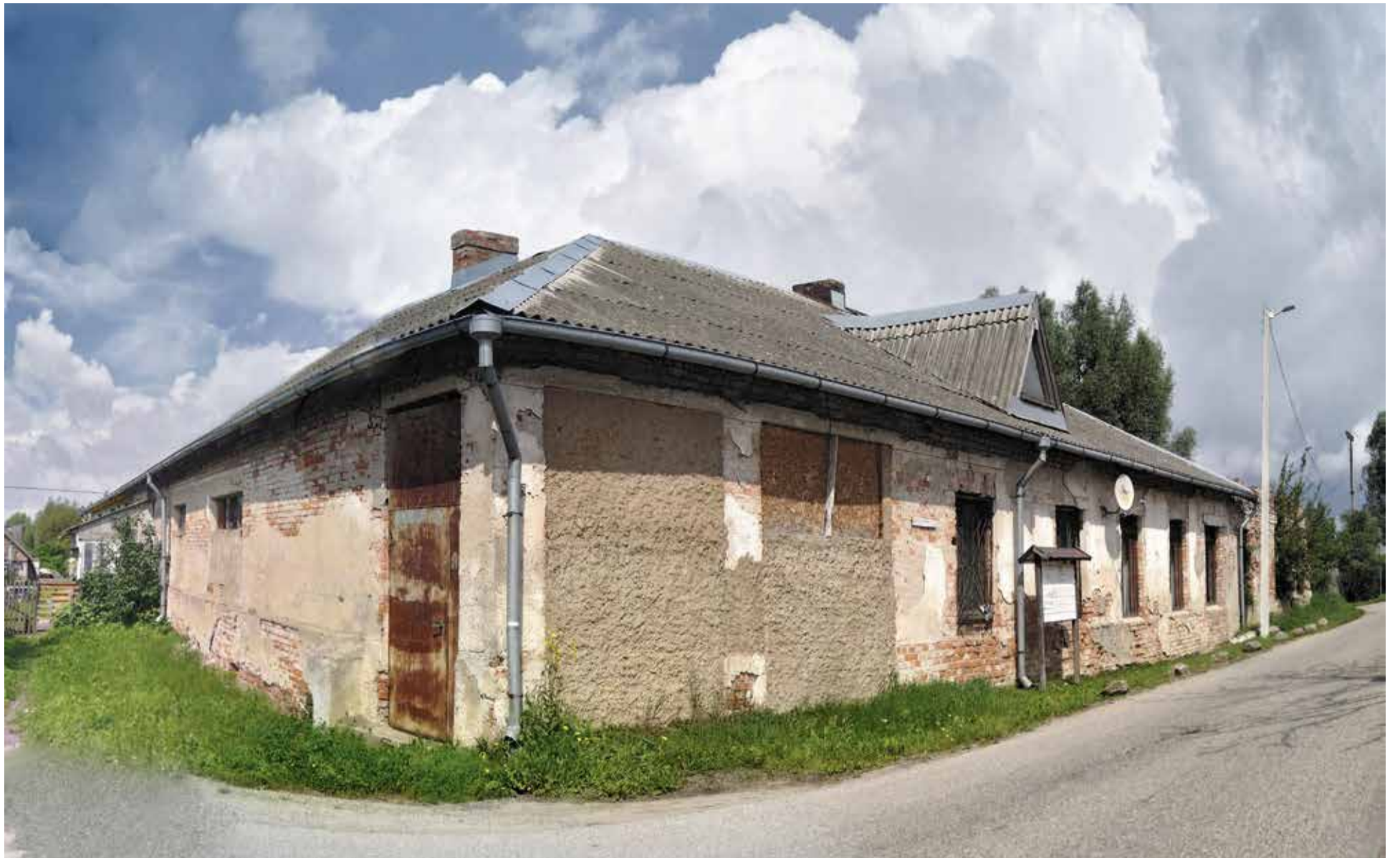
Verfallener Zeuge eines einstigen architektonischen Schmuckstücks von Stararchitekt Bruno Möhring: Das Gasthaus in Juwendt

Wie die vielen anderen „Ehemaligen“ kam Möhring 1915 in die gerade befriedete