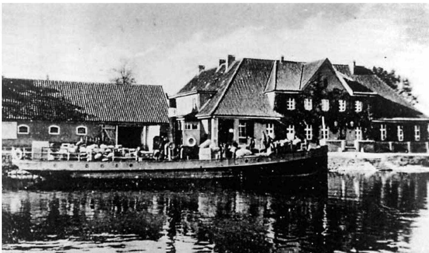
Das von der Familie Lappöhn erfolgreich betriebene Gasthaus war ein quirliges Zentrum des ostpreußischen Städtchens und konnte schon um die Jahrhundertwende mit allerlei modernen Finessen aufwarten

Und an den Gedenktafeln für Königsberg arbeiten wir selbstverständlich weiter – versprochen.