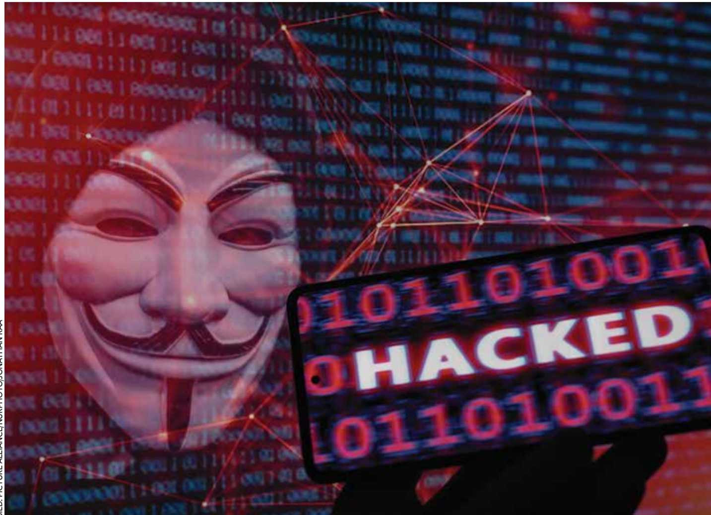
Schnüffeln und Mithören: Die EU will aus Sicherheitsgründen private Kommunikation kontrollieren, bevor sie verschlüsselt wird

Mit ihrer Ablehnung der Chatkontrolle stehen die IT-Firmen nicht allein. IT-Sicherheitsexperten, Juristen, Datenschüt-