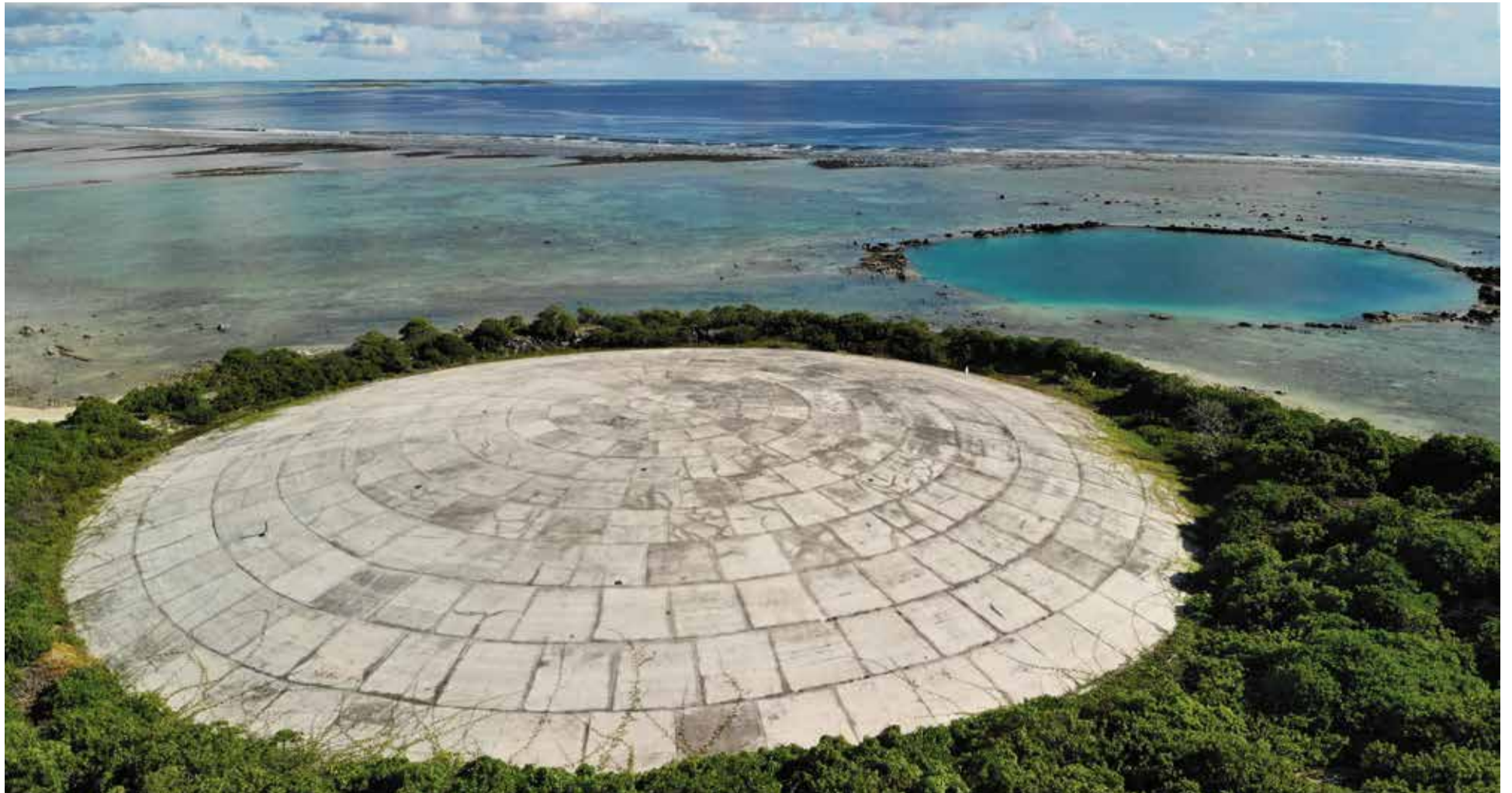
Tödliche Hinterlassenschaft der USA auf den Marshallinseln: Ein Betondeckel soll die Umwelt vor dem Atom Müll schützen

Immer noch sehr stark kontaminiert ist auch das Testgelände von Semipalatinsk, wo Kernwaffen mit einer Sprengkraft von insgesamt 2500 Hiroshima-Bomben getestet worden waren. Die