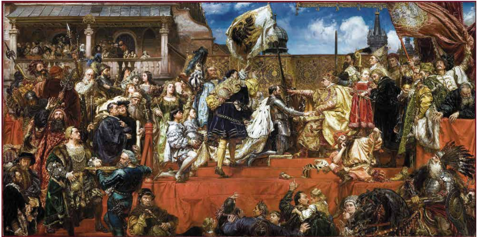
„Preußische Huldigung“: Historienmalerei von Jan Matejko aus dem Jahre 1882

Die Deutung der Ereignisse blieb jedoch umstritten. In Polen gilt die „Preußische Huldigung“ bis heute als Triumph, im monumentalen Historiengemälde Jan Matejkos aus dem Jahre 1882 inszeniert. Gleichwohl existierten aber auch in Polen Stimmen, die den Vertrag negativ deuteten, da durch diesen – nicht ganz unberechtigt – indirekt der spätere Aufstieg Preußens zur europäischen Großmacht ermöglicht worden sei. Im preußisch-deutschen Raum hingegen wurde die Episode lange ausgeblendet. Erst mit der Romantik erweckte das Interesse am Deutschen Orden neu, als Künstler und Intellektuelle die Marienburg wiederentdeck-