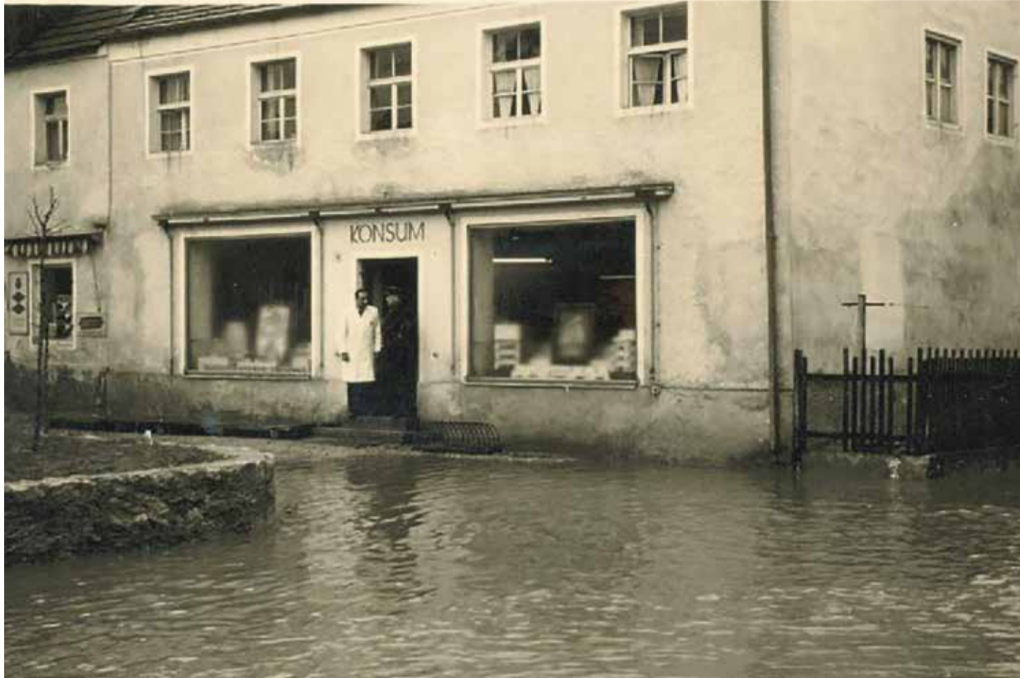
Land unter am Konsum: Der Lebensmittelladen in Beratzhausen in den 50er Jahren während eines Hochwassers