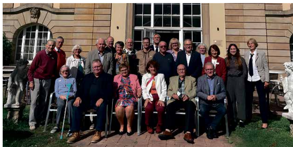
Wie immer war das Treffen eine bunte Mischung aus Vereinsarbeit, Geselligkeit und ernstem wie feierlichem Gedenken: Heimatkreistreffen der Kreisgemeinschaft Mohrungen in Bad Nenndorf

Osterode am Harz – Die Geschäftsstelle der Kreisgemeinschaft Osterode Ostpreußen e.V. ist bis auf Weiteres nur per E-Mail: kgoev@web.de zu erreichen.