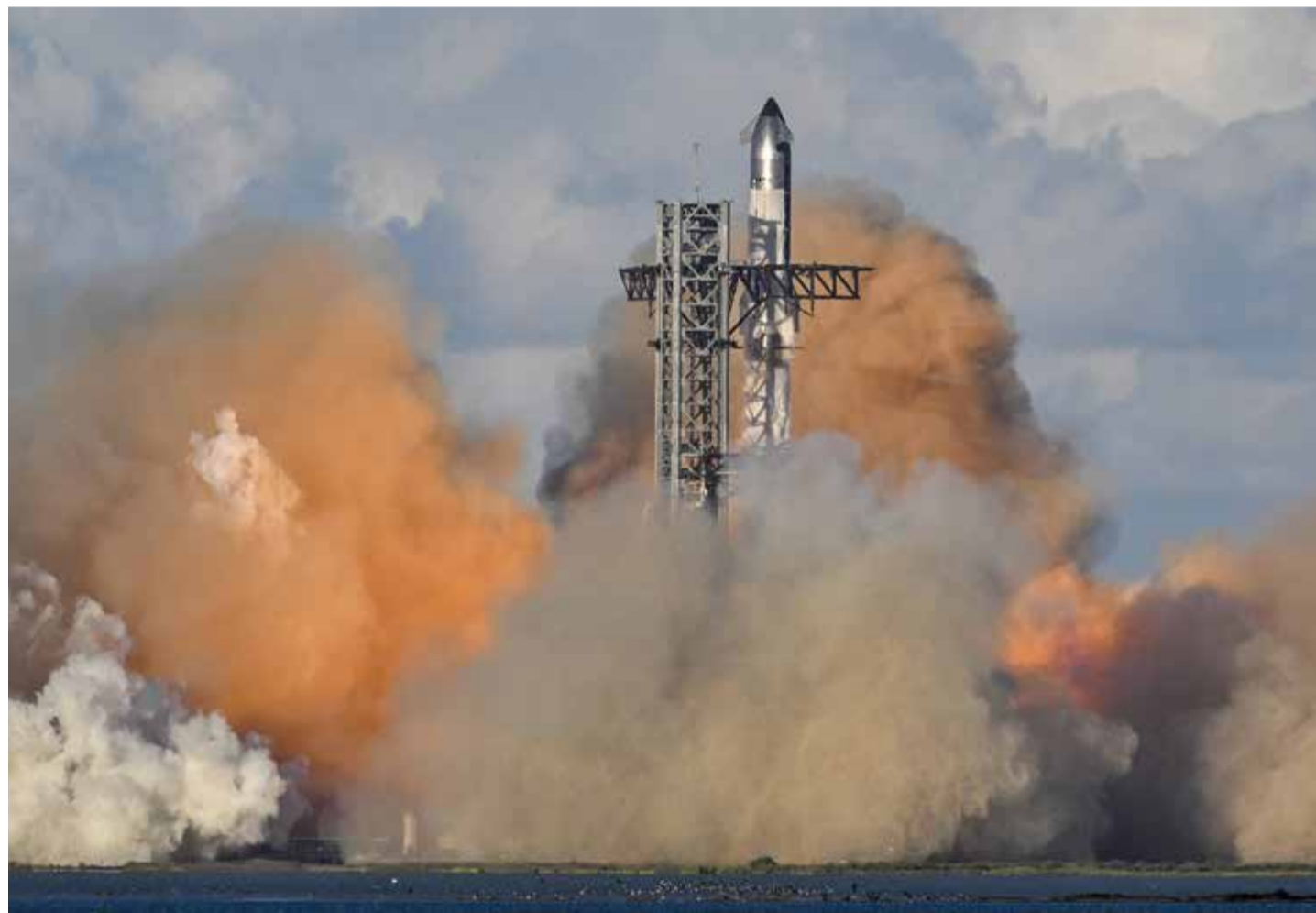
Teststart einer Starship-Rakete des vom Milliardär Elon Musk gegründeten Unternehmens SpaceX in Texas: Nach zahlreichen fehlergeschlagenen Testflügen hinkt das mit zehn Milliarden Dollar veranschlagte Projekt im Zeitplan weit hinterher

Vor diesem Hintergrund wird verständlich, warum Musk auf die Kündigung des Artemis-III-Vertrages eher herablassend als betroffen reagierte. Zunächst bescheinigte der Multimilliardär dem NASA-Chef Duffy, den er dabei provokant „Dummy“ nannte, massive fachliche Inkompetenz. Danach gab er über das Soziale Netzwerk X folgende Prognose ab: „SpaceX ist im Vergleich zum Rest der Raumfahrtindustrie blitzschnell unterwegs. Letztendlich wird das Starship die gesamte Mondmission alleine durchführen. Merkt euch meine Worte!“