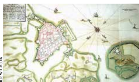
Plan von 1678: Befestigung Stralsunds

sekultur und dem Bauforscher Dirk Schumann organisiert. Verschiedene Referenten, unter anderem auch aus Visby/Got-