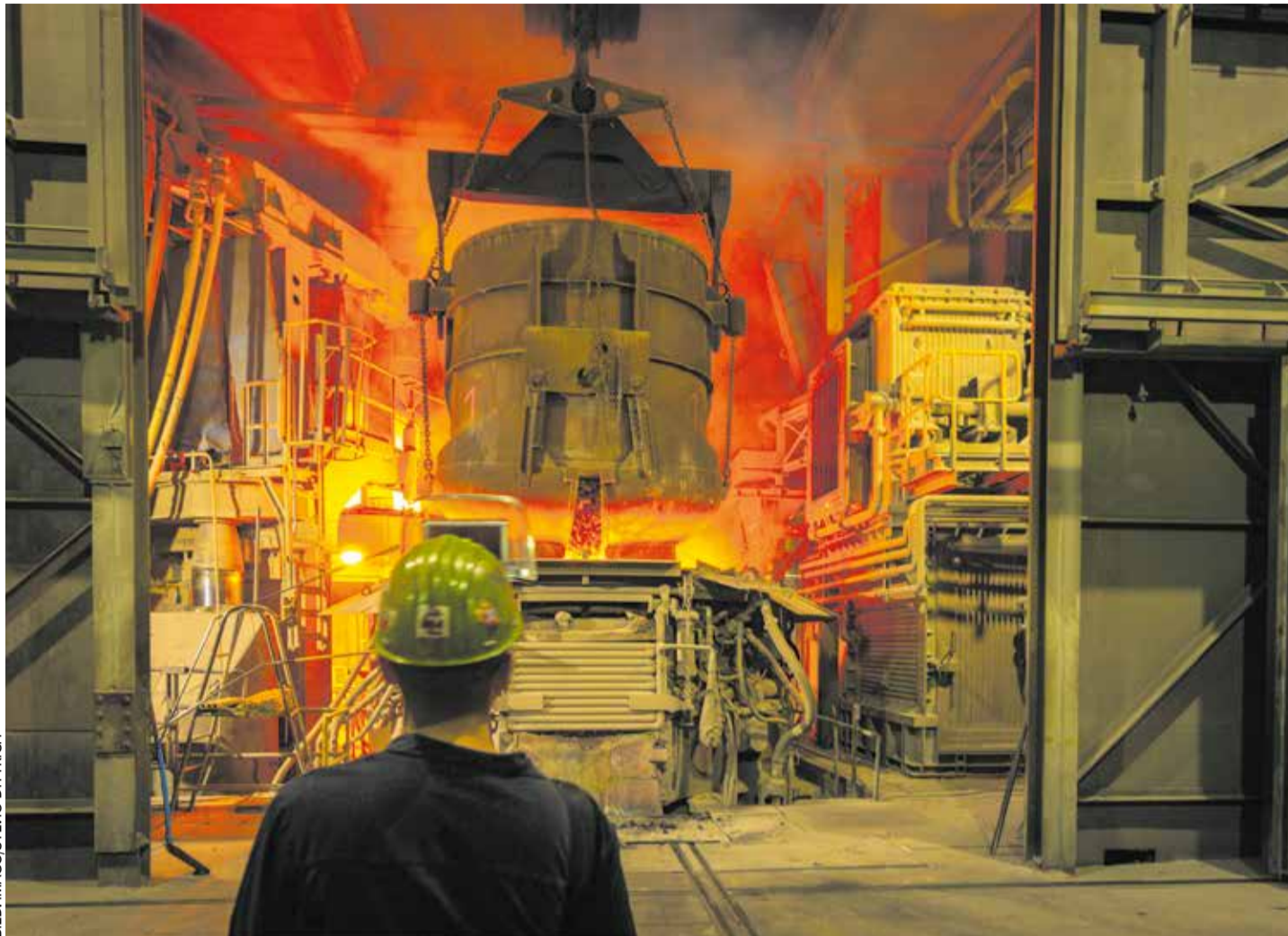
Ist der Ofen bald aus? An der Stahlindustrie als Schlüsselindustrie Deutschlands hängen über 5,5 Millionen Arbeitsplätze

Noch weitere Hilfsmaßnahmen wurden beim Stahlgipfel auf den Weg gebracht. So soll ab Januar 2026 ein subventionierter Industriestromtarif gelten, sobald die EU-Kommission grünes Licht