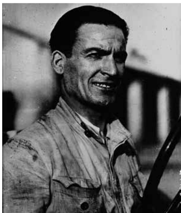
Ernesto Maserati im Jahre 1930

Doch der Weg dorthin war nicht frei von schicksalhaften Rückschlägen. Wirtschaftliche Schwierigkeiten und der politische Druck des faschistischen Italiens zwangen die Brüder 1937, ihr Unternehmen an die Familie Orsi zu verkaufen.