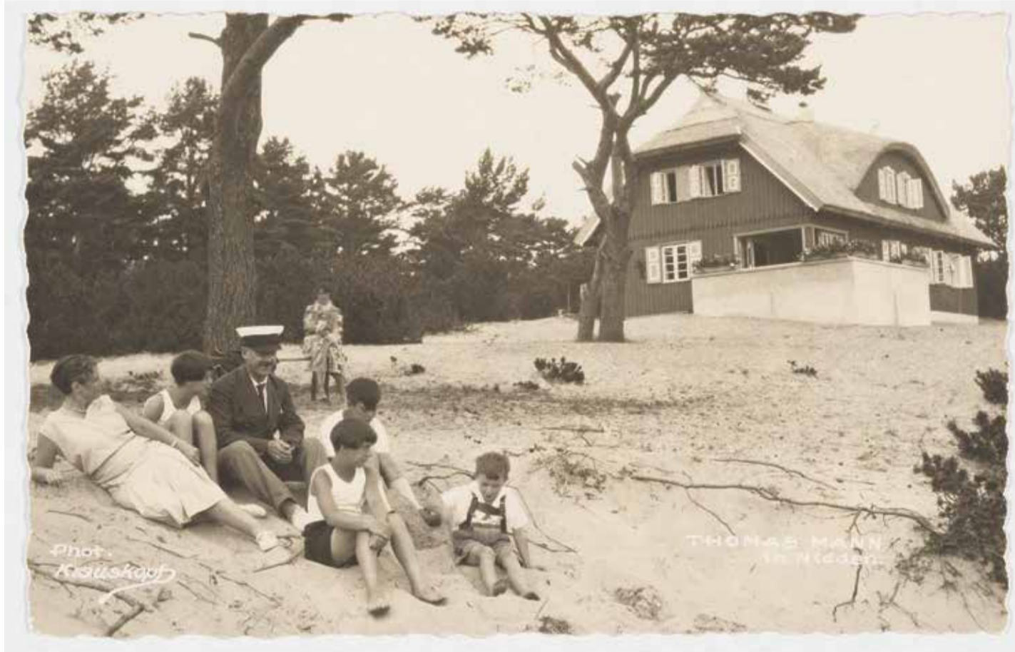
Thomas Mann in Nidden

Der Blick auf Purwin, das Gasthaus Hermann Blode, der Hafen von Nidden, die Ausfahrt der Kurenkähne, der Dampfer „Memel“ im Hafen von Nidden oder die Ankunft des Doppelschrauben-Motorschiffes „Kurisches Haff“ – das sind Foto-