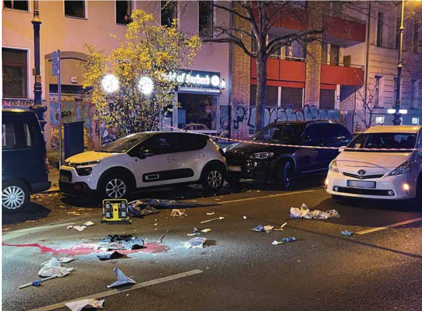
„Es geht um viel, viel Geld“: Berliner Straße nach einem Schusswechsel

Berlin ist von den Chicagoer Zahlen noch ein Stück weit entfernt. Aus Sicht des Bundeskriminalamts ist die Spree-