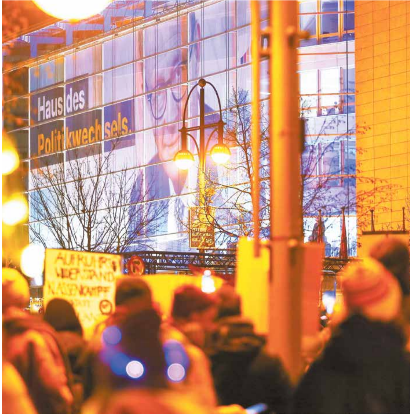
Bislang kaum zu erkennen: Der von der Union nach dem Ampel-Aus versprochene Politikwechsel

Anscheinend hat die Union noch nicht einmal mit informellen Vorarbeiten zu jenem künftigen Zusammenwirken mit der AfD begonnen, das allein es ihr ermöglichen wird, sich von linker Hegemonie zu befreien und einen solchen Kurs des Staatsschiffs anzulegen, der nicht noch mehr ihrer früheren Anhängerschaft vertreibt. Bis auf Weiteres hat sie jedoch Rücksicht auf den fragilen Zustand ihres Koalitionspartners und auf die „Sensibilität“ – besser: Nervosität und parteipolitische Hilflosigkeit – von dessen Vorsitzenden zu nehmen. Lässt Kanzler Merz es daran fehlen, dann droht der Koalitionsbruch samt neuerlichen Bundestagswahlen. Bei diesen werden der Union aber nicht mehr wirklich viele eine „letzte Chance“ auf einen selbstbestimmten, nicht von der AfD auferlegten Politikwechsel geben. Dann ins