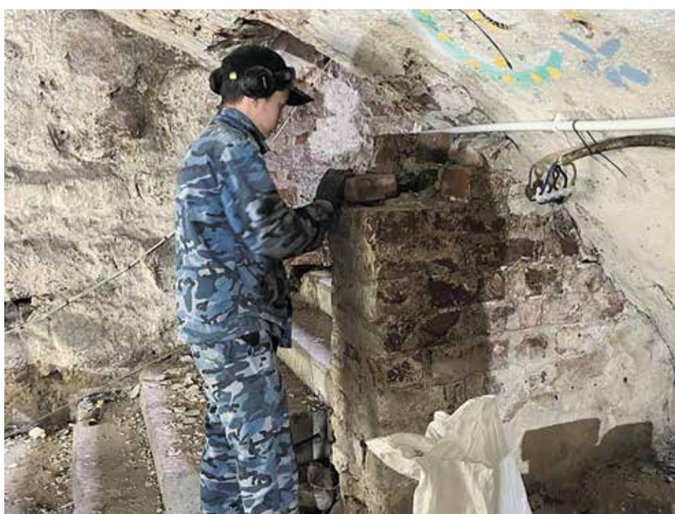
Vorbereitung für die künftige Keramikwerkstatt: Arbeiten im Keller der Burg

Zurzeit werden auch Renovierungsarbeiten im Kellergewölbe des Hauptgebäudes der Ordensburg abgeschlossen. Es ist