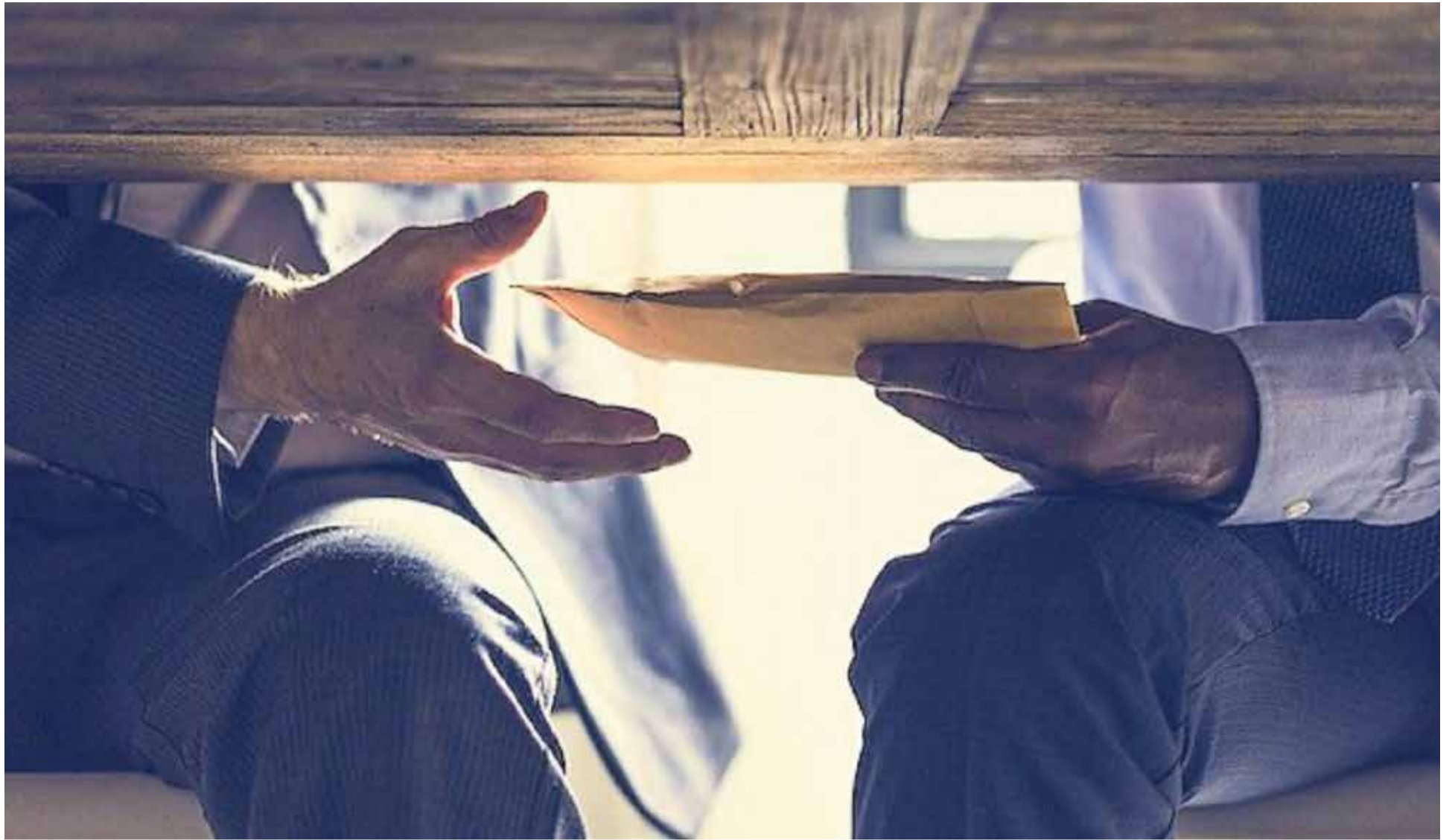
Laut Forschern liegt sie tief in der Natur des Menschen begründet: Korruption begleitet uns seit Jahrtausenden

Ernsthaft in Verruf geriet die Korruption erst mit dem Übergang zur Moderne, wobei zentralisierte Monarchien wie das Königreich Preußen Vorreiter bei ihrer Ächtung waren. Die Korruption galt hier als Merkmal der zu überwindenden Vormoderne und sollte durch eine konsequente Verrechtlichung des gesellschaftlichen und politischen Lebens verschwinden. Daher liefen die berühmten preußischen Reformen zum Anfang des 19. Jahrhunderts auch auf eine Kriegserklärung an die Korruption hinaus. Ebenso stellten die Revolutionen ab 1789 un-