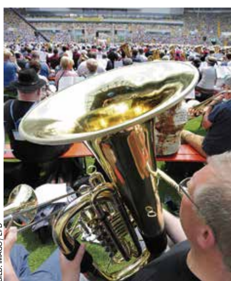
Sorgt im Stadion für Stimmung: Posaune

Die EkiR erstreckt sich über die rheinischen Landesteile von Nordrhein-Westfalen und Rheinland-Pfalz sowie das Saarland, Exklaven im Bundesland Hessen kommen hinzu. Regionale Schwerpunkte sind Schmidt nicht bekannt. Die Aus- und