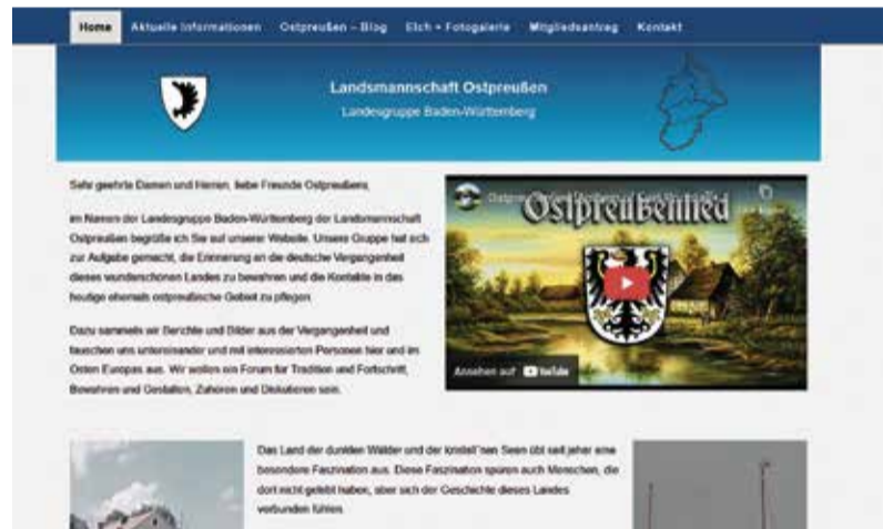
Internetauftritt der Landesgruppe Baden-Württemberg: www.ostpreussen-bw.de Bild: Screenshot