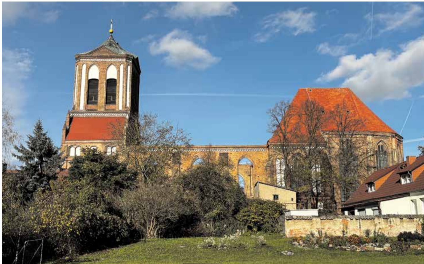
Die evangelische Sankt Stephanskirche: Erbaut in der Zweiten Hälfte des 14. Jahrhunderts, im Zweiten Weltkrieg zerstört, wartet sie nun auf vollständige Wiederherstellung

Markant und ungewöhnlich für die gotische Architektur ist beispielsweise das Stettiner Tor. Getragen von einem mächtigen Unterbau wird es von einer Blendfassade mit vielen Mauerbögen bekrönt. Umschreitet man von hier, wo sich das Ackerbürgermuseum befindet, Gartz in