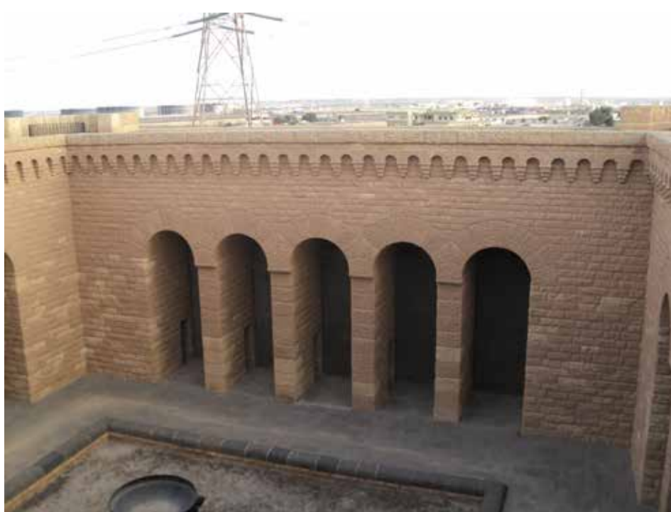
Mit der Opferschale im Zentrum der Anlage: Innenansicht der Totenburg