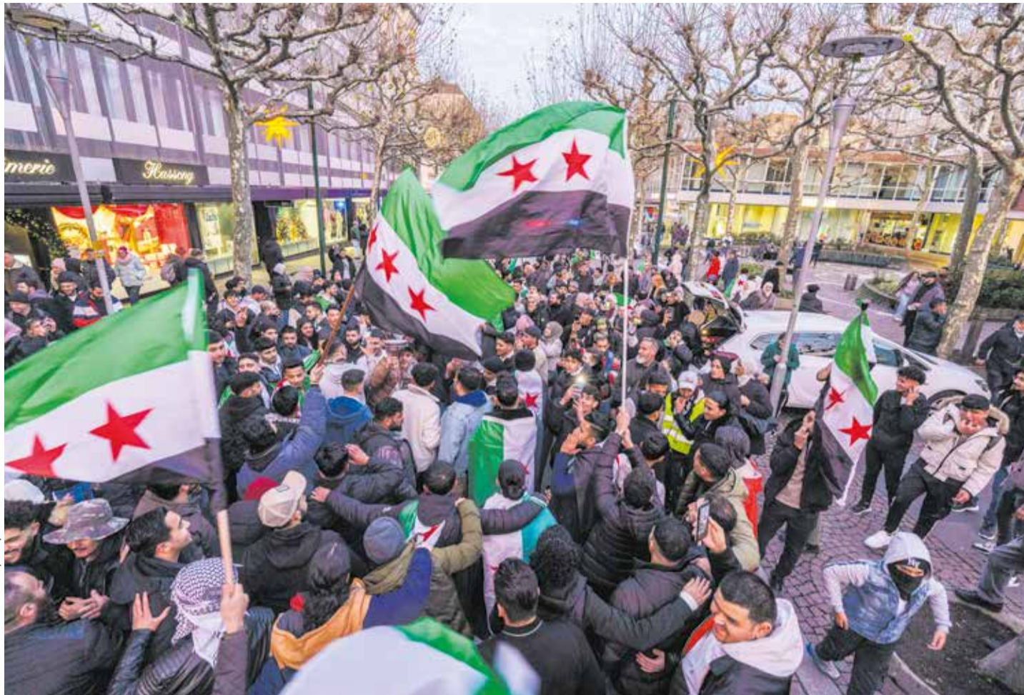
Statt auf deutschen Straßen zu demonstrieren, sollten vor allem die jungen Männer lieber wieder in ihre Heimat Syrien zurückkehren, um ihr zerstörtes Land wieder aufzubauen. So wie einst die Deutschen es nach 1945 taten