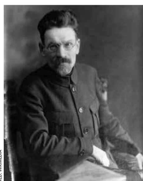
Michail Kalinin im Jahr 1920