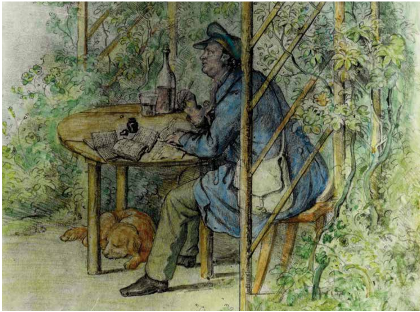
Unermüdlicher Wortfinder: Jean Paul in seiner Gartenlaube in Bayreuth, Zeichnung von Ernst Förster

Aber schon da beginnt ein Missverständnis. Jean Pauls Werk ist so absonderlich, dass die Hüter der Literatur nicht wissen, in welches Regal sie es schieben sollen. Weil der Einzelgänger Jean Paul ebenso wie seine Zeitgenossen Kleist und