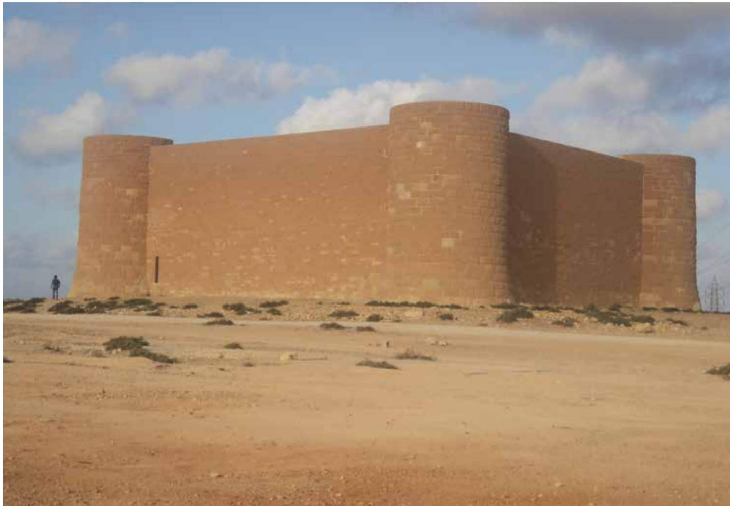
Der Mann links bietet einen Größenvergleich: Die Kriegsgräberstätte von außen

Vor 70 Jahren wurde in Anwesenheit von Angehörigen der Toten sowie Kriegsveteranen die Deutsche Kriegsgräberstätte Tobruk eingeweiht