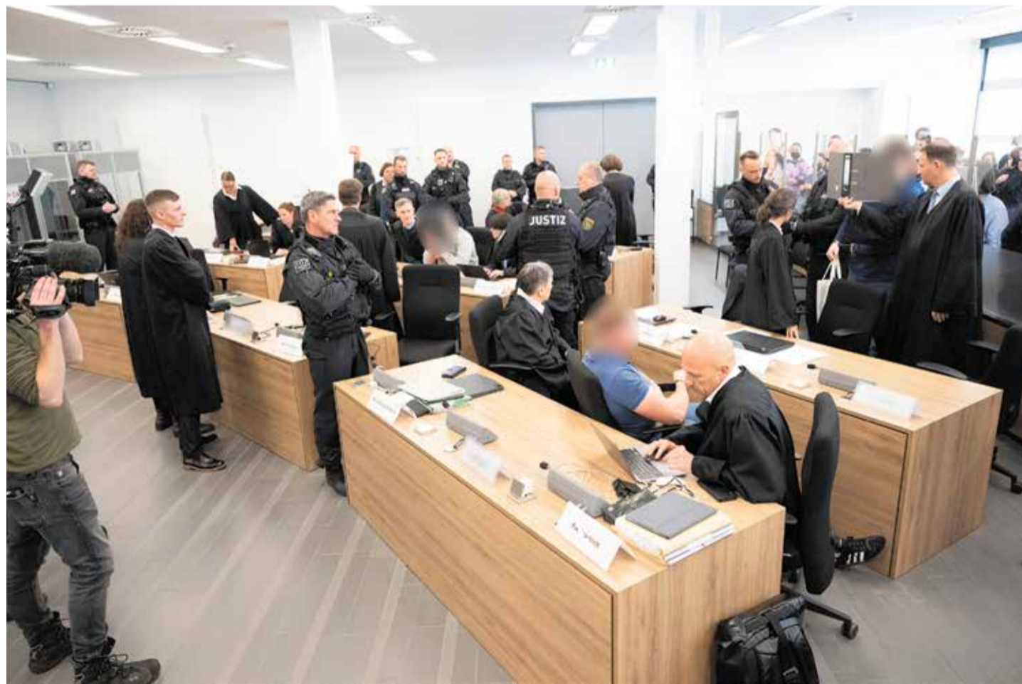
Viel Betrieb: Der Auftakt des Gerichtsprozesses in Dresden gegen sieben linksextremistische Angeklagte der „Hammerbande“ erregte im November viel mediales Interesse. Der Prozess dürfte sich bis Frühjahr 2027 hinziehen

Im nach dem Fall Lina Engel zweiten „Hammerbanden-Prozess“ von Dresden sind noch mindestens 69 weitere Verhandlungstage geplant. Damit dürfte sich das Verfahren bis in das Frühjahr 2027 hinziehen.