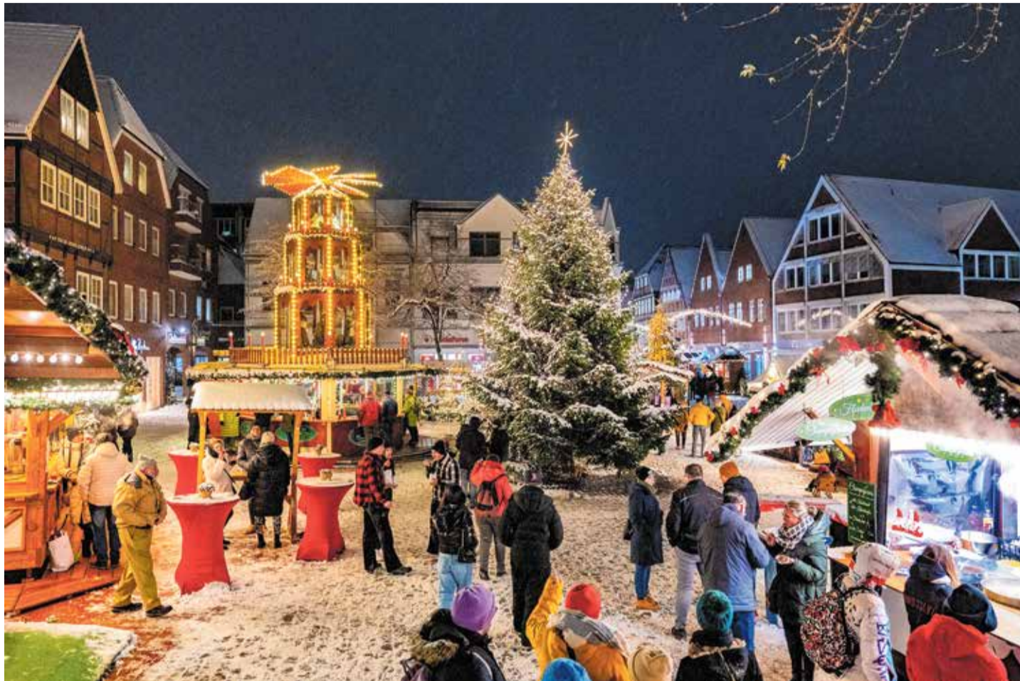
Heimeliger norddeutscher Advent: Der Weihnachtsmarkt am Pferdemarkt von Stade

Stade inszeniert die Adventszeit aber nicht nur als Kulisse, sondern als Erlebnis