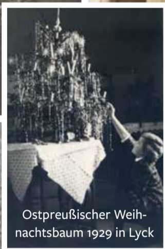
Ostpreußischer Weihnachtsbaum 1929 in Lyck