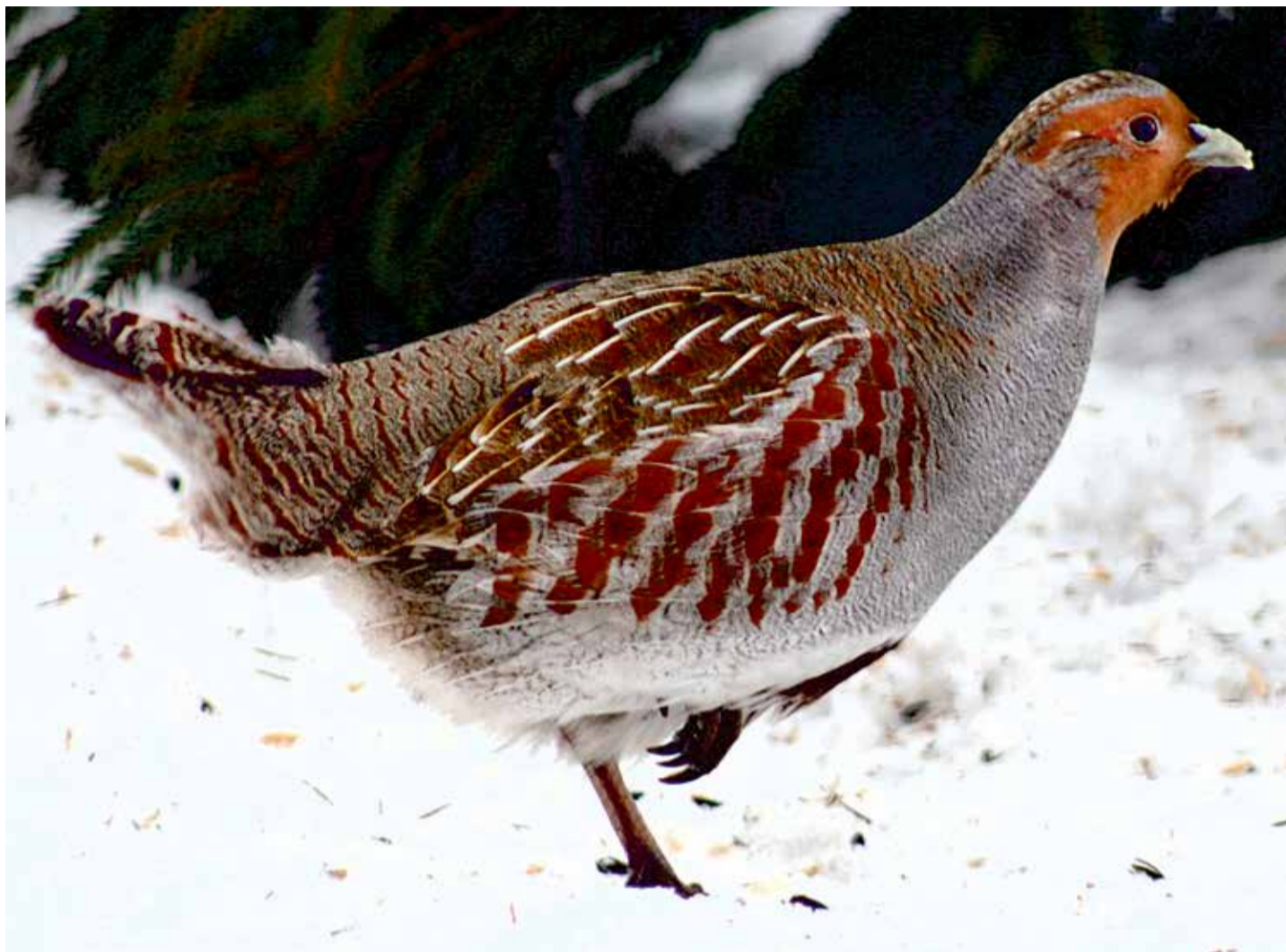
Das Rebhuhn: Alarmierend, die Bestände sind in Europa seit 1980 um 94 Prozent zurückgegangen

Die Menschen hatten manche Mühe aufzubieten, ihre Wohnungen warm zu halten, als zum Erstaunen der Städter aus dem Umland Scharen von Rebhühnern