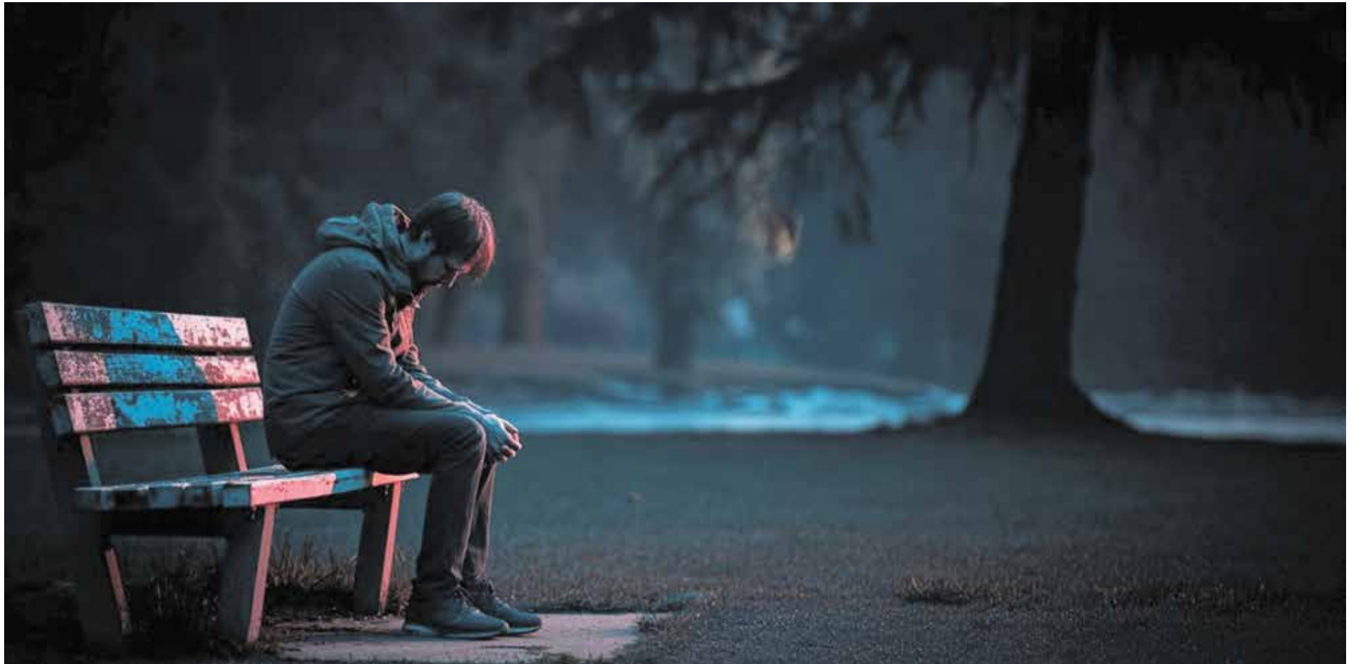
„Hoffnungslos verloren“: Niedergeschlagenheit wird zur seelischen Epidemie

Die Krisen und dadurch verursachten Ängste oder Stressreaktionen, aber auch