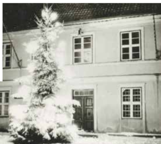
Das Rathaus von Darkehmen, 1935 zur Weihnachtszeit

guren, rotbackigen Äpfeln, Nüssen und Kerzen geschmückt. Und unterschied sich damit deutlich von Regionen wie Bayern oder Westfalen. Die bewusst betonte Einfachheit in Ostpreußen war gewollt und Ausdruck der innigen Beziehung zur Natur. Heute entspricht dies dem Nachhaltigkeitsgedanken, der für viele Menschen Bedeutung hat.