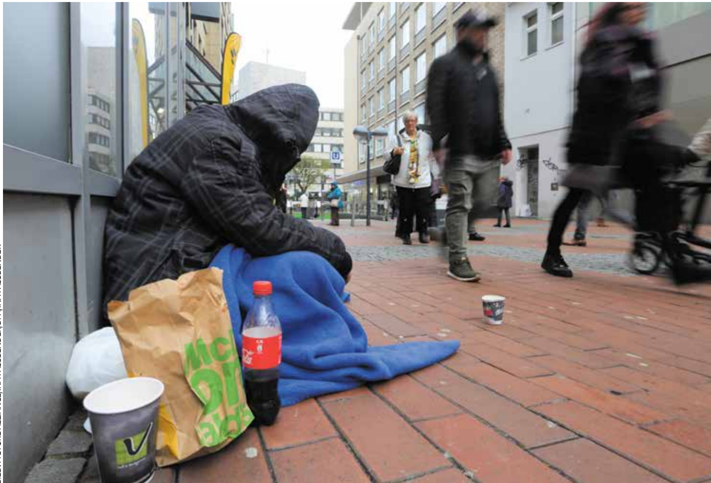
Folgen des Strukturwandels: Die Innenstädte wie die von Essen verwaizen, Geschäfte schließen und die Anzahl der Bettler steigt

Aber es geht auch andersherum. Bremerhaven im hohen Norden ist ein Bei-