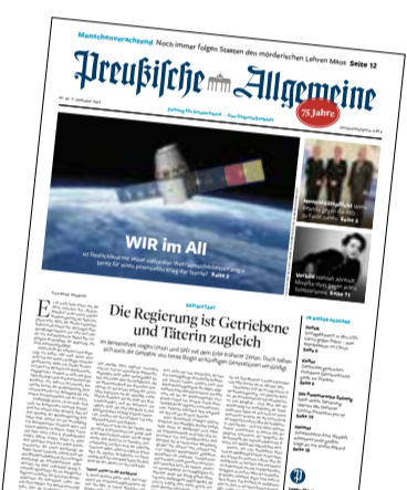
Ausgabe Nr. 49

Christian Benthe, Dresden zum Thema: Das dichtende Zentralgestirn (Nr. 48)