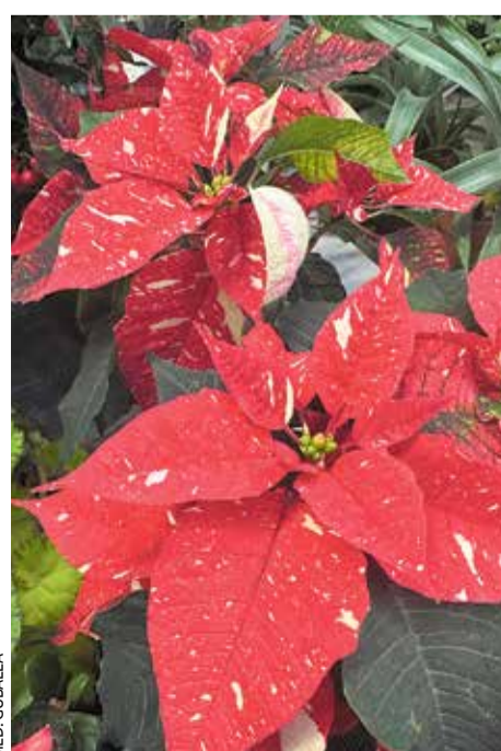
Auch mit weiß melierten Blättern passt der Weihnachtsstern gut zum Fest

Was viele nicht ahnen: Der Weg des Weihnachtssterns in den Handel ist eine logistische Meisterleistung. Die Verkaufssaison in Deutschland dauert nur etwa acht Wochen, von Anfang November bis