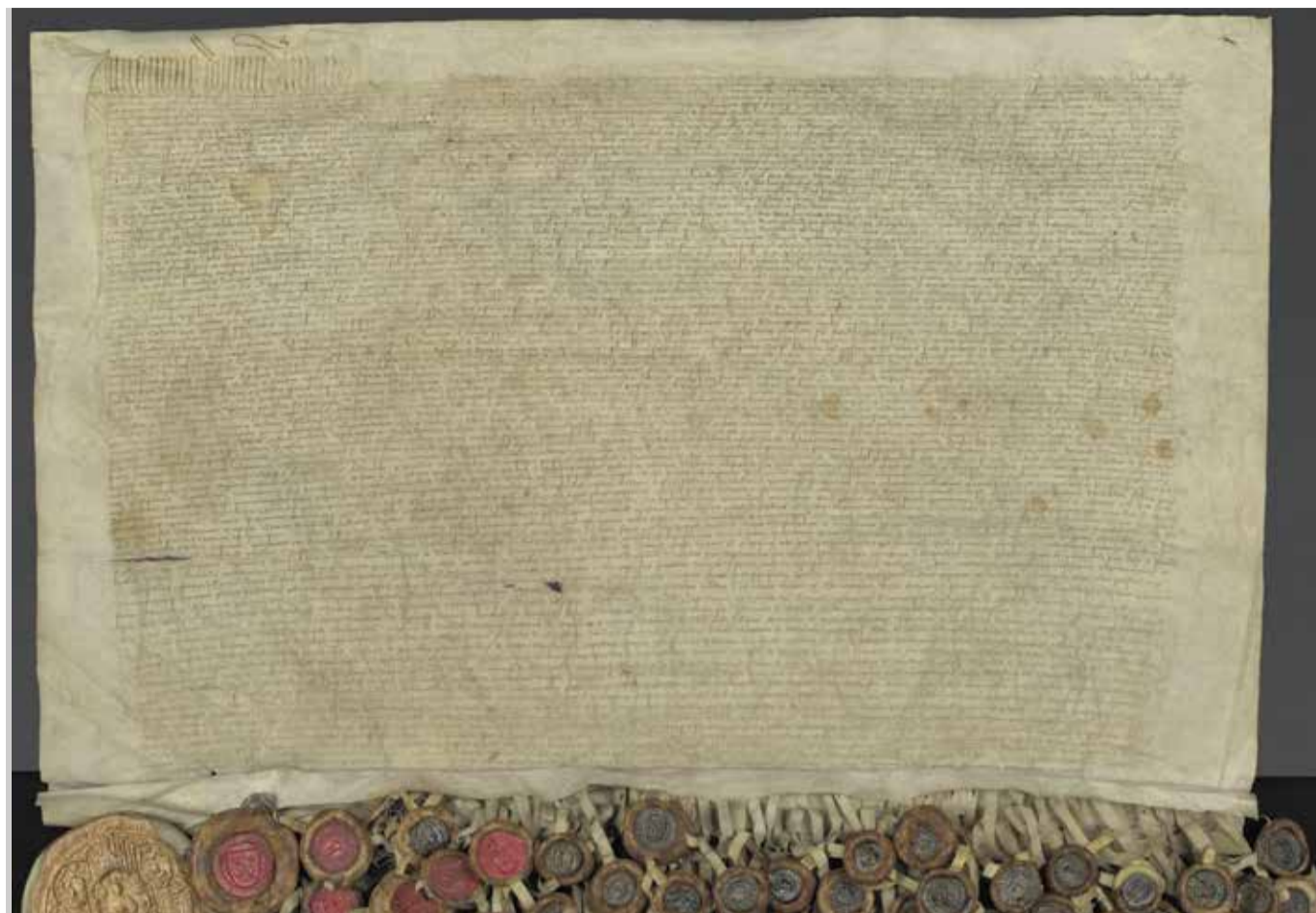
Nun restituiert: Vertrag über den Frieden vom Melnosee von 1422 zwischen dem polnischen König Wladyslaw II. Jagiello von Polen, Großfürst Sigismund von Litauen sowie den Herzögen Janusz und Siemowit von Masowien mit dem Deutschen Orden

Landsmannschaft Ostpreußen: www.ostpreussen.de Bundesgeschäftsstelle: info@ostpreussen.de