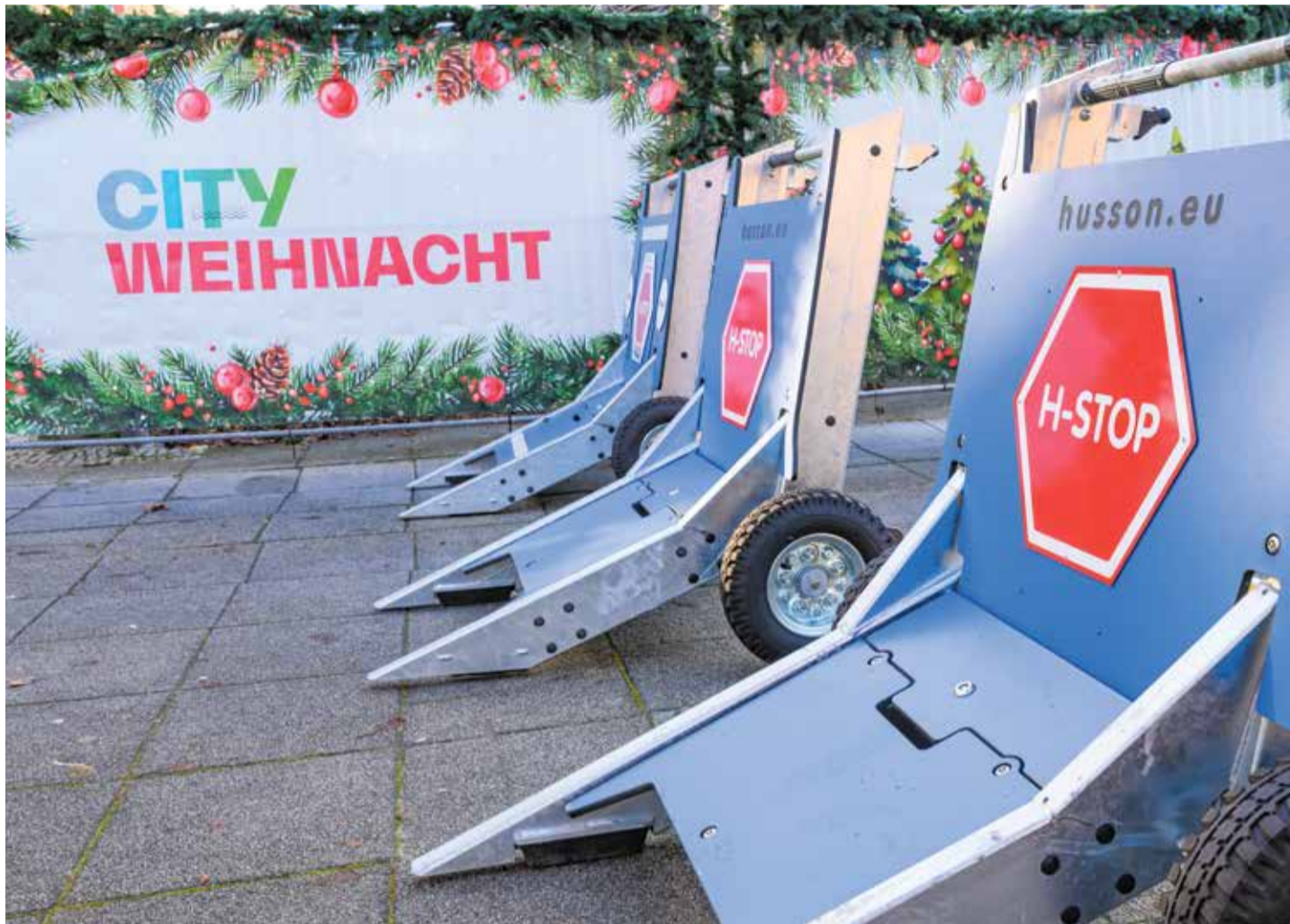
Immense Kosten: Schutzsperre an einem Weihnachtsmarkt in Frankfurt (Oder)

Damit nicht genug: „Gern vergessen wird, dass auch die Schausteller Geld verdienen müssen“, so ein Gewerbetreibender, der auf einem der zahlreichen Berliner Weihnachtsmärkte einen Stand unterhält. Einige Veranstalter und auch Standbetreiber