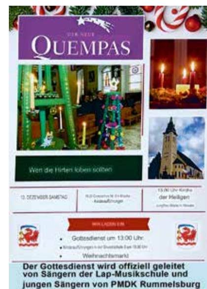
Plakat (übersetzt mit Google)

Rummelsburg – Der neue Quempas findet nach einer mehrjährigen Pause wieder in der Rummelsburger Kirche am 13. Dezember um 13 Uhr statt. Damit lebt die seit 1995 durchgeführte feierliche Zeremonie nach Corona und anderer Umstände wieder auf. BS