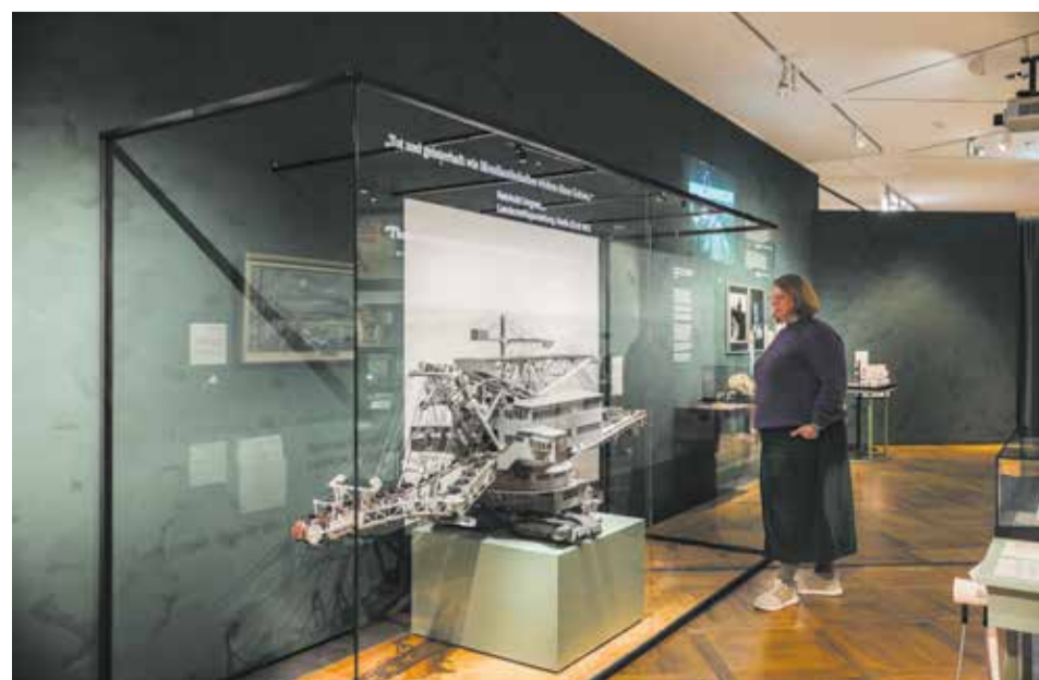
Spektakuläres Exponat: Modell eines Eimerketten-Raupen-Schwenkbagers