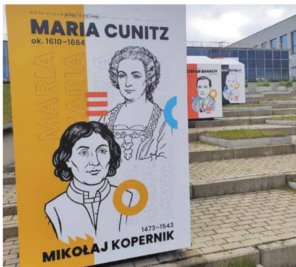
Auf dem Unigelände: Informationen über bedeutende Wissenschaftler

Die Ausstellung wurde mit großer Sorgfalt gestaltet, um das Erbe bedeutender polnischer Persönlichkeiten sichtbar zu machen. Die Porträtierten erscheinen in Form monumentaler Installationen, die zugleich künstlerische Objekte und Wissensräume bilden. Jedes Objekt vereint Text, Illustration und eine visuelle Interpretation der jeweiligen Person, wodurch die Gäste den Charakter und den Geist der dargestellten Menschen auf intuitive Weise erspüren können.