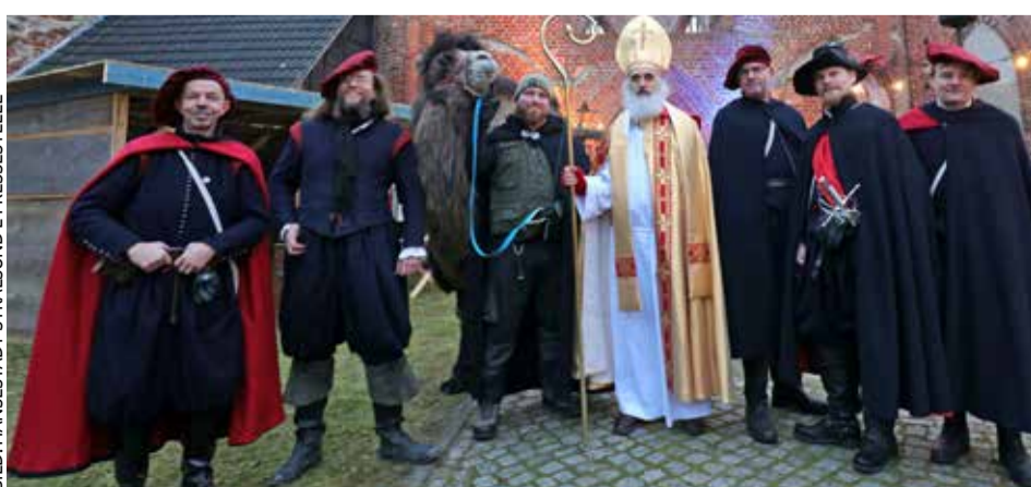
In der Hansestadt Stralsund: St. Nikolaus und sein Gefolge halten Einzug

In Stralsund hat der Heilige eine besondere Bedeutung, dort lebt eine Tradi-