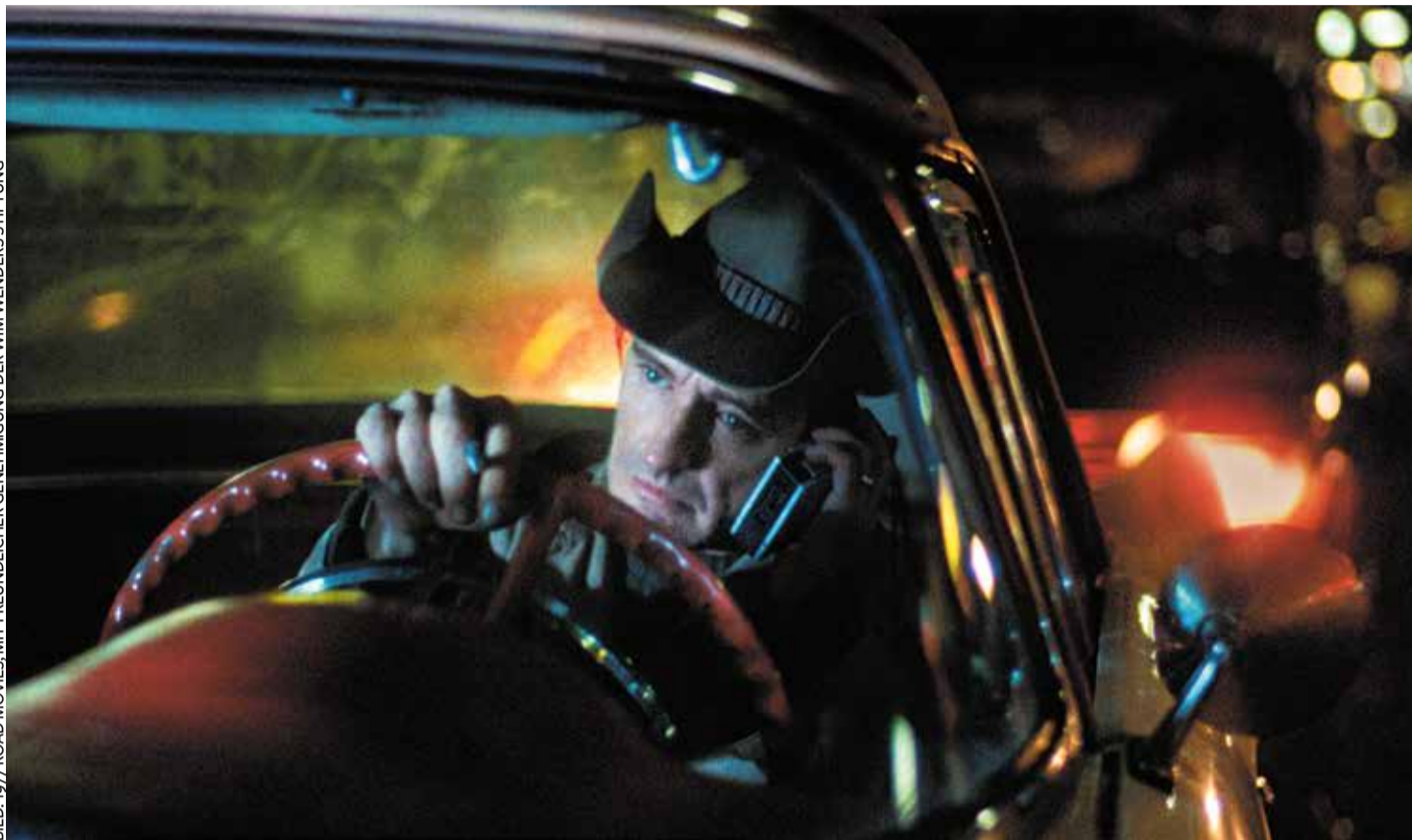
Ein Hollywoodstar in einem deutschen Arthouse-Film: Dennis Hopper in „Der amerikanische Freund“ von Wim Wenders

Vorneweg das „Flaggschiff“ der Wenders-Filme: „Der Himmel über Berlin“ aus dem Jahr 1987. Darin geht es um zwei unsichtbare Engel, Damiel und Cassiel, welche die Menschen in der damals noch geteilten Stadt beobachten. Damiel verliebt sich in eine irdische junge Frau und gibt schließlich seine Unsterblichkeit auf, um der Geliebten – als dann sterblicher und sichtbarer Mensch – nahe zu sein.