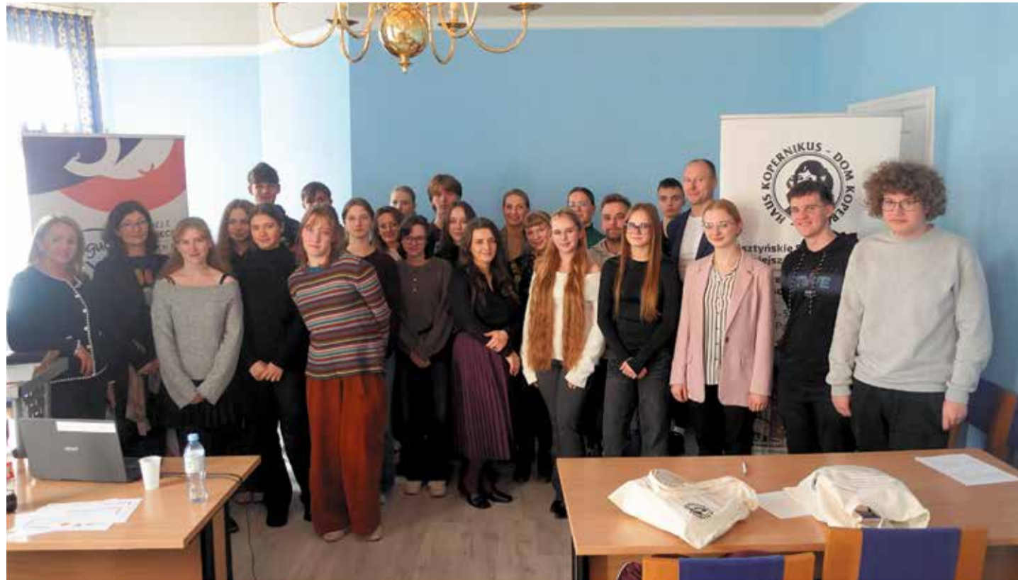
In den Räumen des Kopernikushauses: Gruppenfoto mit Teilnehmern, Lehrern und Organisatoren