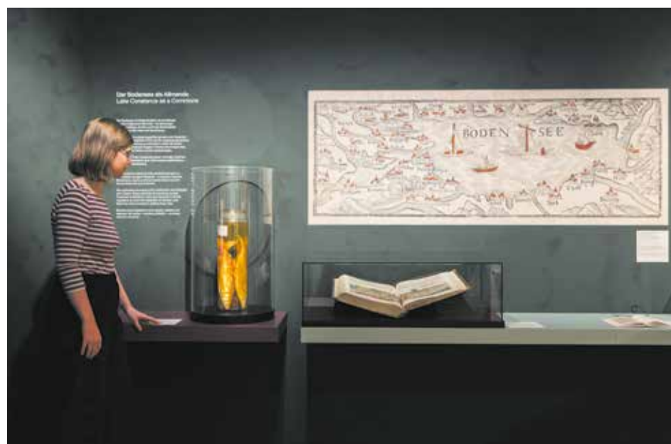
Ihm ist ein ganzer Unterabschnitt gewidmet: Der Bodensee als Allmende