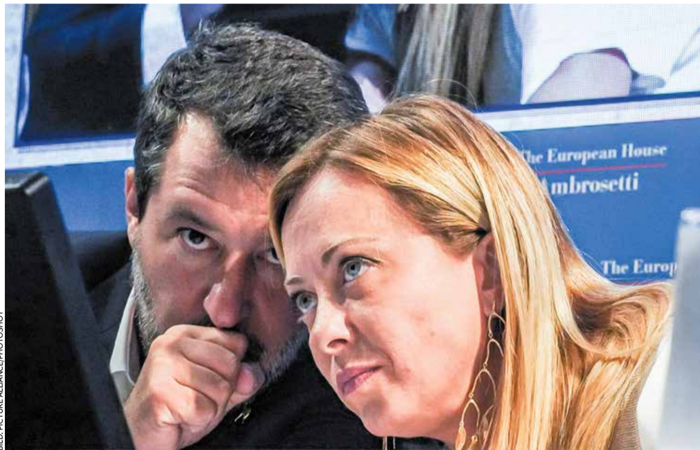
Ministerpräsidentin Meloni hat mit ihrem Koalitionspartner Salvini im Kampf gegen linke politische Gegner viel zu besprechen

Meloni aber zeigt sich unbeirrt: Sie spricht lieber von „Verantwortung“, „Realismus“ und „Kontinuität“. Ihr Erfolgsrezept sei nicht das große politische Spektakel, sondern die Konzentration auf das Notwendige – Haushalte, Infrastruktur, diplomatische Beziehungen. Und in der Tat: Der wirtschaftliche Grundkonsens gibt ihr aktuell bis auf Weiteres recht. Dennoch bleibt die Koalition eine fragile Konstruktion aus unterschiedlichen Interessenagenden. Salvini droht von rechts mit Richtungsstreit, Forderungen nach härteren Maßnahmen bei Migration und mehr Show – genau jene Elemente, mit denen Meloni nicht mehr in Verbindung gebracht werden will.