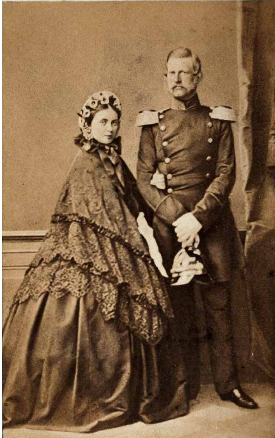
Als preußisches Kronprinzenpaar: Victoria und Friedrich Wilhelm

Den heutigen Leser werden natürlich in erster Linie die – im weitesten Sinne – politischen Angelegenheiten interessieren, die in der Korrespondenz eine Rolle spielen und deren Erörterung die Einstel-