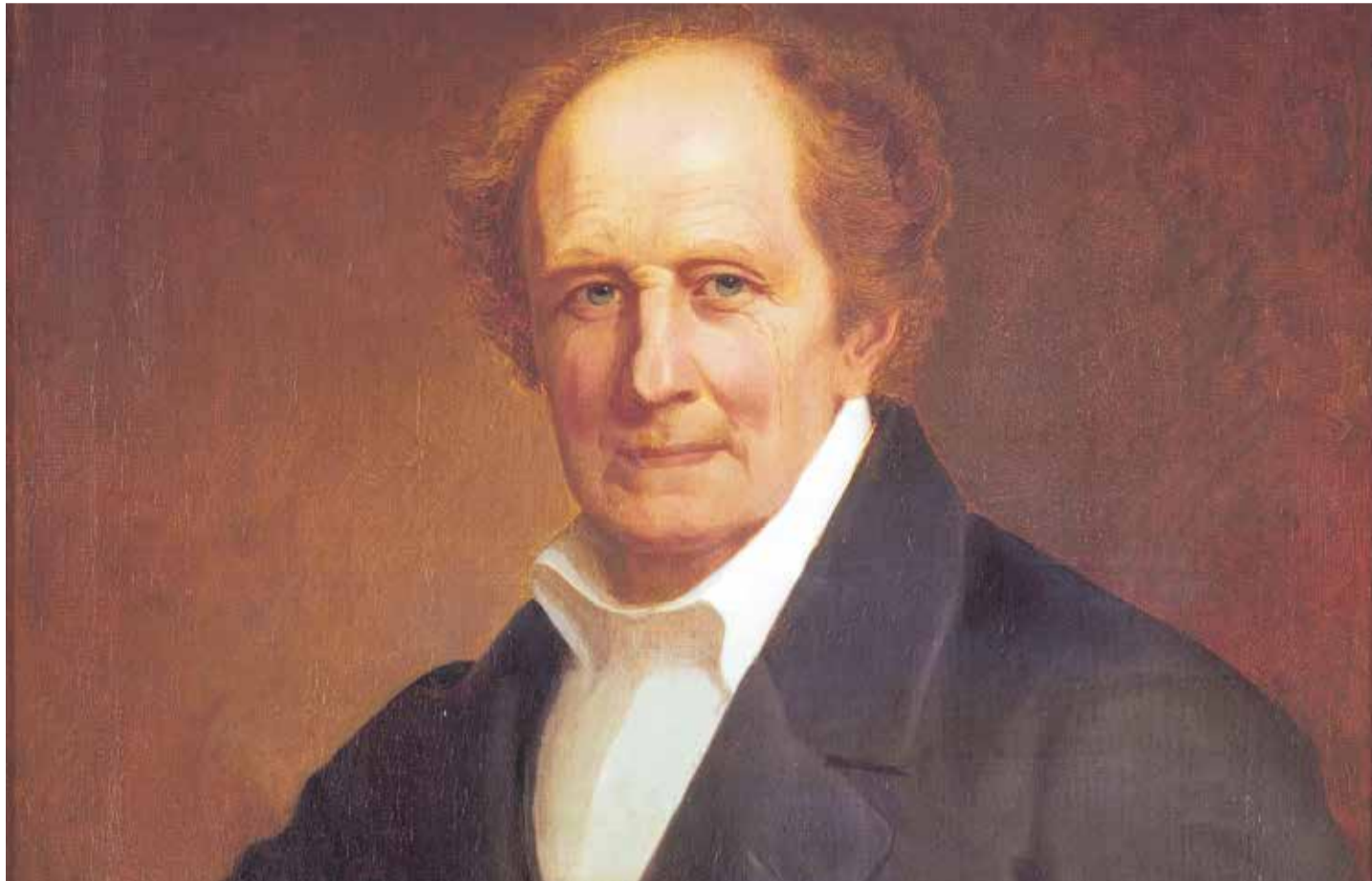
Machte sein anfängliches Hobby zum Beruf: Der leidenschaftliche Astronom Friedrich Wilhelm Argelander

Nach dem Studium und der Promotion beziehungsweise Habilitation an der Universität Königsberg verschlug es Argelander aber zunächst nach Finnland. Verantwortlich dafür war sein akademischer Lehrer, der berühmte Astronom Friedrich Wilhelm Bessel. Dieser empfahl das wissenschaftliche Nachwuchstalent für die freigewordene Stelle eines Observators an der Sternwarte in Turku. Dort beschäftigte sich Argelander hauptsächlich mit der Beobachtung von Kometen, bis Turku 1827 von einem Großbrand heimgesucht und schwer zerstört wurde. Notgedrungen musste der Ostpreuße nach Helsingfors – dem heutigen Helsinki – umziehen, wo er 1828 zum Professor für Astronomie berufen wurde. An der Sternwarte der Universität Helsingfors errechnete Argelander bis 1836 aus der Bewegung von 390 Sternen die Eigenbewegung unseres Sonnensystems. Sein Ergebnis: Es rast ganz offenkundig auf das Sternbild Herkules